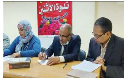
● عيد في قصر الأنفوشي

لمحتفي قصر ثقافة الأنفوشي في مدينة الإسكندرية المصرية بالأديب العراقي علي لفنة سعيد بمناسبة فور روايته «حبي عتيق» جائزة توفيق بكر للرواية العربية التي أقيمت في تونس وعلنت نتاجها قبل أكثر من شهر. على سعيد متصل نظم اتحاد الأدباء في الاسكندرية ندوة أخرى أدارها الأديب شرف الخضري، خصصت لرواية «علق عتيق»، وقدمت فيها أوراق نقدية ومداخلات، شارك فيها الحضور، في حين ضيفت صالون سائلتها ودار القواف سعيد للحدث عن روايته «مزامير المدينة» وبعدها من الروايات التي استحدث أن تترجم الى عدة لغات.