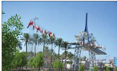
● معرض بغداد

وجرى لقاء مع عدد من المربين وتقديم التوجيهات والأرشادات اللازمة وسماح احتياجاتهم وأرأهم بحضور وسائل الإعلام والفضائيات للإطلاع على واقع التربية ميدانياً، إذ أن الإصابات مستمرة عليها بعد تطويق الحالات من قبل وزارة الزراعة والقيام بالاجراءات الضرورية وتغيير المنظمات الأخرى بالتنسيق مع الجهات المساندة.