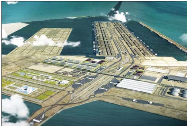
• صورة جوية لميناء الفاو

أكد وزير النقل ناصر حسين الشبلي الوصول إلى تفاهاتم خلال المناقشات مع الشركة الكورية بشأن ميناء الفاو الكبير، لحسم الأمور المالية والفنية للمشروع والبدء بإجراءات العمل. وقال الوزير الشبلي لـ «المصباح» إن «الوزارة جادة وماضية بإنجاز ميناء الفاو الكبير، ورئيس الوزراء، وبخه بإنجاز المشروع بالسرعة الممكنة بعد تجاوز العقبات التي تحول دون المنسي بإنجاز المشروع، وإضاف أن «الوزارة تواصلت مع تفاهاتم مع شركة (دايو) الكورية، والحوارات مستمرة لحسم الأمور المالية والفنية الخاصة بميناء الفاو، وإن التفاهاتم يتحصر فقط بشأن عدد الأمتار المتكعبة لمجرى الأسياب، والذي على ضوءه حدث الخلاف. بعد أن طالبته الشركة الكورية بزيادة الهبات التخصصية للميناء، مؤكداً استمرار التفاهاتم لحسم جميع المسائل المالية». وشبان الاتفاقات ومذكرات التفاهم التي وقعت مع المملكة العربية السعودية، بين الوزير الشبلي إن «وزارة النقل وقعت مذكرات تفاهم واتفاقات متعددة مع الجانب السعودي خلال أعمال اللجنة التنسيقية العراقية - السعودية أربطاً الاتساق على افتتاح منفذ جديدة عرعر الحدودية الذي سيتم تشييده وتشغيله بعد (7) أيام، فضلاً عن تسيير الخط الملاحي بين الموانئ العراقية والموانئ السعودية». وبما يخص مشروع قطار بغداد المعلق، أفاد الشبلي بأنه «ستتم المباشرة بتنفيذه بعد توقيع العقد»، مشيراً إلى أن «الوزارة وجهت دعوات مباشرة لحس شركات استشارية سيتم اختيار احداها لدراسة وتحليل العروض الفنية والمالية، ومن ثم التفاهاتم مع شركة (الستوم) الفرنسية لتحديد قيمة العقد والتوقيع عليه».