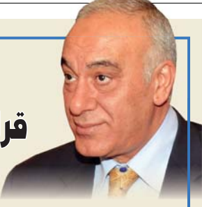
استطلاع: محمد عجيل