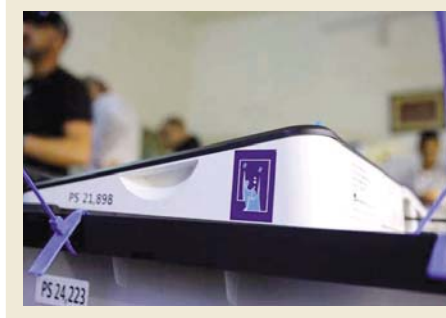
● بغداد: الصباح

تنتظر المفوضية العليا المستقلة للانتخابات قرار مشروع قانون اللوارة للشروع بإكمال الاجراءات، وتؤيد التخصيصات المالية، بينما تستمر عملية التسجيل اليوم، وافر بيان صادر عنها، بأنه «بعد التصديق على قانون نلخاب مجلس النواب العراقي، أصبح لزاما على المفوضية الشروع بجمعها لإجراء الانتخابات في موعدا على حدته الحكومة، وبناءً على ذلك فقد جرى وضع الأنظمة التي تنظم سير العملية الانتخابية والتي يستلزم القيام بها توفير التخصصات المالية اللازمة التي ما تزال المفوضية بانتظار إقرار اللوارة الانتخابية، وتوفير السيولة النقدية اللازمة لتنفيذها». واضاف أن «مجلس المفوضين يسعى إلى التقييم وإلحاح الضبط في العملية الانتخابية المقبلة، إذ جرى العمل في إعداد دراسة للتلغمة الشكراكي والظنون القابلة للقباس بوضوحه ومنطقية في العملية الانتخابية السابقة». وتكشف البيان عن تشكيل لجان مؤلفة من أعضاء مجلس المفوضين من فرق سنادة للتفاوض مع شركة (اندرا) الإسبانية المختصة بإعادة إلتاح وتحديث قاعدة البيانات وتطويرها بما يتواءم والبرامج الخاصة بآلة التسجيل والمعلوماتية، وتواصلت عملية توزيع البطاقة الانتخابية على الناخبين.