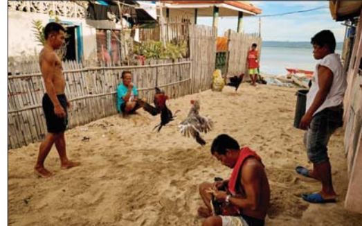
● إقليم سامار في الفلبين

قتل رجل شرطة في الفلبين هذا الاسبوع عقب اصابته بجرح نافذ سنده اليه ديك اثنا، مناهضة القوة وكرا غير مرمض به بقصد مكافحة انتشار وباء كورونا، كان يستخدم حيلة لصراع الديكة.