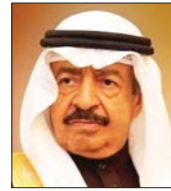
● التقيد خليفة بن سلمان آل خليفة

الله تعالى أن يشمل فقيدكم بواسع رحمته، وإن يلهم الأسرة الملكية الجليلة والشعب البحريني الشقيق جميل الصبر والسلوان. رزق بنبوه عزير رئيس الوزراء «عن صادق ترازوه» ومواساته للمحورين شعبا وحكومة. سالنا الباري عز وجل أن يتعدم الفقيد بواسع رحمته ومغفرته، ويسكنه فسيح جنات. وكان الديوان الملكي البحريني، قد أعلن وفاة رئيس الوزراء الأمير خليفة بن سلمان آل خليفة، في مستشفى مايو كلينك في الولايات المتحدة الأميركية.