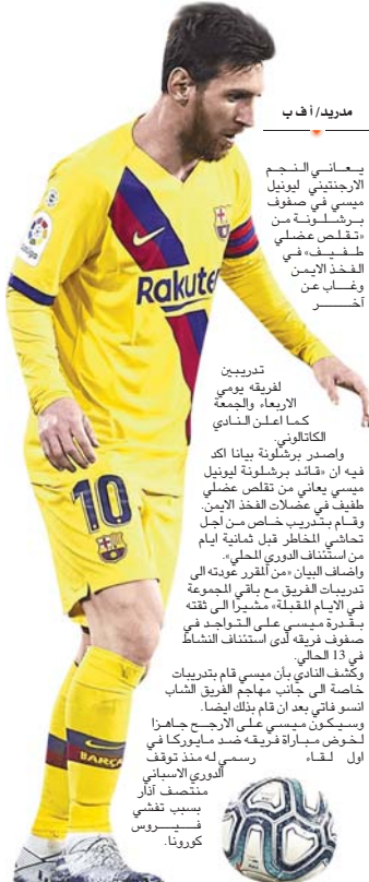
مدريد / ا ف ب

يعاني النجم الأرجنتيني ليونيل ميسي في صفوف برشلونة من «تقلص عضلي طفيف» في الفخذ الأيمن وغيب عن أخصر