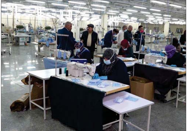
مناخلة العاملين على جودة نوعية الكمامة

مبادرة الشركة العامة للمواشي العراق باشرت بتوجيه مياض من وزير النقل تصنيع الكمامات الطبية في معمل خياطة الشركة تحت إشراف الصحة لسد النقص الحاصل في الأسواق المحلية والمادخر والصيدليات وتوزيعها بين المواطنين مجاناً. وأوضحت إدارة الشركة أن معمل المواشي سيوفر هذه الكمامات مجاناً لعامة الناس وبمواصفات عالية الجودة، إذ ستكون صناعتها بإشراف فريق صحي وبجهود كبيرة من أجل الإسهامات الفاعلة في الإنتاج لسد حاجة المواطنين، كما بينت الشركة أنها تسعى جاهدة لتلبية احتياجات المواطنين إيماناً منها بتوحيد المواقف لمواجهة المخاطر، والشعور