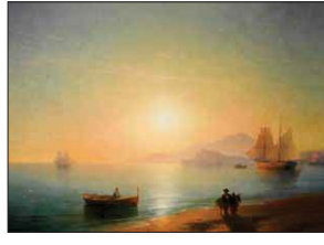
لوحة إيفازوفسكي «سفينة عابرة في ليلة مقمرة» (1868) فبيعت في المزاد بـ435 ألف جنيه إسترليني (نحو 2.9 مليون دولار).

الإجمالية لبيع مؤلفات الفن التشكيلي الروسي بلغت 5.62 مليون جنيه إسترليني (7.1 مليون دولار). أما لوحة إيفازوفسكي «سفينة عابرة في ليلة مقمرة» (1868) فبيعت في المزاد بـ435 ألف جنيه إسترليني (نحو 2.9 مليون دولار). وطرح كذلك في المزاد لوحة «الحصول للرسم الروسي بيوتر كوشالوفسكي (1876 - 1956) حيث بيعت بـ23 ألف دولار.