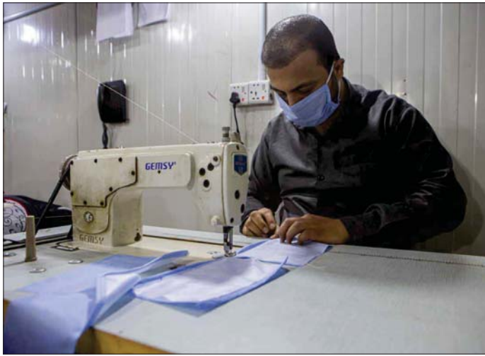
الحفاظ على نظافة وتعقيم الكمامات

دعا مختصون بالشأن الصحي الى ضرورة متابعة صناعة الكمامات التي تنتج محليا ووضعها تحت الرقابة الصحية، فبعض المنتج منها في معامل وورش اهلية قد لا توفر الحماية الكافية من الفيروس، بسبب أن قطر فيروس كورونا أقل سحما من قطر فتحات التنسج في الكمامات الجراحية الزرقاء التي تقوم بإنتاجها معامل اخرى متخصصة، وبحسب تصريحات مترجمة لا اختصاصي الأمراض المعدية بجامعة (فانديريبات) (الدكتور وليم شافنر) فإن "قطاع الوجه الجراحي لا يحمي من فيروس كورونا الجديد"، مشيراً الى أنه "يمكن لتقاع أكثر تخصصا يعرف باسم قناع التنسج "N95 Respirator Mask" أن يحمي من فيروس كورونا الجديد، هذا القناع أكثر سحما من القناع الجراحي، ولكن يجب ارتداده بطريقة معينة"، ويزيل القناع المذكور نحو 95% من جميع مولدات الهواء التي قطرها 0.3 ميكرون والكبير.