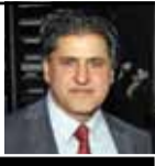
عدنان أبو زيد

وخلال مؤتمر صحفي عقد في المحافظة، وحضرته «الصباح»، قال رئيس الوزراء، إن الحكومة الحالية ليست حكومة أزمات وإنما حكومة لمدّ الجسور بين الشعب العراقي والكتل السياسية والفعاليات الاجتماعية، مبيّناً أن مجلس الوزراء اتخذ حزمة قرارات خدمية خاصة بتحصين البنى التحتية للمحافظة وأنه وجه باستصدار قائمة بأسماء شهداء حوادث تشرين الأول /أكتوبر الماضية تشمل المدنيين والعسكريين منهم توثيقاً لما دمدموه من تضحيات للدفاع عن حقوق العراقيين، وأضاف الكاظمي أننا يجب أن ننظر إلى البصرة كثقافة وتاريخ وعلماء، وما قدمته للعراق من شهداء، دفاعاً عن كرامة وسيادة البلاد وإن تلك حال اهتمامنا، فهي ليست خزاناً للنفط، لافتاً إلى أن من أولويات حكومته إحكام سيطرة الدولة على موانئ البصرة ومنافذها والقضاء على عصابات الفساد وإيقاف سرقة ملايين الدولارات التي تذهب إلى جيوب الفاسدين ضمن