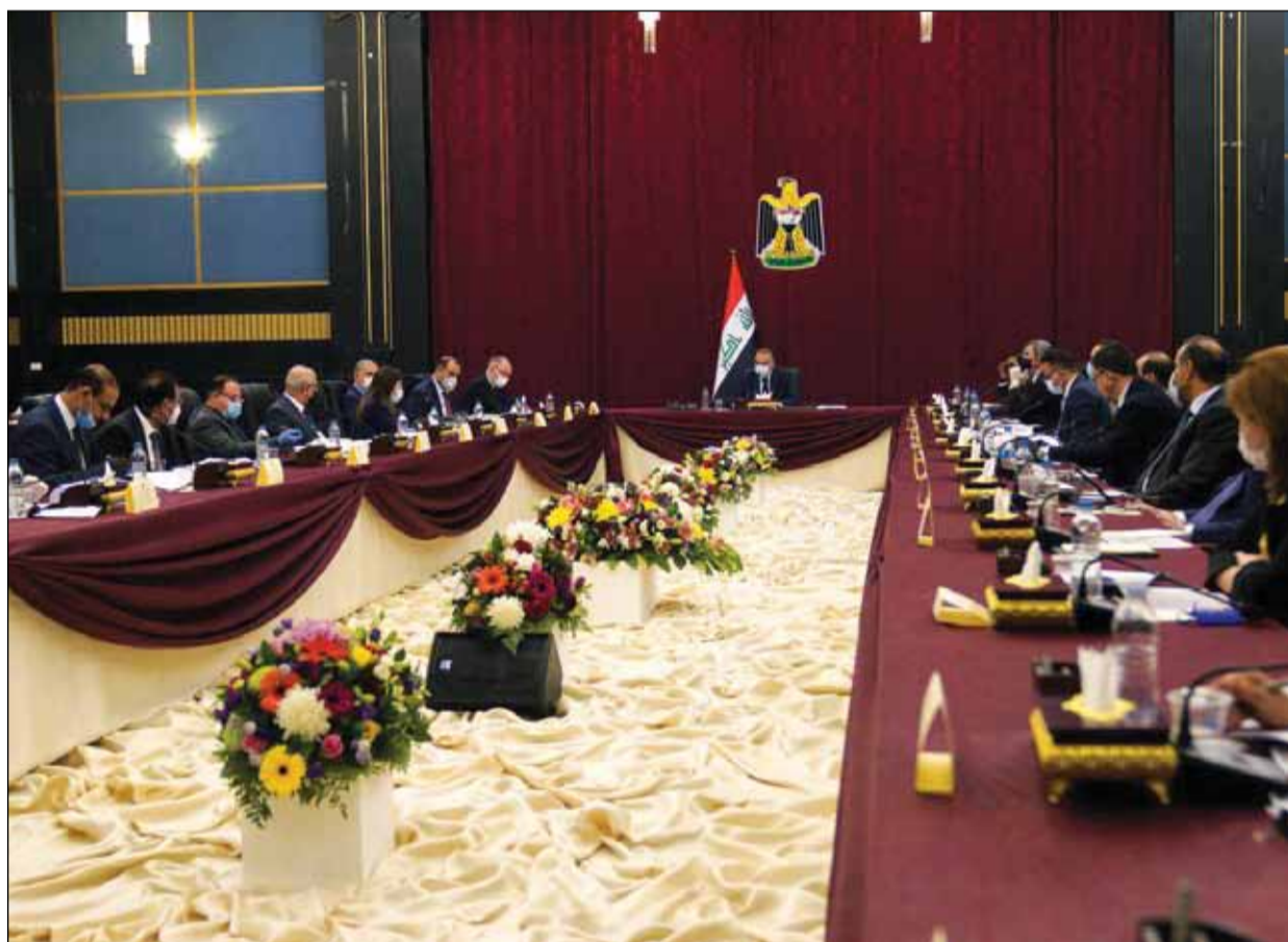
الكاظمي يترأس اجتماع مجلس الوزراء الذي عقد في البصرة