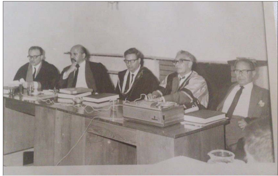
في لجنة لمتابعة أطروحة دكتوراه في العمارة

خلال عمله الدؤوب نهاية الأربعينيات وبداية الخمسينيات تميّزت تصاميم مكّيّة بمزايا معمارية فاصلة عن حقبة سبينيّة أخرى سبيلها. ركّز في هذه الحقبة على الإفادة من الموروث الجمالي المعماري والارتقاء به إلى لغة احترافية. كان من أبرز شواخصها في هذه المرحلة، الدار السكنية لفاضل الجمالي، ودار الأميرات في المنصور، والواجهة الخارجية لمبنى المستوصف العام في ساحة السباع 1949. في كل هذه التصميمات تجد حرص مكّيّة على إيصال مادة الطابوق لمستويات لم تعرفها الممارسة البنائية المحلية قبله. تميّز في هذه الفترة أيضاً تصميمه الأساس لمبنى لمدية الحلة 1951، الذي يعد تحفة جمالية ورغم بساطة التكوين وعدم اللجوء للفخامة الزخرفية أو البنائية التي اشتهرت بها بنايات تلك المدينة وتصميمه لواجهة فندق (ريجنز)