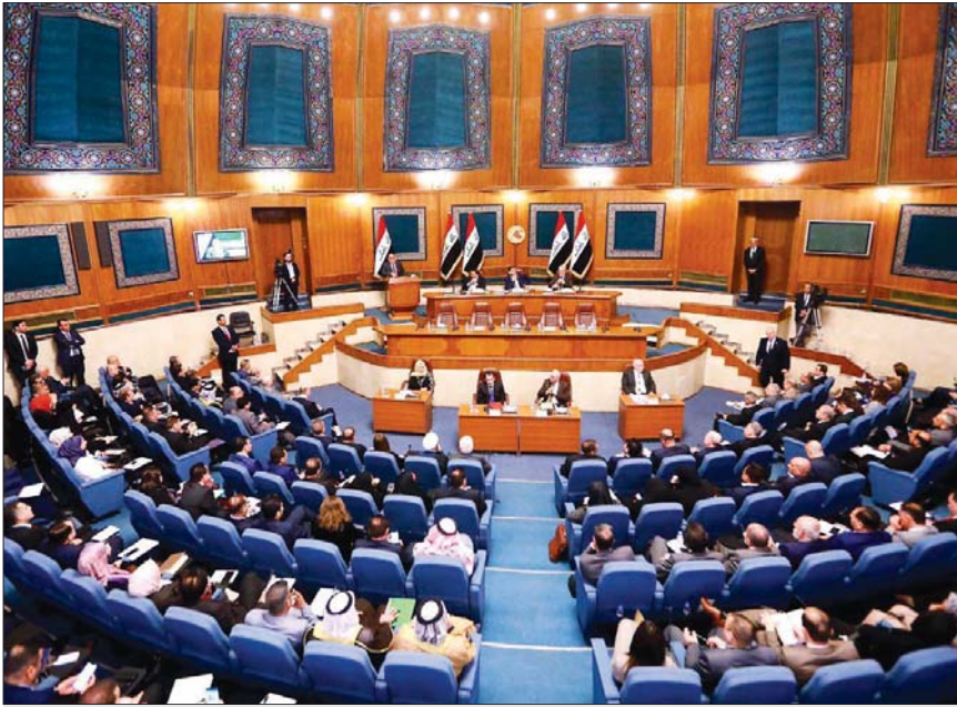
جانب من اجتماع مجلس النواب أمس بحضور رئيسي الجمهورية ووزراء