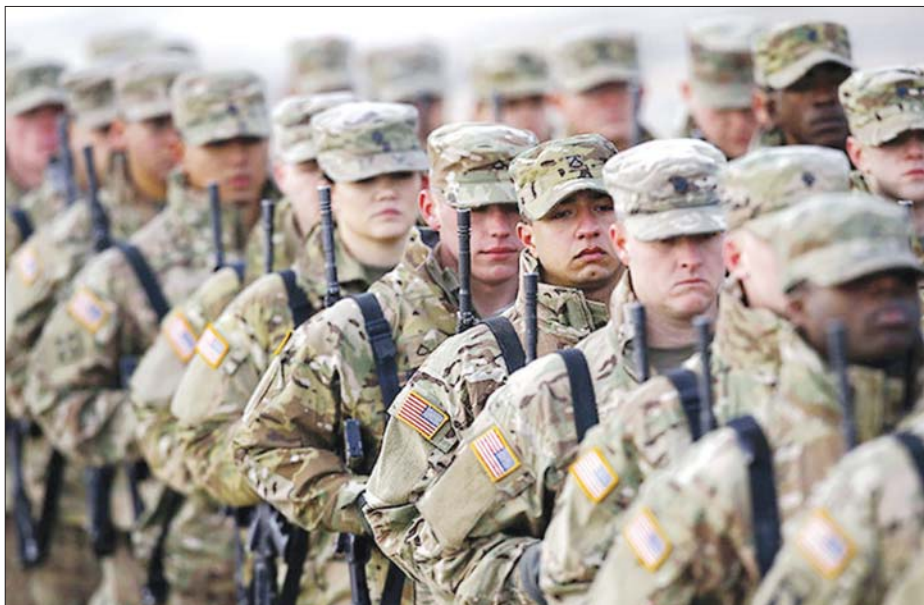
عناصر من الجيش الأميركي

■ وفد من واشنطن: نشر بالخجل من الحظر ضد إيران ■ قاض أميركي يكسر سياسة ترامب وينصف المهاجرين