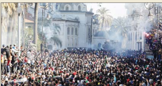
دعوى من الجزائر خلال تظاهرة مليونية بغضا لترشيح بوتفليقة لولاية خامسة

الرائع للعلاج في مستشفى جنيف وذلك قبيل انتخابات الرئاسة للربعة يوم 18 نيسان المقبل. وتكرر وسائل الإعلام المحلية أن عدد المظاهرات الذين شاركوا في الاحتجاجات بالعاصمة بلغ مليون شخص، وردت المظاهرات شعارات تطالب بـ"تغيير النظام" وأجراء إصلاحات سياسية في الجزائر.