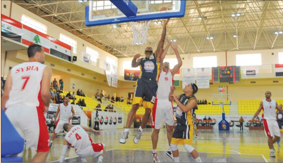
المنظف يواجف قلنديا الفلسطينية في منافسات غرب القارة

ويبدأ حفل افتتاح البطولة في الرابعة والنصف من عمر اليوم باقامة عدة فعاليات، تبدأ بعزف النشيد الوطني ورفع العلم العراقي وشعار اتحاد غرب اسيا لكرة السلة، ثم عرض للفرقة السمفونية العراقية بمزوجة «حلاق اشيلية»، بعدها يتم عرض مقاطع فيديو ومشاهد متيرة لمهارات لاعبين، وتستعرض الفرقة الوطنية للفرقة الشعبية فئونها بلوحة مناسية عن التراث والفلكلور الشعبي، وتختتم الافتتاحية ببعض الكلمات، ثم ايعاز وزير الشباب والرياضة والاذن بافتتاح البطولة ترافق ذلك فرقة الالعاب النارية.