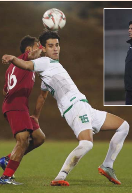
الاولمبي يفوز على العنابي

واعترف قائلا: بمزعل عن نتيجة لقاء قطر يجب الاعتراف اسام الجماهير والوسيعن بخمسة لاعبين اللامين يملون الصفوة في الاندية العراقية لتلك الفئة العمرية بالاضافة الى انه حتى هذه اللحظة لم يكتمل عقد الفريق ما اثر سلباً في وضع اللمسات الاخيرة على التشكيل النهائي الذي سيدخل به التصفيات الاسيوية» مبيها ان «الجهاز الفني سيدعم هؤلاء اللاعبين