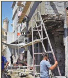
اعمال اعمار مستمرة في الموصل - أريشيف