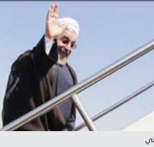
الرئيس الإيراني حسن روحاني

مع رئيس ونواب البرلمان العراقي وحضور الملتقى التجاري المشترك بين البلدين الذي من المقرر عقده بمشاركة القطاعات الحكومية والخاصة للبلدين وكذلك اللقاء مع سائر المسؤولين الرفيعين في العراق وعدد من النخب والفئات السياسية والاجتماعية في هذا البلد، تشمل جانباً آخر من البرامج التي أدرجت في جدول أعمال زيارة الرئيس روحاني إلى العراق، كما أعلن إسماعيل، أن روحاني سيؤيد ذلك الرفع المبني آية الله العظمى السيد علي السيستاني، كما سيؤيد التعيينات المقدمة في العراق.