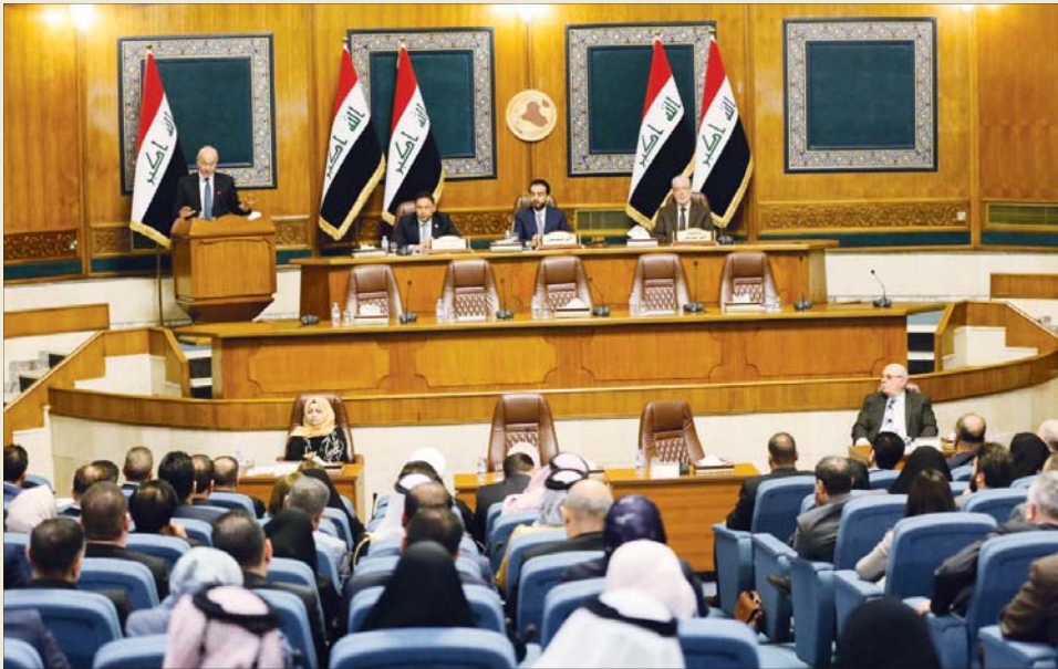
رئيس الجمهورية يلقي كلمة خلال جلسة البرلمان أمس