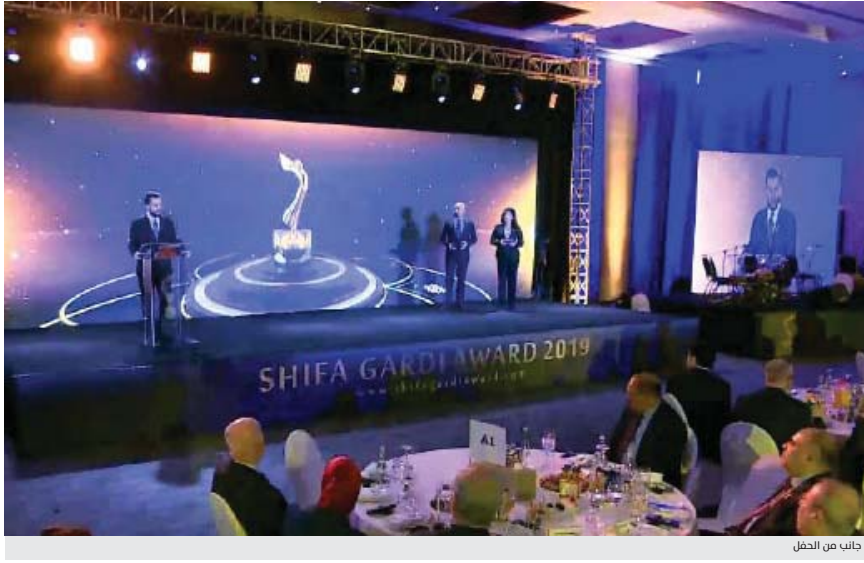
جاناب من الحفل