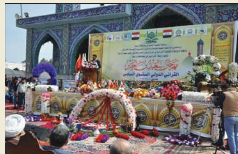
مهرجان سعيد بن جبير

واضاف ان فعاليات اليوم الاول انطلقت في مرقد الصحابي الجليل سعيد بن جبير، بينما عقدت نشاطات اليوم الثاني في جامعة واسط من خلال لقاء، دراسات بحثية وموقف قرآني، في حين اقيم حفل الاختتام