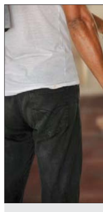
جهود حكومة واسعة للضغط على عمليات الاتجار بالبشر - أريشيف

تسمم بالتبرع بها وفق ضوابط معينة، مما سمح للكثير من تجار تلك الأعضاء اللجو، والتلصقي لتبدو العملية وكأنها تبرع بلا مقابل مالي". واربض التقرير ان "السلطات الامنية الفت القبض على 12 عصابة تمارس الاتجار بالبشر في محافظة بغداد لوجدها وأخر العام 2018 من قبل شعبة مكافحة الاتجار بالبشر قاطع الرصافة في مناطق السعدون والشعب والكرادة والمنصور تمثل عليها والاتجار بالأعضاء البشرية، وبالنساء، لاغراض الجنسية".