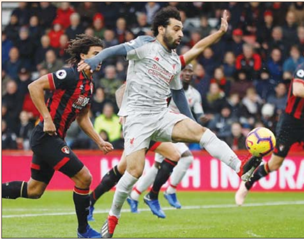
محمد صلاح امام تحد جديد

وطالب هدف ليغربول السابق جون أولدريدح ضرورة مشاركة الجناح السويسري السريع شيردان شاكيري في انتقاد مبطن لكلوب الذي احتفظ به على مقاعد اللاعبين الاحتياطيين ضد إيفرتون، وقال في هذا الصدد، «إنه لاعب يستطيع المشاركة وتغيير النتيجة من الطبيعي أن يتسائل انتصار الفريق عن عدم مشاركته مؤخرا بعد أن كان خيارا رائعا في القسم الأول من الدوري».