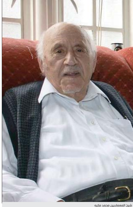
شيخ المعماريين محمد مكّيّة