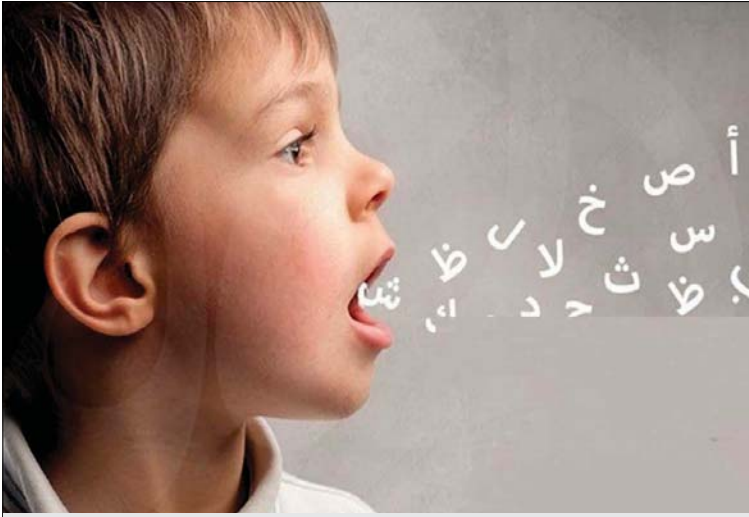
تعلّم في نطق الحروف