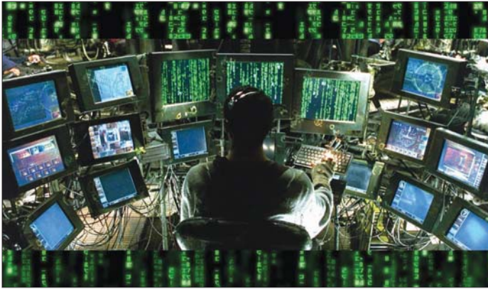
البرلمان يستعد لمناقشة قانون جرائم المعلوماتية وسط جدل كبير

محام مدني: هذا القانون سيعمل على حماية العديد من المواطنين من الابتزاز والتفكير الذي تتعرض له صفحاتهم الشخصية في مواقع التواصل الاجتماعي فضلاً عن هواتفهم