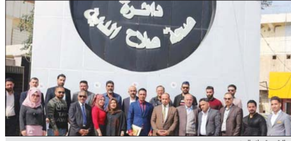
دائرة صحة صلاح الدين

واضافت ان النساء اللاتي تتجاوزن اعمارهن (40) عاما لابد لهن من القيام بقسام الفحوصات اللازمة والضرورية التي من شأنها ان تحدد من هذا المرض الخبيث. هذا واشرت دائرة الصحة والبيئة في محافظة صلاح الدين من خلال لجنة مشتركة مسحا اشعاعيا لقرية 14 رمضان في قضاء الدجيل لتابعة الشكاوي التي اجرت بشأن وجود اصابات متزايدة بمرض السرطان نتيجة وجود ابراج الاتصالات. وذكر مدير عام دائرة صحة صلاح الدين الدكتور عمر صباح شفيق الصباح: ان الدائرة اتخذت بالتعاون مع دائرة البيئة الاجراءات الصحية من الفحوصات مع الموظفين العاملين في شعب الموارد البشرية والقانونية والمحاسبية والأرشفيف والوجوهات الاربابية الأخرى للاستفصال عن امور تخص عملهم الإداري والمالي والقانوني وأبدي ملاحظاته وتوصياته ووجه لوقوفين واخذ نماذج عدد (1) من التربة بعمق (30) سم من الجهة المقابلة