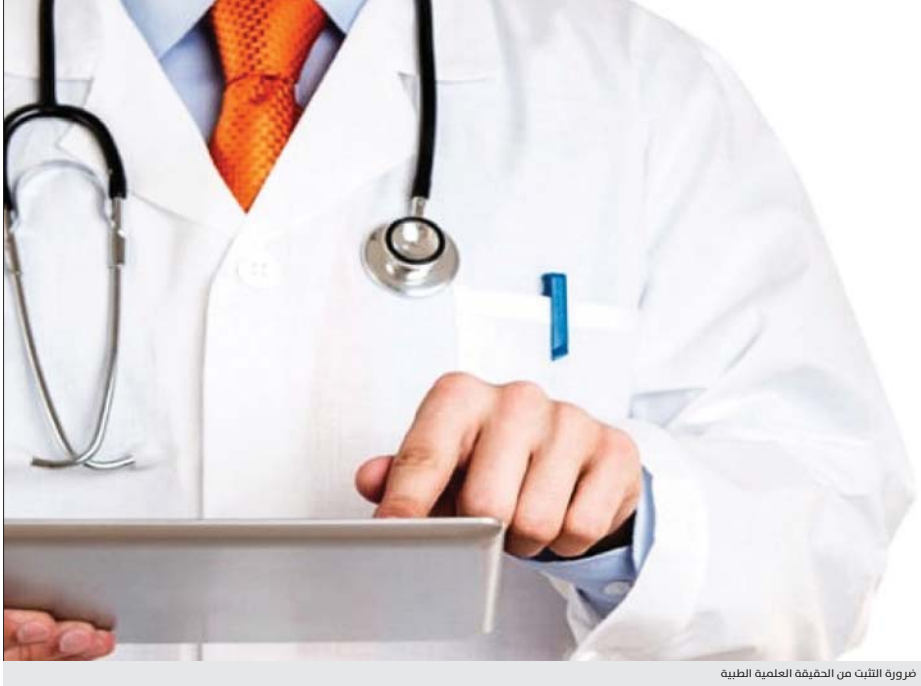
ضرورة التثبت من الحقيقة العلمية الطبية