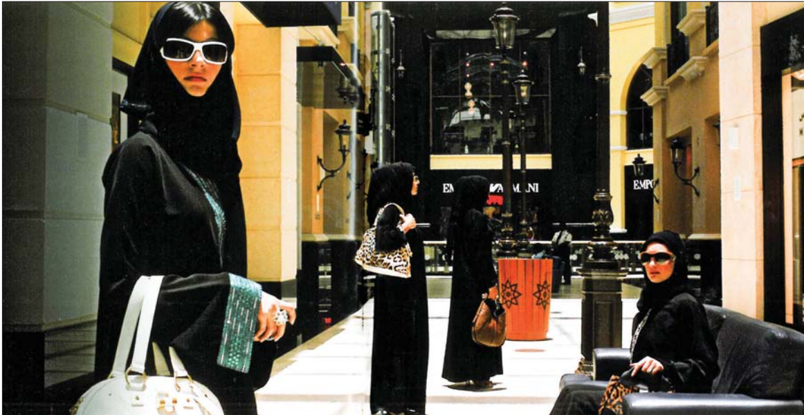
بانسية لكثير منهن، تمثل الشروة عزاء لهن عن عدم قدرتهن على اتخاذ الخيارات التي يريغن فيها