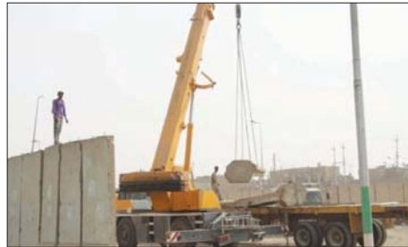
الحكومة تخطط لرفع جميع الحواجز الكونكريتية