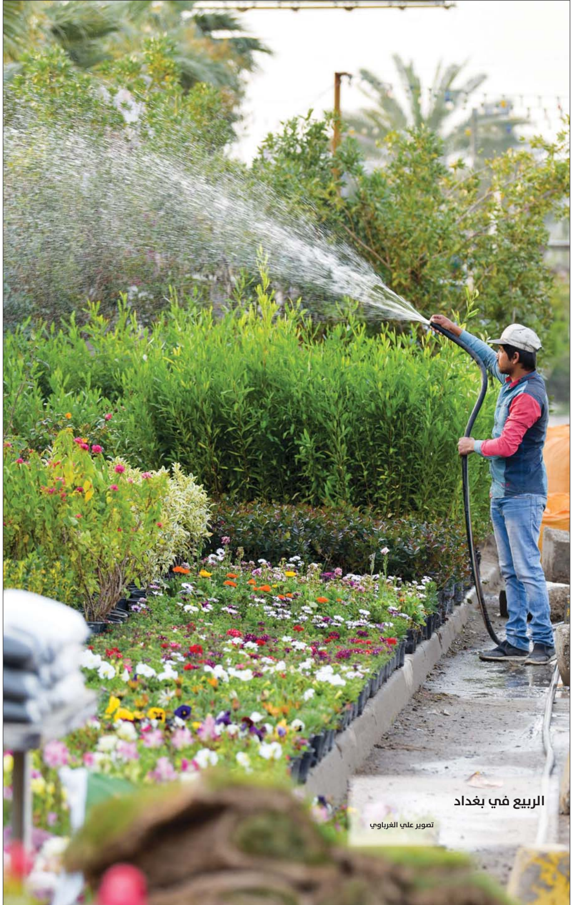
الربيع في بغداد