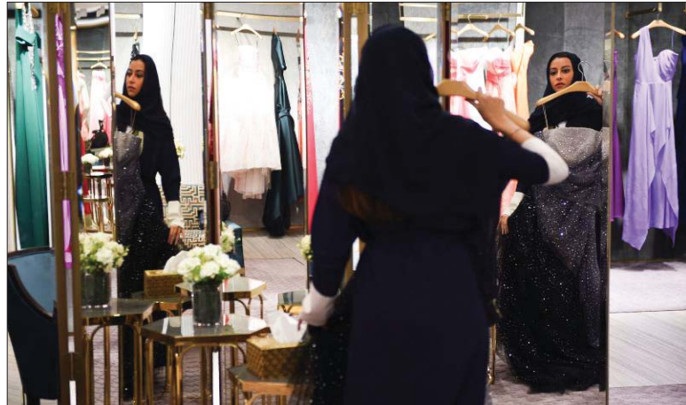
أميرة سعودية تتصفح أحد مراكز اليراض التجارية