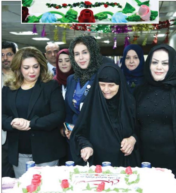
جانب من الاحتفالية

بغداد/ محمد اسماعيل