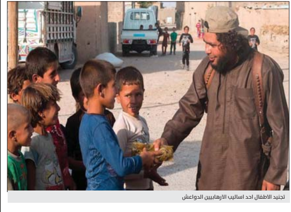
تجنيد الأطفال احد اساليب الارهابيين الدواعش

أقامت المؤسسة العراقية القانونية، ومنظمة من أجل وحدة العراق، ورشة عمل تدريبية، بشأن تعزيز سيادة القانون وإعادة الاندماج المجتمعي للأطفال، مع تغطية الصحفيين العراقيين، بتبويل من منظمة GIZ الألمانية، الخسيس الماضي، على قاعة فندق أربيل الدولي.