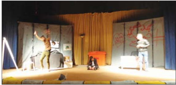
ممثلات للتوعية بضرار المخدرات في كركوك