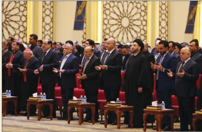
رئيسا الجمهورية والنواب والشخصيات الحاضرة في حفل التأسيس

أحيا العراقيون أمس السبت، الأول من شهر رجب، يوم الشهيد العراقي وذكروا استشهاد آية الله سماحة السيد محمد باقر الحكيم، وقدمت الرئاسة الثلاث العزاء لأبناء شعبنا بهذه المناسبة، حيث أكد رئيس الجمهورية براهيم صالح أن الشهيد الحكيم يعد رمزا وطنيا كبيرا وتاريخيا من البطولة التي رسمت الطريق لعراق محرر من الاستبداد، وبينما أثنى رئيس الوزراء عادل عبد المهدي إلى أن أيدي القتلة التي اغتالت الشهيد إنما اغتالت رمزا ومرجعاً للشعب العراقي قاطبة وللعالم في مقارعة الظلم، أكد الحلبوسي أن الشهيد الحكيم كان نموذجا فريداً في الجمع بين التمسك بالثوابت والمرونة العالية.