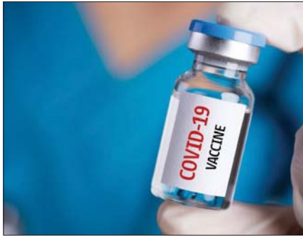
● طالبات المخطمات الدولية بحمص لقاح للتسليطنيين مكافئة كما تسلمته اسرائيل

اللقاح العالمي الكلي من الأنواع البشرية قالت منظمة العفو الدولية أنه في غضون شهرين قليلة ستكون الدول الغنية قد اشترت كميات من جرعات اللقاح تكفي لتلقيح جميع سكانها ثلاث مرات، بينما ستمتكن نحو سبعين بالمئة من الدول الفقيرة من تلقيح واحد من كل عشرة مواطنين.