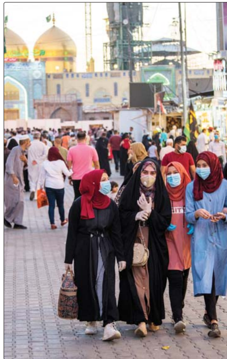
الصحة تطلق حملة جديدة من الاجراءات الوقائية.

كشفت وزير العمل والشؤون الاجتماعية، عادل الرقابي عن وجود ما يقرب من مليون و400 أسرة تتقاضى رواتب شبكة الحماية الاجتماعية. لافتاً إلى زيادة تخصصات الحماية الاجتماعية في موازنة 2021 بنحو تريليوني دينار لترتفع بذلك من 3 إلى 5 تريليونات دينار، فضلاً عن زيادة تخصصات ذوي الاعاقة والاحتياجات الخاصة بنحو سبعة تخصصات السابقة في موازنة العام 2019.