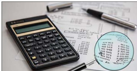
● تعدد الإيرادات

تفعيل الإنتاج ونهبت التي أن "السياسات الاقتصادية المعتمدة يجب أن تكون مناسبة لواقع الاقتصاد الوطني وتنهض الإنتاج وإن كان بشكل نسبي وتربحي وصولاً إلى نسب تتناغم والطموح. إذ توجد في البلاد مقومات تفعيل الإنتاج وتعديده الأسواق المحلية".