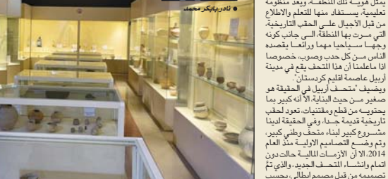
مدير متحف أربيل

ويضيف «متحف أربيل في الحقيقة هو صيرير من حيث البداية، لأنه كبير بما تحتويه من قطع ومقتنيات، تعود لحقب تاريخية قديمة جدا، وفي الحقيقة لدينا مشروع كبير لبناء متحف وطني كبير، وتم وضع التصميم الأولي منذ العام 2014، إلا أن الأزمات المالية حالت دون اتمام وانشاء المتحف الجديد، والذي تم تصميمه من قبل مصمم إيطالي، بحسب