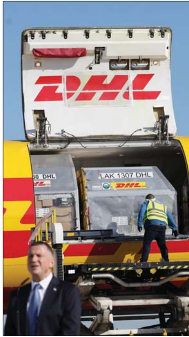
● انتظار طويل امام التسليطنيين تسلّم حصة من اللقاح