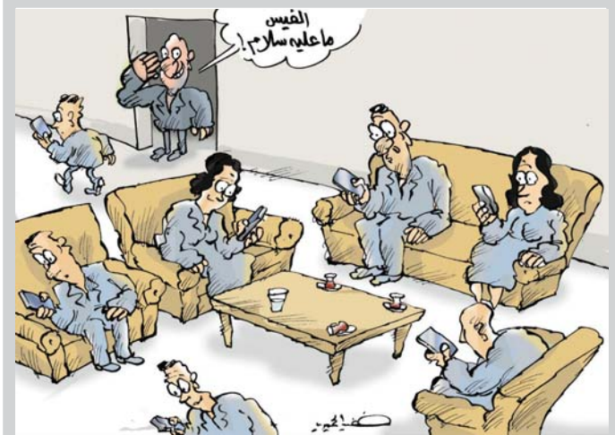
• كاريكاتير: خضير الجميري

إن الديمقراطية التي تكفل الحقوق للجميع، تعتمد على الرضاية التي تنبئ الفقر والعتق، وعلى الرغم من أن بعض الدول تحاول حمل التنمية الاقتصادية عن السياسية وهذه محاولات يائسة لتجميل الكثرة، باسم التراث والأصالة، إذ إن قضية اربوية الاقتصاد على السياسية من سمة الحضامات العرة ولها طابع كرتي يعتدى العرق والدين والهوية النظام السياسي ليس عليه الانفتاح على الداخل حسب، بل عليه الانفتاح على الخارج أيضاً، فلا يمكن أن يعيش في عزلة وشامدا كيف إن دولة علمي تجد صعوبات كبرى في مواجهة الكوارث الطبيعية من دون مساعدة الدول الأخرى؛ فالقوة وحدها مهما عظمت لا تستطيع أن تحمل وتعالج المعامل المتنوعة التي يشهدها العالم، ولو كانت القوة في الراجح التي يقبى الاتحاد السوفيتي السابق والدول التابعة، له في مسيرة التسلسل والنظام الشمولي، الذي يبتني الاقتصاد الامري كما يطلق عليه الباحث الاقتصادي قالح عبد الجبار وليس الاقتصاد الحر - لا سيما أن تلك الدول امتلكت ترسانة نووية ضخمة غير مسبوقة في تاريخ التسلسل والمعامل التنموية البشرية.