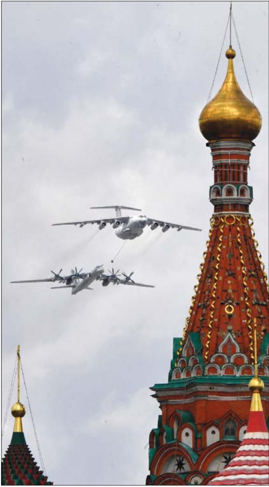
● الملمات الأخيرة لعرض عسكري ضخم، سيجري يوم غد الأحد، بمناسبة الذكرى الـ 76 للملمات التي تشمل جميع مراحل العرض وتفاصيله بدأت، أمس الجمعة، في جميع أنحاء روسيا، بهدف تأمير جاهزية استعراض له وزيمته في التاريخ الحديث للبلاد.

حما، وأفادت القناة العبرية بأنه إضافة لهذه الأسباب، فإن يوم أمس الجمعة السابع من أيار، يصادف يوم القدس العالمي، حيث يستعد الجيش الإسرائيلي لحالة توتر وتناهب، ولذلك قرر الإخلاء، على التعتريزات العسكرية بالصفى الغربية، واتخذ سلسلة إجراءات لمنع التصعيد. وأصيب العشرات من المعتصمين الفلسطينيين بالرصاص المطاطي والاختناق من جراء إطلاق الغاز المسيل للدموع من قبل قوات الشرطة الإسرائيلية، وأغلقت قوات الأمن الإسرائيلي مناطق حي الشيخ جراح بالقدس لمنع توافد المتظاهرين مع السكان المهددين بالتهجير، بينما تواصلت استنزافات عضو الكنيست اليميني، إيتان بن غفير من حزب "الصهيونية الدينية"، وعناصر منظمة "الأنفا" اليهودية المتطرفة التي دعمت انصارها للاحتشاد في المكان. كما انتشر عناصر من وحدات "المستعربين" في أرجاء المدينة واعتادوا بالضرب على فلسطينية، وأعلنت الشرطة الإسرائيلية أممقال شابدين فلسطينيين بزعم "الاعتداء على النار"، قرب محطة القطر الخفيف. وفي وقت سابق، أفادت تقارير صحفية بمقتل فلسطينيين اثنين وجرح ثالث برصاص الجيش الإسرائيلي عند مجبر سالم قرب جنين، شمال الضفة الغربية.