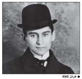
• فرانز كافكا

• فرانز كافكا • ترجمة: عادل العامل ثاقفة الشارع كأن من يعيش حياة العزلة ويريد من هذا. بين المكان والفيئة. أن يرافق نفسه إلى مكان ما. كل من يصن فجأة، ووفقاً للتغيرات الحاصلة في وقت النهار، الطقس، وحالة العمل، وما شابه. بالرغبة في أن يرى أثة ذراع على الإطلاق يتشبه بها. إن يكون قافراً على تدثر أمره طويلاً من دون نفاق تظل على الشارع. وإذا كان يبرجأ لا يبرع معه في أي شيء إلا أن يذهبن إلى بيته ناقدته رجلاً متعباً، بعينين تتقلقان من