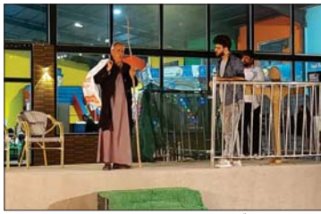
جانب من المسرحية

استقراري، ماذا أنت صانع مع حكام وسلطة هذا الوطن البطل، رغم غناه والجوع والذل والظلم؟