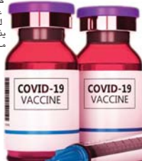
«مصلحة نيوزويك الأميركية

آخر أو أدوية أو تقود كانت موجودة في الخضر، وقد تم فتح تحقيق بالأمور للوصول الي الفاعل، وإفادت التقارير أن اللص اعاد الجرعات بعد وضعها في حقيبة تركها في مقهى قريب من مركز للشرطة بالقرب من المستشفى، بعد اخباره بذلك أن القوارير تستخدم في مكافحة وباء كورونا. بالعلة الهندية، ترك المشتبه به الجصول لملاحظة مع الجرعات المعبأة تقول: «اعتذر، لم أكن أعلم بأننا أدوية لعلاج فيروس كورونا»، يذكر أن 1700 جرعة تضم 1270 جرعة من لقاح استرازينيكا و440 جرعة من لقاح كوفاكسين، تمت سرقتها من مخزن بمستشفى حكومي بمنطقة جند بولاية هاراتانا. والسفر راجيشندر سينغ، رئيس الشرطة المحلية، لي أن لهم لم يأخذ أي لقاح