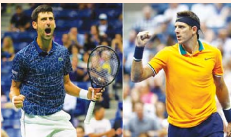
مونتريل / أ ف ب

أعلن الصربي نوناف ديوكوفيتش الصنف الأول عالميا في كرة المضرب والنتوج بلقب بطولة ويمبلدون السنوية من دورة مونتريل الكندية إحدى دورات المسنجرز القفيرة الشهر المقبل على أرض صلبة لملحة في الاربعة. وانضم إلى ديوكوفيتش (32 عاما) الذي أحرز لقبه الكبير السناس عشر بعد نهائى تاريخ ضد السنويروى وجو فيدرر الارجنطينى خوان مارتن دل بوترو الصنف 12 عالميا والذي يتعافى من جرحه في ركبته اليمنى. وقال ديوكوفيتش في بيان نشره الاتحاد الكندي للعبة «يوسفين الإعلان عن انسحابي من كأس ووجز بدعم من فريقى قررت ان أمنح جسمى راحة إضافية ووقتا للتعافى قبل اللعب مجددا». وفي ظل انسحاب ديوكوفيتش يتوقع ان يكون الاسبانى انايل نالد حامل لقب 18 دورة كبرى الصنف الأول في الدورة التي تنطلق في 5 آب. وأحرز نالد لقب الدورة أربع مرات آخرها العام الماضي على حساب اليونانى ستيفانوس شيتسيباس. وتقام الدورة مدارة من مونتريل وتورونتو، وقد