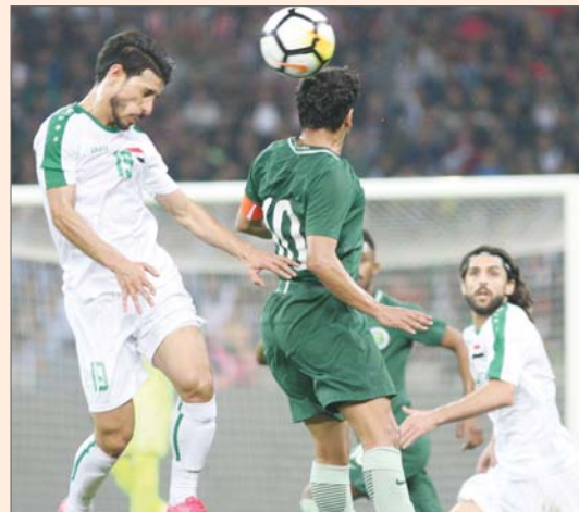
كاتانيتشش مطالب بتوضيح اخطاء اعدادنا

الآسيوية المشتركة فان المجموعة الثالثة التي وضعت منتخبنا الى جانب منتخبات ايران والبحرين وروثغ كورنغ وكامبوديا ليست