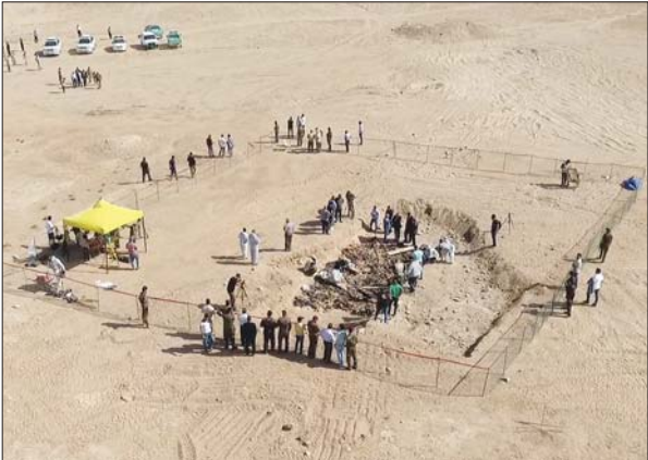
المقبرة الجماعية التي تم اكتشافها في السماوة

حداد: المقبرة الجماعية التي اكتشفت في السماوة للأطفال ورحل شبعة نضاب إلى سرج جرائم النظام المبادء.