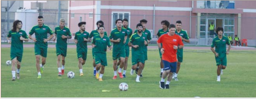
جان من تدريبات الوطني في كربلاء