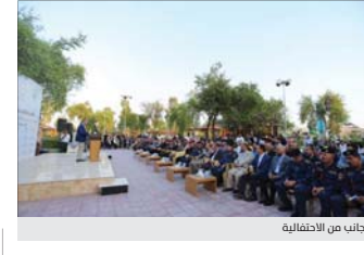
جانب من الانشائية