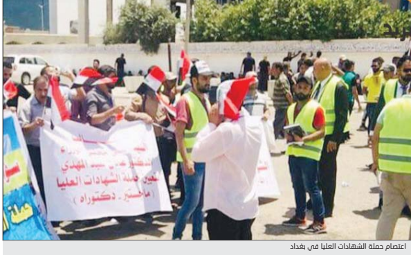
اعتماد حملة الشهادات العليا في بغداد

وأوضحت الوزارة في بيانها، أن "مخيمات اللاجئين في العراق تشهد تحسناً ملحوظاً بفضل جهود المجتمع الدولي، وأن العراق سيبذل قصارى جهده لتسهيل عودة اللاجئين إلى ديارهم وتحقيق الاستقرار والتأكيد على استمرار التعاون المشترك للقضاء على خلايا تنظيم داعش الإرهابي". وأشار الحلبوسي في بيانها، أن "مخيمات اللاجئين في العراق تشهد تحسناً ملحوظاً بفضل جهود المجتمع الدولي، وأن العراق سيبذل قصارى جهده لتسهيل عودة اللاجئين إلى ديارهم وتحقيق الاستقرار والتأكيد على استمرار التعاون المشترك للقضاء على خلايا تنظيم داعش الإرهابي".