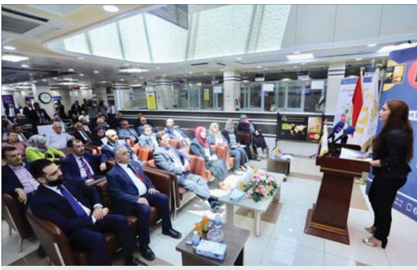
جانب من العالمة