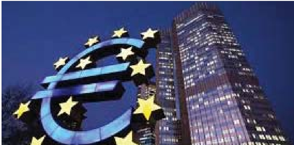
مبنى البنك المركزي الأوروبي