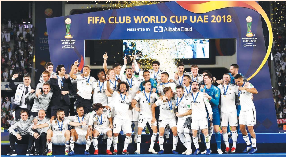
ريال مدريد أحر المتوجين بلقب مونديال الأندية

أهمل ريال مدريد اتفاته مع نادي أرسنال على استعارة الأخير لنادى سيبياس حتى نهاية الموسم. بيد ان هناك لاعبا آخر في طريقه بصورة أكيدة إلى أحد فرق الدوري الإنكليزي الممتاز. فحماس شبكة سكتاكي فإن المدافع خيسوس فايخو على وشك الانتقال إلى نادي وولفرهامبتون على سبيل الإعارة. وتم تحديد موعد إجرا والفحوصات الطبية أمس الجمعة. كان المدافع الإسباني البالغ من العمر 22 عاما والذي لعب لفرانكفورت في موسم 2016/2017 قد شارك في 12 مباراة فقط في الدوري الإسباني في موسمه الأخيرين في ملعب أستيناغو برنابيو. ويعد فايخو خارج مخططات المدرب زين الدين زيان للموسم الجديد كذلك ولذا فإن رحيله على شكل إعارة سيكون فرصة له للحصول على مزيد من الوقت للاعب ليكتسب الخبرات. وفي بعض الأحيان عندما تنفرق الطرق يكون ذلك أفضل للمجموع. ولم يعلن نادي وولفرهامبتون حتى الآن أي بيان رسمي عن انتقال اللاعب إلى صفوفه لكن من المنتظر أن يتم هذا سريعا حتى ينضم لتدريبات فريق المدرب تونو إسبيريتو سانتو والذي سيخوض مباراته الافتتاحية في الدوري الإنكليزي الممتاز في 11 آب المقبل ضد ليستر سيتي.