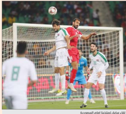
لقاء سابق لمنتخبنا امام السعودية

الامام وتطوير حالة التغطية العكسية الدفاعية وتقليل المساحات. ولعل من أبرز الامور التي تفتقرها التغطية الخلفية لمنتخبنا خلال الحقبة الماضية التي مازالت تكتنف لغاية ودية العراق وتونس الاخيرة في -ضعف التعامل مع التسديدات خارج منطقة الجزاء، من حيث الرقابة وقطع المنفذ او اختطافه -مشاكل المدافعين والحراس مع الكرات والساقطة في المنطقة المحصورة بين ال6 ياردات ونقطة الجزاء اي تطبيق مبدأ الدفاع عن الهدف وحماية المساحة المحصورة بين خط الهدف وخط الست ياردات التي يشترك فيها كل من حامي الرمي والمدافعين الذين يقومون بتطبيق مبدأ دفاع البرازيل او المنطقة الدفاعية السريعة عن منطقة الهدف (الركر) او دفاع الاربعة -الفرديّة المتناسقين بين خطبة اللاعبين للحد من تحركات المناسقين في ركلات الزوية - ضعف ادوار لاعبي الارتكاز في ركلات العمق الدفاعي في الخلف لاسيما التعامل مع الكرة الثابتة -الكرات البيئية -التمريرات المتفاجئة -اللاعب بين الخطوط -الانفرادات والتي ترتبط بدور التعرضين والقائمين في حال المرتداد او الانتقال السريع لانهم مع الحل بواسطة قدرتهم في ابتكار كرات والصرعات الثابتة -سهولة خسارة المساحة بشكل سريع التي تحتاج في بعض الاحيان ان تطبق مبدأ الثاني قبل التمدد واخذ القرار -تطبيق قيادة المنافس او حامل الكرة في مناطق بعيدة او حرمات من سرعة التمرير انتهاء بالضغط ومهاجمة الكرة بعد فقائها او بما تسمى ردة الفعل تجاه فقدان الكرة بسرعة استرداد الكرة سريعاً ومهاجمة كرة المنافس في منطقة فقائه