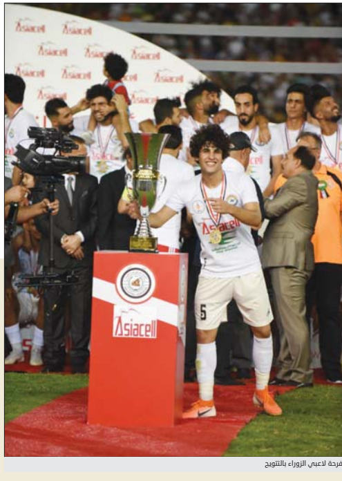
فرحة لاعبي الزوراء بالتتويج

بهم رئيس الوزراء، فتجب إحلتهم على القضاء، قبل التصريح لأنهم لا يتمتعون بالحصانة سواء كانوا سابقين أو حاليين. لذلك فالإجراءات القانونية من السهولة إن تمام بحقهم" داعياً رئيس الوزراء باعتباره رئيس جهاز مكافحة الفساد إلى "الضبي بإجراءات التحقيق باعتباره الظهيرين على الجهات المعنية باعتبارها هي التي تنظر بهذه الأمور حتى تثبت إنهم من "عندها". وأضاف أن "مجلس القضاء الأعلى فاتح في وقت سابق مجلس النواب بوجود شخصيات أصبحت تتمتع بحصانة في البرلمان وكانت سابقاً حاصلة على مناصب تنفيذية في الحكومات السابقة وقد وجهت لها بعض تهم الفساد، وعلى مجلس النواب أن يرفع عنها الحصانة للقضاء كونه إجراء قانوني ويستوريا وعلى النائب أن يدافع عن نفسه أمام القضاء". وقال الغزي لـ"الصباح" -بالنسبة للوزراء- الوجهة لهم تهم فساد اثنين صرح