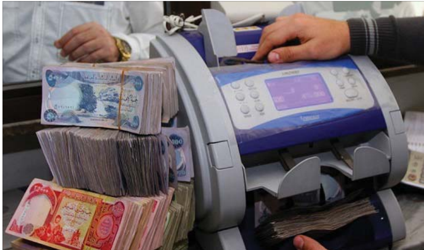
دفع المستحقات المالية للفلاحين