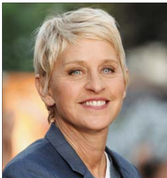
لين دي جينيرس

اعتمد موقع "بيزنس إنسايدر" قائمة بحساب أعلى المشاهير أجراً، في الساعة الواحدة، نشرته مجلة "فوربس" "شاهير الفن والرياضة للعام 2019، ضمن مجموع من مئتين تلفزيونيين ومقدمة برامج وحيدة وجاء، جورج كلوني، على رأس القائمة، بـ 27 ألف دولار للساعة الواحدة، وفي المرتبة الثالثة، جاء الفنان المصارع السابق دوين جونسن، حين تجاوزت 14 ألف دولار، في الساعة، وتأتي بعده في القائمة مقدمة البرامج لين دي جينيرس، التي بلغ دخلها في الساعة الواحدة 10 آلاف دولار.