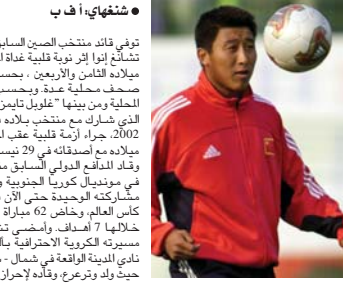
● شغهاي: أ ف ب

7 مرات بين عامي 1994 و2003، وبرغم عدم اكتسابه شهرة على الصعيد الدولي بعد تشانغ أسطورة في بلاده، فوصفته وكالة أنباء الصين "شينخوا" بـ "أسطورة كرة القدم الصينية". بينما أشارت "سوكر نيوز" بمزايا الرجل عاده أنه كان "مقاتلاً" داخل المستطيل الأخضر، لكنه هادئ خارجها. كما تصدرت وفاة تشانغ عناوين الصحف في مدينة غريمسي، وهي بلدة صيداني تقع على الساحل الشمالي الشرقي لانكلترا، حيث أمضى جزءاً من موسم 2001-2000 مع نادي اللينة إثر انتقاله إلى صفوفه على سبيل الإعارة، وبات تشانغ الذي انتقل إلى غريمسي الذي يخوض غمار الدرجة الثانية لحل مشاكله الدفاعية. لاعباً محبوباً لدى جماهير النادي حيث شارك في 17 مباراة وسجل ثلاثة أهداف قبل أن يعود إلى الصين للتخصيص لمونديال 2002.