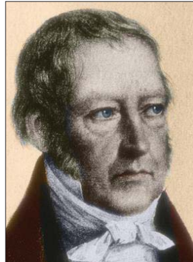
جورج فيلهلم فريدريش هيغل