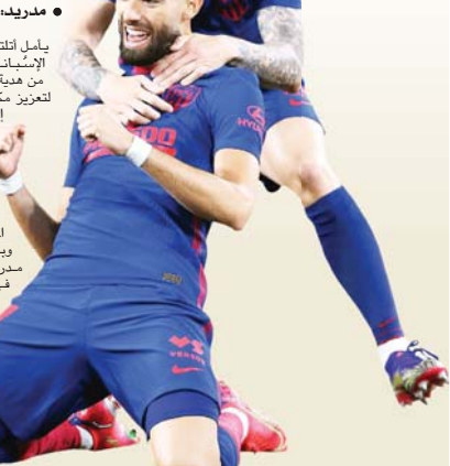
● مدريد: أ ف ب

على أرضه أمام غرناطة (1-2) في مباراة متعجبة من المرحلة الثالثة والثلاثين مقابله أتلتيكو في المباراة قبل خمس مواعيل من النهاية. وذلك قبل لقاء القمة بينهما في الجولة 35 في كامب نو، ما يمكن أن يكون الاستحقاق الأهم لحسم لقب "الليغا" الرجال الدرب الأرجنتيني ييغو سيميوني للمرة الأولى منذ عام 2014. وتحوض الأندية الثلاثة الأولى منافسات المرحلة وهي تجر خلفها أذبال خيبة عدم قدرتها على الفوز بمبارياتها الأخيرة في الدوري، فأبى جاسن خسارة برشلونة، سقط أتلتيكو أمام أتلتيك بلباو 1-2 وتعادل ريال أمام ريال بيتيس سلباً، بينما كان إشبيلية المستفيد الأكبر كونه الوحيد الذي عاد بالنقاط الثلاث بفوزه على غرناطة 2-1. ولا تدخل حسابات شارق الأهداف ضمن أوراق تحديد هوية الفائز بالليغا على غرار ما يحصل في الدوري الإنكليزي الممتاز، فالحسم بين الأندية في حال تساويها تقاطع يُحدد على ضوء المواجهات المباشرة