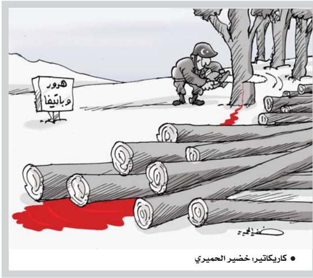
● كاريكاتير: خضير الحيمري

صحية لينا، نظام شفاه، فلا يمكن للشعب الاشارة الى مواضع الخلل والمفاضلة بين الجيد والرهين دون كلام، وكما لا يمكن إيقاف الفساد والهبر بالمال العام عراقى نون استثناء يحذر من اثره الناس اليه، ولا يكلم الناس الا دعاء، سرا لتخليصهم من الكبتات وترويضهم على مسأولها، ويمون النفس بنظام ديمقراطي يمنحهم حرية الكلام والاعتراض والانتفاخ، بعد التغيير وتأسيس نظام ديمقراطي بدستور ثابت وبرنامجاً وحكومة منتخبة، هناك للاسف قمع من نوع اخر و تكبير للأفواه، وأي شخص يتحدث ولو بكلمة انتقاداً لسياسي أو لمسؤول أو إجابته مذكورة تطالبه بتعويض مالي يبلغ مائتا، بعض النظر عن صحة ما يدعي المواطن، وما لود خوفاً لدى شريحة واسعة من الناس من المطالبة بحقوقهم أو الكشف عن حالات الفساد أو المشاركة بالأراء السياسية، بصراحة اغلبنا من رؤساء ومرؤوسين لا نمتلك وعياً سياسياً، حيث لا نفرق بين الانتفاذ والتخيل وبين التسقيط والمعارضة وهذه هي المشكلة، لا يريد السياسي من الشعب ان يوجه له اي كلمة غير كلمات الثناء والمدح ويرى نفسه كامل ومنزه من كل الخطا، وهذا من المستحيل ومما لا يقبله العقل. إن على المسؤول ان يقبل النقد وان تكون له ثقافة سياسية تجتبه الرد بدموع او تهديد لكل من يرفع صوته، مطالباً بحقوقه أو معتزلاً عليه، فهذا اساس الديمقراطية والمعارضة ظاهرة