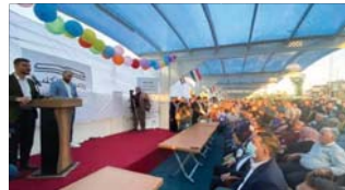
● جانب من كرنفال الموصل