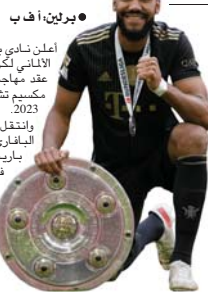
برلين