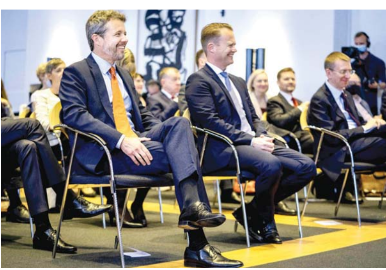
● ولي عهد الدنمارك، فريدريك (إلى اليسار)، ووزير الخارجية، جيبني كوهود (وسط) خلال الاحتفال بالذكرى المثوية للعلاقات الدبلوماسية بين الدنمارك وإستونيا ولاتفيا وليتوانيا.

دعا مجلس الأمن الدولي، جماعة «نصار الله» (الحوثيين) اليمنية إلى السماح لخبراء الأمم المتحدة بالوصول إلى النافذة النقطية المتهاكة «صافير» من دون تأخير، محمّلين الجماعة مسؤولية وضع النافذة التي يخزن فيها أكثر من مليون برميل من الخام قبالة سواحل محافظة الحديدة.وقال أعضاء مجلس الأمن الدولي في بيان عقب جلسة مغلقة ناقشت أزمة النافذة النقطية التي لم تجر لها صيانة منذ أكثر من 5 أعوام، إن على الحوثيين تسهيل الوصول غير المشروط والأمن لخبراء الأمم المتحدة لإجراء تقييم شامل ونزيه ومهمة إصلاح أولية من دون مزيد من التأخير، وضمان التعاون الوثيق مع الأمم المتحدة.وجدد أعضاء المجلس التحذير من تمزق أو انفجار النافذة ما سيستدعي في كارثة بيئية واقتصادية وبيئية وأمنية للمنطقة.يأتي ذلك غداة إعلان جماعة «نصار الله» تعثر اتفاق وقعته مع الأمم المتحدة في تشرين الثاني لتقييم وضع النافذة «صافير» وإجراء صيانة عاجلة لها في الأولي منذ 5 سنوات.وقالت «نصار الله» في بيان، إن الأمم المتحدة اتفقت على معظم بنود الاتفاقية الوقعة لتقييم وصيانة النافذة صافير، ووصلت الأمور إلى طريق مسدود، مضيفة أن الجانب اليمني استبعد معظم أعمال الصيانة العاجلة المتفق عليها، وراعى فقط على أعمال التقييم، بزعامة أن الوقت والتمويل لا يكفيان لإجراء صيانة الآمنة للنافذة المتدهورة المتسوية الكاملة عن أي تعاميات.