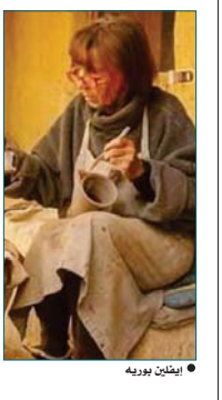
• إيفلين بوريه

رحلت الفنانة السويسرية الأصل إيفلين بوريه نتيجة ميوط حصاد في الدورة الدموية عن عمر ناهز 80 عاماً. وبوريه التي كانت زوجة للشاعر المصري الراحل سيد حجاب (1940 - 2017) وأسست مدرسة لصناعة الحزف والفخار في قرية تونس، تلقب بأسطورة من الفن والجمال. وأسهمت بوريه في تحويل قرية تونس من مجرد قرية ريفية إلى سياحية ذات طابع خاص جعلها قبلة للزوار من مصر ومختلف دول العالم. إنقررت الانتقال إلى مصر من سويسرا منذ أكثر من 45 عاماً بعد دراسة الفنون الخزفية وأسست بوريه جمعية ومدرسة لصناعة الحزف والفخار بالمصرية. لتعليم أهلها تلك الحرفة. وساعدتهم في إقامة ورش خاصة بهم. وفتح مجالات لتسويق منتجاتهم محلياً ودولياً. وفتح قرية تونس على عدد 80 كيلومتر جنوب غرب العاصمة القاهرة. وترتجم بالمليون من الفنانين من برعا في فنون الحزف والفخار والرسم والنحت على النحاس.