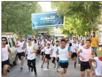
● نقمة انطلاق الماراثون

إذا كان عبد الله الحوروي قد قدم خياره لهذه المرحلة من مراجعات النهضة، عبر كتابه، «الأيديولوجيا العربية المعاصرة»، فقد فعل مشام جعيط ذلك على نحو فكري، من خلال كتابه، «الشخصية العربية الإسلامية والمصير العربي» وأوروبا والإسلام، قبل أن يشهد بعد ذلك شبه انكسار على المنزح الفكري، من خلال تركيزه التحدي على بوكاير الإسلام الأولى، في السيرة والوحي المخمسي، وفي الفتنة، وتاريخ الكوفة كنقطة ارتكاز للمدينة الإسلامية.