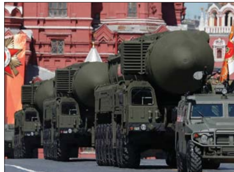
• نموذج من صواريخ روسيا النووية

لم يتسرب في الآن سوى القليل عن مواصفات «كيدر» المؤكدة، وحتى هذا القليل الذي تكشف سببياً عرضة للتغيير مع تقدم أعمال البحث والتطوير على المنظومة الجديدة، وقد سبق أن أكتفت مصادر على الفخام وسائل الإعلام الروسية أن العمل على منظومة «كيدر» لا يزال في مرحلة الأولية، وألا ما تقدمه كثير ولعل مرحلة التجربة والتصميم فسوف يسكن العديد في سبب الموضوع، أما الآن فلا يزال الأمر في مرحلة البحث والتصميم العميق، على حد تعبير مصادر الدفاع.