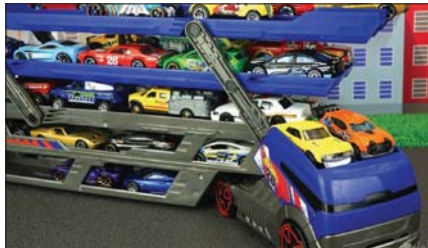
● مجموعة من ألعاب السيارات الصغيرة