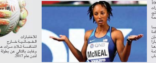
للأختبارات الفحوصات خارج المنافسة ثلاث مرات عام 2016، وإيقاف باقيها من بطولة العالم لندن عام 2017.

أعلنت وحدة النزاهة التابعة للاتحاد الدولي للعبة القوى إيقاف العدة الأمريكية بريانا ماكنيل بطله أولمبياد ريو دي جانيرو 2016 في سباق 100 م حواجز، لمدة خمس سنوات معروفة مسلسل إدارة للتأنيح، في حرق لقواعد مكافحة المنشطات للاتحاد الدولي. وأوضحت وحدة النزاهة أنه بما أن العدة استأنفت لدى محكمة التحكيم الرياضية (كاس)، فإن العقوبة التي يسري مفعولها اعتباراً من 15 آب 2020، تم تجديدها مؤقتاً في انتظار قرار المحكمة الذي يصدر قبل دورة الألعاب