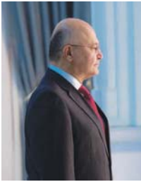
الدكتور إبراهيم برام رئيس جمهورية العراق

عصفت الرياح العاتية بالعراق على مدى الأربعين سنة الماضية، هذت الحروب والأضطهاد والقوبان الاقتصادية والإرهاب والصراعات الداخلية استنزفته وعطلت وهاجمت موارثه. لكن الخطر تهدد مستقبلنا بواجبنا هو التغيير المناخي وأثاره الاقتصادية وأضراره البيئية الكبيرة في جميع أنحاء العراق. وفقاً لميزانج الأمم المتحدة للبيئة، العراق هو خامس دولة مشاهدة من حيث التكيف مع تغيرات المناخ. الألة على تزايد مخاطر المناخ خطير بنا، أصبحت درجات الحرارة العالمية أكثر شديداً.