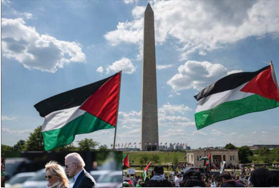
تظاهرة في واشنطن مؤيدة للفلسطينيين

يلتزم الرئيس الأميركي جو بايدن بمسار احتفظ لنفسه منذ عشرات السنين عندما كان سيناتوراً شاباً وهو الدفاع المستميت عن الدافع الإسرائيلي، ولم يتنازل حتى الآن أمام الجناح التقدمي في حزبه أو الديمقراطيين اليهود المحافظين باتباع موقف أكثر قوة تجاه نتنياهو.