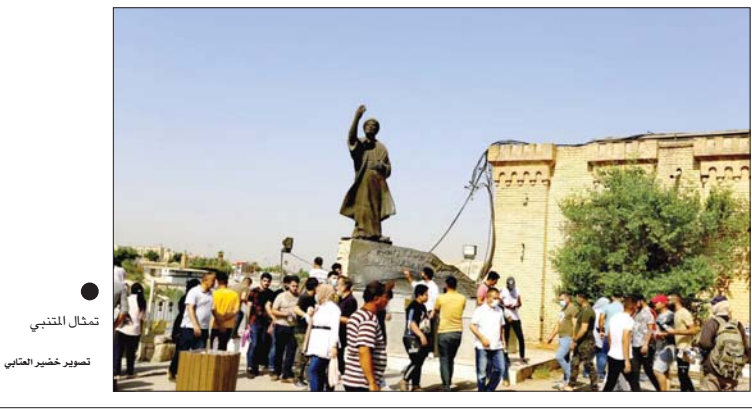
تمثال المتنبي