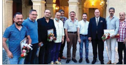
● نقمة تضم الكرمين وتقب الفنانين العراقيين

القائمين على هذا الحفل الذي استطاع أن يبرز دور الفنان والاحتفاء، بانجازته في بلده، موضحاً أن «هذا البحر ذاته تقويم كبير وتشجيع مميز لتسليح السينمائيين وتوجه الشعوب والقوميات، وتعالق عن ثقافة وأدب بلاده، محمداً الأرهاف ومن يحاول التفرقة بين أبناء البلد الواحد، في مهرجان الكويت السنوية الجديدة، الذي أقيم مؤخرًا في الكويت.