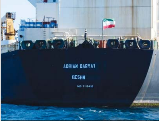
● طهران وكالات

لصالح الجيش الإيراني، وذلك قبل الإطاحة بحكومة شاه إيران في عام 1979. وصدر قرار التحكيم الدولي في عام 2008 بأن بريطانيا مدينة بالتبع للدور في الحكومة الإيرانية، إلا أن شركة الخدمات العسكرية الدولية العمودية - وهي وكالة مبيعات أسلحة تابعة لوزارة الدفاع البريطاني لم يعد لها وجود حالياً - وأسلت التشكيل في حجم البين الكبير للغاية، وما إذا كان مستحقاً للعدا.