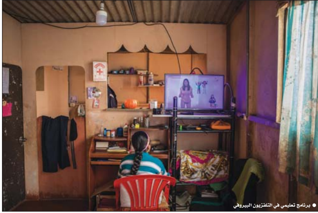
• برنامج تعليمي في التلفزيون البروفسي