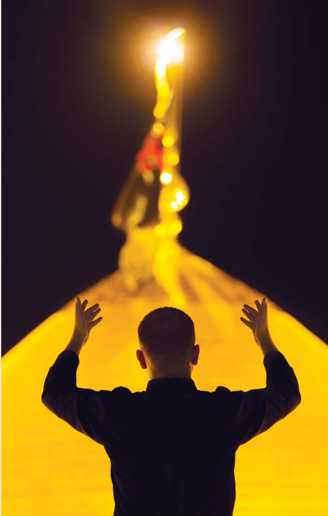
موقع العتبة الحسينية