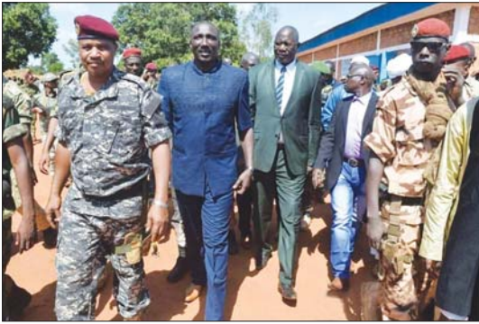
• الجنرال داراسا بالذني الأزرق اللون، برافق رئيس جمهورية أفريقيا الوسطى في زيارة حصلت مؤخرًا

بعد فترة قصيرة جداً من توقيع اتفاقية سلام خلال العام الماضي، أصدرت جمهورية أفريقيا الوسطى مرسوماً رئاسياً، أدرجت فيه أسماء 14 زعيماً للمجاميع مسلحة تقترض سيطرتها على غالبية أجزاء البلاد، والتي تصل مساحتها إلى ما يقارب مساحة ولاية تكساس، وعيّنهم حكوميين.