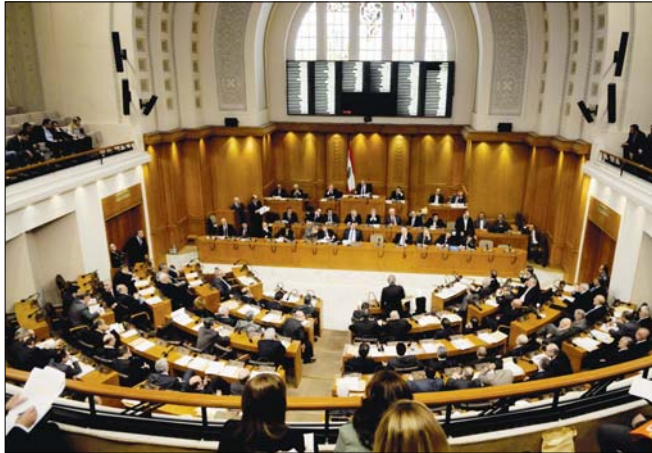
● مجلس النواب اللبناني

المستقل حسان دياب عبر الاستعانة بوزراء (إختصاص) على أن يتم تأمين غطاء دولي من خلال المطلة الفرنسية، مرجحاً أن "وزارة المالية ستبقى في حوزة المكون الشيعي، وبالتالي فإن النقاش قد يستمحو على طبيعة الشخص الذي يتولى الوزارة وليس خلفيته الحزبية والمذهبية". في حين أشار النائب جميل السيد، في تصريح له إلى طبيعة تشكيل الحكومة بقوله: "إن معظم القوى تريد الاحتفاظ بمواقعها ويقدمون له أسماء، الضياغ تلبس ثوب الخراف".