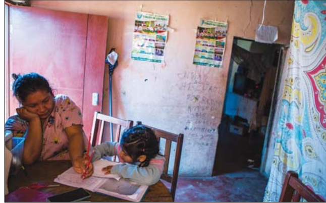
• أم تعلم ابنتها في ليما عاصمة بيرو

توظيفهم. صممت بعض المناطق وسائل تساعد المدرسين على مراقبة تقدم الطلبة من أجل علاج أكبر عائق في التعليم التلفازي، وهو نقص التفاعل والاستجابة الفورية من المعلمين، ويعتمد كثير منهم على الهواتف الأكثر شيوعاً بين دول العالم الفقيرة بدلاً من اتصالات البرويدات. لقد تعرضت بيرو، التي تزيد عدد سكانها على 32 مليون نسمة، إلى واحدة من أسوأ موجات الوباء، وأكثر من 500 ألف إصابة و25 ألف وفاة، ويملك 15 بالمئة فقط من طلبة المدارس أجهزة كمبيوتر في منازلهم، لذلك أصبحت الدروس التلفازية أسهل سيطرة خلال الوباء، وبدأ تطبيق التعليم التلفزيوني هناك خلال السبعينيات، لكن البرامج لا تلبس خلال الأزمات الاقتصادية والسياسية في الثمانينيات، أو تحت الحكومة من هذا الجبال لصالح القطاع الخاص، وجمع بين برامج عدة مستفاداً من تكسيك والاحتجتن عند بداية الوباء، ومن ثم أسست نظامها التعليمي التلفازي الخاص بها وودت الحكومة بقاء هذا الأسلوب حتى بعد القضاء على الفيروس.