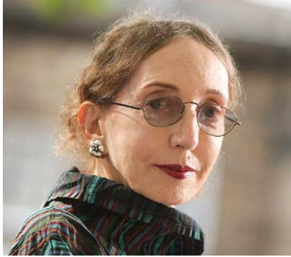
● جويس كاروف أوتس، نكس شخص قصة واحدة على جيمس أوتس

عند بناء القوارب، نحاول صناعة شيء بمقدرته حملنا عالميا، مركب متين قادر على تحمل الأوزان والأتزان، والصمود أمام الأمواج، يفيض القوارب أكثر جمالا من غيرها، ويضئها يوذى الوظيفة لا أكثر، عندما تكون في مازق وتحتاج إلى عبور أي نوع من البحار الداخلية، ستعمل بكل جهدهم كل ما تصطره للعمل معه، فهو مهم أن تكتب خلافا لطبيعة الأمور، أن تمارس الجنس أو تسقط، أو تمزق صفحاتك، أو تعيد تنظيم صفوفك، أو تستمر في العلم في العذاب، الكتابة مؤلمة.