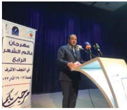
● مشاركة مئة شاعر من العراق