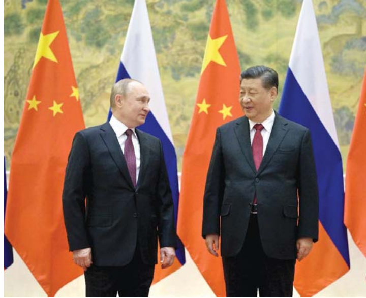
● الرئيسان الصيني والروسي أكدوا أنه لن تكون بينهما "مجالات تعاون محظورة".

في يوم الجمعة الماضي تحدث الرئيس "جو بايدن" هاتفياً مع الزعيم الصيني "شي جنينغ" لمدة ٢٠ دقيقة الساعة. في لقائهما مع الصحفيين قبل ذلك بيوم وصفت السكرتيرة الصحفية للبيت الأبيض "جين ساكي" المكلمة الهاتفية بين الرئيسين بأنها ستكون فرصة أمام بايدن لتقييم حقيقة موقف شي بشأن الغزو الروسي لأوكرانيا. أشارت ساكي إلى أن غياب الشجب الصيني لما تمارسه روسيا كان مثيراً وتوتراً قلق عميقين لدى واشنطن من احتمال اصطافا يمكن مع موسكو. أضافت ساكي: "مجرد امتناع الصين عن شجب ممارسات روسيا ينم عن معان كثيرة تملأ مجلدات. والأمير لا يقتصر على روسيا أو أوكرانيا فقط بل يشمل كل مكان في العالم".