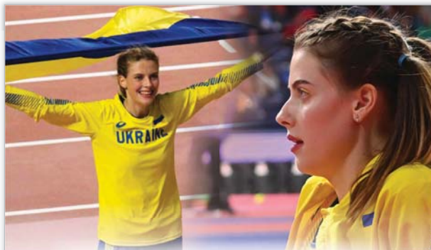
● جعلت الحرب التي تخوضها روسيا ضد كيبيف، شابة أوكرانية تتحدى نفسها قبل كل الأبطال لرفع علم بلدها، ونجحت بالفعل في منح أوكرانيا ذهبية الوثب العالي في بطولة العالم لألعاب القوى، على وقع دوي المدافع وطلقات النار وصوت القنابل التي تضرب في أراضي بلادها.

وتختمت سوريا الدور الحاسم ضد العراق في دبي في 29 لشهر الحالي. ويحتل المنتخب السوري المركز السادس الأخير في المجموعة برصيد نقطتين مقابل 22 نقطة لإيران المتصدرة التي حسمت تأهلها إلى النهائيات بصحة كوريا الجنوبية الثانية (20)، بينما لا زالت منتخبات الإمارات (9)، لبنان (6) والعراق (5) تتنافس على المركز الثالث المؤهل لخوض ملحق مع تلك المجموعة ثالثاً، على أن يلعب الفائز بينهما ملحقاً دولياً مع منتخب من أمريكا الجنوبية.