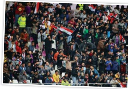
عد مختصون كرويون أن مباراة زامبيا بمثابة رسالة إلى الاتحادين الآسيوي والدولي من أجل إعادة النظر بقرار نقل مباراة منتخبنا الوطني أمام الإمارات ضمن التصفيات الآسيوية خارج العراق. كما أنها كانت بروفة تحضيرية للاعبين قبل الاختبار الحاسم في التصفيات القارية.