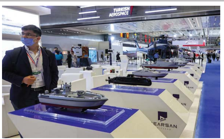
تُظَمّت القوات المسلحة القطرية، أمس الاثنين، النسخة السابعة من معرض ومؤتمر الدولية للدفاع البحري، ديمدكس 2022، الذي يستمر ثلاثة أيام في مركز قطر الوطني للمؤتمرات.