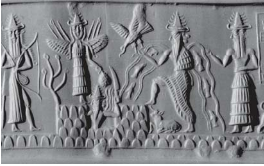
● ثنائية العلاقة بين الأب والام السومرية. حوت فلون إلى بلد الحضارة

إذا استعدنا الأصول المبكرة لجالي الذكورة والأوثونة فإننا لن نستغرب من ازدواجية الرمز الخاص المشترك، وحياته على شثانية الذكر والمؤنث في آن، وأكثر الأمثلة على ذلك هو السارية، التوراتية، المرأة تمكنت من الطبيعة بمرحلة بدئية ونجحت في إجراء تحولات كبرى عليها. كما حققت سيادة كلية بالخصوبة وهي تعلمت منها - الأرض - العطاء والتلح، بعد أن رأت السماء تنزل ماءها وتغور الأرض، حصل ما هو فريد، وتعرفت على النزول/ الاختراق/ الاتصال ويعد الأنياب وبروز الخصوبة.