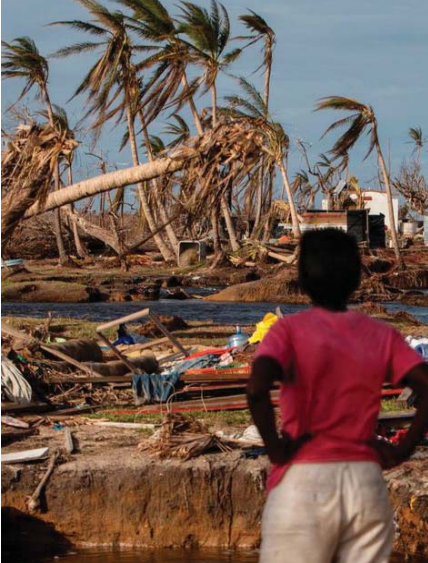
● تغير المناخ أثر في مورد رزق الكثير من السكان

وتكررت الحالة مع نيجيريا، حيث الجفاف المتزايد يسبب تغير المناخ الذي يسلب المزارعين مصدر عيشهم، فوجدت مجموعة بوكو حرام الإرهابية أرضا خصبة للتجنيد. وحصل ذلك في أكبر بلد أفريقي بعدد السكان حيث إن التزام التنامي