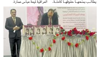
● أول نسخة للديوان مهداة مكتبة دار