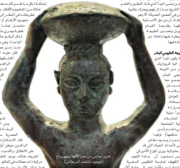
إفريز نحاسي من معبد الآلهة نينهورساج (موجود بالمتحف البريطاني)

ومعنى لأحداث الحياة التي قد تبدو عشوائية، ويرى المؤرخ الأمريكي لويس مسمورد أن. عسادة اللجوء إلى الكهوف لممارسة الطقوس السحرية الجماعية تبدو وكأنها تعود إلى حقبة أكثر