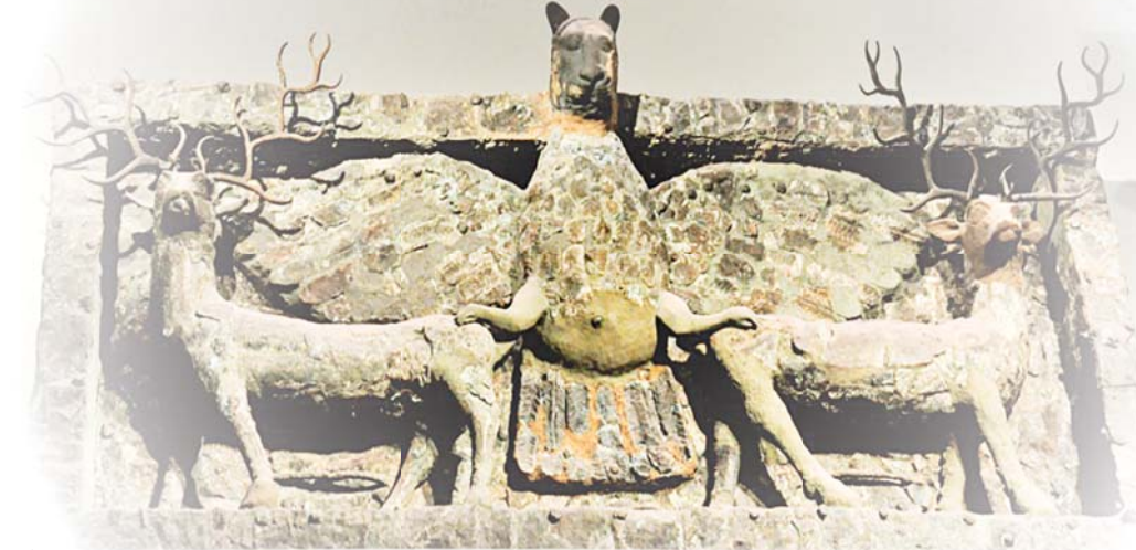
واجهة معبد إينانا في أوروك