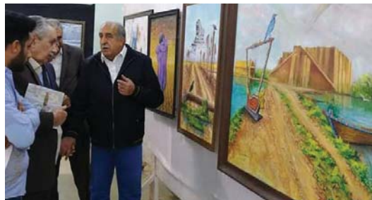
● معرض الفنون في كربلاء