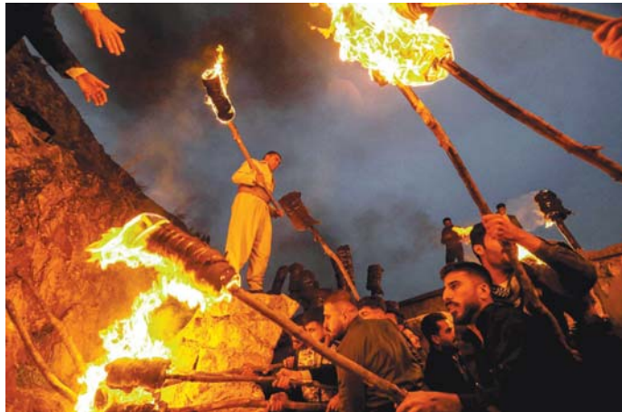
● مواطنون في مدينة عقرة بأربيل يحملون مشاعل مضاءة خلال احتفالات نوروز ..

وهذا رئيس مجلس الوزراء مصطفى الكاظمي، كل العراقيين بكل أطيافهم ولاسيما شعبنا الكردي بهذه المناسبة، داعياً إلى جعل هذه المناسبة العزيزة على قلوب العراقيين فرصة لإصلاح قيم الحبة والتنافس، والتأكيد على تعزيز الأمن،