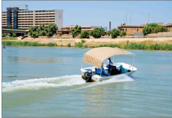
مرسى المتحبي عند نهر دجلة