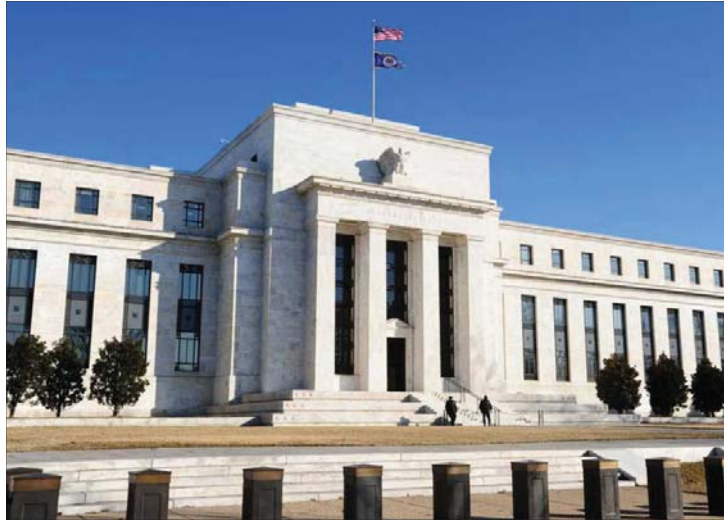
واشنطن/ نافع الناجي

وفي الوقت نفسه، يمكن للبنوك المركزية بث رسائل مطمئنة في الأسواق المالية التي تعاني خصوصاً بإعادة الاستعداد لسلسلة نقدية أكثر تسييراً وتوفير السيولة للبنوك إذا دعت الحاجة.