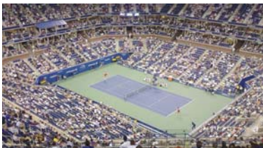
لوس أنجلوس / أ ف ب

باتت دورة انديان ويلز في كرة المضرب الضحية البارزة الأولى في الولايات المتحدة لتفشي فيروس كورونا المستجد، مع إعلان إغلاقها من قبل المسؤولين على خلفية المخاوف الصحية التي انعكست سلباً على الأحداث الرياضية حول العالم. وقال مدير دورة انديان ويلز اللاعب الأثلي الساسيق طوماس هاس في بيان محدد سابقاً بحضور الجماهير على الرغم من دعوات وزير الصحة الألماني ينز سياهن إلى الإياب "جميع الأحداث التي تشمل أكثر من 1000 شخص، حتى إشعار آخر". وأكد لايبزيغ أنه "على اتصال وثيق وبالسبلات الصحية ومع استمرار الأمور في