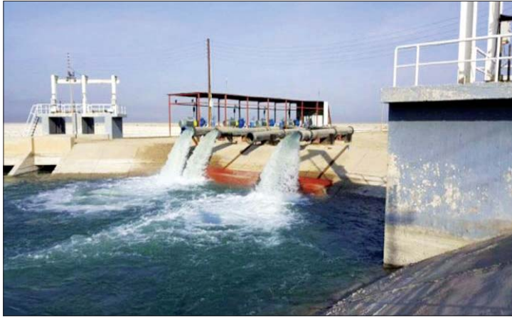
مشروع ماء البصرة الكبير

استأنفت وزارة الأعمار والاسكان والبلديات، العمل بأكثر من ثلاثين مشروعاً شهدت تكلّواً في المدة الماضية لأسباب متنوعة، بينما أعلنت ان مشروع ماء البصرة الكبير بلغ مراحل انجاز متقدمة تجاوزت نسبة 95.1 بالمئة.