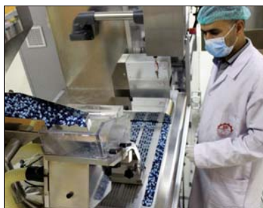
معمل ادوية سامراء

ان طريقة التسويق الحديثة ستساعد على تنامي الشعور الكبير بدعم المنتج الوطني وثقة المواطن بالأدوية التي تطرحها الشركة ووجودها مع توفرها بالكمية المناسبة وفق ما يحتاج اليه المواطن. وأكد ان الادوية التي تنتجها الشركة آمنة وموثوقة وتعرض مبدأ الامن الدوائي وبسعر مناسب. لافتاً الى سعر الشركة لاخذ حصتها في السوق المحلي من خلال عمليات التسويق مع وجود خطط مستقبلية للتصدير بعد اعادة بناء البنية التحتية وفق قواعد التصنيع الدولي الجيد (GMP)، ان ذي الشركة مشروعاً ضخماً لإنشاء بنيايات جديدة وتغيير البنية الانتاجية بالكامل. بدوره قالت مديرة عالية وعلاجية وتبلي الكثير من احتياجات المواطنين من الادوية التقليدية والزمنة، وذكر