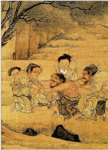
● العلاج في الصين القديمة

دعونا نتحدث عن الأسباب الثقافية لهذا الوباء. مرض الفايروس التاجي الجديد أضجى له اسم الآن: COVID-19. وهذا قد استغرق بعض الوقت. تبعت سلسلة جينوم الفايروس في غضون أسبوعين أو نحو ذلك من ظهوره، لكننا لعدة أسابيع لم تكن تعرف ما الذي سنسميه، أو المرض الذي يسببه. لفترة من الوقت، في بعض الأحيان، كان المرض يُمضي باسم "التهاب ووهان الرئوي"، نسبة لمدينة "ووهان" في وسط الصين، حيث تم اكتشاف أولى الإصابات البشرية. لكن التوجيهات الصادرة عن منظمة الصحة العالمية، التي عمدته باسم COVID-19 مؤخرا، أضيفت تسمية الأمراض تبعاً للأماكن والأشخاص، وذلك من بين أمور أخرى، لتجنب الآثار السلبية غير المقصودة من خلال وصف مجتمعات معينة".