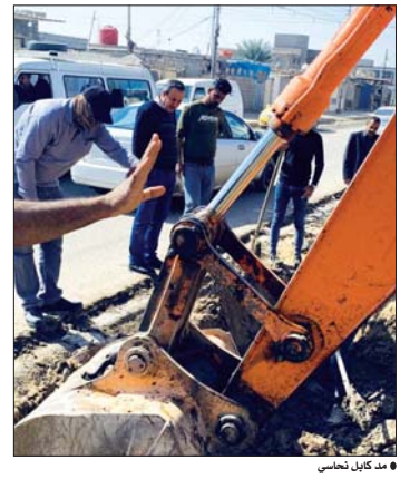
عمل كابل نحاسي