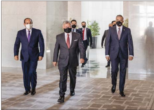
● قمة ثلاثية سابقة...