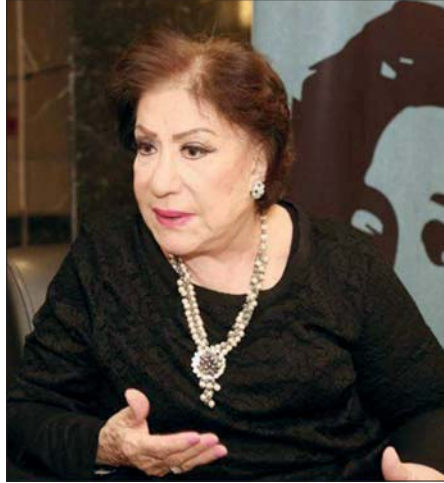
● الشاعلة المسرحية الشهيرة سميحة أيوب