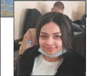
• الحاذية بيستان جمال

انها مفرسة حكومية ويجب ان تتولى هي شأن ذلك.