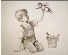
● لوحة لبانكسي