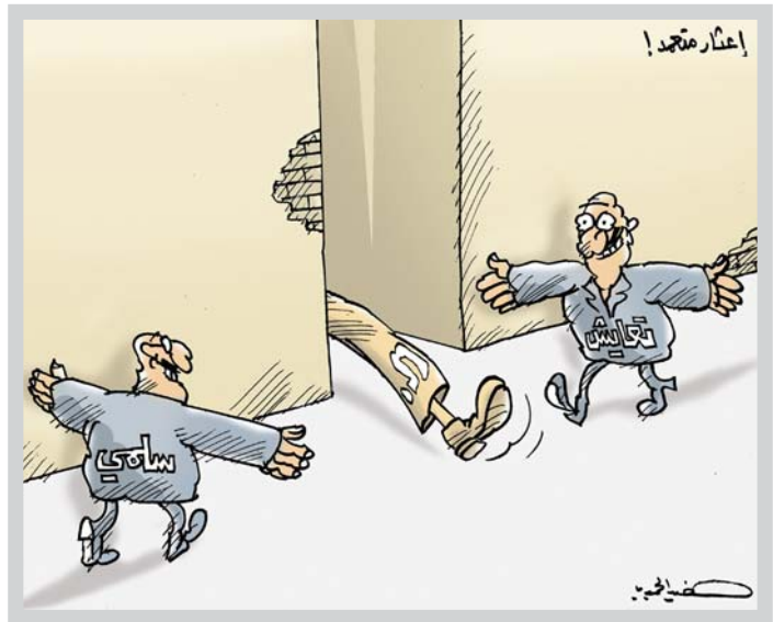
• كاريكاتير: خضير الحميري

التحوش العاشمي وما يندي له جبين الانسانية من عمليات استرقاق واستعداد وانصتباب وتدعو على الاعراض ونقل على البوية واكبر عملية تطهير عرفي شهده التاريخ الحديث. بعد ذلك الاصمار التكفيري الاقتصادي الاصح لزماء على العالم اجمع ان يعيد حساباته ويراجع نفسه ويرجع الى جادة الصواب ويعيش انسانيته المقبولة المبينة على مبادئ التسامح وضرورية تقبل الآخر المختلف ونبذ الكراهية والتوحش في التعامل مع الآخر المختلف واجتثاله او تصفيته لجرد الاختلاف، وما المظاهر الوحشية التي حدثت ايان الغزو الداعشي ال امصاديق عملية على انعدام ثقافة التسامح وتقبل الآخر