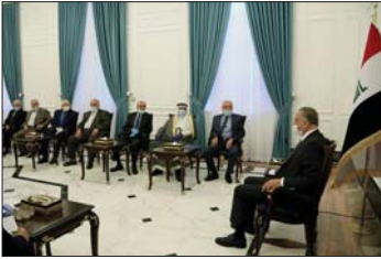
● لقاء الكاظمي بوجهاء مدينة الأعظمية