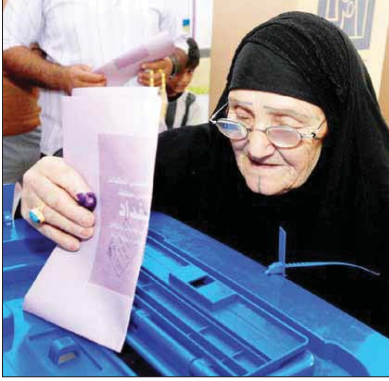
● انتخابات سابقة: ارنيد

وتابع فيصل انه لا يمكن ان تساهد الولايات المتحدة في تفعيل البرامج الاقتصادية التي تتعلق بالزراعة لان العراق بلد زراعي عملاق عبر التاريخ ومنتهج الثورة.