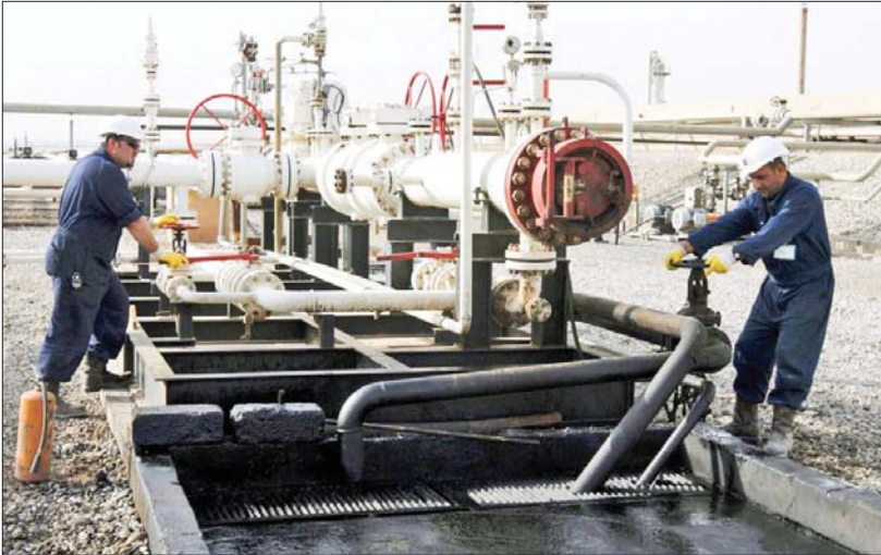
بغداد / الصباح

المشروع بـ 25 بائنة ويحصل على 75 بائنة من القطاع العام.