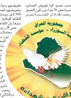
العراق يكرم شهداءه

تعديلات بموجب قانون رقم 2 لسنة 2020، لافتاً الى ان داتره وبالتالي يتسبب على هيئة الوظيفة القطاع العامة تعكف على اعداد تعليمات تنفيذ، ونوه بان الكثير من الاجراءات يتوجب ان تراق عماد التعليمات، منها تشكيل لجنة تخصصية منهم، بين المؤسسة ومجلس القضاء الاعلى، والتي تحال اليها