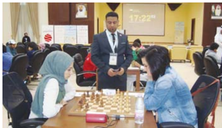
بغداد/ ذيبيل الزبيدي