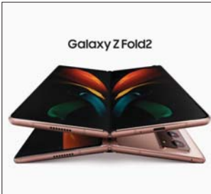
سان فرانسيسكو / أ ف ب

تسعى سامسونغ إلى استعادة صدارة سوق الهواتف الذكية مع طرازات جديدة فاخرة بينها أجهزة قابلة للطي، ولكنها موزعة في منافسة في هذا الجزء من السوق التي قد يصبح ذا أهمية كبيرة. صعدبيعات العالمية في الربع الثاني من 2020، ورغم التنوع الكبير في منتجاتها. بدأت المجموعة الكورية الجنوبية المعلقة تفقد بعضاً من وجهها في الأسواق خلال الأشهر الأخيرة. وقدمت سامسونغ في حفل افتراضي بسبب تدابير مكافحة وباء كوفيد-19 جهاز "غالاكسي زي فولد 2" وهو هاتف قابل للطي أشبه بجهاز لوحى صغير لدى فحده. ويختلف الجهاز الجديد هاتف الجيل الثاني "غالاكسي فولد 2" الذي أطلق مطلع 2019 وتعرض لانكسارها في اللوحة من قبل مايكروسوفت المزودة أيضاً أفلاماً الكرتونية. وتتمتع سامسونغ بنقطة قوة بمعالجة ماسبياسيا في مجال الجيل الخامس إن إن إس إن ويقول الخلل في "تكميشتش" التقنية الجديدة قد تشلّون القابلة للطي من المجموعة.