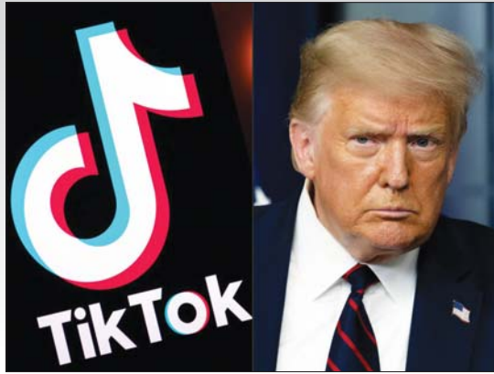
واشنطن / أ ف ب

عزز دونالد ترامب الضغوط على منصتي «تيك توك» و«وي تشات» الشهيرتين مع اتخاذ قرارات جذرية من المرجح أن تؤدي إلى تصادم التوتّر مع الصين. ووقع الرئيس الأميركي مرسوماً يحدد مهلة 45 يوماً لوقف التعامل مع «بايتدانس» الشركة الصينية الامنصة «تيك توك».