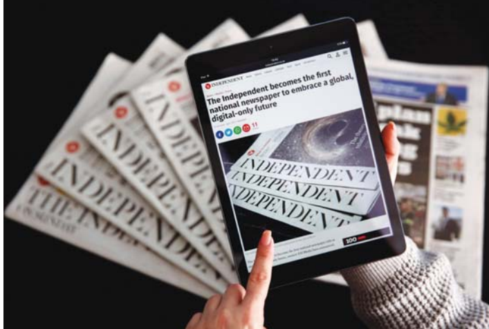
الصحف الورقية تواجه تحديات كبيرة في ظل التحول الرقمي.

● مستقبل وفاند معهد رويترز في تقريره للعام 2020 أن الأزمة سؤعت بشكل شبه أكيد الانتقال إلى مستقبل رقمي بالكامل، وأصابها من الصعاب قطعاً يعاني بالأساس من تراجع المبيعات وعائدات الإعلانات، وهذا صدرا التحلل الرئسيان له، وتحدثت بعض الصحف الكبرى في البرازيل والمكسيك بصور مؤقته عن إصدار نسخ ورقية مؤقته الصدور الكترونياً، وخفضت عدد إصداراتها. وفي الفلبين اضطرت عشر صحف من أصل السبعين الأعضاء في معهد الصحافة إلى الإغلاق بسبب الوباء، وقال المدير التنفيذي لمعهد الصحافة ريال سيبيلينو لوكالة فرانس برس «الأوقات صعبة، ليس هناك إعلانات ولا أحد يقرأنا». والأكثر تضرراً في هذا البلد هي الصحف الصغيرة التي انهارت مبيعاتها في الشارع مع تأثير عزل وجيل سيبيلينو، «القطع محاصر، فمعنا نغاني». وبعكس الانحسار التدريجي للصحافة المطبوعة في كل أنحاء العالم على كامل سلسلة الإنتاج، من الصحفيين إلي باعة الصحف مروراً بمنتجي الورق والمطابع والموزعين، ففي بريطانيا زاد عدد قراء وسائل الإعلام الكبرى على الإنترنت بمقدار 6.6 مليون متصفح في الفصل الأول من السنة، وهو رقم قياسي بحسب تقاربه اليه. لكن معظم الصحف لم تحقق عائدات تساوي عائدات النسخ المطبوعة.