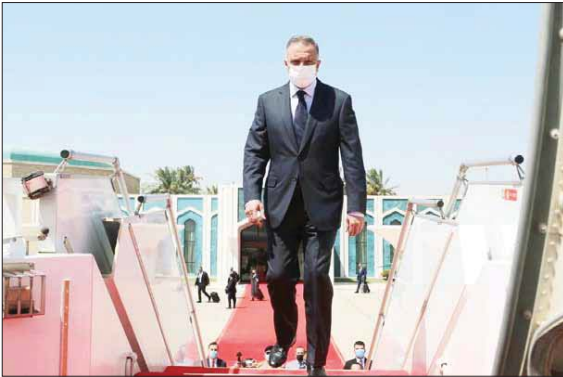
● قرب سياسي واسع لنتائج زيارة الكاظمي إلى واشنطن

بغداد / الصباح / عمر عبد اللطيف مهتد عبد الوهاب / شيما رشيد