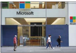
نيويورك / وكالات

تجري شركة مايكروسوفت بعض التغييرات المهمة على البريقة التي تدير بها نظامها التشغيلي ويندوز، ما يشير إلى تركيز متجدد على النظام التشغيلي ألبس صنه اسمها. وعندت عملاقة البرمجيات بايوس باي رئيس أجهزة (Surface)، مسؤولاً عن ويندوز وقت سابق من هذا العام، ويتم الآن إعادة ترتيب أجزاء من هذا الفريق. ويأتي ذلك في أعقاب قرار مايكروسوفت بتقسيم ويندوز إلى جزئين منذ أكثر من عامين بعد رحيل رئيس ويندوز السابق تيري مارتسون. وقامت مايكروسوفت بتطوير أساسيات ويندوز إلى فريقها الذكاء الاصطناعي والحسابة، وأصبحت مجموعة جديدة للعمل على تجارب ويندوز 10، مثل التطبيقات وقائمة أبدأ والبراز الجديدة. وتنقل عملاقة البرمجيات الآن أجزاء من تطوير أساسيات ويندوز مرة أخرى إلى فريق بايوس باي، ويعني هذا أن أساسيات ويندوز وفريق تجربة الملمود قد عادت إلى ما يطلق عليه تقليدياً اسم فريق ويندوز. ويشكل هذا الأمر اعترافاً بأن التقسيم لم يعمل تماماً كما هو مخطط له، وظهرت الكثير من الأدلة على ذلك من خلال تجربة التطوير الفوضوية لنظام التشغيل ويندوز 10، وتأخير تحديثات ويندوز، ونقص الميزات الجديدة الرئيسية، والكثير من مشكلات تحديث ويندوز. وحصل موقع (Thurrott) على مذكرة داخلية من بايوس باي تتناول بالتفصيل التغييرات. وفي حين أن بعض الأجزاء الأساسية من ويندوز، خاصة الجانب الهندسي، ستبقى مع قسم الذكاء الاصطناعي والحسابة، فإن التعديل الذي أجرته مايكروسوفت يركز على تبسيط ويندوز لشحنه وتحديثه بشكل متوق. وتعمل التغييرات أيضاً على موازنة عمل تطبيق (Project Reun - ion) من مايكروسوفت، ما يجعل تطبيقات (Win32) و (UWP) أقرب معاً، مع فريق ويندوز.