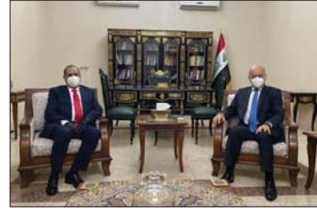
● رئيس الجمهورية يستقبل وزير النقل