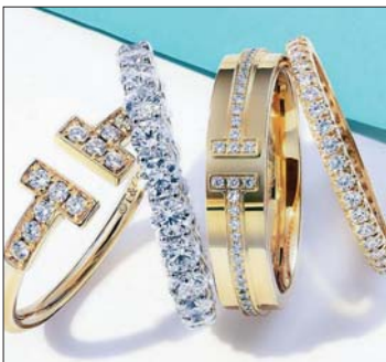
● ذهب مرصع بالألماس

وقدمت شركة «ألماس» في أفريقيا، وبلغت من دون الإفراج عن الأرقام، نقل من القيمة الحقيقية للنفقات.