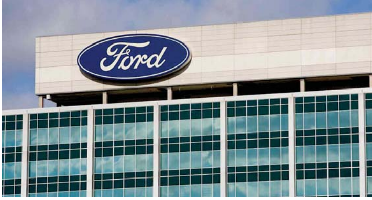
● المقر الرئيس لفورد

بالرغم من التحديات الاقتصادية التي تصافقها بسبب وباء كورونا، وضرورة المحافظة على الالتزام بالوظائف الجديدة وخطط الاستثمار، شرعت شركة «فورد موتورز» عملاق صناعة السيارات الأميركية، بخطة ضخمة لهيكلة تبلغ قيمتها أكثر من 11 مليار دولار، تتضمن غلق بعض مصانعها غير الهامة وإيقاف إنتاج بعض سيارات السيدان الصغيرة (فوكس، فيستا، توريوس وقد تلحقها فيوجن قريباً).