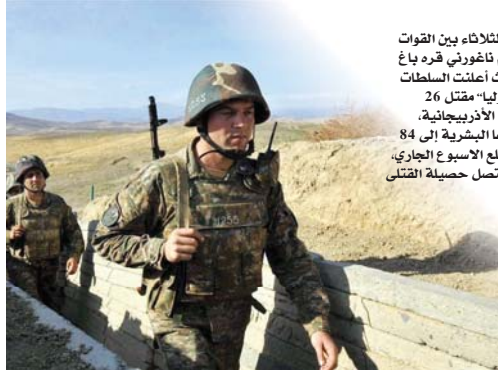
● معارك ناغورني قره باغ

أسفرت المعارك المتعددة أمس الثلاثاء بين القوات الأذربيجانية والأرمن في إقليم ناغورني قره باغ عن سقوط عشرات القتلى، حيث أعلنت السلطات في الإقليم «غير المعترف به دولياً» مقتل 26 عسكرياً في المعارك ضد القوات الأذربيجانية، وترتفع بذلك حصيلة خسائرها البشرية إلى 84 قتيلاً منذ اندلاع المواجهات مطلع الأسبوع الجاري، كما قتل 11 مدنياً في البلدين لتصل حصيلة القتلى إلى 95 قتيلاً.