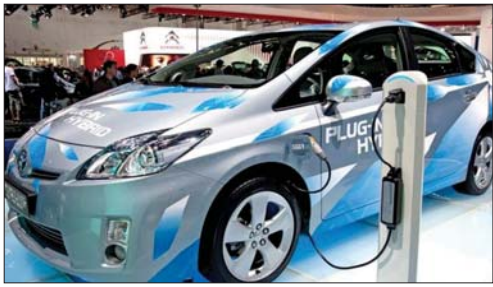
● سيارة كهربائية