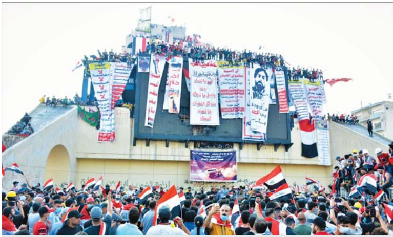
تظاهرات ساحة التحرير