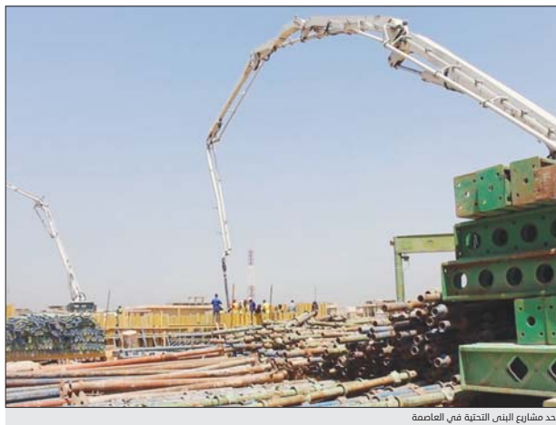
اخذ مشاريع البنية التحتية في الغامقة

يعتزم مجلس محافظة بغداد رفع كتاب رسمي الى مجلس النواب لإيجاد آلية لتجان معاملات المواطنين والمهام الخدمية التي تنفذها المجالس البلدية والمحلية والجهات الخدمية المرتبطة بالمجالس تنفيذياً لقرار البرلمان بحل مجالس المحافظات. وأعاد رئيس لجنة شؤون المجالس احمد المالكى بتصريح خاص لـ«الصباح» بان مجلس النواب وضمن حزمة الاصلاحات الحكومية التي اطلقها، فقد اتخذ قراراً بحل مجالس المحافظات لحين اغاؤها رسمياً بعد مساندة اللجنة القانونية في البرلمان على ذلك. وأرشد ان المجالس البلدية والمحلية كافة ترتبط بمجالس المحافظات وهي جهات خدمية يعتمد عليها باجان الكثير من الخدمات، ما يستلزم إيجاد بديل قبل حلها كونها مسؤولة عن الكثير من الجالات الخدمية مثل كتب التصديق