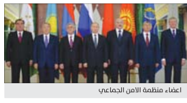
اعضاء منظمة الأمن الجماعي

لكن مصر تخشى أن يؤثر المشروع سلبا في تدفق مياه النيل التي يؤمن نحو 98 في المائة من الإمدادات المائية لمصر. والتجسيس الذي الرئيس المصري رئيس الوزراء الإثيوبي أبي أحمد على هامش قمة روسيا إفريقية التي عقدت في مدينة سوتشي، ويحا مشروع السد.