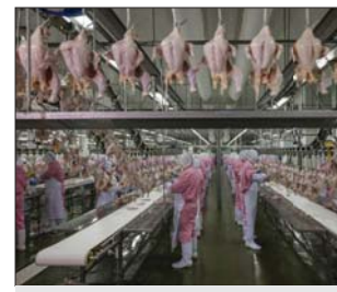
مئنته الدواجن في البرازيل