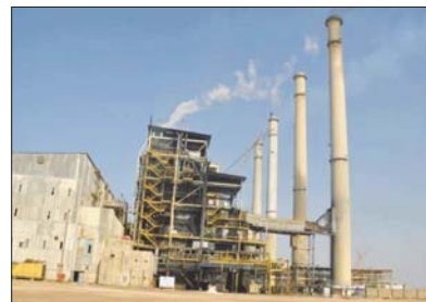
الاطلاق درجات وظيفية بقطاع الكهرباء

وطرحها بشكل موضوعي سواء اثناء التظاهرات التي كانت سلمية ومعبرة من دون ان تشوبها اي إشكاليات او من خلال طرح تلك المطالب أمام الحكومة المحلية من قبل ممثلي المتظاهرين. وفي واسط ايضا قال مدير عام توزيع الكهرباء "الصباح" ان المحافظة كاتيف السامواري لـ"الصباح" ان المديرية بدأت استقبال طلبات التقديم على 750 وظيفة وظيفية جديدة ونصف اجابي اسعد الشواغر ضمن حركة الاطلاق والحذف والاستحداث، مشيراً الى ان مدة التقديم تستمر لغاية العاشر من تشرين الثاني المقبل. واطار الى تشكيل لجنة لاستقبال طلبات الراغبين بالتعيين واجراء المقابلة معهم بعد اجراء القرعة العلنية لاختيار العدد المطلوب وقائمة بصفة احتياطية، منها بيان آلية التعيين حددت الاولوية في توزيع الدرجات الوظيفية لموظفي عقود تنمية الاقاليم واصحاب العقود المجانية من تطبيق عليهم الشروط وحضور جلسة الكهراء، على ان يتراوح عمر المتقدم لاشغال الوظيفة بين 18 ولغاية 35 عاماً. وبين السامواري ان المديرية ستقوم بتوزيع المعينين الجدد من مديرية توزيع كهراء بالمحافظة وجميع الاقسام والادوات التابعة لها في الاضية والنواحي بحسب الاحتياج الفعلي، منها على ان المحافظة استحصلت موافقة وزارة المالية لتعيين هذا العدد من الشباب.