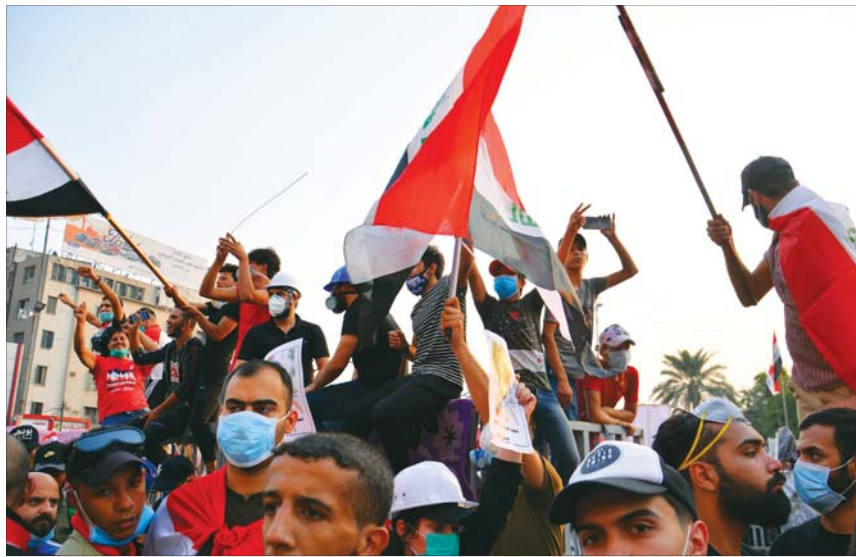
تظاهرات ساحة التحرير

رجح مصدر لـ «الصباح» تخصيص جلسة اليوم الخميس لاقبول استقالة الحكومة، مبيّناً أن مفاوضات تجري بهذا الشأن بين «الفتح» وسائرون، وبينما أبدى رئيس تحالف الفتح هادي العماري استعداداً للتعاون مع زعيم التيار الصدري السيد مقتدى الصدر من «أجل تحقيق مصالح الشعب العراقي وبقاء البلاد بما تقتضيه المصلحة العامة»، أكد الصدر، أن عدم استقالة رئيس الوزراء عادل عبد المهدي، «إن يحقن الدماء» يأتي ذلك في وقت كشف فيه تحالف سائرون عن بدء حوارات جادة وشاملة للكتل السياسية مع البرلمان للبحث في إنهاء عمل الحكومة وتشكيل أخرى، في حين دعا تحالف الفتح إلى عقد اجتماع طارئاً بحضور زعيم التيار الصدري السيد مقتدى الصدر ورئيس تحالف الفتح هادي العماري والرئاسات الثلاث لمناقشة الأوضاع الراهن.