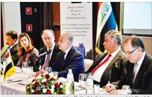
الحكيم طاب اجتمعه مع عدد من سفراء الدول الاعراب والأوروبة لدى هولندا

التي وقعت في جانب العراق في مواجهة عصابات داعش الإرهابية، وإعادة إعمار المناطق الحرة، مؤكداً أن "استقرار العراق ركيزة أساسية لاستقرار المنطقة"، وتابع: "بحث في زيارته إلى ملكة هولندا الامانة والخبرات الامانة الهولندية في هذه القطاعات، واستثمارها لبناء القدرات العراقية".