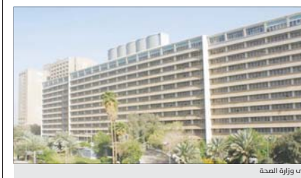
مبنى وزارة الصحة

مشيرا إلى أنه اجتمع بمسؤولي مركز الوزارة، بغية مناقشة أولويات العمل في القطاعين الصحي والبيئي، وأكد، علاوي خلال البيان على المتابعة اليومية والجادة لكل التفاصيل التي من شأنها تحسين الواقع الصحي والبيئي في البلاد، وضمان تقديم أفضل الخدمات لجميع المواطنين.