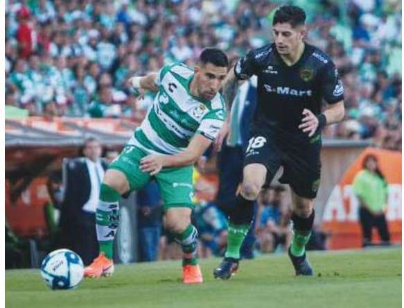
بفارق الأمداد فقط أمام تخوانا وأطلس جوادالاهارا.

المباريات وبسبب التواجد اليومي مع اصيحا أكثر تنامغا، وابت صعوبة تعلم اللغة الصينية، واستخدام لغة الإنكليزية بشكل مستمر، ومتمكر في الصين، إلى إنشاء قطاع نشط للغاية من مترجمي كرة القدم - معظمهم من الرجال في العشرينيات من عمرهم. الترجم «الزوجتي» واعترف هونغ بأنه يضبط أحيانا كلمات ستوكوفيتش عندما يرفع صوته أكثر من اللازم، «في مثل هذه الحالة لا أترجم أشد التعبيرات، ولا أفقد ألقى الزيت على النار، لكنني أقتل رسالة المدرب إلى الفريق بطريقة أخرى». ما يعني أنه في بعض الأحيان، لا يقوم المترجمون بنقل الكلمات الغامضة للمدربين حرفيا، خلال المؤتمرات الصحفية، خاصة تلك التي تستهدف الحكام، والهدف من ذلك هو تجنب فرض عقوبات من الاتحاد الصيني المعروف بصراوته. لأختصار، هم بمثابة «الذات المراسلة» لنادي إن إسباني سيبرج اللغاة السابق لفريق برشلونة الإسباني (1993-2002) الذي