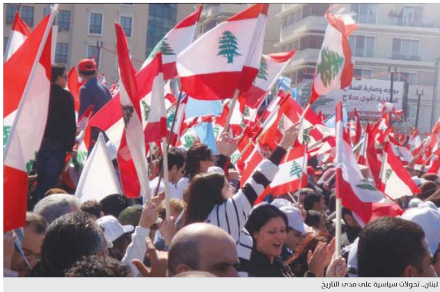
لبنان: تظاهرات سياسية على مدى التاريخ

استأفقت العاصمة اللبنانية أمس الأربعاء على هدوء حذر، غداة ليلة أمنية وسياسية عاصفة، سبقها استقالة رئيس الحكومة سعد الحريري، الذي وصل إلى «طريق مسدود»، وبينما بدأ المحتجون بفتح بعض الطرقات، أصدر الجيش اللبناني بيانا طلب فيه من جميع المتظاهرين «المبادرة إلى فتح ما تبقى من طرق مغلقة لإعادة الحياة إلى طبيعتها».