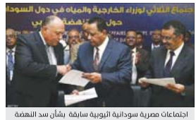
اجتماع مصرية سودانية النورية سابقه بشأن سد النهضة