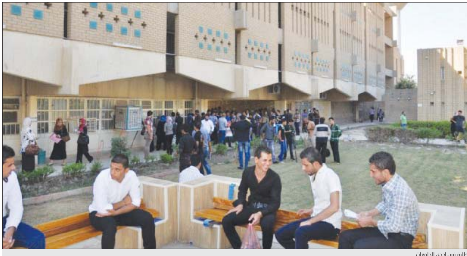
طلبة في إحدى الجامعات

وأوضح المصدر عن احقية الطلبة الرقعة فيوهم في كلية أهلية سابقا. التقديم مجددا على قسم القبول اللقبم الذي رفق قيده فيه على وفق استمارة القبول الإلكتروني، مؤكدا عدم السماح للكليات الأهلية بتسلم أي مبلغ من الاجور الدراسية أو التامينات من الطلبة قبل ظهور قبولهم في الكلية.