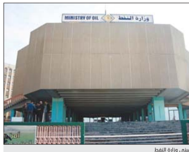
مبنى وزارة النفط

للحصول على شهادة البكالوريوس في الاختصاصات الهندسية والاقتصادية والقانونية مشهوراً الى ان ذلك يأتي من ضمن خطط الوزارة لتطوير ملاكاتها الوطنية. وقال مدير عام وثرة التدريب والتطوير على مدار ان برنامج بنادق المستقبل سيوفر 100 بعثة دراسية للحصول على شهادته البكالوريوس من الجامعات العالمية والاختصاصات الهندسية وبماكان الراغبين في المشاركة والذين تتوفر فيهم الشروط التي سيتم اعلانها في الموقع الرسمي للوزارة وسائل الاعلام مل، الاستمارة الخاصة بالتقديم، مشيراً الى ان الطلبة الذين يمكنهم التقديم هم من خريجي الدراسة الاعيادية الفرع العلمي (التطبيقي، والاحيائي) الحاصلين على معدل (95) بالمئة وايضاً للطلبة من خريجي الفرع الادبي بمعدل (85) بالمئة. يذكر ان الاختصاصات التي سيتم الدراسة فيها هي هندسة المشاريع، هندسة اقتصاديات الطاقة، علوم جيو فيزياء وهندسة كهرباء طاقة متجددة، ومحاسبة قانونية وقانون تجاري دولي (تحكيم) وهندسة البيئة (مرجبة) وعلم اقتصادية ومالية (تقييم اصول) وهندسة ميكاترونكس وهندسة الكيمياء، (معالجة الغاز).