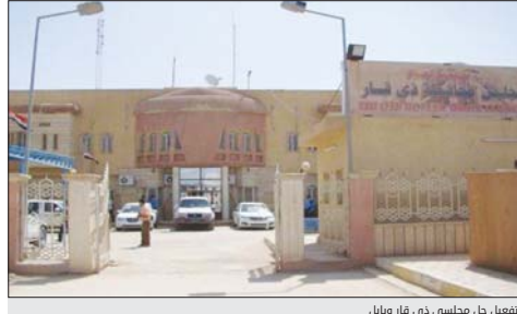
تصوير حل مجلسي ذي قار وبابل