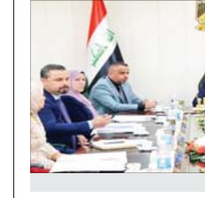
السوابي خلال اجتمعه مع الملك المقدم للوزارة

الحفاظ من أجل توفير البنى التحتية لمشروع الإرسنة الإلكترونية، مؤكداً ان "مكتبة الدوائر العدلية وانتقال عملها إلى الأسلوب الإلكتروني بدل الورقي سيقف نفقة نوعية في عمل الوزارة ليسمى المواطن ويحقق الخطوة الأساس لمشروع المحكمة الإلكترونية لعموم دوائر ومؤسسات الدولة".