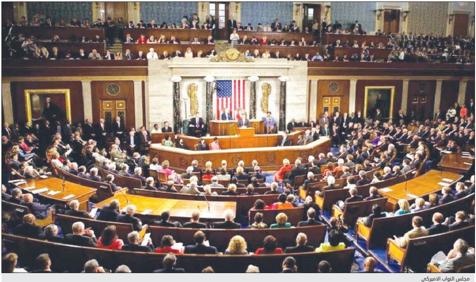
مجلس النواب الاميركي