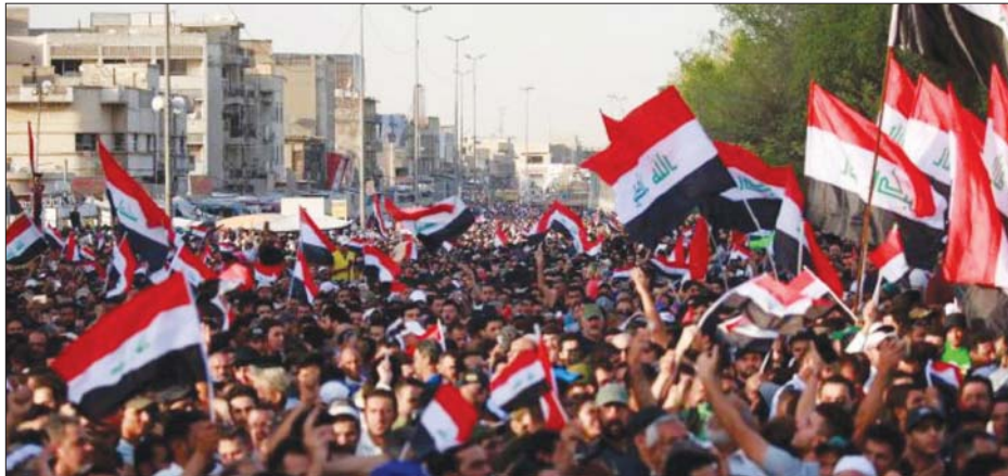
تظاهرات تبنها اعلام العراق

بجدارة، تصد العلم العراقي رمزية التظاهرات التي تشهدها بغداد وعدد من المحافظات، وتوجد تحت ظله المظالمون من مختلف مشاربهم والجهات الاينية بمختلف سماليها وعنايتها. وبحوي القاطبات والشوارع الباعة الجوالون يحلون الاعلام العراقية التي وجدت ايقالا على شرفها من قبل الشباب.