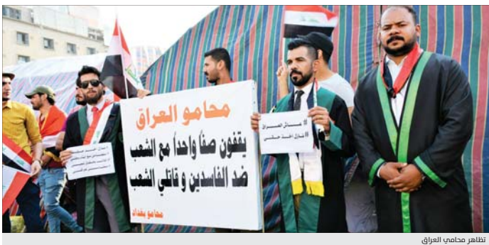
تظاهر محامو العراق

الكشاكش بعد استجوابها من وزارة العمل والشؤون الاجتماعية، وتوزيعها بين الشرايين المستهدفة، واعاد برنامج تأمين 150 ألفاً من العاملين عن العمل، وصرف منح بطونين لهم لمدة ثلاثة أشهر، وأضاف المتحدث باسم الأمانة العامة أن التوصيات نمت أيضاً على "إلغاء الشركات العاملة المتعددة مع وزارة النفط، وتمويل العاملين في العمل مع شركة نفط الجنوب، بتدريب ألف عامل عن العمل، فضلاً عن استئجار الأراضي للاستصلاح الزراعي، ذات النفع الوطني، لحين استئجارها من قبل وزارة النفط".