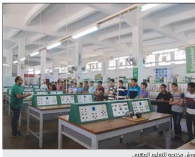
ورش مختصة للتعليم المهني

وضعت التوجهات الاستراتيجية لتطوير التعليم المهني، وتحديد مناهج التعليم المهني لدورها الفاعل بتشكيل الاكاديميات التي تخلق لدى الطالب المهني معلومات نظرية وعملية لرغد سوق العمل بالطاقات الفنية الواسعة. وأرشد ان اللجان الرئسية والفرعية تشكلت لاجل تحديث المناهج الدراسية للتعليم