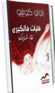
جسي - قدم يارولو

تبدأ السيرة بتحاور بين يارولو كويولو والمرشد (جي) الذي جاء إلى مدينة ريو دي جانيرو ليبرم عقداً لصالح الشركة التي يعمل فيها، بدأت معرفته هجرتي الأولى في استديام وكان يارولو وثاماً بصحة زوجته، كان في أحد المطاعم لم يكن في ذلك الوقت قد شاهدته من قبل وجهاً لوجه، فالتارت فيه الرجل الغربي والكنسي وجبهه بالشعوب، لماذا؟ لأنه سبق أن رأى جي في مانه منذ شهورين، وقام من مكانه ليتعرف عليه، كما أصبحا يلتقيان خلال فترات متباعدة، ويحضر يارولو جلسات جي التي كان يحضرها الرجال والنساء، وهذه المرة هو الذي جاء، إلى ريو دي جانيرو، ودار التحاور بينهما عن المرأة والسحر والحب، ويذكر يارولو بأنه كان يحب معلمه السحر، فيكرهه لكنه لم يستمر بحالاته، وفي هذا اللغز الذي جمعه بالمرشد