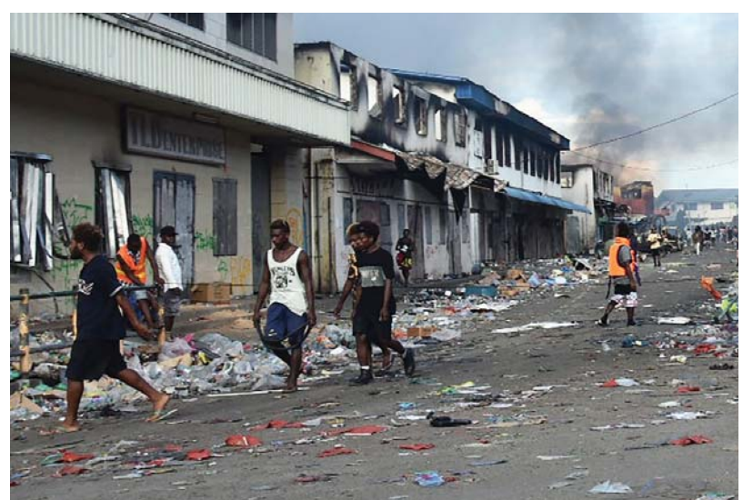
عبرت حكومة نيوزيلندا عن قلقها العميق من الاحتجاجات وأعمال الشغب المستمرة في عاصمة جزر سليمان، هونيارا، وقال شهود، إن الشرطة الأسترالية بدأت تسيطر على المدينة أمس الجمعة بعد احتجاجات عنيفة اجتاحت البلاد على مدى أيام، حيث أحرقت محال تجارية ومراكز شرطة ومدارس في العاصمة.

اتهم الممثل الدائم للمغرب لدى الأمم المتحدة عمر هلال الجزائر بالسعي للتصعيد ضد المملكة، في محاولة للتفهير من وضع اجتماعي واقتصادي خطير على أراضيها. وقال في مقابلة مع مجلة 'نيوزلوكس' الاميركية: إنه بدلاً من أن تترك أخطأها تحالول الجزائر بشدة لقاء اليوم على الغرب في كل مشكلاتها، لكن لحسن الحظ أن الشعب الجزائري لا يجاري هذه الحملة التشهيرية اليومية' وأضاف أنه رغم كل الاتهامات المباطلة وتصعيد الجزائر اختار المغرب موقفاً مسؤولاً ومسؤولاً، لأنه ليس بلداً يفضل الحرب فالمملكة المغربية بلد محب للسلام، 'مشياً إلى أن الملك محمد السادس' المد إلى الجزائر بدعوتها للعمل وسيدو شروط لإرساء علاقات ثنائية تقوم على الثقة والحوار وحسن الجوار، على حد قوله، وفي رده على إمكانية بدء حرب في المنطقة، قال هلال: 'أتمنى بصديق لا يحدث ذلك أبداً يذكر أن الجزائر تقدم الدعم والمساندة لجبهة 'البوليساريو' التي تتنازع مع المغرب على إقليم الصحراء منذ 1976، وتريد الجبهة الاستقلال التام عن المغرب بينما يعترضها المغرب جزءاً لا يتجزأ من أراضيها، وقدم المغرب مشروعاً للحكم الذاتي لإقليم الصحراء تحت السيادة المغربية لكن الجزائر و'البوليساريو' رفضناه في المقابل، دعا رئيس 'حركة مجتمع السلم' الجزائرية، عبد الرزاق مقري الغاربية إلى قراءة سال الدول التي سلمت أمرها إلى إسرائيل، في تعليقه على زيارة وزير الدفاع الإسرائيلي بيني غانتس للمملكة.