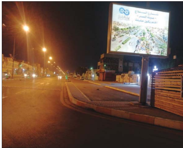
تواصل أعمال تأهيل شارع التلاخ في مدينة الصدر