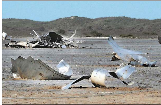
النظر بها على وجه السرعة

على غرار ذلك فإن النشر السريع لوسائل التزويد بالانترنيت المعتمدة على الاصطناعية (مثل «ستارلينك» الذي يخطط له «إيلون ماسك» للسيطرة ان يكون فقط الاصطناعية الصغيرة) ان يؤدي فقط الى زيادة دواعي القلق المشروع بشأن توسع انتشار غابات الفضاء، بل ان هذه التجمعات التراكبية العملاقة التي صنعها يد الانسان سوف تؤدي في حالة بقائها بلا ضوابط الى اعادة مساعي دراسة الفلك من خلال تدخلها مع عمل التلسكوبات، التي يستعين بها العلماء لفهم أصل الكون وتاريخه وتحليل ظواهر الفيزياء الفلكية واقتناص معلومات بناء الحياة في أنظمة شمسية أخرى. خلال ذلك كان يعمل الدائر الان بشأن التنافس على الجيل الخامس (جي 5) ومايلا لذي مقرنته بالانفاس الجيوسياسية بين مزود الانترنيت الغربية المعتمدة على الاموال الاصطناعية (مثل ستارلينك ومشروع اسازونن السمي كبير