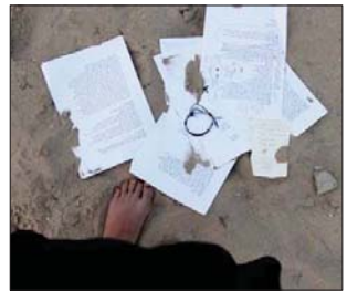
بيروت / الصباح