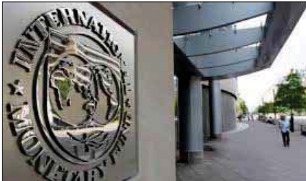
بغداد / شيعة رشيد

عند عام يكون لديها عجز ففتح البنك الدولي لاتراضها بفترة لتسليم الموازنة. وفي هذا العام فإن هناك الكثير من الأمور التي ستأخذ بعين الاعتبار، حيث اقترح الأليات لتسديد إيقاف استيفاء الديون في هذه المرحلة وهو أمر جيد، خاصة أن ديون العراق الراجب تسديدها بصندوق النقد هذا العام تقدر بآلتر من 10 مليارات دولار، وفي حال كان هناك اتفاق فإن ذلك سيخفف العراق من الوضع الاقتصادي والسياسي الذي يعيشه في هذه المرحلة، ولقد التي أن التحسب العراق غير مستقر، لأنه يعتمد على التسديد بنسبة 95 بالمئة و53 لتسديد آليات تسهيلا الآن لانعدام الضرائب والرسوم وغيرها، ومنها بان التحرك لايشمل النقد الدولي فقط وإنما إيقاف استنطاق ديون الكويت ومستحققات الجامعة العربية، علما أن إجمالي ديون العراق تقدر بقرابة 139 مليار دولار، وكان صندوق النقد الدولي، قد توقع أن ينكش الاقتصاد العراقي إلى معدل سلبي بنسبة 4.7 بالمئة في حين سيمنكش اقتصاد منطقة الشرق الأوسط وشمال إفريقيا بنسبة 3.3 بالمئة هذا العام على خلفية إجراءات مكافحة فيروس كورونا السنجد، وتراجع أسعار النفط، في أسوأ أداء منذ أربعة عقود.