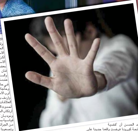
عبد الحسن ان قضية جائحة كورونا فرضت واقعا جديدا على الاسرة سواء في العراق او دول العالم. واصناف لاالصباح قائلا: عمل حظر التجول الذي فرض على مواطني العديد من الدول ومنها

وتضيف كما يتطلب الوضع القائم التركيز على الية المؤسسات التي ترعى شريحة المرأة وتتبنى عملية التمكين بما تساعد على الحد من ارتكابها داخل نطاق الاسرة فضلا عن ذلك فان ايجاد تشريع نوعي من هذا القبيل يعد معالجة وسد النقص في المنظومة التشريعية العراقية لحماية الاسرة ككل وليس فقط المرأة، ويؤكد الاستاذ في علم الاجتماع الدكتور محمد