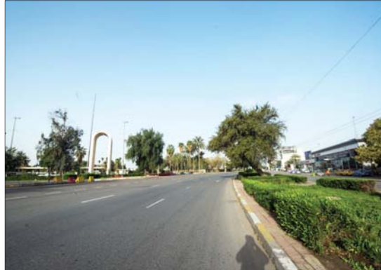
حظر التجوال...

أن الانخفاض الكبير في أسعار النفط تسبب في حصول أزمة مالية ومن ثم التقصير باتجاه تمويل القطاع الصحي في البلد، ومنها على التبرعات العينية البنوك والتجار وغيرها والتي غطت جزءا كبيرا من الاحتياجات بصورة جيدة، وكانت اللجنة تأخر معاملات هؤلاء الموظفين الذين أحيلوا على التقاعد مطلع هذا العام، كان سبب ظروف حظر التجوال إضافة إلى التقصير الحاصل من دوائرهم في عدم إكمال معاملاتهم بأسرع وقت وبين الجبوري، أن اللجنة صرفت سلفة عاجلة إلى هؤلاء الموظفين المحالين على التقاعد وتمت تعويضها مستخدماً من قديم، من دون تحديد مقدار مبلغ هذه السلفة، الجبوري طرقت إلى تخصيصات وزارة الصحة التي وصفها بأنها قليلة ولا تناسب حجم الخطر والمشكلة، إلا