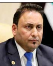
بغداد / الصباح

طالب النائب الأول لرئيس مجلس النواب، حسن الكعبي، الحكومة بموقف حازم إزاء خرق العراق العرفية من قبل تركيا، وقصفها مناطق الجاسر قرب مخمور، بينما استنكرت لجنة العلاقات الخارجية البرلمانية، ذلك الفعل، داعية إلى إيجاد حلول سلمية لحلحلة دون تكرار الاعتداءات التركية. وقال النائب رئيس البرلمان الاعلاي، وقلته "الصباح" إن الكعبي يستنكر عملية خرق الاجراء العراقية من قبل تركيا، وعملها الاستنزافي بحسب خطتها لآسر قرب مدينة مخمور ومطال الكعبي، وفقاً للبيان، ووزارة الخارجية بأخذ موقف