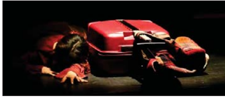
بيروت / الصباح

مع إلغاء الضمانات الثقافية والفنية أو تأجيلها بسبب انتشار فيروس كورونا المستجد، أطلقت مؤسسة المورد الثقافي مبادرة المنح الإنتاجية خلال الحجر التي تتنوع عبر الانترنت مع متابعة أعمال فنية وأدبية جلسات حوارية مباشرة، وذلك بالتعاون مع الفنانين والادباء انضمامهم.