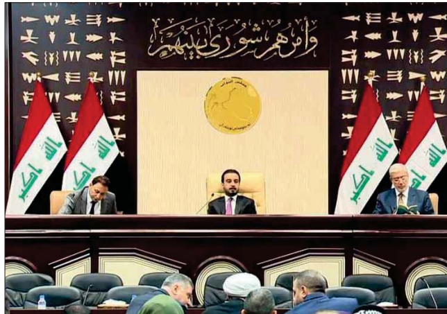
البراد. وقال السوداني، للصباح: إن البلاد تواجه مجموعة من الأزمات التي تحتاج إلى فريق مهني ومختص ومخلص ووزيره متجانس مع رئيس الوزراء يعمل على إيجاد الحلول أو تخفيف أثر الأزمات، مبيناً أن إيجابيات فاضلة وسيؤثر في مستوى رضا الشارع.

إعلان رئيس مجلس الوزراء المكلف مصطفى الكاظمي انتهاء من تسمية تشكيلته الحكومية، فتح الباب أمام إجراء المفاوضات مع الكتل السياسية للتوصل إلى توافق بشأن مرشحي وزارته قبيل الذهاب إلى البرلمان والتصويت عليها. وكان الكاظمي قد كشف عن الانتهاء من وضع التشكيلة الحكومية، في تصريح صحفي، مشيراً إلى أن من أولوياته إجراء حوار جاد مع الأليات المتحدة بشأن وجودها العسكري في البلاد، وأكد أن "العراق ليس ساحة لتصفية الحساسيات". وأضاف الكاظمي أن "أولوياته تقتضي فتح حوار وطني حقيقي بين مختلف الاطراف العراقية، بهدف تأسيس رؤية وطنية نستطيع من خلالها بناء مؤسسات الدولة بناء سليماً، متعمداً بالعمل على الافتتاح بشكل جاد على المحيطين العربي والإسلامي.