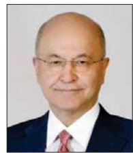
بغداد / الصباح

بارك الرئاسات الثلاث، الجمهورية والوزراء، والدولة لأبناء الديانة الأيزيدية في العراق والعالم بمناسبة حلول السنة الجديدة، داعين إلى الرقرار قانون التجنيد الأيزيديت، وإنهاء أسامة المختطفات. وقال رئيس الجمهورية، برهم صالح، في بيان رئاسي تلقته "الصباح": إنه "يطيب لي أن أهنئ أبناء الديانة الأيزيدية في الوطن والمهجر بمناسبة حلول السنة الأيزيدية الجديدة، متمنياً لهم عاماً سعيداً مفعماً بالأمن والسلام والاستقرار". وأضاف صالح: لقد قدم الأيزيديون تضحيات كبيرة، وأبدوا شجاعة فائقة في الدفاع عن مناطقهم وقراهم وعن العراق بشكل عام ضد عصابات داعش الإرهابية، وهم مدفونون اليوم بأوجحة التحديت التي تواجه بلادنا والنازر، والتكاتف والتعاون مع إقرار الصيغة العلمية لأوجحة خبريون كوروننا السنجد، وتاريخ رئيس مصطفى الكاظمي، في تعزيمة على منعة كورن، بمناسبة العام الأيزيدي الجديد، أقدم بأجر قلهائي لأبناء شعبنا من الأيزيديين متمنياً لهم الخير والسلام، وستنذكر بآلم