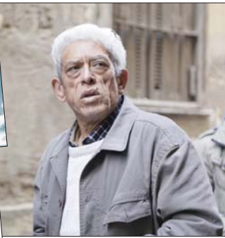
داود عبد السيد قارئ ومتابع جيد للإنتاج الروائي ويختار منه أيضا لأنه يدرك قيمة الأدب الروائي سينمائيًا.

كثير من الفرحين المصريين تأثروا بسينما الأوفد والنسخ التي بدأت في فرنسا خلال عقد الأربعينيات والخمسينيات من القرن الماضي أمثال محمد خان ورافع النهي، علقا الطيب خيري بشارة وداود عبد السيد، والآخر تميز عن الكثير من الفرجين من أبناء جيله فهو عندما أصبح علامة من علامات السينما المصرية جاء ذلك ليس من فراغ بل ما قدم من أفلام طرح من خلالها رؤى شديدة الخصوصية وعلى الرغم من قلة أفلامه إلا أنها تركت بصمة واضحة من الصورة المصرية من ناحية الرؤى والفلسفة والأفكار التي قدمها على لسان أبطال أفلامه من ناحية أخرى.