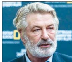
ماري كاراماليتوز احتمال إطلاق ملاحقات قضائية بحق بالدوين أحد منتجي «راست» ولكنها خضعت على أنه من زوال من المبكر جداً تحديد المسؤوليات وتوجيه الاتهامات.

وخلافاً لمتنر صحافي، لم تستبعد الدعاية العامة عن إجابات لها.