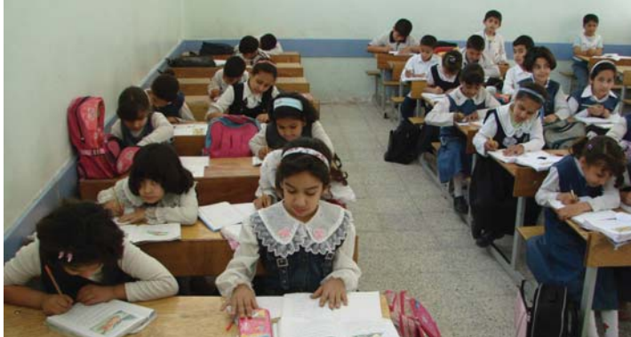
● تصوير نهاد الحزوي