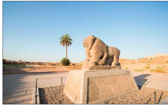
تمثال اسد بابل