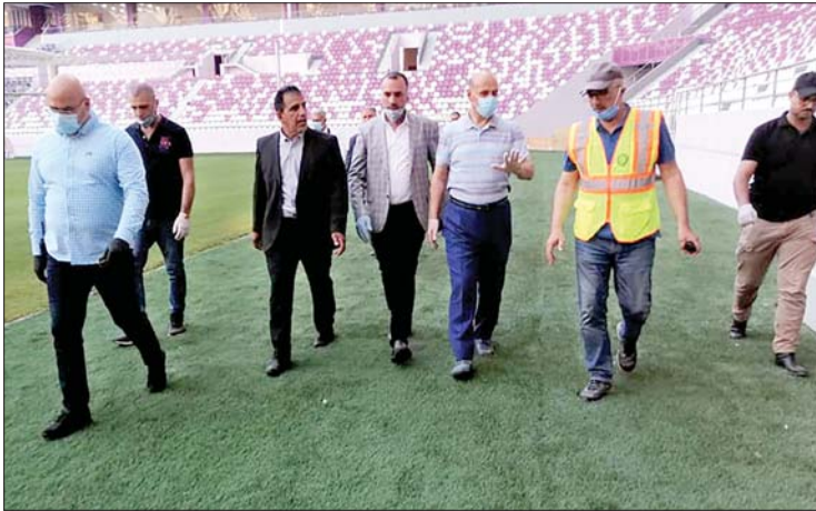
وزير الشباب يتفقد ملعب الزوراء- الموقع الرسمي لوزارة الشباب

أكد وزير الشباب والرياضة الكابتن عدنان درجال ان الاستثمار الافضل والاكثر جدوى في العالم هو الانسان كقيمة عليا لبناء المجتمعات وازدهارها وهو الاضمن لكل بلد متحضر متشددا المستقبل .