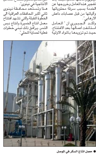
معامل إنتاج السكر في الموصل