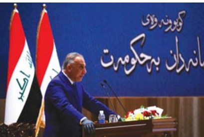
● رئيس الوزراء

وقادت بيانات مكتب رئيس مجلس الوزراء الإعلامي: بان «الكاظمي تلقى رسالة تهنئة من رئيس مجلس الدولة لجمهورية الصين الشعبية في تبريكات استثنائية، فقد أبدت الصين الشعبية التي ترتبط العراق معها باتفاقية اقتصادية مهمة، استعدادها لمكافحة كورونا والشاركة بنشاط البناء الاقتصادي والاجتماعي في العراق. وأعربت تركيا الجارة الشمالية عن ثقها التامة بنجاح الحكومة في مهمتها خلال هذه الفترة الصعبة التي يمر بها العالم أجمع وليس العراق فحسب، وأكد لبنان حرصه وريغته في تمتين العلاقات بين البلدين بما يقدم مصالح الشعبين الشقيقين في وقت لاشأت لجنة العلاقات الخارجية الثنائية، بالترحيب الدولي والإقليمي لحكومة الكاظمي بعله يعيد التوازن للحكومة بعلاقاتها الخارجية».