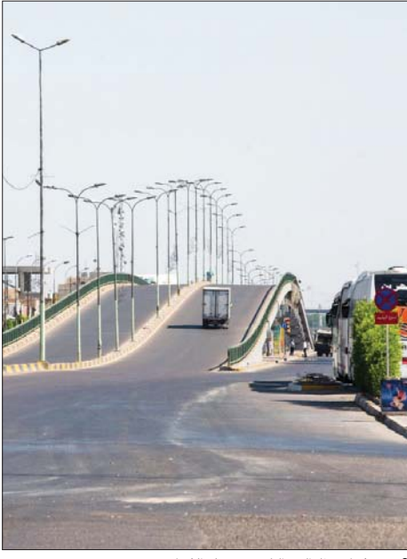
توجه لإعادة حظر التجوال

خول مجلس الوزراء، في جلسته الاعتيادية الأولى التي عقدت، أمس السبت، برئاسة رئيس الحكومة مصطفى الكاظمي، رئيس المجلس وزير المالية صلاحية إطلاق رواتب التقاعدين، وعلى قرار مجلس الوزراء السابق بشأن إيقاف التمويل، وفي حين طالب مجلس النواب باستكمال التصويت