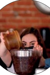
● (أ ف ب)

وتحاول ميخيا بست الحياة في تلك معناه في نهاية المطاف عودة نشاطها التجاري من خلال التحول إلى البيع عبر الإنترنت، ومن