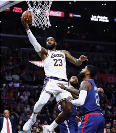
مباراة من الدوري الاميركي للكرة...

من الأيمن حصر المباريات في موقع واحد أو موقعين على أقصى تقدير، قد يكونان لاس فيغاس في المنطقة الغربية وأورلاندو في المنطقة الشرقية. وفي تسجيل حصلت عليه "إي أس بي إن" للاتصال الذي أجراه سيلفر مع مسؤول الدوري أنه "لا جدوى من إضافة خطر سفرهم (للاعبين) من مدينة إلى أخرى إذا لم يكن هناك مشجعون، نعتقد أنه سيكون من الأمن أن نبدأ (العودة) في موقع واحد أو موقعين، وأشار سيلفر إلى أن أحد "أكبر التحديات في حياتنا" هو حضور المشجعين لأن 40 بالمئة من عائدات الدوري تأتي مباشرة من تذاكر المباريات، صفقات الرعاية والامتيازات. كما شفا أن مالكي الأندية الثلاثين ملتزمون باستئناف اللعب وأن الدوري يميل نحو تخصيص ثلاثة أسابيع على الأقل لمسكرات التدريب قبل بدء العودة إلى المنافسة. وأفادت تقارير الشهر الماضي بأن رابطة الدوري درست خطط إقامة الأنوار الاقتصادية "بلاي أوف" بإكمالها في جزء مغلقة من لاس فيغاس لكن سيلفر تراجع في حينها عن ذلك بعد تلقيه ردود فعل سلبية من اللاعبين، بحسب "إي أس بي إن".