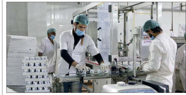
مصنع تعبئة عراقى