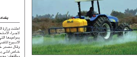
● زراعة / ارشيف

التطور الذي يشهده العالم في هذا المجال، اضافة الى أربعة بيوت بلاستيكية لزراعة فسائل الخليل والورود ودرنات البطاطا وارفان، ان للشروع يضم مختبرا للسيطرة النوعية خاصا بالتحويل والبطاطا وزهور القطف والشليك، اضافة الى مختبر التلقيح بتقنية (النايكو) للمعادن والقاني المستخدمة في الزراعة في جانب مختبر تحضير المواد الكيميائية وعزرة لقلمة للفسائل وصالات غرف للزراعة في الشان نفسه. ذكر رئيس هيئة استثمار بغداد ان عمل انتاج الفطر الغذائي يعد ابرز مشاريع القطاع الزراعي الاستثماري المتفذة في منطقة الدنان.