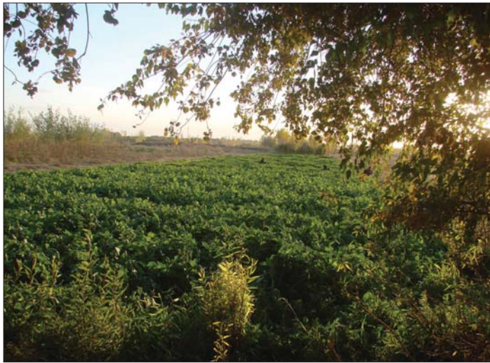
استثمار الأراضي للانتاج الزراعي