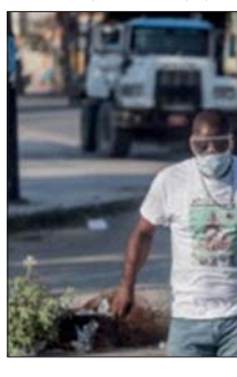
● حلق في هايتي من فيروس كورونا.

ويتمسك الحبوب ثلث استهلاك الغذاء اليومي الهايتيين فسجدي الفقر، مع ذلك ارتفع سعر الأرز لأكثر من الضعف في بعض الأسواق مقارنة مع عام 2019. وانحسار مكتب التسويق الوطني للأسن لغنايتي إلى أن صعد التضخم يسارع منذ آذار.