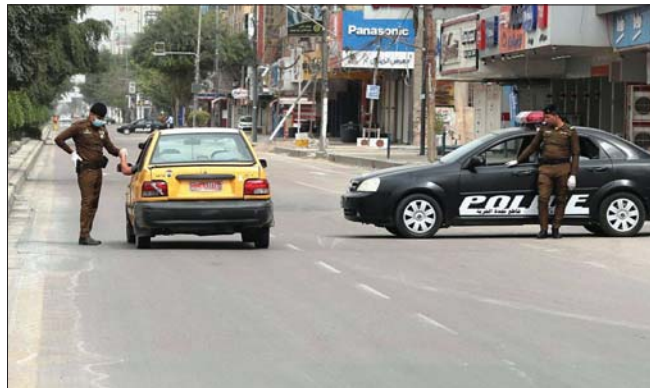
● حظر التجوال - رشيد

تدرس خلية الأزمة الحكومية حالياً مقترحات عديدة منها العودة إلى حظر التجوال الشامل خلال الأيام العشرة الأخيرة من شهر رمضان وقطرة عيد الفطر مع وضع ضوابط أشد وعقوبات صارمة للمخالفين وتقليل الاستثناءات، شرط توزيع منحة الطوارئ على الأسر المتعثرة قبل العودة للحظر الشامل لمساعدتها على الالتزام، بينما حذر مقرر خلية الأزمة البرلمانية الدكتور جواد الموسوي بأن فيروس «كورونا» لا يزال على مستوى عالٍ من الخطورة، مؤكداً تزايد أعداد المصابين بالفيروس بعد تخفيف إجراءات حظر التجوال وأن هناك مخاوف جديدة من زدياد الإصابات في الأيام المقبلة.