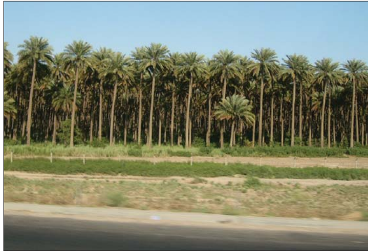
● مسانين التخليج تساعد على تطوير الصناعات التحويلية

صيد جائز واضاف سعدو: بالنسبة للاسماك سنويًا يتم صنع صيد الاسماك النهريّة في موسم التكاثر، لان صيد امهات الاسماك وهي موسم باليوبيص يعد خسارة كبيرة في موسم تكاثرها ونقل الاسماك الصغيرة. لكن لا يتعد صيد الاسماك التي تربي في الاحواض الفلينية او الاقفاص من الزارعين، وهذا النوع من الاسماك الكراب الذي يمتنع تربيته الكثير اربعينيات القرن الماضي ونجت تربيته لدينا وهو الاكبر الى سمك البني المحلي واسماره زهيدة في متناول الاسرة العراقية، وذلك منعاً من استيراد السمك الحي والجمد والبرن ونحن نمتلكون ذاتياً بالانتاج المحلي منذ سنة تقريباً، ولدينا في جمعية الرضوانية تجارب لتكثير انواع من الاسماك المحلية (القبلي والكلان والشيوب) بطريقة التفقيح الصناعي ابدأً في الصورة تجاراً للحفاظ على هذه الانواع والافش منها نطلقه في الانهار لكن الصيد الجائر اثر في الثروة السمكية بشكل كبير بسبب غياب الرقابة واستعمال المواد الكيميائية والمتحسسات او الصعقات الكهربائية والتي تقتل جميع الاسماك الصغيرة والكبيرة وتؤدي الى نضوب الثروة السمكية الطبيعية المتوفرة في الانهار والمسطحات المائية. واشار المستشار القيسي الى منع استيراد الانغمات لغراض التربية والاكتفاء، بما متوفر منها. لكن توجد بعض عمليات التهريب المحدودة اما باستيرادها لغراض التربية والجزارة لكن هذا الاستيراد لن يستمر طويلاً لكي نحافظ على الثروة الحيوانية. حالياً قلنا الاستيراد لوجود منتج محلي ويتم فتح الاستيراد كل ثلاثة اشهر في السنة. اما عمليات تهريب المواشي المحلية فهي قليلة نسبياً وفي المسابق كان يجري تهريبها وفق سعر صرف الدولار، وكثيرة على مستوى التقدم في مشروع الامن الغذائي نحن في مستوى 50% واستيراد في ايام وصولها الى مستويات متقدمة