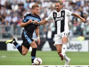
عودة الكشيتيو بانتظار قرار حكومي... وكالات

تجته الحكومة الإيطالية التي منح الدوري لكرة الكرة القدم الضو، الأخضر من أجل استئناف التمارين الجماعية ابتداءً، من 18 أيار الحالي، على أمل أن يكون ذلك مؤشراً لإمكانية عودة المنافسات في حزيران بعد أن توقفت منذ التاسع من آذار بسبب فيروس كورونا المستجد. وأعلنت مصادر عدة، بينها موقع "فوتبول إيطاليا" المتخصصة في التعديلات التي أدخلت على البروتوكول الطبي أذنت للجنة العلمية-الفنية الحكومية بالموافقة على استئناف التمارين الجماعية ابتداءً، من 18 أيار، وذلك بعد أن سمح ببدء التمارين الفردية للفريق، وبدأت إيطاليا تخفيف إجراءات الإغلاق التام في البلاد، ما سمح للأندية في