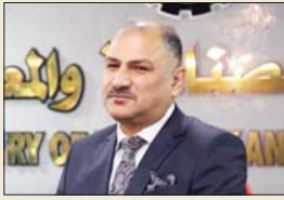
● وزير الصناعة