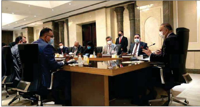
الكاظمي خلال اجتماعه مع لجنة الصحة النيابية أسس

بمهر، أثاره «وتابع الغريباوي، إن وزير الصحة وعد بأن تكون هناك خطة طبية وهي عبارة عن فريق استشاري لزيارة المرضى القاطنين في منازلهم وتوفير المستلزمات العلاجية لهم، أما في الجانب الإنساني اليوم أكثر من المستشفيات».