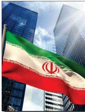
طهران / وكالات

طالب وزير الخارجية الإيراني محمد جواد ظريف المجتمع الدولي بمحااسبة واشنطن على انسحابها الأحادي من الاتفاق النووي، وأن تعوض بلاده عن الضرر الناتج من خطواتها «غير القانونية».