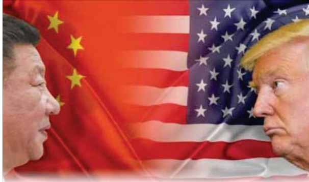
بكين / وكالات

حثت وزارة الخارجية الصينية الدول على النظر بموضوعية في أهداف القانون الخاص بهونغ كونغ، ودعمت التصريح ردا على انتقادات من الولايات المتحدة وبريطانيا ودول أخرى بشأن إقرار الصين لقانون الأمن القومي الجديد الخاص بهونغ كونغ الذي دخل حيز التنفيذ أمس الأربعاء.