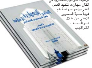
تضمن الكتاب فصلين الفصل الأول تحدث فيه عن العمارة الإسلامية وتفصيلاتها، من حيث الهوية والتسويق المعماري والطابع الإسلامي ومفهوم المنظر الروحي له وتاريخية فن العمارة وخصائصه. وعن العوامل البيئية وأثرها في الممارسات التصميمية كما تطرق فيه إلى التصميم الداخلي وأسسه وتنسيق المخططات اللونية له، وقرن بين التصميم الداخلي والبيئي.