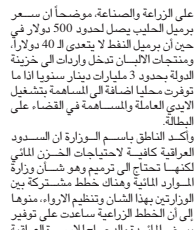
زيادة الانتاج الزراعي في العراق / رديف

على الزراعة والصناعة، موضحاً أن سعر برميل الحليب يصل لحدود 500 دولار في حين أن برميل النفط لا يتعدى إلى 40 دولاراً، ومنتجات الألبان تدخل واردات إلى خزينة الدولة بحدود 3 مليارات دينار سنوياً إذا ما توفرت محلياً إضافة إلى المساهمة بتسغيل الأيدي العاملة والمساهمة في القضاء على البطالة.