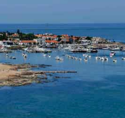
تعمل وفقاً لتطور الوضع

لكنّ الجائحة كان لها تبعات شديدة على قطاع السياحة الذي يسهم بنسبة مهمة في الناتج المحلي الإجمالي وهو أيضاً مصدر رئيس للعملة الأجنبيّة. ويعيدت إيرادات السياحة نحو 50 في المئة خلال أول خمسة أشهر من العام الحالي مقارنة بالفترة ذاتها من 2019 مع بقاء الفنادق والمتنحعات التونسية خاوية بسبب إجراءات العزل العام وإغلاق الحدود.