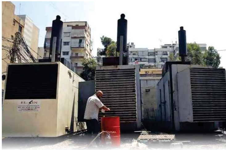
بغداد / وفاة عامر

افادت محافظة بغداد بان الوحدات الادارية للمناطق والقائمقاميات، ستتولى مسؤولية تحديد سعر الامبير للمولدات والخاصة بشهر تموز الحالي، شريطة ان لاتصل الى مبالغ عالية ترهق كامل المواطنين.