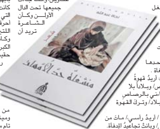
تتمثل مشغلة / وتعلم ودعها / قبله للثبات أريد هوية / بلا وصافي، وبلا بلا طاعة، جاني بالبرصاص ملتبساً بالبيلا، وترتق الماتة / فرفه الأبي / أريد راسي، فمات من الضحك إلى ويات تجايل للفاة.