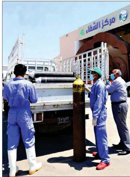
● جهود كبيرة لتأمين الاوكسجين لجميع المستشفيات

من المواضيع خلال الاجتماع أمس مع رئيس الوزراء، وبحضور وزير الصحة، التي تجسدت حول الواقع الصحي وإعطاء صلاحيات لجميع الوزارات لتسيير قدراتها مع وزارة الصحة. تمت مناقشة التخصصات الطبية لوزارة الصحة وتغييرها لها وإيجاد تدخلات الأحزاب في إدارة وزارة الصحة وعمل الملاكات والتخطيط. التفاصيل 2