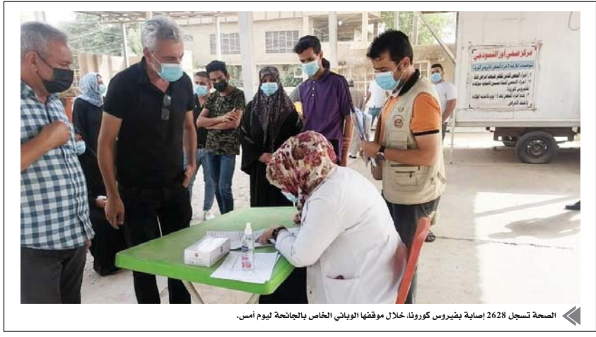
الصحّة تسجل 2628 إصابة بـفيروس كورونا خلال موقتها الوبائي الخاص بالجائحة ليوم أمس.

● بغداد - الصباح يُنشد الأمانة العامة لمجلس الوزراء، أمين الأريعاء، إمكانية تقسيم مبلغ التوقيفات التقاعدية للقعود والأجراء المثبتين على الملك الدائم. وذكر الأمين العام لمجلس الوزراء حميد الفزعي، كتاب رسمي ردّ فيه على استفسار نيابي بشأن شريعة القعود والأجراء، أنه لا يوجد مانع قانوني يحول دون تقسيم مبالغ التوقيفات التقاعدية المترتبة بمجهوداتهم في حال عدم القدرة على تسديدها دفعة واحدة، وذلك بتقديمهم تسوية مقبولة وفق أحكام المادة (5/2) من قانون تحصيل الديون الحكومية رقم (56) لسنة 1977 المعدل على تشييدهم على الملك الدائم أو إحالتهم إلى التقاعد وفقاً لأحكام البند (خامساً) من المادة 19 من قانون التقاعد الموحد رقم (9) لسنة 2014. وأضاف أن الموضوع لا يتطلب إصدار قرار من مجلس الوزراء.