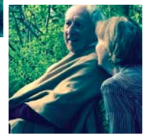
كان ترانسترومر يجيب بمساعدة زوجته

الجميع هنا موجودون ليسهوا في تأويل إشارات الشاعر الفاقدة للتحقق فيو يستطلع التطبيق كمتكلمين فقط بوضوح ونعم ولا. وكذلك جيد جداً، بينما تظهر ريقية الكلمات متقطعة بينما وجهه يقول الكثير