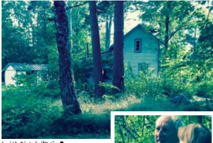
بيته الأزرق ما يزال شامخاً

هكذا كنا نتناور.. الجلطة التي أصابت الشاعر بالشلل التصدي عام 1990 سرقت منه قدرته على الكلام بشكل شبه تام. كانت العفة التي أخذتها إليها مونكا صغيرة ومزجعة بالأشياء، وكان هناك اثنان من أصدقاء العائلة منتج أقلام أميركي وزوجه السويدية يجلسان قريباً من مكان الهبوط الضيق فيما جلست مونكا ومصور الشاعر ووكيلة الإعلام في نصف دائرة تحيط به، كما لو أنه عازف حقله موسيقية على وشك أن يبدأ العزف أكثر من كونه شاعراً يهيباً للإجابة عن أسئلة معارضة بلطف. الجميع هنا موجودون ليسهوا في تأويل إشارات الشاعر الفاقدة للتحقق فيو يستطلع التطبيق كمتكلمين فقط بوضوح ونعم ولا وكذلك جيد جداً، بينما تظهر ريقية الكلمات متقطعة بينما وجهه يقول الكثير. سألت ترانسترومر أسئلة قامت مونكا وترجمتها إلى السويدية، وكان يجيب بمساعدة زوجته التي تحاول التوضيح قدر استطاعتها، وفي هذه الأثناء كان الشاعر يراقب أسلحتها واستقرار أها يوجهه، كمنهاته القليلة، إشاراته ونبرة صوته. بين الشاعر وزوجه شامخ راقبي تهذيب واحترام عابيين، وإذ كنت أراقبهما كما صعباً يتم أخذ من المايسترومن الفرقة السمفونية. ولعل من المناسب الحديث بهذا الأسلوب مع شاعر محبوب من الجمهور لفترة طويلة حتى قبل فوزه بجائزة نوبل. وقد ترجم إلى ما يقارب ستين لغة ليأتي بعد الشاعر الأكثر ترجمة في العالم يابلو نيرودا. العديد من الشعراء أجبروا ترانسترومر بين فهم شاموس هيني، والكثير من الشعراء الأميركيين البازيزين الذين فهروا بعد الحرب، الرومانتين