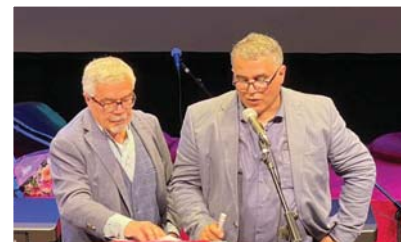
● قراءات شعرية مترجمة

بعدم من بلدية مدينة لاهاي في هولندا، وبالتعاون مع اللجنة العراقية- الهولندية المشتركة المنظمة لمهرجان ميزوبوتاميا، ما بين النهدين أقامت فعاليات مهرجان ميزوبوتاميا الثقافي قبل أيام، والمتوزعة بين فعاليات في الآداب والفنون والحوارات لمختلف الشعراء والفنانيين والسينمائيين العراقيين والعرب ونخب من ضيوف من مختلف البلدان حول العالم.