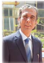
● ماجد طوفان

الشعر واقتصره على النخبة، من جانب آخر، النواب واحد من أبرز الأمثلة الشامخة على الشعراء الذين عاشوا على وفق المبادئ التي تبناها ولم يتصل منها في زمن تفنن فيه الآخرون في اللعب على الجبال، مظفر النواب عاش العبث وخبر التنكيل والملاحقة ولم يترك ما أمن به وهذا بعد ذاته نادر على مر العصور بحسب الشاعر والأكاديمي الدكتور هيثم الزبيدي التغيير الذي تركه النواب في القصيدة العامية، بالهجة الدارجة فتح أبواباً جديدة وشكل أنماطاً مغايرة في بناء القصيدة بحسب الشاعر عامر عاصي كان التغيير الذي أحدثه النواب في القصيدة العامية والملازمة والبياني في القصيدة الفصحى، ذلك الناظر شكلاً ومعادلة الدلالات والتوظيفات السبئية التلميح، نضاه، هاتان المادتان اللتان اتجتا مضموناً مكروراً من الخطاب الشعري الترتيب الشجيح