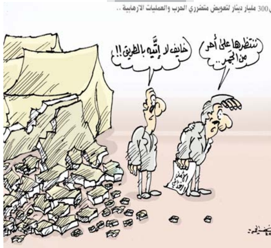
تقريباً 300 مليار دينار لتقويض متطوري الحرب والعمليات الإرهابية..