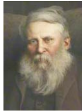
● فرجسون الأذريجية اللغوية