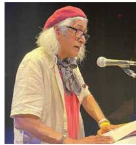
● الشاعر زاهر الغافري

قيمت ومشاعر الحب والحرة. مرض كتاب ودور مشاركة من دور النشر المسهبة في المهرجان أحد من العراق، دار خطوط مبرسه والشاعر العراقي عدنان الصانع، بينما احتلت دار نشر أجدع وبالتعاون مع مؤسسة المهرجان بصور مئة كتاب للشاعر والباحث العراقي الدكتور خزعل الماجدي.