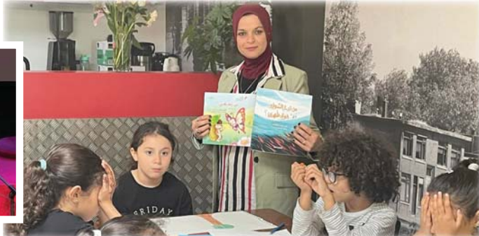
● وورك شوب للأطفال

وقال مدير مهرجان ميزوبوتاميا الثقافي الدولي الشاعر محمد الأمين الكرخي: «تم تصنيف المهرجان في الأعمار الأخيرة كأحد أهم وأبرز المهرجانات الثقافية للجاليات المشتركة في أوروبا، إذ استضاف هذا العام شعراء وروائيين وقنايين تشكيهيين وموسيقيين من عدة بلدان، والمهرجان هذا العام نهج برنامجاً خبيراً من الفعاليات التي جانب الشعر والرسم والسينما، وورش كتابة التنص لأطفال، فضلاً عن مشاركة دور النشر عبر معرض الكتاب حيث كان الإقبال من الجالية العربية كبيراً». وأوضح الكرخي «خروج كل ما ذكرناه فإن مهرجان هذا العام دورة الشاعر مظفر النواب سلط الضوء على الأصوات الشعرية الجديدة في أمريكا اللاتينية وشارك فيها الشعراء من دول الأرجنتين، بيرو، المكسيك، أوروغواي، وكان الهدف إطلاع الجمهور الهولندي والمشاركين على أدب الشرق والغرب والثقافة تلك الشعوب والتركيز على الحوار بين الثقافة الهولندية والثقافات الأخرى».