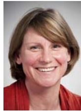
● مervان كحيتبة استعمال اللغة

لغة عنوان (الصالون) تعتمد على التعبير عن المتعدد اللساني الذي يتحول فيه المدينة والعل للثريولوجية رقيمة عن العصر، من ناحية أن قراءة الظواهر الاجتماعية قراءة نصية تعتمد على فكرة الممارسة السيمولوجية