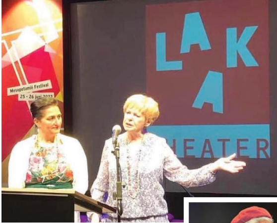
● إحدى المشاركات مع عريفية المهرجان