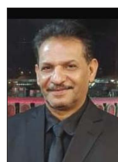
ولي الخفآجي، أصدآء السوء والعنف الأري من أكثر العوامل، التي تسبب بالمشكلات والاحرفآء السوكية والأخلاقية للمراهقين

قد تثير خدمة الاتصال بالاختصين خوفًا وريبة في نفوس الأيآء والأهآء لخطورة المشكلات التي يمر بها أبنآؤهم، إلا أن الدكتور عبير أكدت سرية الاتصال، كما أن هذه الخدمة لا تقدم لليافعين فقط، بل توفر الاستشارات والحلول الناجمة لأوليآء