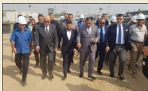
محافظة بابل مع اللجنة الوزارية