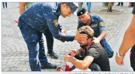
القوات الأمنية تعالج أحد المتظاهرين خلال التظاهرات

ثلاثة محاور إلى المحافظة بمناسبة وفاة النبي محمد (ص) وتوافره أعداد كبيرة من التظاهرين في ساحة ثورة العسكرو وساحة الصدرين. وأضاف أن أعداد التظاهرين تجاوزت أربعة آلاف متظاهرين، مبيناً أن للتظاهرين أربعة بتقديم الرورد للقوات الأمنية. التفاصيل 2