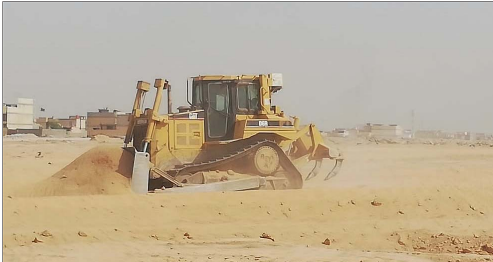
فرز القطع السكنية