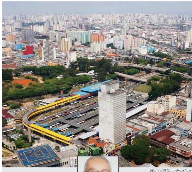
مدينة ساو باولو - رة اقتصاد البرازيل