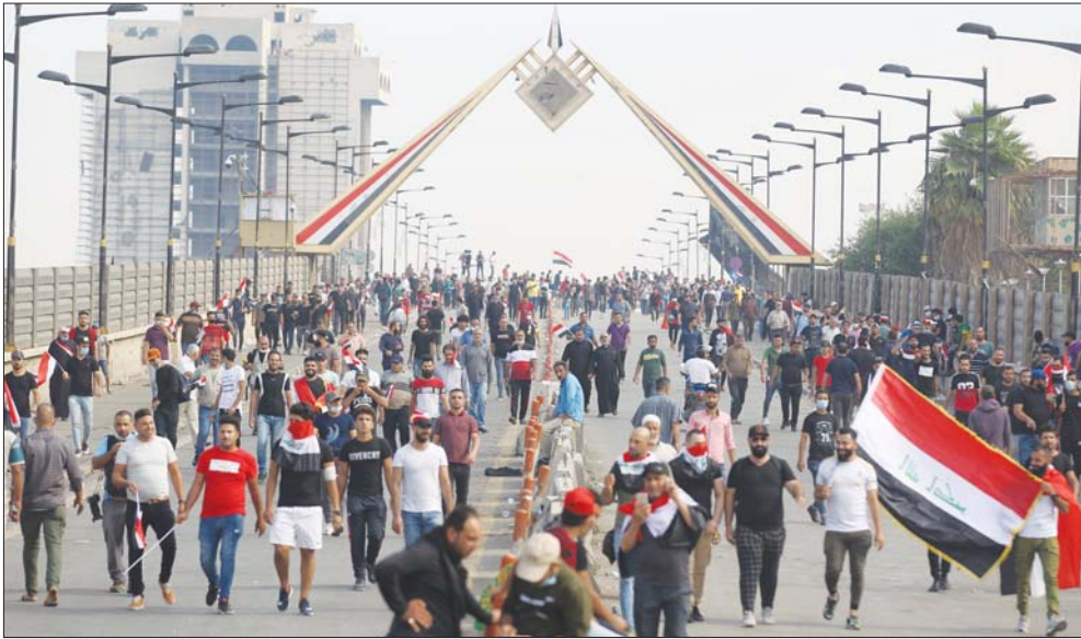
التظاهرون يعبرون جسر الجمهورية