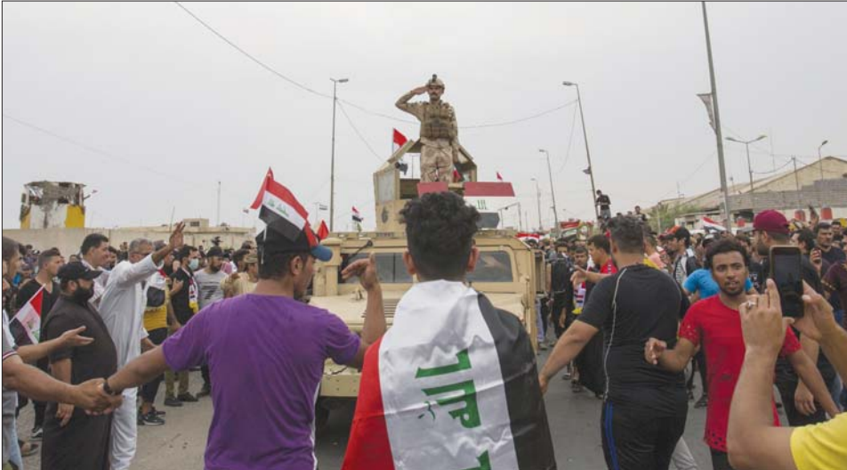
القوات الأمنية تحيي المتظاهرين السلميين.

■ نحن أمام أزمة نظام لم تدرکہا القوى السياسية والدولة ■ أعددنا ورتاسة الجمهورية مشروعا لتشكيل مجلس الامعار