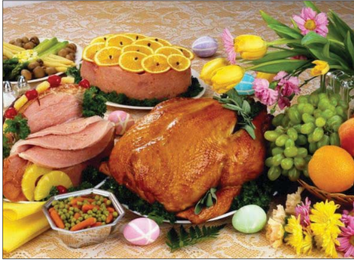
تنوع الغذاء مهم وصحي

خلصت دراسة كبيرة إلى أن الأشخاص النباتيين، الذين يعتمدون على أنظمة غذائية نباتية فقط، تقل لديهم مخاطر الإصابة بأمراض القلب، لكنهم يصحون أكثر عرضة للإصابة بالسكتة الدماغية. وسجل العلماء تراجعاً في حالات الإصابة بأمراض القلب بين النباتيين بواقع 10 حالات من كل ألف شخص، وزيادة عدد حالات الإصابة بالسكتة الدماغية بواقع ثلاث حالات من كل ألف شخص، مقارنة بمن يتناولون اللحوم. وشملت الدراسة التي نشرتها المجلة البريطانية الطبية 48 ألف شخص، والتي أجريت على مدى 18 عاماً.