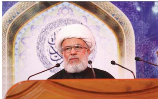
ممثل المرجعية الدينية العليا

الحفاظات، ندعو أحيبتنا التظاهرين واعزتنا في القوات الأمنية إلى الالتزام التام بسلمية التظاهرات وعدم السماح بانجرارها إلى استخدام العنف وأعمال الشعب والتخريب. وأضاف أن «شكك العديد من الإصلاحات التي تتفق عليها كافة العراقيين وطالباً طالبوا بها، ومن أهمها مكافحة الفساد والغاء أو تعديل بعض القوانين التي تمنح امتيازات كبيرة لكبار المسؤولين واعتماد ضوابط عامة في التوظيف والحصر السلاح بيد الدولة مع سن قانون منصف للانتخابات. وقال ممثل المرجعية الدينية الشيخ عبد الواسع الصباح: نسخة منها، في هذه الأوقات الحساسة من تاريخ العراق العزيز حيث تجدد التظاهرات الشعبية في بغداد وعدد من