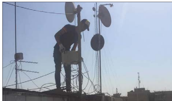
جنان من الحلة