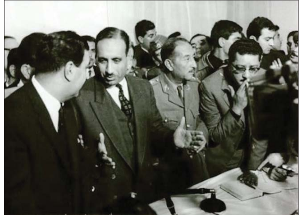
مؤتمر مصفي لثلاثيني 1963

مع مجموعة من جنود وضباط صف المدرسة المهنية العسكرية وبعض المدنيين بزي عسكري حاملين الرتب العسكرية العالية وشارات خاصة على اذرعهم العسكرية في الخياب الرئيسي للمعسكر الرشيد واستطاعوا السيطرة عليه، وهو موقع مهم لانه يتيح للثوار اسر جميع الضباط الذين اعتادوا ان يبيتوا اليهم في منازلهم في بغداد والعودة في الصباح الباكر الى مقرات وحداتهم العسكرية داخل المعسكر، واستولت مجموعة ثانية من مقر اللواء الخامس عشر، واستطاعت مجموعة ثالثة السيطرة على كتيبة الديابات الاولى واعتقال عدد من ضباطها وقامت مجموعة رابعة بقطع شبكة الهاتف المباشرة مع المعسكر وتخريب بيالة المعسكر، وسيطرت مجموعة اخرى