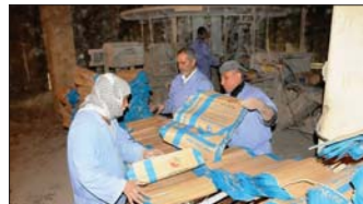
معمل سمنت حدي

وأشار إلى أن "ما تقوم به السمنت العراقية في بيومها وتضاعف الإنتاج والبيعات هو حفاظ على إرثه قرار منع استيراد السمنت الذي أوقف استنزاف ملايين الدولارات كانت تهر مع استيراد السمنت من دول الجوار مع الحفاظ على سلامة مستقبل البناء ودعم حركة البناء، والإعمار بالنسب وأحد أنواع السمنت". وفت إلى أن "الشركة لديها (18) معملاً ينتج جميع أنواع السمنت موزعة في جميع أنحاء العراق ويمكن لثلاثين شركة إنتاج والتجهيز من أي معمل حسب الموقع الجغرافي وهو يكمه بعبءا عن الروتين والبيروقراطية". ويذكر أن معمل سمنت النجف تأسس سنة 1975 بتنفيذ شركة (ACC) الهندية بملف تصميمية (156000) ألف طن سنوياً ويعمل بالطريقة الرطبة موحدة في كافة عملياتها وتلحرج من إنتاجها من السمنت في تلك المعمل بأسعار تنافسية حيث حدد سعر (60) ألف دينار للطن الكيس العادي و(65) ألف دينار للطن الكيس القارم.