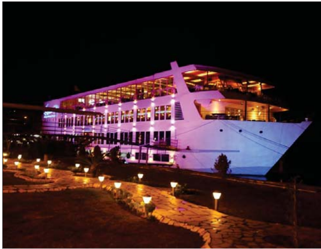
مقرم علم في بغداد