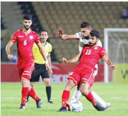
الضغط على اللاعبين السعوديين ومنعهم من التقدم وهدر هذا الثاني فرصاً عديدة للتسجيل.

زبدة الكلام على الرغم من مشاركة العديد من المنتخبات بالصف الثاني او بلاحين بدلاً، الا ان المستوى الفني للبطولة بدأ بالتصاعد في كلا المجموعتين، منتخبا الوطني لا يزال يقدم مستويات متفحة وبناء، متجدد ونأمل منه الوصول الى الجاهزة المثالية رغم ايماننا بان لاعبي الجاهزين سوف يكونون خارج حسابات المدرب كاتالينش في التصفيات ذات الكلام يقال للمنتخب اللبناني التي تطور في المباريات الاولى الثانية، حين ان سوريا مطالبة بإثبات كبروتها الكروية أمام منتخبا في لقاء المقبل واستباقاً وترصد عن كتب مستويات المجموعة الاولى التي يبدو ايجاجات للبطولة من اجل تقديم صورة مختلفة عن السابق وشاهدنا مثالي لعب حذبة وتعبيرات في طريق الازراء التي من شأنها الارتقاء بالجائزين الخطفي والفني للبطولة الحالية.