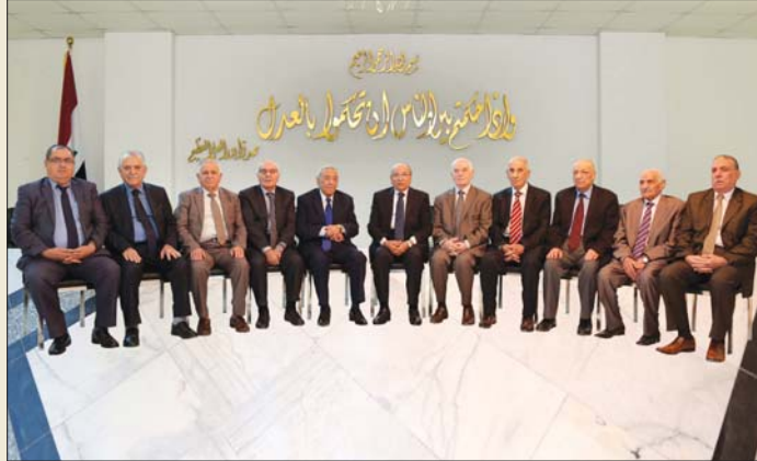
المحكمة الاتحادية العليا الحالية الأعضاء المثلثون والنديات