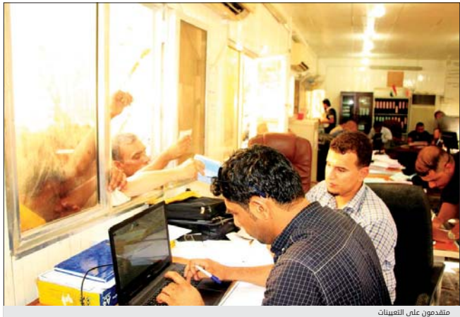
متقدمون على التعيينات