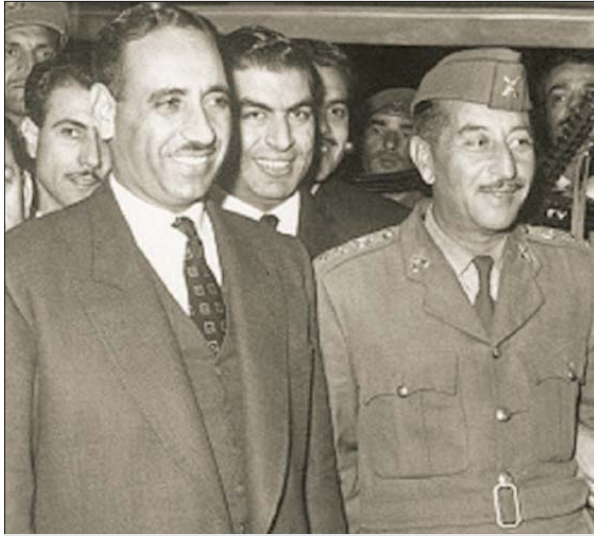
احمد حسن البكر وعبد السلام محمد عارف

ادى انقلاب 8 شباط عام 1963، ولاسيما بعد جرائم مليشيا الحرس القومي، الي مقتل اكثر من سبعة الاف عراقي، ناشرا فوق سماء العراق عيمة دموية كثيفة. وبينما كان حكم الاعداء ينفذ برايعهم، عبد الكريم قاسم، انطلاق من مفاعل أuar محزون يستعصي الشيوعيين من بونهم للانصبة السجدية؛ وفي حين قتل عدد من قادتهم، توفي امينهم العام سلام عادل جواد العنزي، وفي الايام الاولى للانقلاب كانت اعداد المعتقلين تتجاوز سعة المئوفات، ففتحت النوادي الرياضية ودور السينما وملعب الكرة وقاعات الرياضة ومورست ضخم اوسع منصف التعذيب، ومن اوضحها ان سجن البعث لم يتوقف عند الاحتاث المادي الكامل للشوعية فحسبه، بل قتل الشيوعيين جميعا. ولما ان تساءل هل جاءت حركة حسن سريع كريد فعل المصارف التي مورست ضد العراقيين؟ ام هي حركة تحد الحكم العا قاسم؟ ما علاقتها بالتحزب الشيوعي العراقي؟ كيف خطت تلك الحركة للإطاحة بنظام 8 شباط؟ هل هي انقلاب شيوعي ام ثورة عرفاء؟ كيف نفسر اسباب اخفاها؟ وأخيرا كيف استغلها عبدالسلام محمد عارف لإزاحة العنيين من السلطة في 18 تشرين الثاني 1963 لاحقا؟