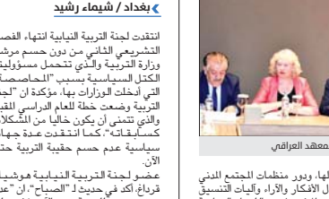
بغداد / الصباح