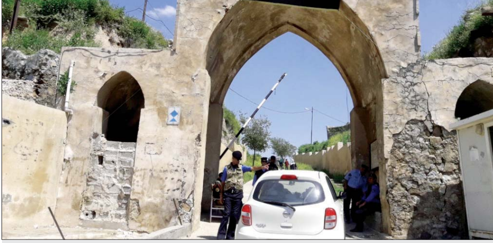
بوابة قلعة كركوك

وأوضح ان القلعة تحمل المواصفات المطلوبة للشواخص الأثرية المدرجة ضمن لائحة التراث العالمي، لاسيما انها تضم القبة الخضراء التي تعود الى 700 سنة مضت وكنيسة ام الاحزان والقيصرية والبراسا واسوراا طينية و60 دارا ترابية، وجامع النبي (دائيل) الذي يعد مزارا دينيا وسياحيا.