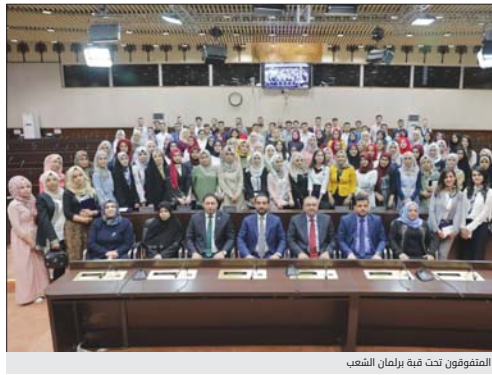
المتفوقون تحت قبة برلمان الشعب