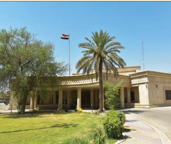
مبنى هيئة الزهارة

الحالي، بينما بلغ عدد الوزراء، ومن هم برزجتهم مئتي صدر بحقهم أمر قضى 8، الواقع 106 امر قضى، و106 امر قضى اخرى صدر بحق 46 من ذوي الدرجات الخاصة والديورين العاليين". وتابع ان "عدد امراء الاستقدام القضائية الصادره منذ على تحقيقات الهيئة خلال السنة نفسها بلغ 2866 أمر، كُفد منها (2014) امراً، مُؤخّصةً ان "عدد الوزراء ومن هم برزجتهم الذين صدرت بحقهم امراء استخدام كان 12 صدر بحقهم 12 صدرت بحقهم امراء استخدام في وقت كان عدد الذين صدرت بحقهم امراء قضائية بالاستخدام من الدرجات الخاصة والديورين العاليين 98 مسؤولاً صدر بحقهم امراً، فضلاً عن اصدار 1124 مذكرة توقيف قضائية منها واحدة بحق وزير، و6 مذكرات صدرت بحق 4 مُتهمين من ذوي الدرجات الخاصة والديورين العاليين". واستعرض التقرير "عدد المتهمين والقضايا الجزائية والنسب والتقديرية والقضايا المشمولة بقانون العفو العام"، مبيناً ان "مجموع المتهمين به في ما يتعلق بقضايا الفساد الحالية من الهيئة بلغ 986 مُتهماً ومحكوماً في 647 قضية جزائية". وأشارت الهيئة في تقريرها إلى "عمليات الضبط والأسلح المضبوطة التي مئقتها خلال النصف الأول من العام الجاري" موضحة انها "مئقت 306 عمليات ضبط، وأن عدد المتهمين في تلك العمليات بلغ 691 مُتهماً، مُخرّجاً بالبرازات الجريمة التي تم ضبطها وتثبيتها في محاضر الضبط