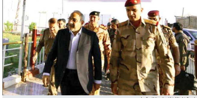
رئيس الوزراء خلال زيارته مقر عمليات ديالى امس

ان كانوا مجتمعين قرب قرية مهجورة تسمى «تل طيبة» من الجيش الشرفي، عين الجاحش الغربي، عريش، عين البصرة، خربت الفريدي، جند الراهبين القلتل، فضلا عن 4 مناطق ووفي ديالى ذكر بيان الاعلام الحشد الشعبي ان قرية مشتركة من اللواء 20 والحشد الشعبي والجيش ظهرت قرى ااصلاح والتشييدية، عرب جلالا، ضمن قاطع عمليات ديالى".