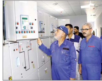
محافظ ميسان يطلع على المحطة