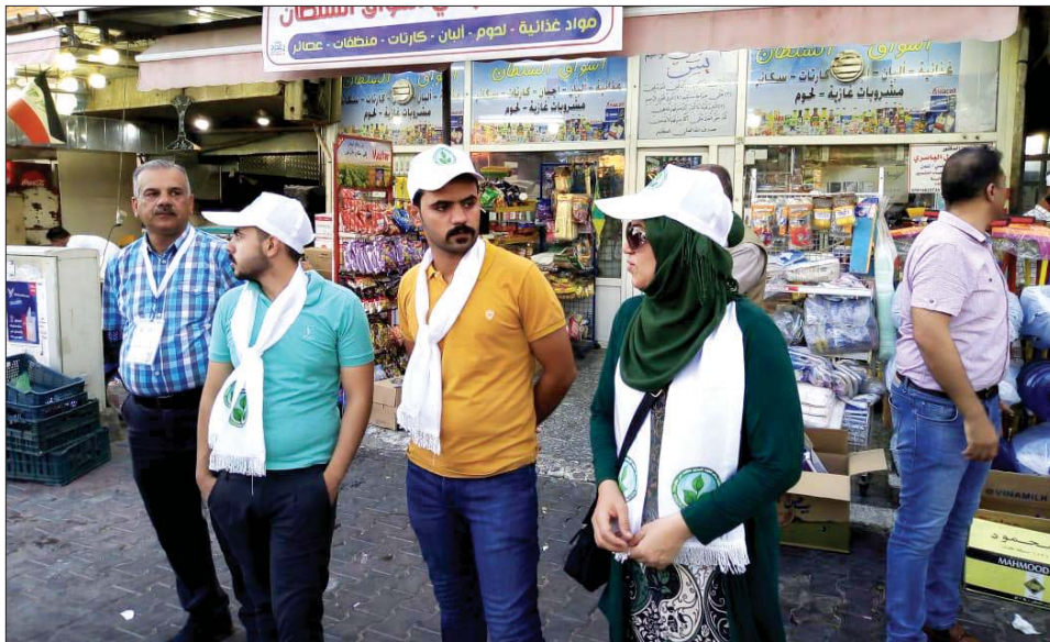
حملة استعمال الأكياس الورقية