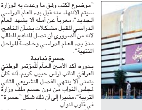
بنية مجلس النواب

أكد رئيس مجلس النواب محمد الحلبوسي، خلال استقباله السفير العراقي لدى بغداد ايرج سمجدي، أهمية أن تتبنى دول المنطقة موقفاً متوحدًا بشأن القضايا التي تتعلق بالامن والسيادة، داعياً الى تعزيز التعاون بين دول المنطقة.