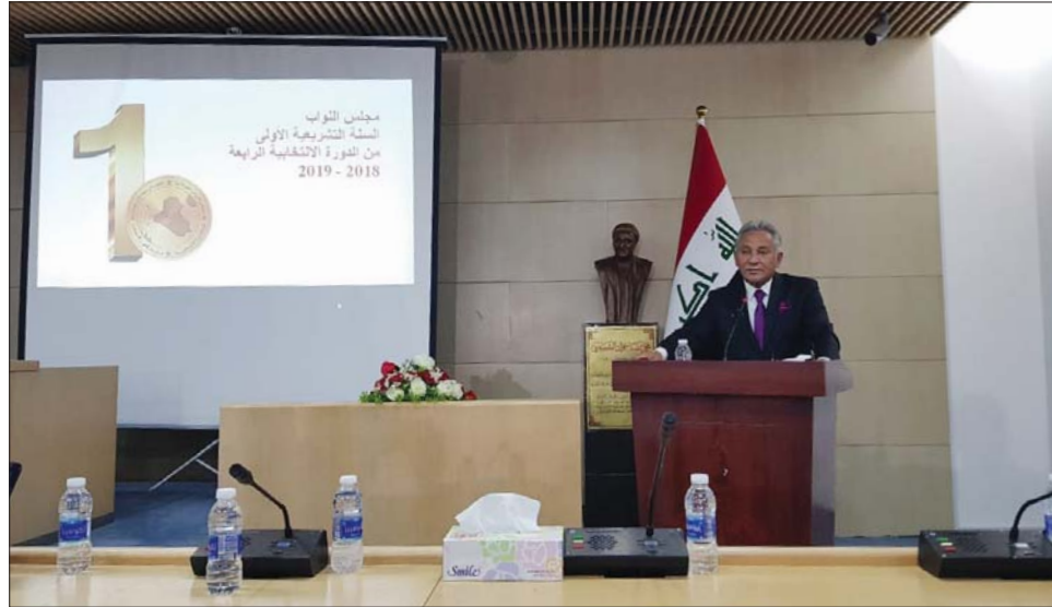
المؤتمر الصحفي الذي عقد في مجلس النواب أمس