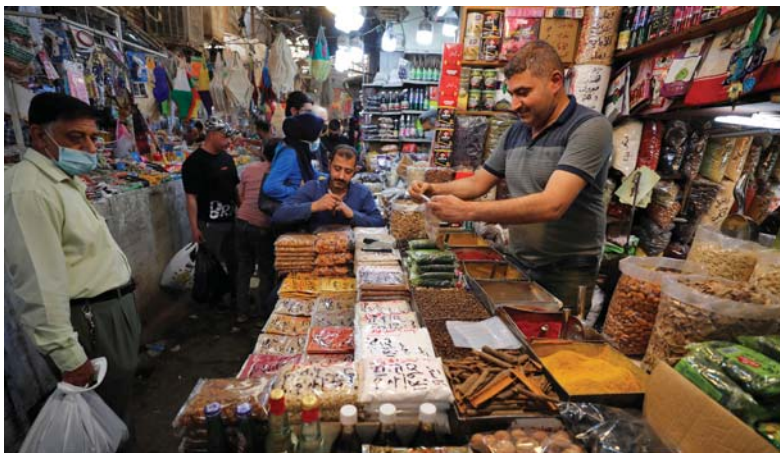
أقبال الناس على شراء المواد الغذائية قبل حلول شهر رمضان المبارك. (أخفب)

أخيراً أردت لهذه الكلمات أن تكون إشارات إلى المرجعيات الفكرية الكبرى للأمين، كما تجلت في أبرز كتبه: «الاجتماع العربي الإسلامي»، «تقد العولمة والفكر الديني»، «الإسلام والديمقراطية» و«مساهمات في النقد العربي».