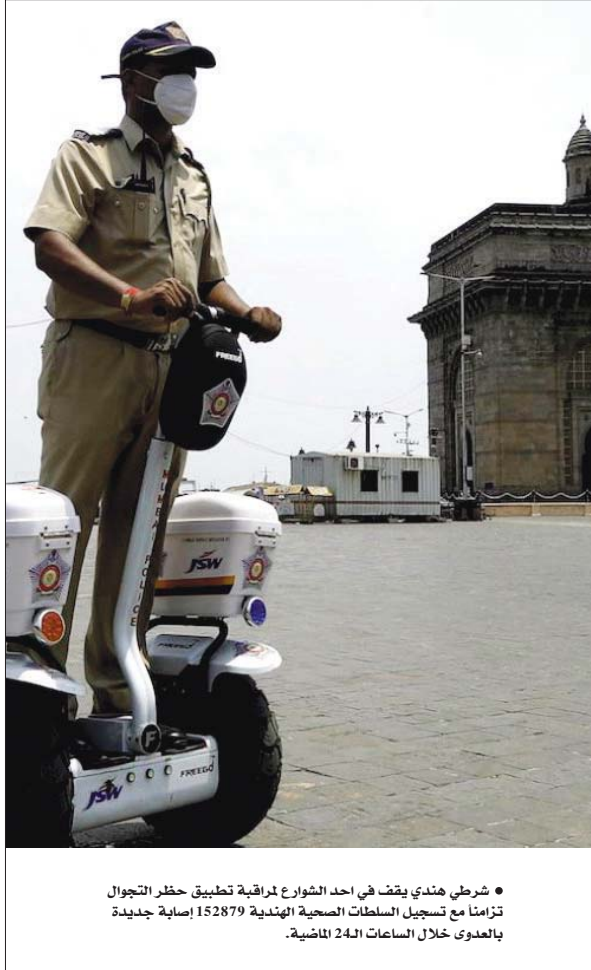
● شرطي هندي يقف في احد الشوارع لمراقبة تطبيق حظر التجول تزامناً مع تسجيل السلطات الصحية الهندية 152879 إصابة جديدة بالعدوى خلال الساعات الـ24 الماضية.

ومن التوصيات التي تضمنتها «وثيقة المبادئ التوجيهية»، مطالبة الحكومة المصرية بضرورة المشاركة في أعمال التنمية المستدامة في إثيوبيا.