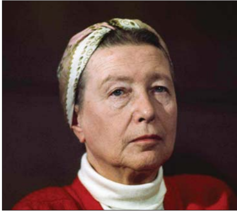
• سيمون دي يوفوار

منذ ما يقرب من ربع قرن نادت طالبة الفلسفة في جامعة السوربون بالتحجر وكسر القيود ومساواة المرأة مع الرجل في كل شيء وأي شيء، هما أن تذكر لحظة النسوية حتى تتبادر إلى الأذهان (سيمون دي يوفوار) الكاتبة والمفكرة والنظرة في علم الاجتماع والفكر والاخلاق الجريئة، والناشطة والفلسوفة، التي قدمت عبر افكارها ودراساتها الفلسفية المساهمة الكبيرة الوجودية، وخاصة على الرتبة الثانية وكانت الرتبة الاولى من نصيب جان بول سارتر وفي هذه الايام ونحن نتقرب من ذكرى وفاتها في 14 / 4 / 1986 ما علينا الا ان نحيي وقتها وفكرها مساندة المرأة والدفاع عن حقوقها المسلوقة.