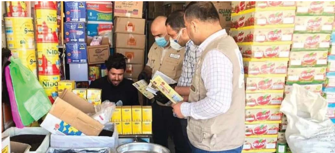
مفردات جديدة تنتظر العراقيين ضمن السلة الغذائية، أبرزها الحليب والبقوليات