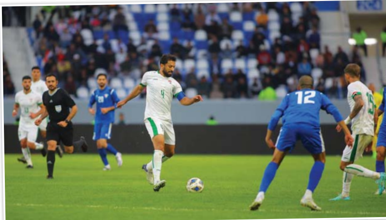
ثانياً الشق الهجومي: