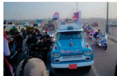
● تشهد ميسان اليوم عرساً رياضياً كبيراً

وسط ترقب واستقبال جماهيري حافل ازدادت شوارع مدينة العمارة بمحافظة ميسان بمظاهر البهجة والفرح، إذ تقدم فرسان اتحاد الفروسية وهم يمثلون الخيول في عرض بهيج وبمشاركة اتحاد الدرجات العراقية المكللة بأعلام عراقية وبإتباع نابوية زينت سماء المحافظة انطلاقاً من الموصل، مروراً بمحافظات عدة عبر جولة ترويجية لاستضافة البطولة التي ستعقد في البصرة في السادس من الشهر الحالي من جانبها، استقبلت قيادة عمليات ميسان وفد باص الخليج الذي وصل ميسان ليوم جولة في المحافظة غاية في عدم بطولة كأس الخليج العربي، وقال قائد عمليات ميسان اللواء الركن محمد جاسم الزبيدي - الصباح - تقف دعماً وتشجيعاً لتنظيم البطولة التي ستقام في محافظة البصرة، لأنه حدث وطني. واستقبل قائد عمليات ميسان اللواء الركن محمد جاسم الزبيدي وفداً رياضياً على متن باص كأس الخليج، إذ أمر بتوفير الحماية اللازمة لتسيوف المحافظة خلال إرجائهم جولة بالباص في مدينة العمارة وقال قائد شرطة ميسان اللواء ناصر عبد اللطيف الأسدي - الصباح - إن