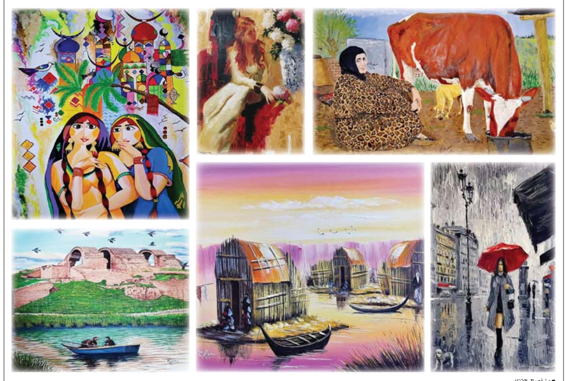
من أعمال الفنان

دهشة قرينة للتأمل، فطريقة مزج الألوان والخطوط كانت ملفتة وفيها خليط من الخيال والحقيقة وكذلك الحال بالنسبة للوحة التي تجسد المرأة العراقية، إذ