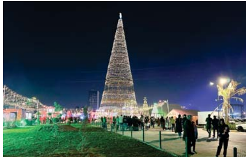
● توجدت الدعوات والأمنيات في أن يعم الخير ربوع البلاد

أجواء من الفرحة والبهجة والسرور زينت أوضاع شجرة الميلاد بأبهى صورة وسط شارع الخزانة في أربيل استقبال عراقيو مدن إقليم كردستان برهفة القادمين من مختلف المحافظات العراقية السنة الميلادية الجديدة.