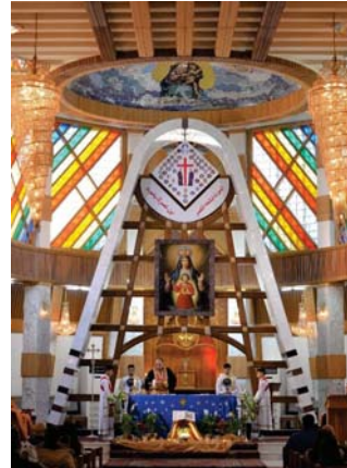
● مطرانية سيدة النجاة

أقيم قداس رأس السنة الميلادية في مطرانية سيدة النجاة بالكرادة ليلة السبت، وروى رئيس طائفة السريان الكاثوليك المطران يوسف عيا، قصة ولادة السيد المسيح عيسى بن مريم عليهما السلام، بترايم إنجيلية مهيبه القديسة: «حضره ملاك الرب وأشرق حوله، فقال: لا تخافي، أشرقك بفرح عظيم». مع نفسى، متجهاً إلى كنيسة انتقال مريم العذراء في المنصور، أردت، ستجدون طفلاً ممتحماً تحف به ملائكة السماء، مسيحين، المجد له في العال وعلى الأرض السلام. في «انتقال مريم العذراء» قدم موكب