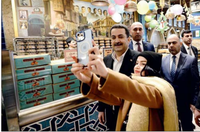
● مواطنة تلتقط سفيش مع رئيس الوزراء