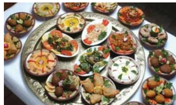
الإقبال على الأطعمة والحلويات الشامية واسع

فرصة الإطلاع على العالم وثقافته، أين الشام لا سيما أن المطبخ هو سمة الشعوب الأساسية ويمارس دوره ويسهم بشكل كبير بكرة قيود التزمتم الذي لحظاً زرعته التقاليد. وفي العودة لتراث الشعبي ارتبط الطهي بكلاسيكيات المدن وأحاديثها، تبعاً للأمكنة والجو وما يعطيه، وبحسب السوربة والحلويات الشامية وأما هذا ما جذب السوريين وأصحاب المشاريع التجارية لاستثمار هذا القطاع، ويتناهي ليس بالعرف أن يحدث هذا في عصر التكنولوجيا والعدالة التي أتاحت