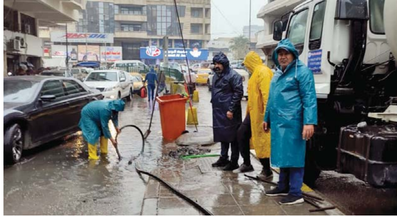
● استنصار حكومي لتصريف مياه الأمطار