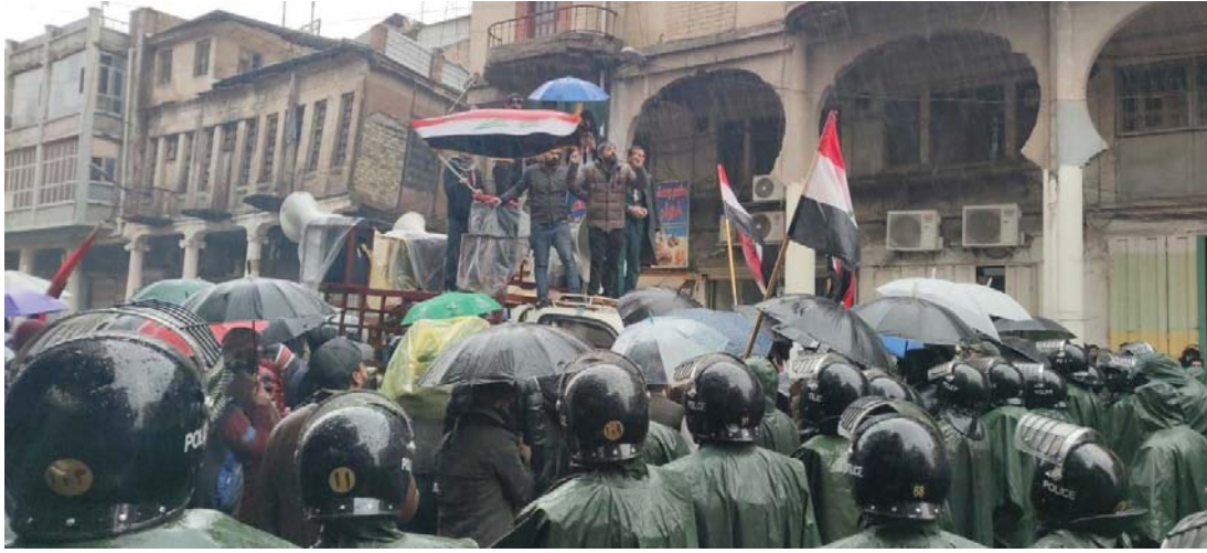
● تظاهرة أمام مبنى البنك المركزي للمطالبة بخفض سعر صرف الدولار الأميركي مقابل الدينار، أمس الأربعاء.