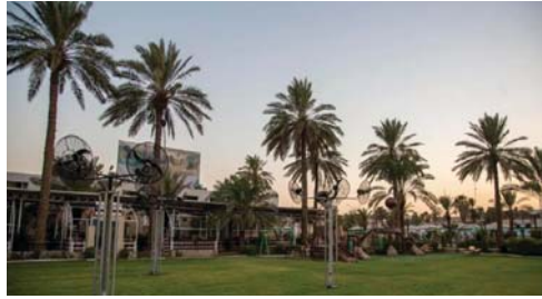
النادي يستقبل بعيد الجيش العراقي

تمكنت من اعتقال (123) ألف واحد منهم، وقُتل (412)، والاستيلاء على عدد من العصبي (3) أكداً من الحجارة، وقراءة (1213) لافتة. في بلدان العالم الثالث يصعب الحديث عن الديمقراطية بمعانيها الشاملة، إلا باستثناءات نادرة جداً أبيض البلدان في مقدمتها العراق إذ أتحت التطبيقات الديمقراطية (الشاملة) فرصة ذهبية لرسم صورة مشرفة، وخير دليل على ذلك أن المواطنين منذ عشرين سنة يتظاهرون أمام هذه الوزارة أو تلك المؤسسة أو الدائرة الحكومية، وهم خرجون بطاؤون بالنسب، ونسوان متظاهرات بالملساء، ورجال يتظاهرون ضد العنف الأسري، واعتصامات ومظاهرات بالكويت، والسكن والخدمات، وقطع طرق وحرق (تايربات)، وحقائب وحقائب الدوائر الخ. ومع ذلك فإن (المسؤولين والوزارات والمؤسسات والدوائر الحكومية) وفرت لهم سبل التعبير عن آرائهم بأعلى درجات الحرية وأسمى معاني الديمقراطية، وبالطبع لا يجوز، وليس من الديمقراطية في شيء، أن يتمتع بها المسؤولون المتظاهرون أو المعتصمون، ولا يتمتع بها المسؤولون لأن حصولهم على المنصب يعد حصوله، وهو موطن مثل الآخرين، ومن حقه المتع بهذا الحق الدستوري، ومن هنا - بعد أن مرع عين المواطنين حقوقهم الدستورية في التعبير عن آرائهم - فقد مارس بدوره هذا الحق الشخصي، واكتفى بمشاهدة التظاهرات والاعتصامات، وسماع طلبات المتظاهرين، ولم يفتح منها طياً واحداً، لأن مهمته الرئيسية هي المشاهدة والاستماع فقط، ولن ينفذ أي طلب حتى لو تواصلت التظاهرات والاعتصامات عشرين سنة أخرى.