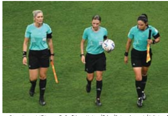
مباراة الأولى من نوعها وتاريخ كأس العالم بطاقتهم تحكيمى بالكامل، من السيدات