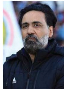
● البصرة، موفدو الصباح