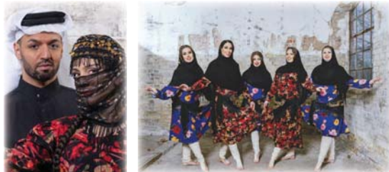
• فكرة التأسيس جاءت من تاريخ وتراث فوي