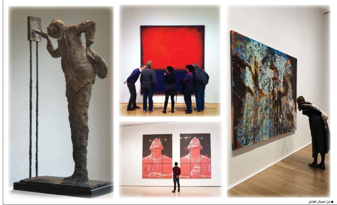
من أعمال الفنان

ولكن هو بحث لا بد منه لتوضيح صورة ما حدثت تصف أو يفرض عليها الوقوف في الجانب المظلم أو تفتل الأبواب عليها بدواعي الصلح. العامة.. لكني سأحاول الاختصار قدر المستطاع. علينا أن نعرف أن ثمة نوعين رئيسيين من