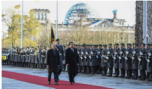
رئيس الوزراء والمستشار الألماني يستعرضان حرس الشرف