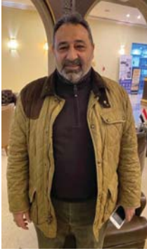
● البصرة، موفدو الصباح

بارك كابتن منتخب مصر السابق مجدي عبد الغني للعراق وشعبها وحكومة وزارة شباب واتحاد كرة على النجاح الباهر لبطولة كأس الخليج 25، مشيراً إلى أنه لم يكن يتوقع أن تصل البصرة وباقى المدن العراقية (الذي الأول وأكثر) لاسيما وأنه زار بغداد سابقاً خلال تصفيات كأس العالم، متمنياً أن يصل المنتخب العراقي إلى نهائي كأس الخليج ليكمل حلقات نجاح البطولة. وقال اللاعب مجدي عبد الغني لـ (موفدو الصباح): إنه حضر إلى البطولة بدعوة خاصة، وإن البصرة محافظة فيها مناظر جميلة وطبيعية، و(الكورنيش حالة رائعة والاستادات التعمت بشكل شيك جداً)، بينما أهدر التنظيم وحفل الافتتاح كل من شاهدهما سواء في الملعب أو عبر شاشات التلفاز. مؤكداً أن هذا النجاح سيعيد العراق مرة ثانية لحوض ميازيته الرسمية على أرضه وبالتالي فإن أسود الرافدين سيكون رقصاً صامياً على الخارطة الآسيوية بموازرة جماهيره الكبيرة وثأراً مؤكداً من أن المنتخب العراقي سيكون أحد المنتخبات المتأهلة إلى نهائيات كأس العالم المقبلة. وتعددت كابتن منتخب مصر السابق عن المستويات الفنية للفرق المشاركة في خليجي البصرة، قائلاً: شاهدة لاعبي المنتخب العراقي كيف أن لديهم الروح والإصرار على تحقيق الفوز على السعودية برغم الأمطار الغزيرة، بينما تفاوتت باقي المنتخبات من ناحية مستواها الفني من شوط إلى آخر، وأيضاً برزت بعض المواهب الخليجية التي لا اسكان أن تحجز مقعدها في منتخبات بلدانها، وأكد في ختام حديثه على إمكانية نجاح العراق في استضافة بطولات أكبر من كأس الخليج لاسيما وأن البصرة وبغداد ومدينتان كبيرتان وإسكان الاتحاد العراقي تقسيم الجامع عليهما.