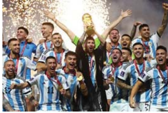
استضافة قطر للمونديال الأول الذي يقام في بلد عربي ويمتددة الشرق الأوسط

ها قد ودعنا العام 2022 ولم يبق لنا منه غير ذكرياته، ومع أنه مَرَّ بشكل عاصف وسريع، إلا أنه بكل ما شهدته وحمله لنا من أحداث وإنجازات ومواقف، يمكن أن نطلق عليها تسمية "قطاعات تحول"، اخترنا منها "22" -حدثا بعضها سياسي وآخر علمي وربما اقتصادي وغيرها، لكن ما جمع بينها كلها، هو أنها حدثت "لأول مرة" -في العام 2022 لتستكشف ما قد تعنيه، "لحظات حاسمة" من عام مضى، للعام الجديد 2023. • تريشيا تيساك • ترجمة واعدا: ليندا أدور