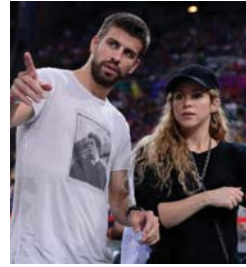
التضامن شاكيرا وبيكيه

وأطلقت الاثنين الماضي حملة دعائية عن الأغنية شملت تخطيط طائرة مع لافتة كتب عليها جملة من العمل (ذئت مثلي ليس لرجل ملك) فوق منتجج "مار ديل بلاتا" الساحلي في الأرجنتين. وانتشرت مواقع مواقع التواصل تعليقات وأراء تتمحور