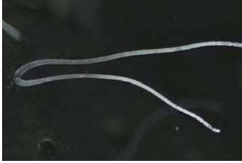
بكتيريا عملاقة ترى بالعين المجردة