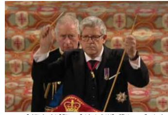
يث مشر كهد عملا المكتب كإشارة على نهاية عهد الملكة اليزابيث الثانية