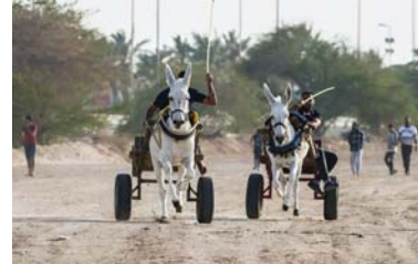
• بعيداً عن ضجيج محركات السيارات