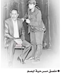
● ملصق مسرحية ابصم