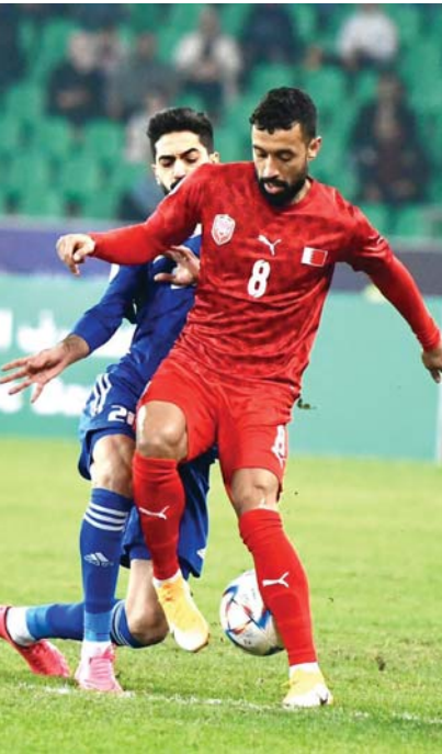
● بغداد، الصباح الرياضي

بارك كابتن منتخب مصر السابق مجدي عبد الغني للعراق وشعبها وحكومة وزارة شباب واتحاد كرة على النجاح الباهر لبطولة كأس الخليج 25، مشيراً إلى أنه لم يكن يتوقع أن تصل البصرة وباقى المدن العراقية (الذي الأول وأكثر) لاسيما وأنه زار بغداد سابقاً خلال تصفيات كأس العالم، متمنياً أن يصل المنتخب العراقي إلى نهائي كأس الخليج ليكمل حلقات نجاح البطولة. وقال اللاعب مجدي عبد الغني لـ (موفدو الصباح): إنه حضر إلى البطولة بدعوة خاصة، وإن البصرة محافظة فيها مناظر جميلة وطبيعية، و(الكورنيش حالة رائعة والاستادات التعمت بشكل شيك جداً)، بينما أهدر التنظيم وحفل الافتتاح كل من شاهدهما سواء في الملعب أو عبر شاشات التلفاز. مؤكداً أن هذا النجاح سيعيد العراق مرة ثانية لحوض ميازيته الرسمية على أرضه وبالتالي فإن أسود الرافدين سيكون رقصاً صامياً على الخارطة الآسيوية بموازرة جماهيره الكبيرة وثأراً مؤكداً من أن المنتخب العراقي سيكون أحد المنتخبات المتأهلة إلى نهائيات كأس العالم المقبلة. وتعددت كابتن منتخب مصر السابق عن المستويات الفنية للفرق المشاركة في خليجي البصرة، قائلاً: شاهدة لاعبي المنتخب العراقي كيف أن لديهم الروح والإصرار على تحقيق الفوز على السعودية برغم الأمطار الغزيرة، بينما تفاوتت باقي المنتخبات من ناحية مستواها الفني من شوط إلى آخر، وأيضاً برزت بعض المواهب الخليجية التي لا اسكان أن تحجز مقعدها في منتخبات بلدانها، وأكد في ختام حديثه على إمكانية نجاح العراق في استضافة بطولات أكبر من كأس الخليج لاسيما وأن البصرة وبغداد ومدينتان كبيرتان وإسكان الاتحاد العراقي تقسيم الجامع عليهما.