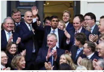
سونك بيدخل التاريخ كأول ملون شموسى يرأس الحكومة وأغنى من الملك