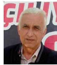
● نفاق عبيد ذيب