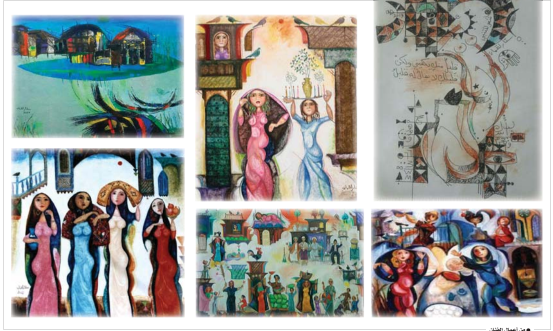
● من أعمال الفنان

يعد ستار لقمان، من جيل العقد الستيني، وأكثر الفنانين مواصلة ومحافظاً للمدرسة (الجرادية) - نسبة إلى الفنان جواد سليم - وتستكأ بأبداعها الفكرية وطرزها الفلكلوري الفني، وإد تبتغنا أعمال تجريبته، سنتلمس ذلك جنباً في تجسيد تلك المعاني الجميلة والتصورات الرائعة، التي أسسها جواد سليم، كونها قد حملت فيها جملة من المبالغات اللطيفة، هي النسب الأكاديمية وسياسة التصميم ووضوحه والمعادلات المتوازنة في الشكل والألوان الشرقية المتضمنة عن المنمنمات الإسلامية، التمتعة، هنا وهناك. وشيئاً ما من مرجعيات صور الفنان (الواسطي).