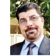
هشام الشديدي: إعطاء صلاحية لرئيس مجلس الوزراء في تعيين المحافظين ويصبح المحافظ مسؤولاً عن عمله وهو من يتحمل قانونياً أي تصغير في الأداء