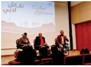
● العمل يجسد التفاعل بين جنس الفكر والأشياء