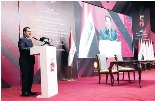
● السوداني يعلن عن مشاريع قائمة في الخدمات والسكن والصناعة