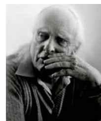
● بول غريسي

أما ما يخص التوقع الدلالي المتعلق بالمعنى فقد أشار إليه بعض البلاغيين وفهمه على