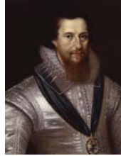
• إيرل سكس

لغة نضاج التوم على سريز السلطة، لم تقرب من الشعر. سماء الشعر زرقاء، وأرضه بلون الماء، وبين السماء والماء امتدت تجارب الحياة من دون أن ترتكب مجازة التنديس بالمذم. هذه وقائع الشعرين والشعورين التي كانت دوماً لا يخلطهم بدوي الموهب، ولكن شعري وشموربي السطوي الفاضحة المتأخرين أسقطوا حصانة الروح المرهفة لا تدم تحت تأثير المواقع المتقدمة، تراجع سامي مهدي، مبكراً عن ضفة العباد الشعري، لم