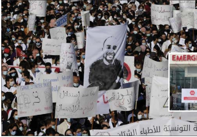
احتج أطباء تونس وشبان عام 2020 على ظروف العمل الخطرة، بعد وفاة أحدهم سقوطاً في بئر المصعد