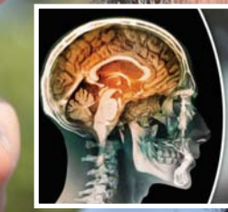
• المدخنون بمرحلة منتصف العمر معرضون للإصابة بالتدهور المعرفي

هل أتت من مدخني السكاثر ولا تزال في العقد الرابع من عمرتك؟ إن أنت معرض للإصابة بالتراجع أو التدهور المعرفي، هنا ما كشفت عنه دراسة حديثة واليك التفاصيل.