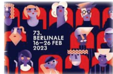
● بوستر المهرجان