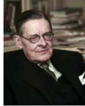
• تي إس إليوت