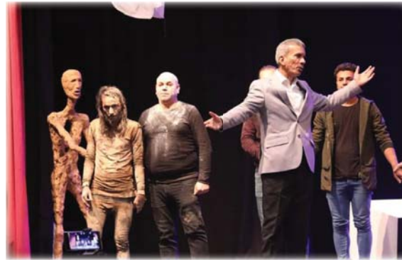
● من أعمال مرزوق المسرحية