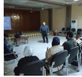
● استمرت أعمال الورشة لمدة عشرة أيام