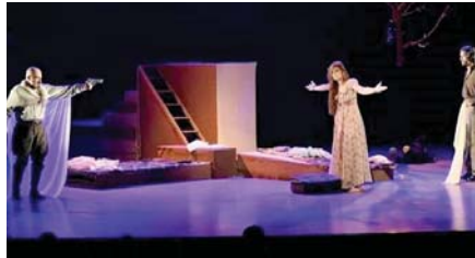
● من فعاليات مهرجان بغداد الدولي للمسرح

كتفتي من خلال لجان المشاهدة التي تختارها وكما هو المتعارف عليه مع بعض المقيمين بعروض المسرحية التي تفرغها من عروض المحفوظات أن تورطت ثم تتلقت بمهرجان تدفع لمن ينظر له ويطلب لنجاحه من المندملين وتغض النظر في الدفاع عن عمل واجتهاد وتجز من فنانين وثقافة وفنيين وتقنيين، وتغض مجموعة في ذرة الضوء ترضى نفسها بما قام المأمولون من جهد وتعب واجتهاد وسبير.