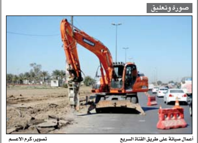
صورة وتعليق أعمال صيانة على طريق القناة السريع

شكا لنيف من الموظفين المولدة ورايتهم لدى المصرف العراقي للتجارة (TBI) من بغداد وعدة محافظات من انتهاء صلاحية بطاقتهم المصرفية الـ (الماستر كارد) منذ أكثر من شهر وهي أعقاب نهاية الشهر الثاني، فالتين في شكواهم التي وصلت "الباب المفتوح" لم نستطع تسليم روايتنا الشهرية، لانتهاء صلاحية بطاقتنا، وعند استفسارنا، قالوا لنا إصدار البطاقات متوقف من شركة ماستر كارد في البحرين، إلا أننا وجدنا تقصيراً بعدم دفع معاملات إصدار بطاقات جديدة، علماً أن دولتنا المالية قامت بإرسال كتب بأسماء الموظفين الذين سنتهم بطاقتهم