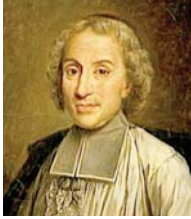
● كلود فردي

ثلاثة مؤلفين حطماً تعليمية للفئات الصغيرات. بادئ ذي بدء، نشر ريمو ديوس والمؤرخ كلود فردي رسالته حول طريقة الدراسة في عام 1685. وقدم للفتيات خطة تعليمية احتل فيها التعليم الديني المركز الأول، أكثر منه عائلانياً. بعد ذلك يعانين في عام 1687، كتب اللاهوتي فيليون أن "ما من شيء أكثر اهملاً من تعليم الفتيات". ينطبق الأمر نفسه على روسو الذي لا يزال يحدد مكاناً دقيقاً وتقليداً للمرأة في عام 1762 في إميل أو التعليم.