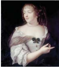
● مدام سيفيني

في القرن الثالث عشر، تغير وضع المرأة حيث كان عليها أن تخضع تدريجياً للكنيسة وتقرر أن تقتصر على الصلاة، مما يحدد من تعليمها تدريجياً.