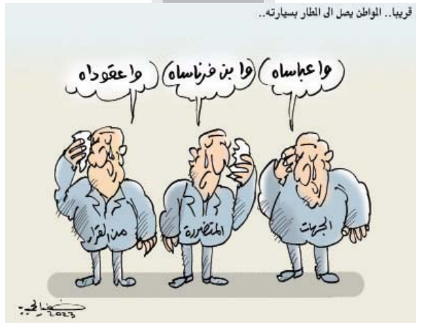
قريبا.. المواطن يصل إلى المطار بسيارته..