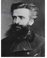
● غوستاف لوبون

تصنع؛ بل تراهم فعلاً نبيلاً والجانب المادي له تأثير في تشكيل روح الجماعة تجاه عنصر الرضا، إذ الثاني لهم القابلية على تناسي كل المواقف والأحوال؛ وتكتمه لا يستطيعون تناسي ما يتسل من أجلهم، وغالباً ما كان هذا الأمر دافعاً لتوليد الحجج المغزوية والأدبية التي تبسّر سلوك الجماعات لعالة الرضا والتكفل النفسي والفعلي. المحرضون يستغلون مثل هذه الدوافع للتأثير في سلوك الجماعات النفسية.