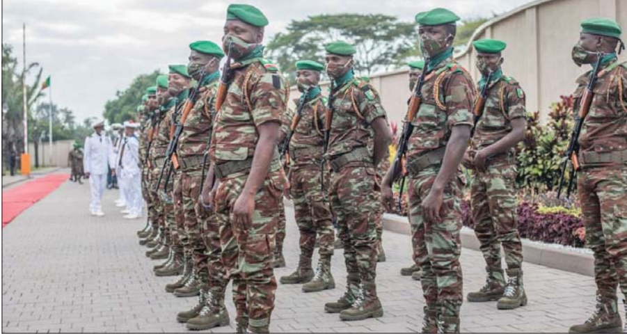
● جيش بنين يجند المزيد من القوات لمواجهة الجماعات الإرهابية

مر أكثر من عام على شن الجماعات الدينية المتشددة لأول موجة أعمال عنف ليلية الراهب "بغور كاسا" الواقعة شمالي دولة بنين، لكن الرجل ما زال يعيش حالة من الخوف. بحياته التي كانت سابقاً تنعم بالسلام، تتميز حالياً بمكالمات هاتفية ملؤها التهديد، كما أن المتطرفين استمروا بتشويه ابواب الكنائس، مطالبين الناس بالرحيل، وتطارد مخبئة الراهب مشاهد جثث القتلى الذين سقطوا في الاعتداءات.