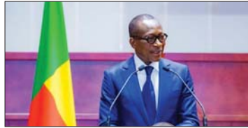
● رئيس بنين باتريس تالون يوجه خطابه لشعبه

الاجتماعي، وسوء التحكم بالموارد الطبيعية، وتحتاج المنطقة لزيادة الإنفاق على التعليم والتربية والصحة في المناطق المعادية لمنطقة الساحل، بحسب وكالات الإغاثة لأجل تخفيف المماناة الإنسانية مقابل تزايد العنف، ويقول بعض السكان أنهم يتم إرغامهم على القبول بعبادة لم يتقبلوا مطلقاً أنهم قادرون على تحملها. يقول أنزو هاوتنو، الجيسر بالأمن الوطني للأستاذ، وربما بسبب سداجة معينة بأننا يمكن أن نهرب من التهديدات، ومن الهجمات شبه اليومية تقريبا، التي تعاني منها بنين حالياً التي كانت تثير عن إرهاب منطقة الساحل، رغم قربها الشديد من نيجيريا وبنين فاسو، لكن الحقيقة فرضت نفسها. صحيفة لوس أنجلوس الأميركية