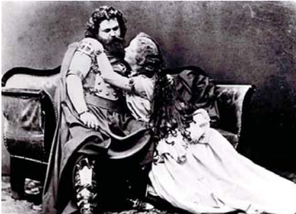
● قصة الحب المزعزعة الخالدة تريسبان وايزولت

كانت العصور الوسطى فترة متناقضة في ما يتعلق بصورة المرأة، فبه تمتع نساء الطبقات الدنيا، ومعظمهن ريفيات، بحرية معتدلة في فرنسا وتعتبرن وأشدات من سن الثانية عشرة، مما يسمح لهن بالالتحاق بمكاتبهن والزواج وحتى التصويت. ويعتقد بأن بعض الرجال سواء في الحقول أو في المدينة، كما أنهم يقضين الكثير من وقتهم في رعاية صغارهم. من ناحية أخرى، تصور الأدب المرأة في المجتمع بطرق مختلفة، استناداً على طرف كل منهما. من ناحية، يتم تقييد النساء كخادمات ودايخين وطرف مغمضة متواضعة، كما في تريسبان وايزولت (1170). إذ يقدم لنا بيرون رؤيته لامرأة الشعب على أنها فقيرة وأحياناً متعبة ومع ذلك، فإن هذا لا يمنعهن من لعب أدوار أساسية. يمثل بعض الأعمال عبر التاريخ، من ناحية أخرى، مثل التصوف الإسلامي في العصور الوسطى نساء أكثر نبلا، في شكل نكات أو محاربات. إنهن شخصيات أسطورية أو إلهية، مثل نساء الألمانزونات والسماوات الجديدة للمحاربات اللاتي يخشن الصناعات البشري. وهناك جانب بارز بشكل خاص في تلك النكات واحد من أشهر الفارسايات في التاريخ. خلال هذا الوقت، أجبرت الأوثية والحروب النساء الفقيرات على ممارسة أعمال غير مناسبة من