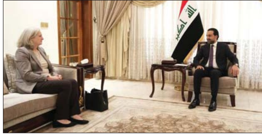
● الحلبوسي يستقبل رومانوسكي

بحث رئيس مجلس النواب، محمد الحلبوسي، مع السفيرة الأميركية لدى العراق أليسا رومانوسكي، أمس الأربعاء، نتائج الزيارة الأخيرة للوفد العراقي الرسمي إلى واشنطن، وذكر بيان للدارة الإعلامية للبرلمان، أنّ الحلبوسي، استقبل رومانوسكي، وجرى خلال اللقاء بحث نتائج الزيارة الأخيرة للوفد العراقي الرسمي إلى واشنطن، والخطوات القادمة لتعزيز الشراكة القائمة بين البلدين في مختلف المجالات ومنها الاقتصادي والأمني.