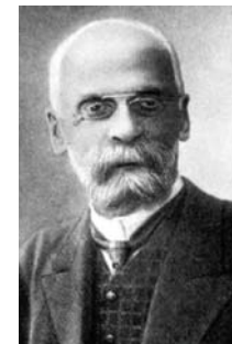
● اميل دور كايم

ببملا لا تعرف نحن الكثير عن أنفسنا، ونجمل بشدة روح الجماعات، وما لها من قوة تدميرية، أصل فيها من قدرات عبقرية في أصل كل حساب حضاري مكن. التاريخ لا يعيد إنتاج أخطائه إلا بسبب الجهل بعوامل نشوء الجماعات النفسية، أما وجود الأفكار والأحداث فما هي إلا نتيجة. لذلك نحن نسمي ونقدم التصريات من أجل النهوض من بين زمام أسانها؛ لكن ليس لدينا التفكير العذري الذي تفهم منه داتاها، وطباطنا وطرفها. بل نضع لأنفسنا جماعات نفسية سلبية، تتعارض مع جماعات نفسية أخرى في جميعها في الأصل من تنسيق واحد. وبهذا نحول روح الجماعات لدينا إلى طاقة مدمرة؛ بدلاً من أن تكون طاقة مغيرة ساعمة للحضارة والارتقاء المدني والثقافي والأخلاقي. أما اقتصر على إن محاورات التغيير - إذا ما اقتصر على نمط سطحي تلازمه قلة التكشاة وغياب القدرة الذهنية والفراسة - تنهني إلى بناء هوس؛ سرعان ما تعصف به التدميات، وبأن زوالها سريعاً، لأنها تنفرد إلى ما يستطه أسلمة الروح. روح الجماعات النفسية. استراتيجية تشكيل روح الجماعات تشكلت بناه، والألا فصول إلى اجتماعات التخلط والفضالة والمطل عن العطاء أمر لا مفر منه. رغم كل مكشبات الرفاه وطوفان الرغبة والتسلك التي أضحي الهدف الذي نسايق إليه الشعوب على حساب الكينونة والحضون.