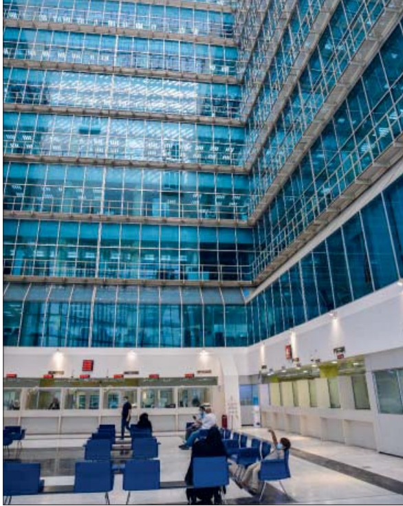
تصوير رقيب اموري