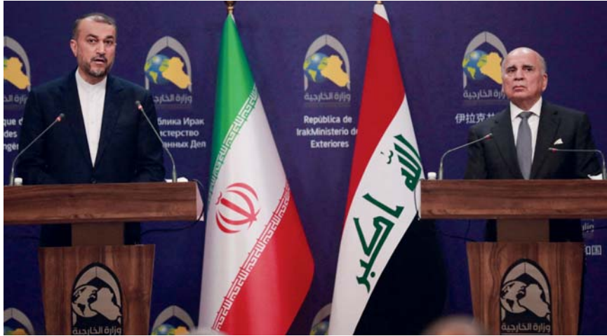
● بغداد - الصباح

استقبل رئيس الجمهورية عبد اللطيف رشيد، في قصر بغداد، أمس الأربعاء، وزير الخارجية الإيراني حسين أمير عبد اللهيان والوفد المرافق له الذي وصل للعاصمة بغداد بوقت مبكر فجر أمس، كما التقى الوزير الضيف رئيس الوزراء محمد شياع السوداني ووزير الخارجية فؤاد حسين. وذكر المكتب الإعلامي لرئاسة الجمهورية في بيان، أنّ رئيس الجمهورية عبد اللطيف جمال رشيد تلقى دعوة رسمية من الرئيس الإيراني إبراهيم رئيسي لزيارة الجمهورية الإسلامية الإيرانية. مبيناً أنّ ذلك، خلال استقباله في قصر بغداد، وزير الخارجية الإيراني حسين أمير عبد اللهيان والوفد المرافق له، حيث وعد رئيس الجمهورية بلطيفة الدعوة في أقرب فرصة ممكنة. وأكد رشيد أنّ العراق وإيران بلدان جاران وترتبطهما علاقات تاريخية وأواسر مشتركة، إذ تلاهما في الحرب على صصايات داعش الإرهابية. وفي المنقطة، وتشجيع الركين إلى الحوار والتهدئة لحل الإشكاليات في القضايا الإقليمية والدولية، لافتاً إلى أنّ ترسيخ الأمن يتطلب تعاون جميع دول المنطقة.