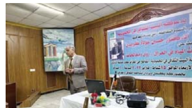
مجلس طرح الرؤى والمعالجات التي من شأنها الحد من التلوث