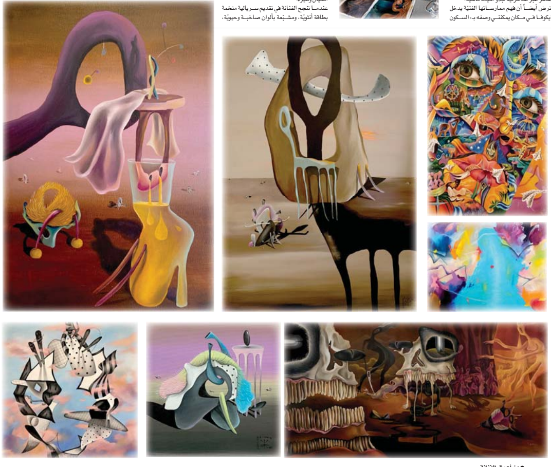
● من أعمال الفنانة

دالماً ما مستوحىنا العديد من الأعمال الفنية والرسومات السريالية التي قد تبدو لوهلة الأرسى كأنها حائكة ومهوسمة. لكن عند التركيز في ثيماها وأشكالها تتحول إلى تفاصيل مخيفة وربما غامضة تثير التوحش. تدعني هذه البداية إلى الاستعانة بأعمال الفنانة التشكيلية المعاصرة ريتا مايكيفا التي أجدها من الأمثلة الواضحة لسريالية الفولكلور الثقافي الظاهر عبر لغة مرئية تبدو أحياناً قاسية. أفتض أيضاً أن فهم ممارساتها الفنية يدخل مايكيفا في مكان يمكنني وصفه بـ السكون