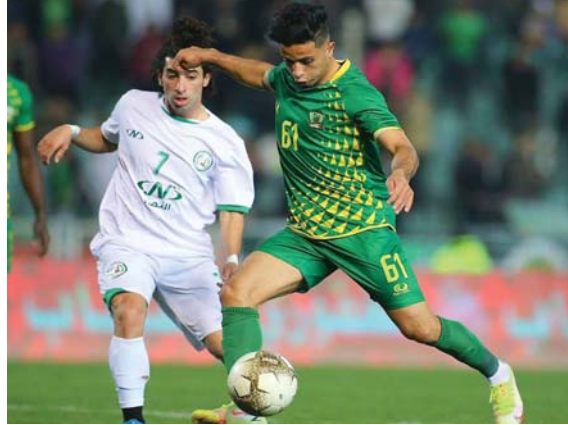
● بغداد، الصباح الرياضي

تطلق اليوم الخميس في ملاعب بغداد والمحافظات، مباريات الجولة الثامنة عشرة من منافسات دوري الكرة الممتاز، وذلك بإقامة خمس مواجهات، أبرزها لقاء الشرطة أمام نطف ميسان على أن تستكمل يوم غد الجمعة، بقية المباريات الخمس الأخرى، حيث يحط المنصهر الجوية رحاله في زاخو لمواجهة أصحاب الأرض، بينما يضيف الكرخ في ملعب الزوراء وخبراً يسافر الطلبة إلى محافظة أربيل لقابلة نوروز.