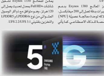
معالج سامسونغ Exynos 1380

أكدت شركة سامسونغ إطلاق معالجاتها الجديدة من سلسلة Exynos وهما Exynos 1380 و Exynos 1380 Gal، للمعالجات الهولتف الذكية من سلسلة Galaxy A. وهي الفئة المتوسطة. يأتي المعالج Exynos 1380 بتقنية 5 نانومتر وهو مزود بأربع نوى من نوع ARM Cortex-A78 بتبردد 2.4 جيجاهرتز، وأربع نوى من نوع ARM Cortex-A55 بتبردد 2 جيجاهرتز، ووحدة معالجة الرسومات Mali-G68. ومزود بمعالج 950 ميجاهرتز. يمكن لهذا المعالج تشغيل شاشات Full HD+ بمعدل تحديث يصل إلى 144 هرتز، وهو متوافق مع ذاكر الوصول العشوائي من نوع LPD-DRAM و LPDDR5 وأيضا التخزين بتقنية UFS 3.1. يتميز المعالج Exynos 1380 بدعم الكاميرات بدقة تصل إلى 200 ميجابكسل، ومثلا له لوحدة معالجة عصبية (NPU) مخصصة للذكاء الاصطناعي كما يأتي مع معالجات Exynos 1330 لتشغيل