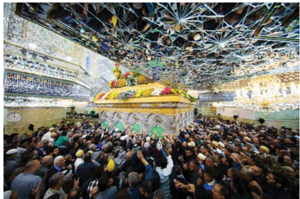
● الزوار يباركون ذكرى ولادة الإمام الحسين بن علي (ع)

بيان ختامي وأعلن بغداد، بالإضافة إلى قرارات اللجنة السياسية وقرارات لجان المرأة والطفولة والمالية والاقتصادية. وأشار إلى ضرورة التعاون والتكاتف في ما يتعلق بـ الملف الاقتصادي، إذ ستكون هناك لجنة أساسية بمهمة مالية واقتصادية وسيكون لها اجتماع وتحتد قرارات مستوى الطموح العربي. دعم عربي ومنذ تأسيسه في العام 1974 كان الاتحاد البرلماني العربي مركزاً للتعاون والتضامن كما تضافت عليه ديباجة أهدافه، وكان الاتحاد قد اتفق في دورته الماضية على انتخاب رئيس