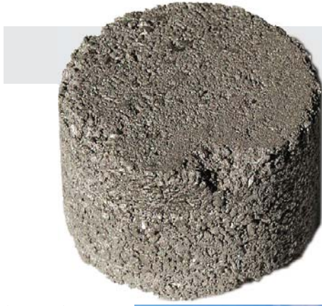
مثل وزارة الدفاع أوزارة الداخلية أو البيت الأبيض.

أسفر الدعم الغربي لأوكرانيا على مدى العام المنصرم عن ربط الولايات المتحدة وحلفائها في الاتحاد الأوروبي وحلف شمال الأطلسي، «الناتو» بمصير كييف ارتباطاً لا انفصام له، لأن الغزو الثاني الذي شنه الرئيس «فلاديمير بوتين» على هذا البلد قد ارتد كما يبدو ويتأخّر عكسية، فدفّع بأوكرانيا إلى احضان المجتمع الأوروبي الأطلسي أكثر فأكثر كما رسخ طموح كييف في اكتساب عضوية الاتحاد الأوروبي وحلف شمال الأطلسي. ثمة مسعى جديد لا يزال في أول أطواره الآن في الولايات المتحدة والدول الحليفة لها من أجل تحديد وتطوير واستغلال موارد أوكرانيا الضخمة من معدن رئيسي له أهمية بالغة في تطوير التكنولوجيا العسكرية الأعلى تقدماً لدى الغرب، التي باتت عماد الردع المستقبلي بوجه روسيا والصين. والمعدن المقصود هنا هو التيتانيوم.