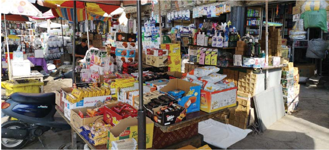
● انتعاش الحركة التجارية في بغداد بالتمزام مع الحزمة الثانية للبنك المركزي