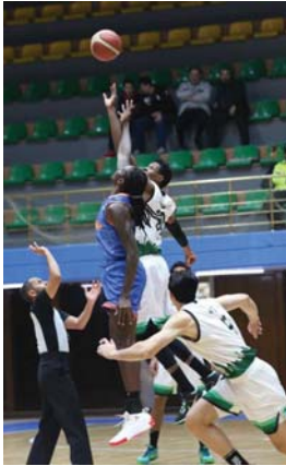
● بغداد، احسان الرسومي

تعاود عجلة الدوري الممتاز بكرة السلة دوراتها من جديد، بعد توقف استمر لأكثر من شهر إثر مشاركة منتخبنا الوطني في مناسبات التأهدة الثانية المؤدية إلى نهائيات آسيا. إلى ذلك تتواصل في قاعة الشعب والدرسة التخصصية اليوم السبت مباريات بطولة الجمهورية للشباب، وبحسب الجدول المعلن من لجنة المسابقات في اتحاد اللعبة، فإن يوم الثلاثاء المقبل سيشهد لقاء التضامن والنقطة في قاعة الأول، بينما تجري يوم الأربعاء مباراة الحلة والنقطة في قاعة الحلة تسبقها مباراة الفريقين في قاعة الشباب، وتشهد قاعة الشعب والدرسة التخصصية بغداد اليوم السبت مباريات الجولة الثانية من منافسات بطولة الجمهورية للشباب التي افتتحت أمس الجمعة، ويلعب في العاقد من صباح اليوم السبت في قاعة الشعب منتخبنا محافضتي كركوك وكربلاء للشباب نظماً مواجهاً منتخب أربيل مع نظيره بابل ويلتقي مع ميسان مع دهوك ثم بنين مع ذي قار ويلتقي أيضاً بابل مع بابل وكركوك مع أربيل، وفي العاقد التخصصية يلعب اليوم السبت في العاقد صباحاً منتخب القادسية مع السليمانية والبصرة مع المثنى، ويلتقي منتخب الأبار فريق بغداد وأجيراً بوجه واسط منتخب النجف. يذكر أن منتخبنا الوطني تأهل إلى التصفيات الأخيرة المؤهلة إلى نهائيات آسيا بعد أن حصل على المركز الأول في منافسات التأهدة الثانية التي اختتمت مؤخراً في قطر، كما حصل منتخبنا في عاقدية 3 × 3 على لقب البطولة العربية التي جرت مؤخراً على ضوء التصفيات الآسيوية.