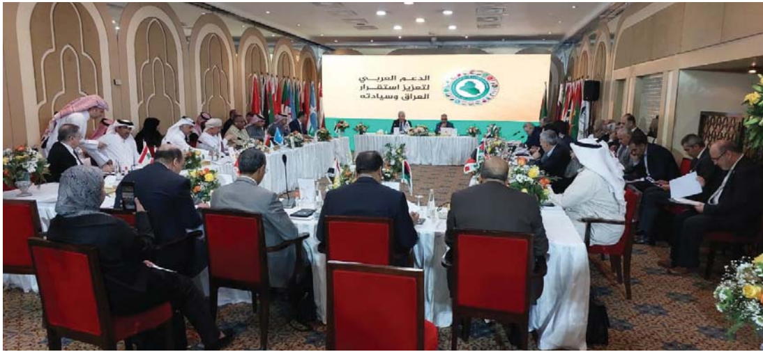
● بغداد: مهتد عبد الوهاب

مؤتمر سياسي عضو مجلس النواب الليبي وعضو اللجنة التنفيذية للاتحاد البرلماني العربي عبد السلام ناصية قال إن ما مطلوب تسليمة في هذا الطرف الصعب الذي تمر به الأمة العربية هو توطيد العلاقة بين الشعوب العربية من خلال البرلمانات العربية. إن أقدما في الاجتماع وضع استراتيجية لتعمل هذه العلاقات باحتوائها على آليات مهمة للتيسير العربي ولاسيما في المحافل الدولية مثل البرلمانات الدولية وتبادل الزيارات البرلمانية العربية وتفعيل الاتفاقيات الاقتصادية والتكامل الاقتصادي العربي. وأشار إلى أن العالم يمر بأزمة اقتصادية ولا يمكن لدولة بمفردها أن تخرج من هذه الأزمة لذلك نحن بحاجة إلى الحوار الاقتصادي العربي وعندما يكون الحديث على مستوى الشعوب العربية التي تمثلها البرلمانات سيكون أكثر جدوى من الحديث بين الحكومات لأن الشعوب أقرب دائما إلى بعضها وتجاوز المسائل السياسية وتفتي في المهوم المشتركة. وأكد أن الانطلاقة من بغداد تعجلا تتبادل وتعمل العمل العربي المشترك على مستوى البرلمانات العربية سيكون أفضل في المستقبل ولاسيما في وجود كل الدول العربية.