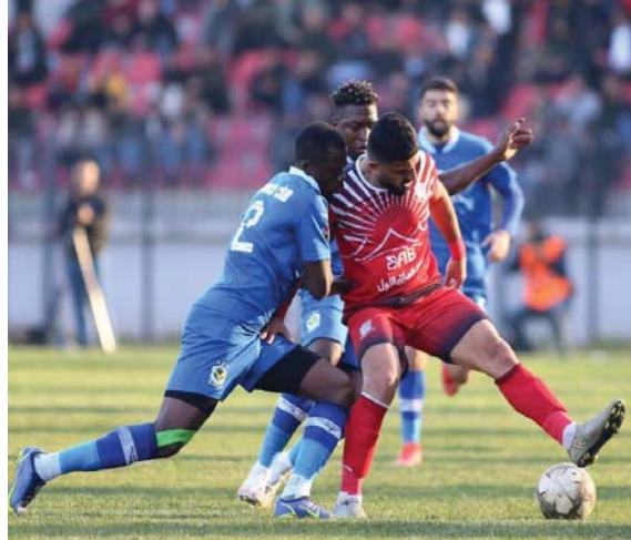
● بغداد، الصباح الرياضي