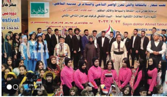
المهرجان يعكس ثقافات التنوع والاعتزاز بالهوية التراثية

ضمن خطة الضعيات الثقافية لدائرة العلاقات الثقافية انطلقت الخميس الماضي في محافظة كركوك فعاليات مهرجان الآخي السنوي بتسخته الثانية، متمسمة برنامجاً ثقافياً وفنياً شاملاً يعكس تراث مجتمعات ومكونات المدينة وفنون مبدعيها ليجسد صورة متكاملة عن نموذج يعتز به لمدينة تمتل مبادئ العيش المشترك في ظل قيم السلام والوئام والمحبة وتتنوع ثقافتها الزاخر.