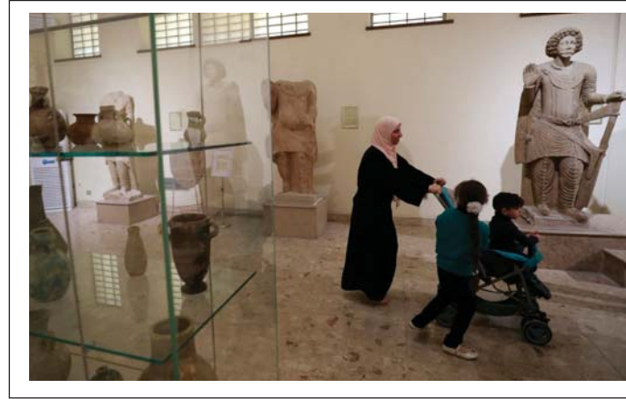
● المتحف العراقي يُفتتح أبوابه للزائرين مجاناً في عطلة نهاية الأسبوع