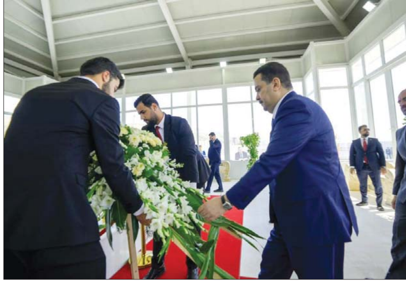
● رئيس الوزراء يزور ضريح الرئيس الراحل مأم جلال طرابلسي