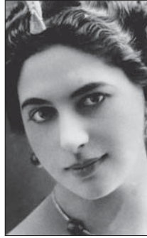
● ماما هاري

يشعر جهاز الأمن الداخلي في بريطانيا (أي أم فايفز - MI5) بالقلق أزاء موضوع الجنس. فمن خلال وثيقة مؤلفة من 14 صفحة كانت قد وضعت سنة 2009 على مئات المصارف والشركات والمؤسسات المالية البريطانية، بعنوان: "خطر التجسس الصيني"، قدم جهاز الأمن البريطاني الشهير هذا وصفاً لمساع صينية واسعة النطاق لا يترتبز رجال أعمال غربيين باستغلال علاقاتهم الجنسية. حدثت تلك الوثيقة بشكل صريح من أن أجهزة المخابرات الصينية تحاول غرس ما وصفته صحيفة التايمز اللندنية بأنه "علاقات جنسية طويلة الامد ثم استغلال جوانب الضعف المتولدة من تلك العلاقات للضغط على أشخاص معينين وجعلهم يتعاونون معها". على حد قول الصحيفة.