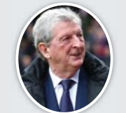
● لندن، أ ف ب

عين نادي كريستال بالاس الإنكليزي لكرة القدم أسن الثلاثاء، روي هودجسون مدرباً حتى نهاية الموسم، خلف الفرنسي المقال باتريك فييرا، ويبدو هودجسون توتنهام الذي للمرة الثانية بعد أن أشرف عليه بين أيلول 2017 وأيار 2021، وأقال بالاس فييرا الجمعة الماضي بعد سلسلة من النتائج السيئة في موسم النادي للبقاء بين الكبار هذا الموسم. ولم يحقق بالاس أي فوز في الدوري هذا العام وتعدوا في المباريات الـ12 الأخيرة، وقد مني بأربع هزائم تواليها، آخرها ضد أرسنال 1-4 التي أشرف عليها مساعد فييرا باتريك ماكارثي. وشهد هذا الموسم صراعاً معتمداً للبقاء، في الدوري الممتاز، إذ تفصل أربع نقاط فقط بين بالاس الثاني عشر وصاحب المركز الأخير. نقل بالاس عن هودجسون (75 عاماً) فوزه بأنه لشرف لبي أن يطلب مني العودة إلى النادي الذي يعنى الكثير بالنسبة لي، وأن يتم تكليفه المهلة المتمثلة بقلب الموازين هدفاً الوحيد الآن هو بدء الفوز بالمباريات وحصد النقاط اللازمة لضمان البقاء، في الدوري الممتاز.