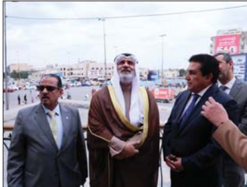
أمين منظمة أوبك زيور قاعة الشعب التي احتضنت اجتماع أوبك تأسيس عام 1960

سبب جائحة كورونا. وأشار الفيص إلى أهمية قيمة القنارات التي جرت مع رئيس مجلس الوزراء، ونايب رئيس الوزراء لشؤون الطاقة وزير النفط حيان عبد الغني، والتأكيد على أهمية تعزيز الدور المشترك في استقرار أسواق النفط العالمية. وعقد الفيص اتفاقاً أوبك من أهم القرارات التاريخية المهمة التي اتخذها أعضاء المنظمة لمواجهة التحديات المختلفة التي تعرضت لها أسواق النفط العالمية.