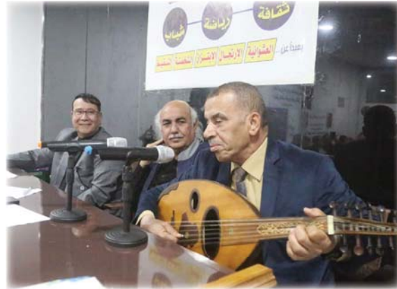
احتفاءً بالشاعر عزيز الرسام

في أمسية جمعت بين الشعر والغناء والموسيقى وبحضور عدد من الأدباء والشعراء والإعلاميين والمهتمين بالشأن الثقافي والفني ضيف مركز افرست للاعلام الشاعر الكبير عزيز الرسام للحديث عن تجربته الشعرية الممتدة لعقود وعن غريته بعيدا عن حبيبه بغداد.