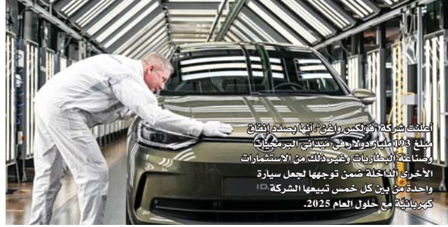
أنفقت شركة فولكس واغن وأنها بصدد إنتاج ما يقرب من 100 مليار دولار في مبيعات البرمجيات وصناعة البطاريات وكثيراً من الاستثمارات الأخرى التي لا تحصى ضمن توجهها لتجهيز سيارة واحدة من بين كل خمس تبيعها الشركة ككهربائية مع حلول العام 2025.