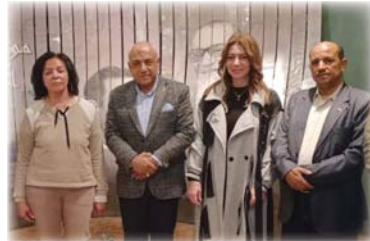
المتحف يعرض أزمدة وموقف الموسيقار