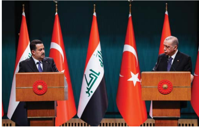
رغبة عراقية تركية جادة بعقد شراكة اقتصادية حقيقية

كما شهدت الجلسة استعراض سيل تفعيل اللجنة التنسيقية المشتركة بين العراق وتركيا، ودعم نشاطها. وكان رئيس الوزراء محمد شياع السوداني وصل على رأس وفد رفيع إلى العاصمة التركية أنقرة أمس الثلاثاء، في زيارة رسمية تستغرق يومين، حيث جرت له مراسم استقبال رسمية من قبل الرئيس التركي رجب طيب أردوغان، في قصر ييش تيه الرئاسي. وشهدت مراسم الاستقبال عزف التشيدين الوطنيين العراقي والتركي في القصر الرئاسي،