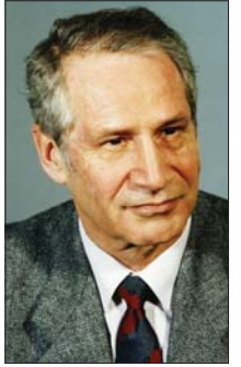
● ماركوس وولف (رجل بلا وجه)