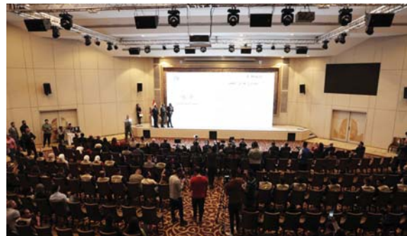
● إطلاق المنصة نقلة نوعية في العمل الخيري