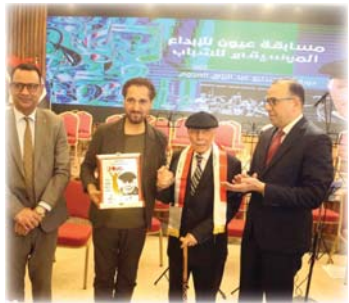
تكريم الموسيقار عبد الرزاق العزاوي

طالقات موسيقية شبابية من محافظات عراقية منها البصرة، الموصل، الأنبار، كركوك، إضافة الى العاصمة بغداد اجتمعت مساء الجمعة الماضي في قاعة كلية التراث الجامعة تعزف أعمالا موسيقية مؤثرة على مختلف الآلات الموسيقية الشرقية والغربية ضمن فعاليات مهرجان عيون ولإبداع الموسيقي للشباب والذي حضره عدد كبير من موسيقي العراق .