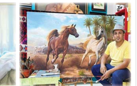
• من أعمال الفنان