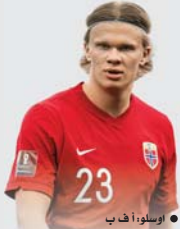
● أوسلو، أ ف ب

سبب الهجوم الغزير لإرنلنغ هالاند عن مباريات النرويج ضد إسبانيا وجورجيا في مسهل التصفيات المؤهلة إلى كأس أوروبا 2024 لكرة القدم، بسبب إصابة في الفخذ، وفق ما أعلن الاتحاد النرويجي لعبة أسن الثلاثاء. واشتكى هالاند الذي سجل منتصف الأسبوع الماضي خمسة أهداف مع فريقه مانشستر سيتي الإنكليزي ضد لايبزيغ الألماني في ضمن نهائي دوري أبطال أوروبا، أعقبها بثلاثية "هاتريك" ضد بيرتل في ربع نهائي كأس الاتحاد الإنكليزي، من ألم في الفخذ بعد المباراة الأخيرة، وقال الاتحاد النرويجي: إن ابن الـ22 عاماً غادر المسكر التدريبي للمنتخب في ماربيا في إسبانيا لتخضوع لمتابعة طبية مع تاديه.