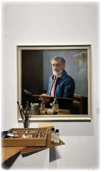
● من أعمال المعرض