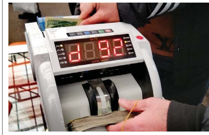
● سعر صرف الدولار أمام الدينار يسجل انخفاضاً في بغداد وأربيل