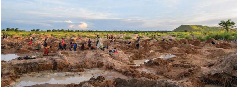
يقضي بعض السكان 12 ساعة يوميا في الوحل بحثا عن القصدير