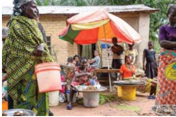
فقد جميع سكان مانغزو تقريبا مصدر رزقهم، وباتت البلدة في انحسار دائم