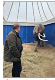
● الفيلة «بيبي» تبلغ من العمر 38 عاماً

تعد واحدة من الحدائق المسجلة عالمياً، ومركز إيواء وتكاثر للجوونات، كما وفيها عدد من المستشارين الألمان، وكان أنه قد تم اتخاذ القرار بأن يكون موطن الفيلة «بيبي» الأخيرة في حديقة حيوانات أربيل بسلام وطمأنينة ومن دون جهد وعمل، متفوهاً بأن الفيل يبلغ في سن 38 عاماً. وأوضح الطيار أن العمل جارٍ في حديقة حيوانات أربيل لتخصيص مكان ملائم للفيلة «بيبي» التي ستصل مع المديرة الخاص بها، مالك السيرك الذي كانت متواجدة فيه في فرنسا من أجل تدريب العاملين في الحديقة حول كيفية التعامل مع الفيلة، لا سيما أن الفيلة ودودة وتحب الناس ومسألة