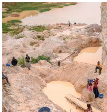
التنقيب عن القصدير مصدر دخل السكان الوحيد، إذ يقضون ساعات في الوحل ليكسبوا بضعة يوروهات يوميا

ببساطة لا تعطينا رخصة التعدين، ولا يُسمح لنا ببدء العمليات الآن. شرح تشيسكي للخصوم الخطبوط المبرضة للزراع؛ وهي محاولة معقدة نوعا ما. شركة «عمان AVZ» الكونغولية على خلاف ميوزس منه مع شركائها، كونغ ماوهواي؛ الذي يسميه الصيني في الكونغو، سايمون كونغ، يسود الاعتقاد أن هذه الشخصية اتصالات سياسية ممتازة؛ في كل من كين