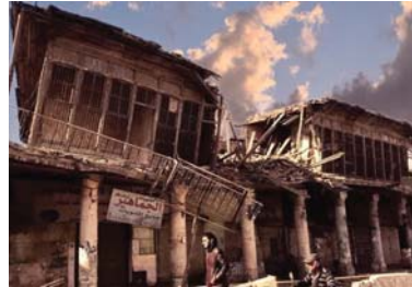
● هجر جزء من مسرح اثري في شارع الرشيد

يذكر أن العراق يضم أكثر من 14 ألف موقع أثري وتراثي مسجل، تعود إلى حضبة زمنية مختلفة، بعضها إلى ستة آلاف عام، وتعرض عدد غير قليل من هذه المواقع إلى تجاوزات وسرقة آلاف القطع الأثرية خلال الأحداث التي راقت سقوط النظام السابق عام 2003، وتضيقت مديرة الانتفاخ فضلاً عن التجاوزات وأعمال السرقة، فإن العامل الزمني أسهم هو الآخر في فقدان العديد من المواقع الأثرية والتراثية، نتيجة تأثر أسسها من العمان إلى أكسدة، والخشب إلى التآكل، وهو ما حدث مع منزل الشاعر الكبير بدر شاكر السياب في البصرة.