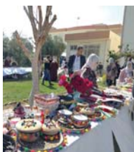
● المعرض لتوفير فرصة عمل للنساء