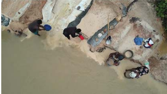
يعمل العديد من سكان مانغزو في مناجم صغيرة ويعدانها لا استخراج القصدير

الأكبر في صناعة الليثيوم، وتعتبر شركة CATL، الرائدة عالميا في إنتاج بطاريات السيارات الكهربائية، وقامت للتو بإنشاء مصنع ضخم جديد في ولاية تورينجا الألمانية؛ وهو الأول خارج الصين هنا أيضا أصبح الليثيوم المستخرج من مانغزو مطلوبا بشدة وليس سرا أن الصين ترغب أيضا بالسيطرة على كميات الوصول إلى المواد الخام؛ وتملك مانغزو فرصة متشابهة للقيام بذلك. كانت المناجم الصينية ناجحة في البدء؛ إذ إن تعدين الليثيوم مسألة مكلفة، وكان الاستراليون قد احتاجوا إلى مبالغ كبيرة لاستخراج الخزون لهذا الغرض. أيرمو اتفاقا في العام 2021 مع شركة تايبه لعملاق البطاريات CATL، استحوذت الشركة الصينية