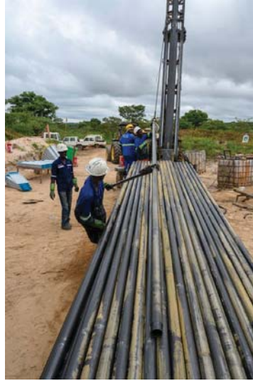
كسب سكان مانغزو رزقهم من تعدين القصدير، لكن المنطقة أيضا موطن لعن أكثر قبيحة لليثيوم

سرعا ما استغلت شركة AVZ، بقضايا متعددة؛ إذ طالب كونغ، المدير الصيني لشركة كينشاسا بامتداد بعض أسهمه؛ مؤشرا أنه قد جرى خداعه وكانت هناك مشكلات أخرى أيضا؛ إذ إن شركا آخر في الامتياز المشترك، وهي شركة التعدين الكونغولية «كومينير» Cominère (التي تسيطر