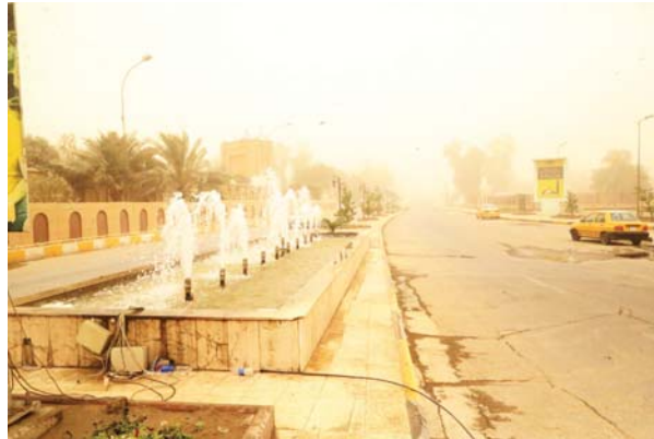
● أول عاصمة ترابية هذا العام تضرب بغداد وعددا من المحافظات