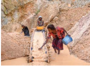
تهوى سعر القصدير وأوسط التماثلات، فافلس التنجم وتلاشي رخاء مانغزو

واضين الدور الصيني، لكنه مجرد نصر صغير؛ إذ إن للحكومة في المعاصرة كينشاسا رأيا أكبر بكثير من تلك المواقف التي يعبر الصينيون عنها في نهاية المطاف، إذ يعتبر الصينيون في العاصمة شركاء، مرخبا بهم؛ فهم لا يسألون العديد من الأسئلة ولا يتحدون باستمرار عن معارضة الفساد أو استدامة البيئة. لقد خلطت الشركة الاستراتيجية لاستخراج سيمتة أف طن من المعدن سنويا، حتى إن سعر أسهمها ارتفع إلى السقف بحلول أوائل العام 2021، لكن الإقبال الأولي تبعد منذ ذلك العن، وجرى تعليق تداول أسهم الشركة في البورصة الأسترالية انتظارا لحل النزاع بين الكونغو ووقفا لتقريرات إعلامية تسعد مجموعة من المستثمرين لرفع دعوى جماعية ضد شركة AVZ، زاعمين أن الشركة قسدت في تعريفهم بالخطر عند بلوغ الوقت المناسب؛ خاصة أنه من غير المحتمل بشكل متزايد أن تصدر كينشاسا رخصة تعدين، بينما لم تلق وزارة المناجم الكونغولية على الاستفسارات بهذا الشأن.