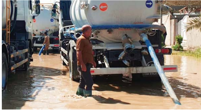
• مياه الأمطار تعطل الدوام لأربعة أيام متتالية

مع موجة الأمطار الأخيرة، وبينما تمّ تعطيل الدوام يوماً واحداً في عدد من المحافظات، عطلت محافظة الديوانية الدوام الرسمي حتى نهاية الأسبوع، بسبب فشل سحب مياه الأمطار من الشوارع، بينما أرسلت محافظتنا بغداد ودي قار آليات دعم، وطالبت النائب عن المحافظة نور نافع رئيس الوزراء بتشكيل لجنة عليا للتحقيق بتريدي قطاع الخدمات في المحافظة.