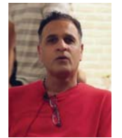
● للمخرج البحريني محمد القفاص