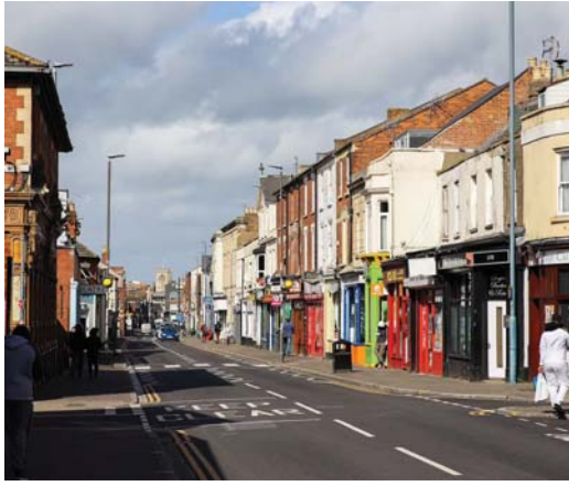
• سوبرماركتان وهمسرو لايكتراان بمخاضة الشارع سلفا