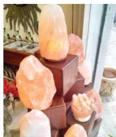
العديد من أنواع حكايات آسف لينة ولينة

السعادة أو الطمأنينة، وربما هناك تسميات أخرى يعصب اختلاف المكان، لكنها في النهاية هي ججارة ملونة