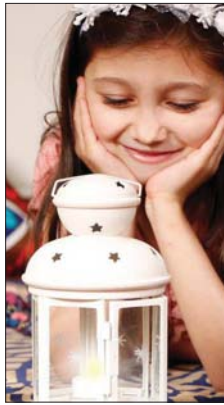
مشاركة الطفل في تحضير المائدة الرمضانية

والطفل حواراً حسن، أن الأمر يتطلب منا التنسيق، وأن يصوم على الأقل ثلاث ساعات يومياً، ثم زيارتها بحسب قدرة الطفل على التحمل مع الابتعاد عن أسلوب عقابته، وتأييده في حالة تناوله للطعام وهو صائم. وهي أم ثلاثة أطفال يحتاج أوقات السجور، يتسرع بدخله عادة محببة، وطاقة يخترتها للمستقبل، كما يجب الاهتمام بذاته وجملة صحيا.