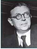
جان بول سارتر