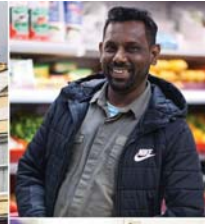
• متجر في شارع بارتون يبيع الطعام السوفالكي