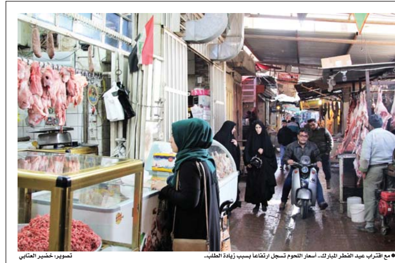
● مع اقتراب عيد الفطر المبارك.. أسعار اللحوم تسجل ارتفاعاً بسبب زيادة الطلب..