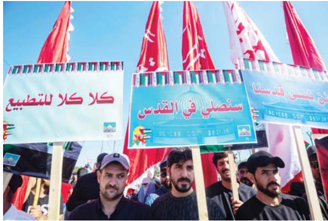
● العراق يجند التأييد على وقوفه إلى جانب الشعب الفلسطيني

وفي لقاء متصل بالنخالة، نقل بيان عن حركة الجهاد الإسلامي عن رئيس الوزراء محمد شيك السوداني، قوله: إن العراق وقواه السياسية