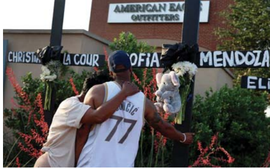
أقرب ضحايا حادثة مدينة آين بولاية تكساس

بلية من خلال تخفيف قوانينها الخاصة بالأسلحة، لتوافق على حمل السلاح من دون تصريح في العام 2017. وبحلول العام 2019، وجدت صحيفة "تكساس سيتي ستار" ارتفاعاً بمعدل يقارب 58 بالمئة منذ العام 2007، عندما أُلغيت القوانين الصارخ للشرطة. وطرح سؤال على الخبرة ماسيا، وهو كيف يمكننا مقارنة الولايات المتحدة ببقية العالم في ما يتعلق بالسلاح، تقول أنه فيما يتعلق بعنف السلاح، فأنت أكثر أماناً في كاليفورنيا مما أنت عليه في تكساس. لكذلك لا تزال أكثر أماناً في بلدان أخرى مما أنت عليه في كاليفورنيا. هذا لأنه، على حد قول أستاذ القانون بجامعة كاليفورنيا في لوس أنجلوس "أدم نيكلر"، فنظراً لكاليفورنيا أكثر قوانين الأسلحة صارمة في الولايات المتحدة، ولكنها بنفس الوقت تعد قوانين الأسلحة الأكثر تساهلاً وتسامحاً في العالم الصناعي. هذا ما يفسر سبب استمرار إطلاق النار الجماعي في كاليفورنيا، فلا تزال أقوى قوانين الأسلحة لديها غير مطابقة لتلك الموجودة في كندا أو المملكة المتحدة أو اليابان أو سويسرا أو غيرها من الدول، من بين دول أخرى. هذه البلدان حريصة جداً في منع من يسمح لهم بحياة الأسلحة، حيث تشتت عملية العزلة لعدة أشهر. النظام الوحيد الذي يمكن مقارنته هو عملية ترخيص الأسلحة في مدينة نيويورك، والتي تشرّف عليها إدارة مدينة نيويورك.