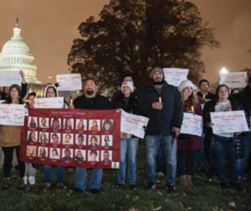
متظاهرون يطالبون بحملة تلاميذ المدارس من القتل الجماعي

وتملك كاليفورنيا أكثر قوانين الأسلحة صارمة في الولايات المتحدة، ولكنها بالوقت نفسه تعد قوانين الأسلحة الأكثر تساهلاً وتسامحاً في العالم الصناعي