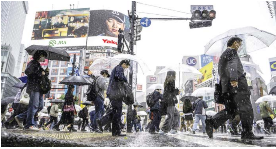
صدرت توجيهات لثلاث آلاف السكان في اليابان، أمس الجمعة، بإخلاء منازلهم بسبب مرور العاصفة الاستوائية «ماوار» التي تسببت بهطول أمطار غزيرة خصوصاً في وسط وغرب البلاد. وصدرت توجيهات الإخلاء - وهي غير الإلزامية - خصوصاً لأكثر من 410 ألف شخص في تويوتا (وسط).