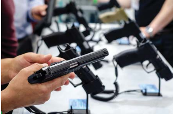
الحصول على السلاح أمر ليس صعباً في الولايات المتحدة

في هذه المرحلة، ليس من المستغرب أن يكون هناك إطلاق نار جماعي آخر في الولايات المتحدة الأميركية. ووقعت المأساة الأخيرة في مدينة آين بولاية تكساس يوم السادس من أيار الماضي، عندما فتح مسلح النار على متسوقين في أحد منافذ التسوق. لقد كان هجوماً مروعا آخر على أناس يمارسون حياتهم بكل بساطة، سواء في المتاجر أو المصارف أو الحفلات أو المدارس أو أماكن العبادة، أو حتى في منازلهم.