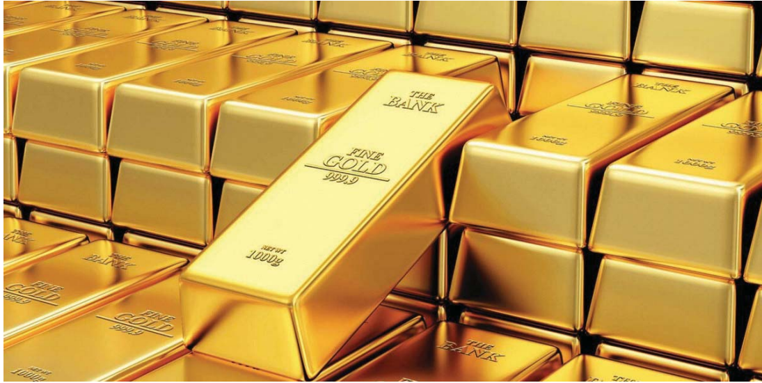
● اقتناء الذهب توجه عالمي من قبل البنوك المركزية