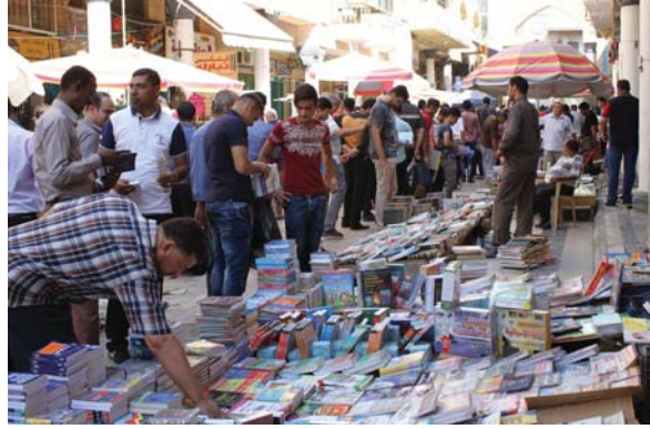
● إقبال على اقتناء كتب التنمية البشرية ودواوين الشعر الكلاسيكي