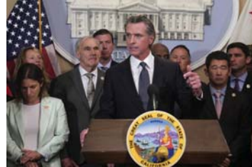
المسؤولون الأميركيون مطالبون بقرض قوانين صارمة تخص حياة السلاح

في هذه المرحلة، ليس من المستغرب أن يكون هناك إطلاق نار جماعي آخر في الولايات المتحدة الأميركية. ووقعت المأساة الأخيرة في مدينة آين بولاية تكساس يوم السادس من أيار الماضي، عندما فتح مسلح النار على متسوقين في أحد منافذ التسوق. لقد كان هجوماً مروعا آخر على أناس يمارسون حياتهم بكل بساطة، سواء في المتاجر أو المصارف أو الحفلات أو المدارس أو أماكن العبادة، أو حتى في منازلهم.