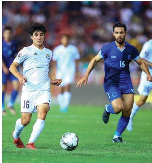
● بغداد، الصباح الرياضي

تقام اليوم السبت أربع مواجهات لحساب الجولة الثانية والثلاثين من مسابقة دوري الكرة الممتاز للموسم -2023-2022، إذ يستهل فريقا الحدود والقاسم منافسات هذا الدور عند الساعة 4:45 عصراً في ملعب الشعب، بينما تلعب عند الساعة 7:00 مساءً مباراتين في الأولي يضيف دهبوك في ملعب منافسه النجف، وفي الوقت نفسه يستقبل كربلاء في ملعب النجف الدولي ضيفه نفط ميسان على أن يعود ملعب الشعب الدولي مرة أخرى في تمام الساعة 9:15 مساءً لاحتضان المواجهة المهمة التي تجمع الزوراء ومنتديه الكهراء.