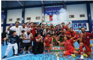
● كرة الصالات مهمة إعلامياً