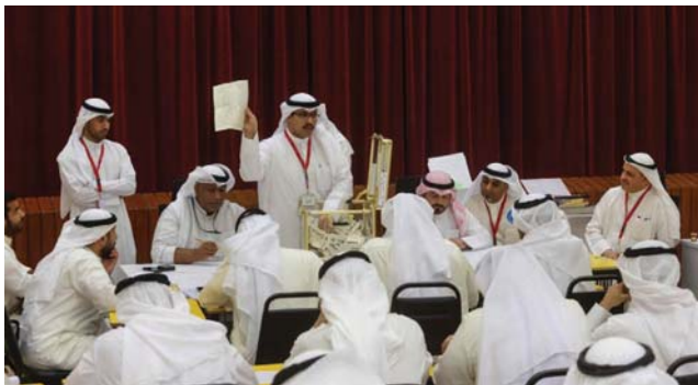
● نسبة التغيير في مجلس الأمة بلغت 24 ٪.