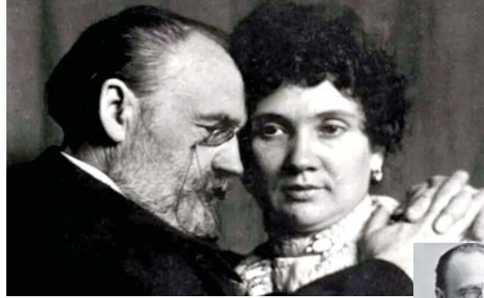
● إميل زولا وجين روزيبر

وبعد انتهاء العمل كله، نزلت إلكسندرين وجين والأطفال إلى القبول، حيث تم دفن إميل زولا بجوار عمال آخر هو فيكتور هوفو.