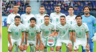
● العراق أمام حلم المونديال من جديد