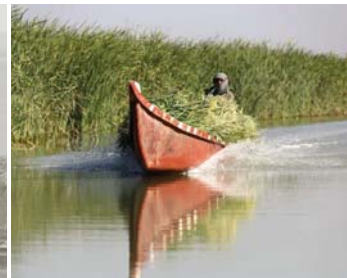
● الجفاف يهدد التنوع الاحيائي في الأنوار