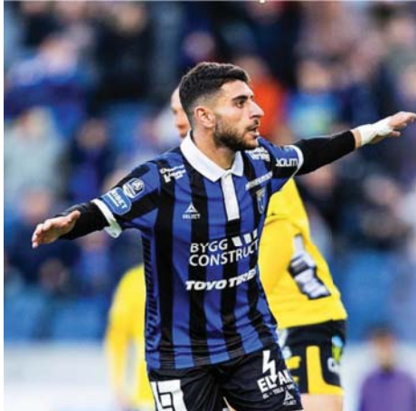
● حلمي الأول خدمة بلدي