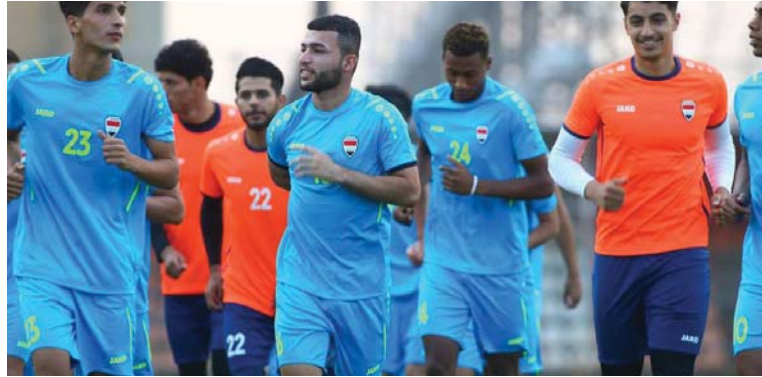
● تدريبات مكثفة لأولمبي