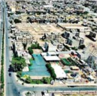
● الكوت التي ترعرع فيها شاعرة الراحل

بتمتها فندا محباً للجمال ومزخاً لشواوح مدنيتها متغزلاً بسناها ومتأماً احيانا لتشطى مستبقها، مسافرين وعيني مشدودة لدرمك لمانصا لسفر الحبيب الابعني تطخر في هوى خطاه هكذا يصبح نجيل بمشاعره بعد فراق الاحبة وطول السفر ليس لي الا نظري