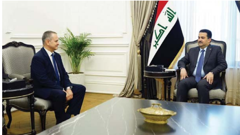
• رئيس الوزراء وسفير المجر يستعرضان علاقات الصداقة المتميزة بين البلدين