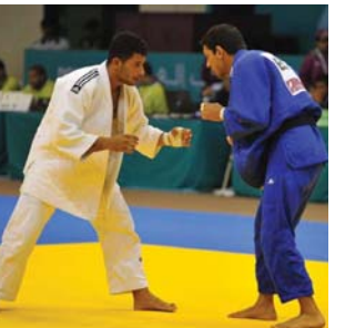
● مشاركة خارجية لجودو الحشد

أعلنت الهيئة الإدارية لنادي الحشد الشعبي مشاركة فريقها للحدود بمنافسات بطولة الأندية العربية لفئات العمرية التي تستضيفها العاصمة المصرية القاهرة للفترة من السادس عشر ولغاية الثالث والعشرين من تموز المقبل بمشاركة واسعة من أندية أبطال العرب، وهما رئيس نادي