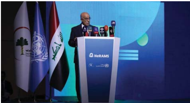
● وزير الصحة، الرقمنة خطوة أساسية لتطبيق البرنامج الحكومي

شدت وزارة الصحة نتائج رهنة النظام الصحي المختص بمدى توفر المعلومات الخاصة بالموارد والخدمات. وقال وزير الصحة الدكتور صالح الحسناوي في كلمه ألقاها في حفل الإطلاق وحضرته الصباح: إن البرنامج الذي نفذ بالتعاون مع منظمة الصحة العالمية يتماشى مع البرنامج الحكومي الذي من أولوياته أتمتة المعلومات والانتقال من النظام الورقي إلى الرقمي، مبيّناً أن المشروع أحد الخطوات الأساسية لتطبيق البرنامج الحكومي، إضافة إلى الإلقاء بالواقع الصحي وتحليل المعلومات الموجودة إلى ريفية من أجل تحقيق مبدأ توفر المعلومات الدقيقة وجودة الخدمات الصحية. وأوضح أن النظام يمثل خطوة مهمة في طريق رفعة النظام الصحي، مما يجعل العراق في طليعة الدول بهذا المجال، بما يمكن الوزارة من تطوير ثقافة تعتمد على البيانات والمعلومات وتعملي الأولوية لاستخدام المقاييس والمؤشرات الصحية. وتابع أنه من خلال تطبيق البرنامج يمكن تحديد مكان الضعف والخلل ومجالات التحسين واستهداف الموارد بشكل أكثر دقة وكفاءة وفعالية، منوهاً بأن الوزارة ستطور البرنامج باستمرار وتؤسس نظاماً تتكمن من خلاله الاستجابة بشكل أفضل للاحتياجات المتطورة والسعي نحو الهدف النهائي المتمثل بتحقيق الرعاية الصحية الشاملة بتطبيق قانون الضمان الصحي. من جانبه، قال ممثل منظمة الصحة العالمية في