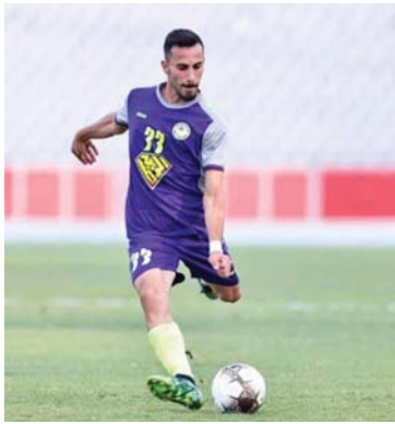
● المدربون لا يتابعون الدوري جيداً

المحلي والمهاجر الكروية من دون خلق أسواق للاعبين الأجانب وسمايرتهم. وأشار الكادوري بفرقه القاسم وإصراره من أجل البقاء في الدوري، وقال إننا عازمون على تقديم الأفضل وإرضاء جماهيرنا رغم الأزمات المالية التي يواجهها الفريق.