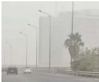
● العراق من أكثر الدول تأثراً بالتغير المناخي