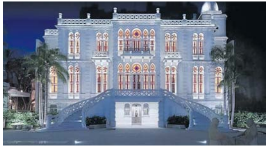
• واجهة متحف سرسق

بفعالية، وفي اتجاهات فنية مثقت تيارات واتجاهات فنية حديثة، وفي تجريب فني خضع لقواعد ومعايير محكمة. يشغل الصالون مهتدة عرض تجريبية استثنائية، تجمع بين المنهجية الفنية الجمالية، الخيال، التمرد والحرية، في أعمال ذات ممان تطال تشكيل المدينة الطليعية، وتشكل فضاء واخر، وقصصا تراصليته بإدراك واع ثقافي، للفنون والتصوير، والتصوير، والتصوير الحديث، من منظور نقدي، وفي حالات عرض لخصائص متجاوزة عالميا، في عرض من الزمن الاجتماعي المفتوح، على كبر من المضامين والمأثرة في قضايا هي جزء من التحولات السيولوجية، والإيكولوجية، والبيئية والثقافية، في خلاصة الكلام، افتتاح حديث بعد كل مأسى المتحف ولبنان، على شراء في المحتوى والتربية والرسالة، كصالون تشكيلي، تراصلي، نموذجي، ومثلي مدني، واجهة بيروت، لطلما صنع والتأليف والتصويرية، حارسه ذاكرة الحداثي الثقافي والفني، ضمير ذاكرة بيروت والتلفق الفني الحديث، الأيقونة الازدخارية في مسؤيتها الفنية الازدخارية، والجمالية متحف كان أحد جيور سلمسة معارض منها لجبران أن جميل جبران، وجوج شحادة، ولجين من البراد الاوائل، وأضفاها معارض الشباب، بتفاعلية اجتماعية وثقافية، وصارونية بالذخ، وحاذية، وبحرفية آراء وعرض مؤسسية استثنائية.