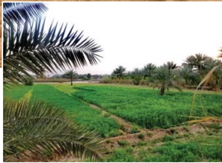
● ضرورة وجود مبادرة وطنية للزراعة

الأضرار التي خلفتها عمليات تجريف المساحات الخضراء حول المدن، نتيجة الزحف السكاني والتجاوز على الأراضي الزراعية وتحويلها إلى مدن سكنية