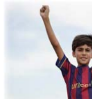
● نقطة من فيلم 'ميسي بغداد'

شارك فيلم 'ميسي بغداد' في أحد اعرق المهرجانات العالمية زيننا السينمائي الدولي بدورته الثالثة والستين، التي اختتمت أمس الأربعاء في جمهورية التشيك، وسيشارك في الدورة الخامسة والعشرين من مهرجان شتغهاي السينمائي، مترشحاً لنيل ثلاث جوائز، هي 'Media Choice' لأفضل فيلم وأفضل مخرج واختيار الجمهور.