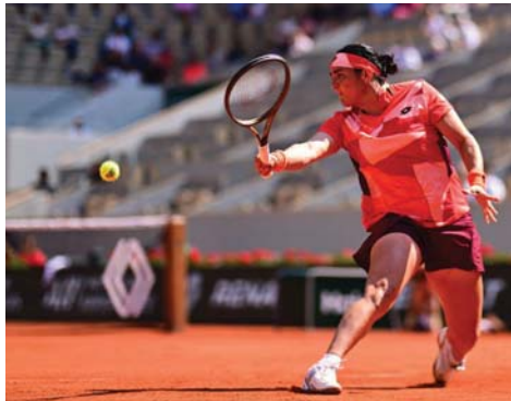
● مازال النحس يلاحق أنس جابر في البطولات الكبرى

حققت لقب دورة شارلستون الأميركية وبلغت نصف نهائي دورة شتوتغارت، قبل أن تتسحب بسبب إصابة تعرضت لها خلال مباراة ضد شيفوتيك، ما حرمها من المشاركة في أستراليا المفتوحة في روما وتخرج من مبارياتها الافتتاحية.