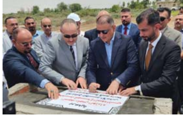
شبكة الإعلام- شريك في إعمار واسط

التابعة لجامعة بغداد أن نتخلص من هذه النفايات وطلب منا تصنيفها وشكلنا لجاناً وعملت لوقت طويل ووضعت قوائم بالمخلفات المعدنية وأخرى خشبية وثلاثية بلاستيكية ورابعة وخامسة، وصلت لمكتب الوزير وصدر توجيه بفرزها على الأرض ودفقة توصفها في قوائم جديدة مع مرفقات قرارات اللجان بوصفها سكراباً غير الصالحة للاستعمال وتطلب ذلك