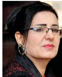
• نجاح إبراهيم

شخصية ليماء الشابة الجميلة القصدية القامة، استطاعت بطبيعتها الأنثوية أن تؤثر على حامد وتقلبه من جو الأيسار والانهيار إلى جو التفاؤل، وقد اقتنعه من الموت بجراثة كبيرة وقت تعرضه للاختيال، فنقلته