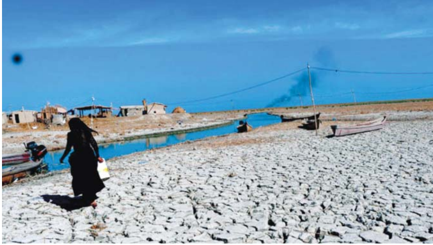
• كلما زادت صادرات النفط ازداد الجفاف

• ساره مائيسيرا ودينيل سالا • ترجمة: آيس الصغار