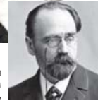
● إميل زولا

للمين القومي من خلال هجومه على السلطات بشأن قضية دريفيوس. في هذه الأثناء، كان جسمه ملقى في نعث مفتوح مزين بالزهور في منزل باريس كان ألفريد دريفيوس انتشر الشائعات بأن زولا قتل وتم طلب تحقيق وأجرى التخصيص اختبارات في منزل باريس حيث أشعلت النيران، ولكن لم تكن هناك علامات تذكر على تأثير أنجرة أول أكسيد الكربون وتحت الخزائير الفنية المعلقة في