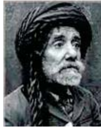
• بيرره مرد

الوقت الجميل الذي مرّ سريعاً، كنت استشعر المعنى الصديق جبار، وأعيش معاناته في إيصال المعنى المراد للمحاضرة، إذ لم يكن الامر سهلاً عليه، وعلى الحاضرين أيضاً، الذين غم عليهم الكثير من بيان ما كتبه ولم يصل الى المترجماً من لغة الى اخرى، ما أجملنا لو كنا نعرف الكوردية، وما أجمله لو أنه كتب بجمته بالعربية.