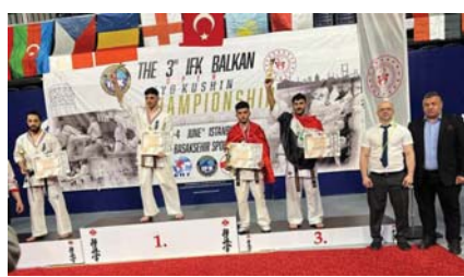
● تائق عراق في البلقان