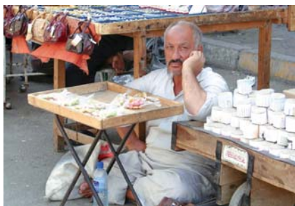
● حفظ كرامة كبار السن واجب إنساني

بينما يعتقد الدكتور محسن الزهيري، أن هناك تبايناً واضحاً على مستوى الوعي الثقافي بين أفراد المجتمع، إذ كثيراً ما يتأثر الجيل الحالي بما يسمعه ويراه من وسائل التواصل الاجتماعي المباحة للجميع، إذ وفر سهولة الحصول على المعلومة الإيجابية والسلبية على حد سواء، مما افرز بعض السلوكيات الخاطئة حول التعامل مع كبار السن، من خلال تغيير لمعظم مزاجيات الشباب وفهمهم واتساع رقعة التقاعد في نوعاً من التعامل السلبي والإناني لكبار السن، ويرى الزهيري أن الموضوع لا ينطبق على جميع الشباب، فهمم الوعي الذي يقدر قيمة كبار السن، ويسعى إلى الاستفادة من خبراتهم والتعامل الحسن معهم، باعتبارهم قوة له.