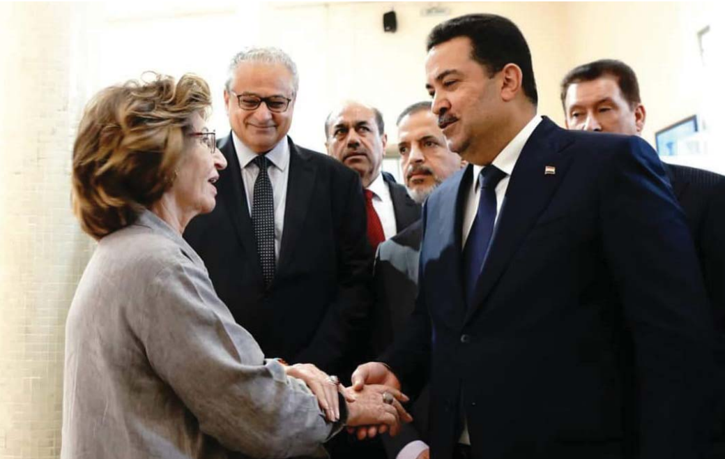
السيد رئيس الوزراء محمد شياع السوداني يسافح السيدة ثريا الصراف لدى افتتاح قاعة الصراف في المتحف الوطني

مسكوكات نادرة أمسكت بها يد أمهلا في مراحل أوškكت على إحتلتها إلى الهباء شمة خيط رفيع يمتد بأرواح من أورشتم ترتيهم الأسرية الوطنية أن تكون المنقذ بوجه الحصف الذي همد الأرت بالضباع، هنا رحلة لكم تسميتها كما يشاء زيت العقل وروح الضمير، قاعة الصراف الأرت التاريخي التي وقتت دولا وممالك وخلصاء وملوكا وسلاطين بمختلف العصور والتي أهدى عبد الله الصراف كل محتوياتها للمتحف العراقي، واستأنفت ابنته ثريا إعادتها بعد تحديتها بالتعاون مع هيئة الآثار والتراث وملاك المتحف العراقي افتتحت يوم 2023 / 6 / 10 برعاية السيد رئيس الوزراء محمد شياع السوداني.