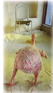
● من أعمال الفنان