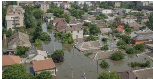
• مناطق سكنية واسعة وعمرها ثمانية مياه سد نوبا كاخوفكا بعد التدمير

عام 2014، حيث لا تزال موجات الصدمة من التأييد الغربي يتردد صداها في جميع أنحاء البلاد والمنطقة الأوسع قبل ذلك، كانت القناة توفر نحو 85 بالمئة من مياه شبه جزيرة القرم، وكان معظمها يستخدم للزراعة، كما يجري استخدام الباقي للصناعة والاستهلاك العام. وفرضت القوات الروسية سيطرتها على القناة منذ اليوم الأول من الغزو، وحققت الهجومية التي نجحت شمالا من شبه جزيرة القرم نجاحا أكبر من نظيرتها في شمال وشرق البلاد. وبعد أيام، نسفت القوات الروسية السد الذي