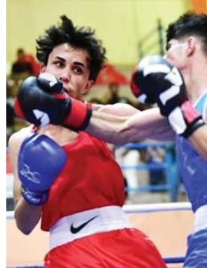
● معسكر إيران .. محطة ملاكمينا الأخيرة للاستحقاق العربي