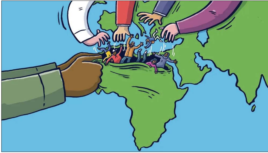
الاتحاد الأوروبي يسعى إلى منح هجرة الأفارقة إلى دوله