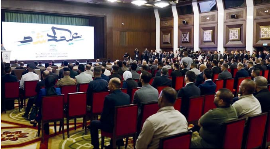
جانب من الحفل المركزي السنوي بمناسبة الذكرى التاسعة لتأسيس الحشد

دعا رئيس رئيس الجمهورية عبد اللطيف جمال رشيد، إلى توفير كل الدعم التسليحي للحشد الشعبي، وبينما بين رئيس الوزراء محمد شياع السوداني، أن الحكومة تعمل على وضع قانون يضمن لأبناء الحشد تقاعداً كريماً، شدد رئيس مجلس النواب محمد الحلبوسي على ضرورة إدانة النصر والحفاظ على دور الحشد ليبقى عنواناً للوحدة الوطنية والتضامن بين المكونات العراقية.