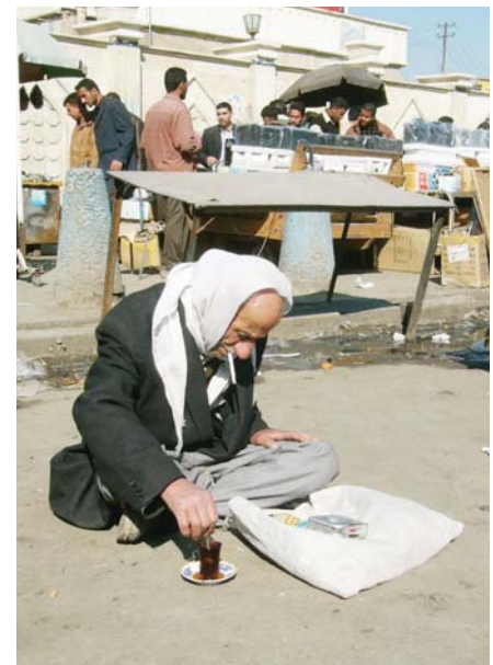
● لا وجود لعمل مؤسسي يهتم بالتقاعدون