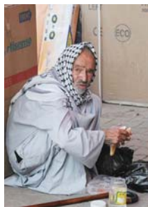
● الراتب التقاعدي لا يكفي

قوانين رئيسة مركز حقوق المرأة الإنساني الدكتور مها الصكيان، تقول مع شديد الأسف أن الشخص المسن في بلدها، يعامل كأنه عبء حتى قبل أن يصل إلى سن الشيخوخة، لكن في واقع الحال أن كبار السن هم ثروة، من الضروري الحفاظ عليها والاستفادة من عصارة خبرتها، لذلك نجد الأمم المتقدمة تهتم بمسئلتها وتعمل جاهدة على توفير جميع مستلزمات الحياة لهم، خاصة بعد إحالتهم على التقاعد أو وصولهم إلى أعمار كبيرة عن طريق وضع قوانين خاصة برعاية المسنين ودعمهم اجتماعياً وصحياً، وتوفير جميع مستلزمات الراحة لهم، فضلاً عن الاستفادة بخبراتهم التي امتدت لسنوات طويلة حسب اختصاصهم الوظيفي والمهارة، حيث نجدهم مستشارين وحكاماً وشيوخ أعيان يتم الرجوع إليهم في جميع مجالات الحياة السياسية والاقتصادية والاجتماعية والتعليمية.