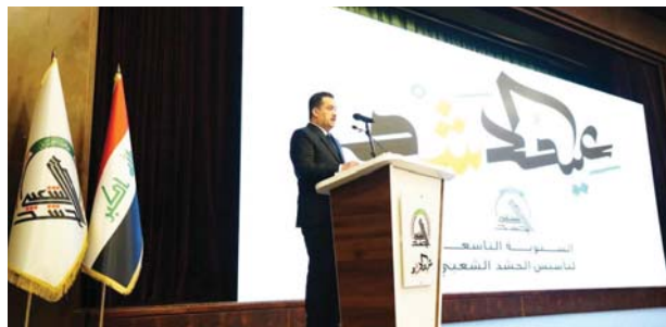
● السوداني، الحشد أصبح واحداً من بين أهم التشكيلات الأمنية

دعا رئيس الجمهورية عبد الطيف جمال رشيد إلى توفير كل الدعم التسليحي للحشد الشعبي، وبينما يترأس رئيس الوزراء محمد شياع السوداني أنّ الحكومة تعمل على وضع قانون يضمن لأبناء الحشد تقاعداً كريماً، شدد رئيس مجلس النواب محمد الطيوسس على ضرورة إدامة النصر والحفاظ على دور الحشد ليبقى عنواناً للوحدة الوطنية والتضامن بين المكونات العراقية. وقال رئيس الجمهورية، أسد الأرياء، في كلمة له ألقاها منته عبد الله الفيافي، خلال الحفل المركزي السنوي بمناسبة الذكرى التاسعة لتأسيس الحشد الشعبي بحضور الصباح، إننا نتخلف بذكرى تأسيس الحشد الشعبي الذي شارك في تحرير العراق من الوجود الجرمي، إذ مثل العراقيون القيم الإنسانية النبيلة وهم يذهبون لتلبية ظوى الجريمة الرشيدة للسيد علي السيستاني (دام طله) بالجهاد الكفائي في مسيون أبهر العالم الذي كان يشكل في وحدة العراقيين وقدرتهم على الهزيمة الوشيعة الإرهابية، مبيّناً أنّ العراقيين اثبتوا من جديد أنهم صناع الانتصارات كما هم صناع الحضارات وأنهم المعلمون الأوائل بالعبارة والشهادة، وبارك رشيد