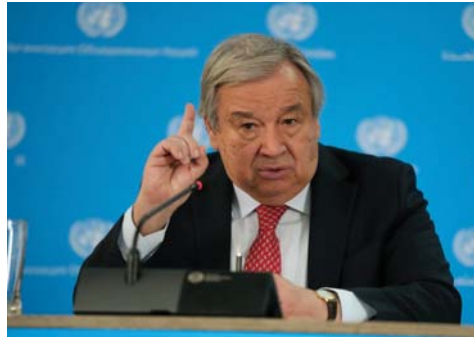
• إنشاء الفيديووات المزيفة يؤدي إلى الكراهية والعنف

قال الأمين العام للأمم المتحدة أنطونيو غوثيريش إن العلماء والخبراء دعوا للتحرّك وأعلنوا أن الذكاء الاصطناعي تهديد وجودي للبشرية، لا يقل عن الحرب النووية، مؤكداً: «يجب أن نأخذ تلك التحذيرات بجدية بالغة».