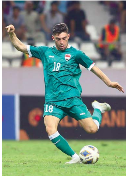
● طموحات كبيرة بإجتياز الإمارات