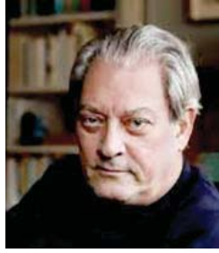
● بول أوستر

سعيد الفلاسفة وأصحاب الفكر في أعمال بول أوستر ضالته، عند قراءة المجتمع الأمريكي، هناك فسحة سخرية في نقد الرأسمالية، واضح أنه خبر العيش في الشوارع الخلفية للمدن هناك، أو أنه اقترب كثيرا، ويوعى مختلف من حياة المهمشين في الأحياء الفقيرة، حيث يهتز الملائكين إنسانيتيه، وفي أدق تفاصيل حياته