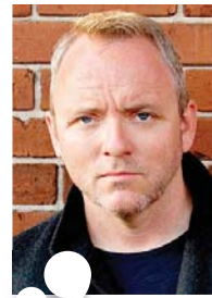
● دينيس ليهان

اصدر الكاتب الأمريكي دينيس ليهان رواية رائعة عن أمريكا في فترة السبعينيات، أمريكا التي لا يربد الفصل العنصري أن يورث فيها، ورواية «الصمت» الصادرة مؤخرًا عن دار غايليمار الفرنسية للنشر هي تحفة فنية خالصة وكتابت عن أم شجاعة تواجه النظام الذي يهدد أطفالها.