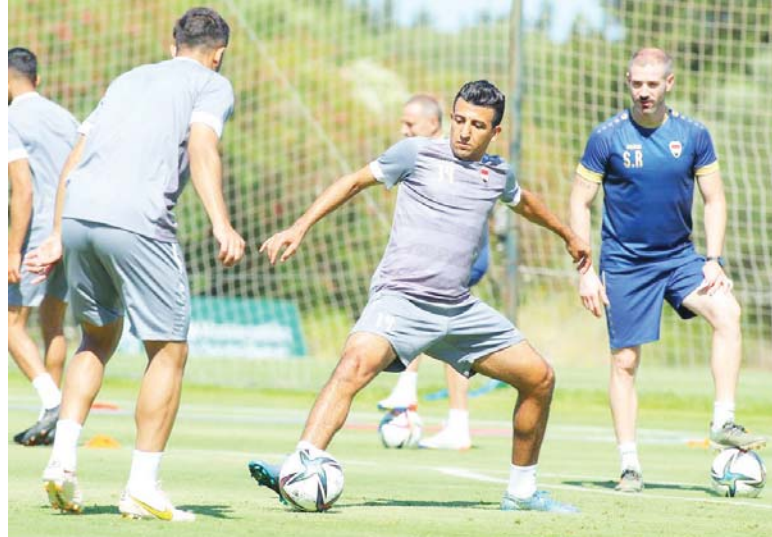
● معنويات مرتفعة سودنا يتأهبون لتجريبية كولومبيا