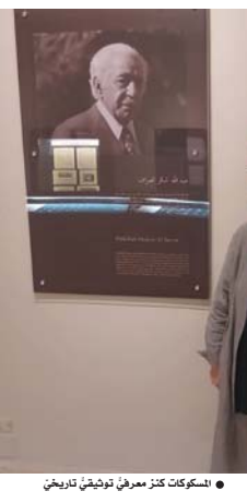
المسكوكات كنز معرفي توثق تاريخي