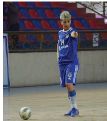
● كأس العراق محطة مهمة لتجسيبات سيدات الجوية

وأشار إلى أن «تركيزه خلال الفترة المقبلة ينصب على الإعداد إلى خيل بين العناصر الشباب والخبرة إلى جانب الكرة النسوية في النادي، فضلاً عن رفع