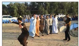
الجوبي فولكلور عراقي أصيل