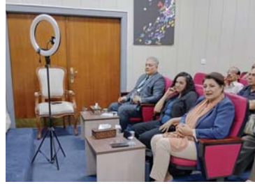
نادي السرد يحتفي بمحاضرة محاضرة

وهي الخلافة التحكّمة بالمصائر؟ لأنه العراق، تنزل إليه الآلهة لتخطف أرواح الشباب بعدها.