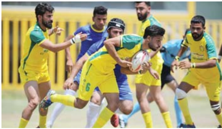
● ركني الحدود وإمام المحافظ على السبب

الضلوعية وإمام المنتخبين تواليًا. وأضاف أن دوري السبياعيات يرمو فرصة مناسبة للجهاز الفني لمنتخبنا الوطني بقيادة المدرب الإيراني حميد رضا، الذي تابع المباريات ووثق من سجله بعض الأسماء التي تستحق تمثيل اللعبة خارجياً، لا سيما أن هناك العديد من التحديات التي تنتظر الركني على جميع الأصعدة الدولية. وأشار هزاع إلى أن اتحادنا يسعى للارتقاء باللعبة ونشرها على نطاق واسع في مختلف المحافظات، مستمداً على العجلة التطويرية التي تهدف إلى استقطاب المواهب والعناصر الشابة من المنتسبين، وتعزيز قدرات الطواقم التدريبية والتكيفية عبر إقامة الورش التدريبية والتكيفية، وتطبيق البطولات المحلية بالتعاون مع الاتحادات الفرعية، فضلاً عن دعم الأندية المحلية والفرق الوطنية بما يسهم في تحقيق نتائج إيجابية والمناخه بقوة خارجياً.