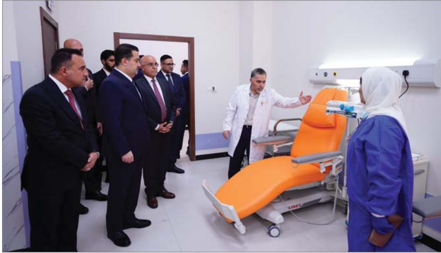
● رئيس الوزراء الحكومة وضعت التخصيمات الأزمات لتأمين احتياجات القطاع الصحي