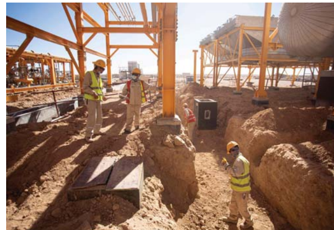
● جولة الترخيص السادسة اشترت تشغيل نسبة كبيرة من الأيدي العراقية

البلاد نحو الاقتصاد الأخضر المستدام وتشجيع استخدام التكنولوجيا الصديقة للبيئة، من خلال وجود تعاون إقليمي لمواجهة تأثير التغيرات المناخية. وذكر مريد أنه سيتم خلال المؤتمر عرض أهم ما تم تفيذه من اتفاقية باريس للمناخ ووثيقة المساهمات الوطنية العراقية لمواجهة تأثير التغير المناخي، كما ستعقد اجتماعات عدة، لتحديد أبرز تحديات التغير المناخي متضمنة الأمن الغذائي والطاقة والمياه، فضلاً عن ملف تقليص الكوارث، إسهاماً بوضع حلول سياسية دبلوماسية لتكثيف والتقليل من الآثار السلبية لتغيرات المناخية.