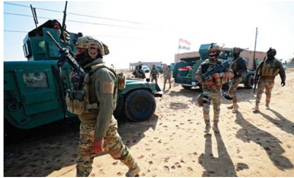
● القوات الأمنية تتنّض عمليات نوعية ضد الإرهابيين