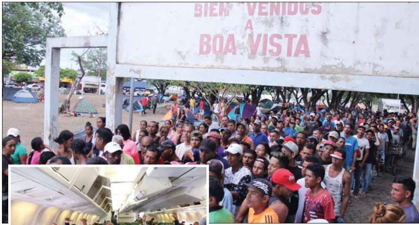
• طوابير اللاجئين فنزويليين تنتظر رحلتها صوب جنوب البرازيل