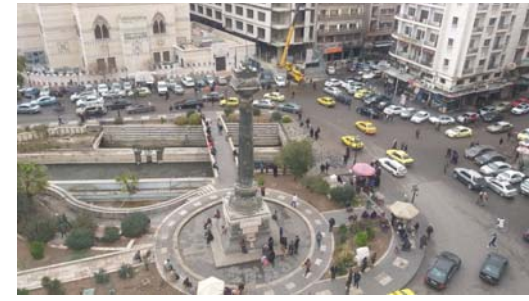
• ساحة المرجة للدينة

أمكنة سياحية يشاهدونها عبر شاشاتهم نوستالجا، حنياً مرضياً لسكان مشهتي، مكاناً في العيال، في الحكايات والكتب وأمسيات كانون، لا يتحدثون عن الوجوه المنعب، ولا عن تفاصيل الهروب اليومي من الموت إلى الحياة في أحد مداخلسها، الخراب الذي عمم الأرواح والأجساد، الخوف الذي يعرض على القلوب ويمشع في الخلايا، صدق لأهزجة الموت العيشي بقذيفة هاون أو مطلقه قنص لا