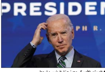
● الدستور الأمريكي يجيز عزل الرئيس بشروط

السكان في ألمانيا إما ولدوا في الخارج أو لديهم والد واحد في الأقل مولود في الخارج. وبعد سنوات من البطالة المتخفضة، بدق قادة الأعمال الألمان اليوم ناقوس الخطر بشأن نقص العمال وتأخرت الحكومات الألمانية في سبب شريحة السكان، إذ سيبدأ قريباً مواليد الستينيات من القرن الماضي في التقاعد. وحذر الوزراء من أن ملايين الوظائف الشاغرة تحتاج إلى المولدين، ووصفوا نقص العمالة بأنه أكبر خطر يواجه الاقتصاد الألماني. وعندما هزم حزب أولاف شولتس، الحزب