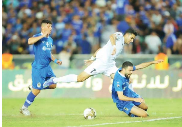
● الزوراء يحرم الجوية من السدارة