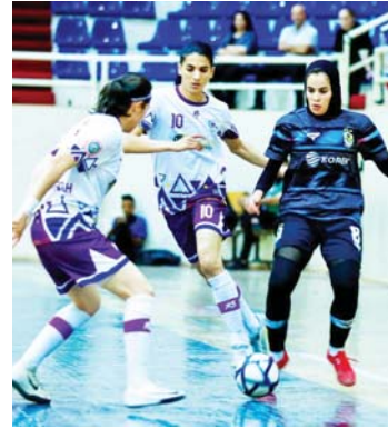
● كأس العراق لمسالات السيدات يقترب من النهاية