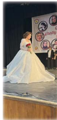
دورات تعليمية تختص بفن التجميل