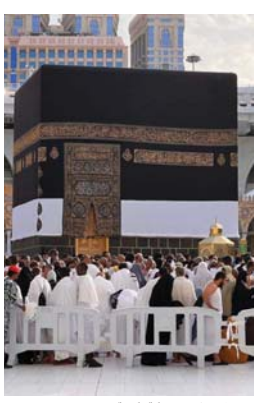
● المسلمون في رحاب مكة المكرمة

بينما كنا في المدرسة الابتدائية انبهرتنا بالمعلومة التي تقول انك إذا ما مزجت ألوان الطيف الشمسي كلها، فإن الناتج سيكون اللون الأبيض، وكم جربنا وكربنا التجربة حتى صارت المعلومة يقيناً ثابتاً في أفكارنا، اليوم وأنا أتجول في شوارع وأزقة مكة التي يقرب توقيتها رويداً رويداً من مراسم فريضة الحج، أرى ألواناً متعددة تمتزج مع بعضها البعض، أرى ألوان بشرات رجال ونساء يمشى عليها من الأبيض مسروراً بالأحمر والأسود والآخر وانتهاء بالأصفر، كل تلك البشريات تلتقي ببعضها البعض وتمزج جنب بعضها البعض