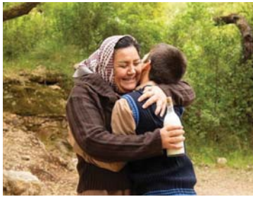
شاهد من الفيلم تظهر فيه العائلة تماضر قائم والعهد حيث تظهر

العمل الذي أقامه لفقيهه العائد. يشهد الأخير الشاعر الجيولوج الذي ينطلق بالحكمة من خلال ما يردد من أشعار لثمنين والأخطل الصغير ومترنة وكأنه ضمير الجماعة وصوتها الواوي الخفي، وقد خلا الفيلم من المناجيات والعقد الحادة وطلعت الإيجابية على الحوار الأساسية فيه وما تكرره لهذه المشاهد إلا تأكيداً على حياتها رغم مرور الزمن في إشارة أنه ما من تطور بطراً على العقول ولا تغير يحصل ما لم تتغير الأساليب المتبعة في يتعاشرون على كثره.