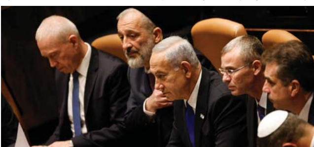
• اجتماع حرب وهي لرئيس حكومة الاحتلال من كابينته الأمنية

أما تائباهو فقد اتهم الوكالة الدولية للطاقة الذرية بالإفغان وقال إن إيران تكذب. كل هذا يقدم مثالا آخر على العزلة الدولية التي يشعر بها إسرائيل في شأن قولها إن خير من يعرفه وشع