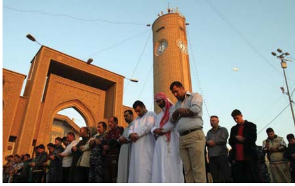
• صلاة العيد في جامع أبي حنيفة الشعمان

ميلخ من المال يقوم بتوزيعه الكبار من الأهل والأقارب بين الأطفال ليزرع البسمة على وجوههم، أما حالياً فقد أصبح يتخذ أشكالاً معينة، أو رصيداً يتم تحويله لأحدى الطماطات الخاصة بالألعاب التي توفرها المولات ومدن الألعاب الأخرى.