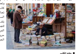
● بيع الكتب

روايات متعددة، لاقت استحسان المجتمع البسيط، بينما سخط الجمع المثقف من إغراق الفن الروائي بلغة الشارع البسيطة، والذي سيعيد الجيل الجديد عن تشعبات اللغة العربية، وبالتالي سيخلق جيلا جديداً قادر على تكوين جملة مفيدة. وبين هذا الرأي وذاك تنتسج دائرة اللجوء إلى الفن الروائي الشعبي الجديد ذي اللهجة الدارجة والابتعاد عن الروايات المعقدة من وجهة نظر الشباب، الذي يسعى للقراءة أحيانا كروح من نقت الانتباه أو لإثبات الانتماء إلى عالم الثقافة، والتجوال في شارع المثقبي بحثا عن هذا الكتاب أو ذاك.