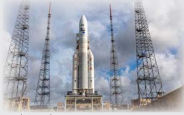
• قاعدة إطلاق أريان 5.

مرحلة يعاني فيها صراع الفضاء في أوروبا فراعناً، إذ باتت التائرة شبه محرومة من بلوغ الفضاء بإمكاناتها الخاصة المستقلة في انتظار بدء العمل بصاروخ أريان 6، بينما تستخدم المنافسة في سوق الصواريخ التي تسيطر عليها شركة سبيانس إكس الأمريكية. ويعد سبب ذلك إلى التوقف المفاجئ لاستخدام صواريخ سبيوز الروسية عقب الغزو الروسي لأوكرانيا في شباط/فبراير 2022، مما خفض من نشاط قاعدة كور.