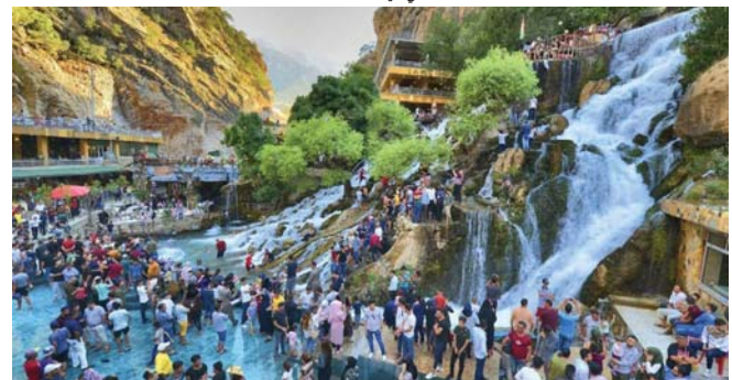
• أجواء كردستان العراق