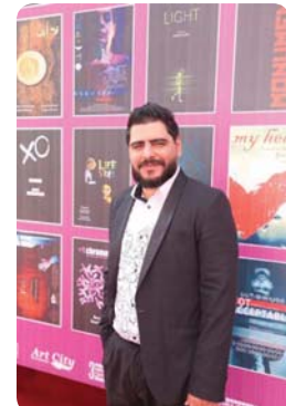
● المخرج الراحل لؤي فاضل عباس

وأعلنت وفاة المخرج الموهوب لؤي فاضل عباس، الاثنين الماضي بعد اختفاء لمدة 6 أيام، حيث وجدوه ضمن الجثث مجهولة الهوية في الطب العدلي، وبذلك انتهت رحلة سينمائي واعد حافلة بالإجازات والأحلام.