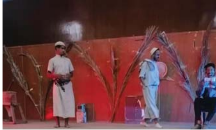
● مشهد من المسرحية

فرقة (ماكبت للفنون) التي أسست بتاريخ 1 - 2023 ويهجو وطموح مجموعة من شباب وشباب هواة دفعهم حُبهم وعشقهم لفن المسرح التراثي على أن تكون لها مساحة على خريطة الفعل المسرحي في مسرح المحافظة من خلال ما تسعى على تقديمه ما لديها من طاقات شبابية وأبداعية.