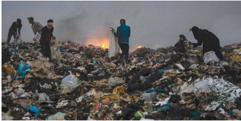
مواطنو المحافظة الأغنى يعيشون مأساة حقيقية