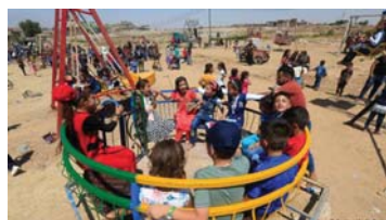
• فرحة الأطفال بالألعاب

الكنجية متعددة الأشكال والطعم، وكذا تأخذ من كل صنيعة تضع، عدداً من حبات الكنجية، حتى تمتلئ ألوانها بأشهى الأصناف والأشكال. وتابع