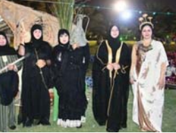
● سومريات ذي فارق يستعرضن في بغداد

صعدت عروض الأزياء الخاصة بالحضارة السومرية المركز الأول في المهرجان السنوي الذي نظم في حدائق الزواء بمناسبة عيد الصحافة.