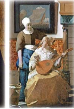
● من أعمال الفنان