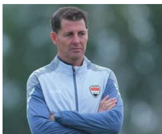
• كاساس يبحث عن تجريبية في قطر قبيل نهائيات آسيا

ويشأن الأخبار التي نشرتها بعض المواقع والصفحات الإلكترونية، إزاء طلب منتخبني هونغ كونغ وأوزبكستان اللعب أمام منتخب العراق في ملعب جعد النخلة خلال تشرين الثاني المقبل، نفي كريم ذلك جملة وتفصيلاً، مؤكداً أنه لم يتلق أي رسالة إلكترونية بهذا الصدد.