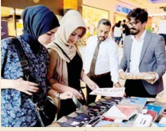
● تهدف المبادرة إلى نشر الثقافة وطرق أبواب مساحات اجتماعية جديدة

تتميز لهوية الثقافة العراقية وتنحصر أهمية المبادرة التي استحدثت ليومة الجمعة والسبت، بأن الاحتكاك المباشر بالجمهور خارج الأوساط الثقافية المعروفة يساعد بنشر الثقافة العراقية وطرق أبواب مساحات اجتماعية جديدة، فضلاً عن أهمية تضييق الميادين للبحث في شخصيات وأعلام الثقافة العراقية بعد خنوعهم التجربة كشكل من أشكال التنمية الثقافية. المبادرة في مبنى «الول» برعاية وزير الثقافة والسياحة والآثار د. أحمد فهدك الحمداني وبالتعاون مع «مول بابيلون» أطلق قسم التنمية الثقافية الخسيس الماضي، مبادرة التعريف بأعلام الثقافة العراقية في مبنى «الول» بيومها الأول. وشملت المبادرة سؤال الزبائن من مختلف شرائح الشعب العراقي عن مجموعة من شخصيات الثقافة العراقية الأعلام بمجالات الشعر والزوايا والفكر والتشكيل والنقد الأدبي، والتعريف بهم وتوزيع كروت تعريفية بهذه الشخصيات، كما تم توزيع إصدارات من دواوين المأمون الترجمة والنشر والشؤون الثقافية كهدية وزارة الثقافة للمشاركين من عامة الناس في المبادرة، واستخدم التمر العراقي الحشو بالمشكرات كضيافة وشخصها.