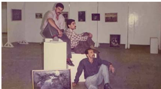
● تحضيرات افتتاح المعرض عام 1991 في جمعية التشكيليين العراقيين