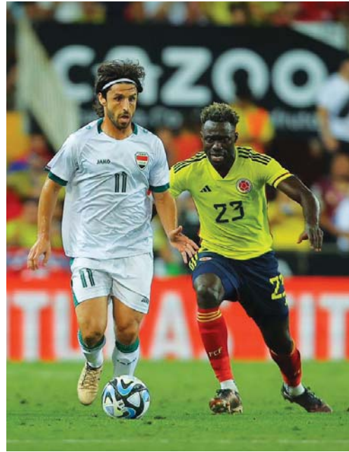
● برنامج إعداد مثالي لاسود الرافدين تحضيراً للنهائيات القارية

أسيا المقبلة والتي قد تكون متشاحاً لثبات على التشكيل النهائي الذي يمكنه خوض نهائيات كأس العالم المقبلة، مطالباً بالثبات على التشكيل الذي حققه المنتخب الأولمبي في بطولة غرب آسيا التي نظمتها العراق قبل أيام. ويعد المدرب بأنه "من الضرورة بمكان أن يعطى النضج الشبابي باهتمام كاساس كون أن كرة القدم الحديثة تعتمد على الطاوله والقوة، مبيئاً أن الفترة المقبلة قبل انطلاق أمم آسيا كقطة يعاظم الطاغم التدريبي الرؤية الواضحة في إيجاد التشكيل المناسب لما تتطلبه المرحلة المقبلة من إعداد سليم وإنهاء مثالي لفنصان"، معرباً عن "أمله في أن تسهم بطولتا ملك تايلند والأردن في تلبية طموحات الجهاز الفني وأن يتمكن منتخبنا من استعادة بريقه القاري الذي حققه قبل 16 عاماً حينما توج بطلاً لآسيا".