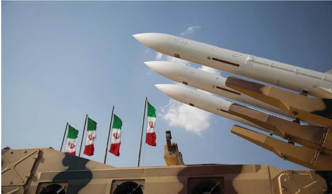
• خبراء ويتكهنون في أن يقدم تائباهو على ضرب إيران