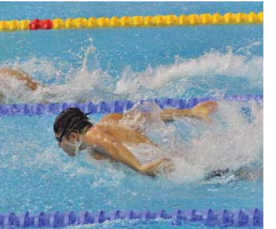
• المتاحات الدراسية ترحن انطلاق منافسات السباحة

أعلن الاتحاد المركزي للألعاب المائية تأجيل بطولة أندية العراق بالقفز إلى الماء بقشي التقديم والتأشئين، التي كان من المقرر انطلاقها يوم أمس إلى بعد عيد الأضحى المبارك لأسباب تنظيمية. وقال نائب رئيس الاتحاد المركزي للسباحة هاشم محمد ل (الصباح الرياضي): إن