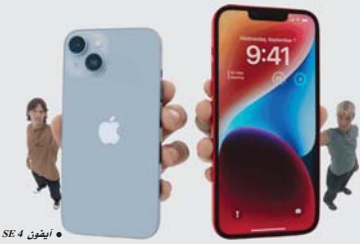
• آيفون SE 4.

إلى أن آبل سوف تستخدم تصميم هاتف آيفون 14 الحالي نفسه في هاتف آيفون SE القادم، وأنه سيحتوي على شاشة OLED مع تقنية تعرف باسم Face ID، وليس معرفاً إن كانت آبل سوف تطلق هذا الجهاز بمودم من إنتاجها أو من إنتاج كوالكوم.