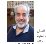
● فلاح ابراهيم

عبر عدد من الفنانين، أسى الأحد عن حزنهم العميق لرحيل الفنان والبرج المسرحي فلاح ابراهيم على نحو مفاجئ بعد اجراء عملية جراحية في تركيا، كما تمت نقالية الفنانين رحيل ابراهيم ومدت ذلك خراساً لساعة الفن العراقي، يذكر ان الفنان الراحل يمتلك اكثر من 50 عملاً مسرحياً مكملت وعشر أعمال مسرحية كمشروع وعشرين كسينوغرافي ومن أعماله (الغويلا) و (تقسيم على نعم التوى) و (الوميا) و (قلب العذت) بالإضافة إلى الأعمال الغرامية، وقد حصل على عدد من الجوائز، كانت أولها جائزة أفضل ممثل وأعد عام 1988 عن مسرحية (الغويلا) وجائزة أفضل مخرج عن مسرحية (بياض الظل) وجائزة الدولة للمحترفين عن مسرحية (الهجرة إلى الحب).