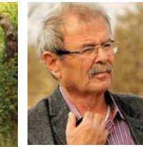
المخرج عبد اللطيف عبد الحميد

عبد اللطيف عبد الحميد كتوب عن الوفاء، أهدى عمله الأخير لزوجته الراحلة وصديقه الذي شاركه بتأليف العمل وهو الذي طغلت حياته بفيلم عدة (رسائل شفوية 1991، سعود الطمر 1994، نسيم الروح 1998، قسران وزبونة 2001، خارج القطية 2008، الضجر 2008، الإفطار الأخير 2012) في موجة العفوية أعطانا متعة بصرية لافتة وتوقاً لترقب المزيد.