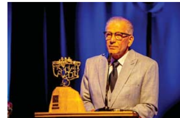
● هاتف الجنابي