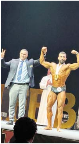
● تتألق مميزة لبناء الأجسام