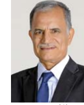
• صبري خاطر

تحدثت هذه الرواية عن اغْتصابين، يشبه الراوي كل منها الآخر في العنوان عبر استدعائه للثنائيات الثقافية المتناقضة، فيعرض ثنائية الاعتداء على الجسد ونهايات حريمته من جهة وفوقه على الفرد أو على الدولة، تشابهها من حيث مصطلح الاغتصاب لا تشابهها من حيث حجم الفاجعة والخطة المبرمكة. تدور أحداث الرواية حول شاب اسمه (الساك) وتلد لأسرة تتخذ الصوفية طريفة، ولكنه يتسرد على تشبته الاجتماعية الثنائية، التي تحاول والده (التمنان) تربيته عليها، يتعد لأسباب متعددة من بينها الشك الذي يتوهمه في النهاية إلى طريق غير سوي، حيث حاولت جهات أجنبية تعيينه ضد مصالح دولته، والجد الذي يصل فيه لإرتكاب المعصية واغتصاب امرأة أجنبية، فدمت في ظل شركة استثمار لها دور مهم بما يتبرع غضب الجهات الأجنبية في دولتها هذا هو مصير الساك الذي انتهى به المطاف في لسنجن ثم يفتن الراوي تحولاً (Parsi-