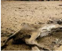
● تلوث المشية سيء تغير المناخ يضر بصحة البشر

ووجدت الدراسة أن «التقاط الساخنة، لتقاطع المشكلات تقع في جميع أنحاء أوروبا الشرقية وجنوب آسيا والشرق الأوسط، جنوب شرق آسيا وأجزاء من أفريقيا ومعظم البرازيل والمكسيك والصين، وأجزاء من غرب الولايات المتحدة، ومعظمها جزءا من تغير المناخ على سبيل المثال، فإن نحو ثلثي مساحة الأرض محرومة من معايير