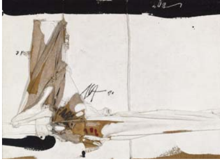
● لوحة الفنان Manolo Millares

الافصح، فأخذ يفحص المصباحين، واحداً وراء الآخر، وكان الضوء، قوياً، يخترق البلورات الثلجية المتلاصقة على زجاجاتهم. أضواء نيرة طفولية، دعائية إلى حد ما، مصباح مائي ممتاز. لم أفهم، على وجه الدقة، معنى أن يكون المصباح تلحي الضوء مائياً، فقلت لنفسي ربما لأنه مقاوم للماء، أو ربما لإضاءة التي منعت المحل أحساس ليلة ماطرة، وزادت من لعان دشاثة الصبي كما لو كانت ليلة، ورأت، أخيراً، أن القطرات على الزجاجتين كغاية بالتسمية. أعاد المصباحين إلى علبتهما، ثم وضع العليتين في كيس نايلون، وسألني، قبل أن يسلمني الكيس: أنت معلم؟ لا، لست معلماً. لم يكن الرجلان يجلسان أمام المحل، دخلت بخطوات سريعة، كان الصبي أمام منشدته وقد ارتدى، هذه المرة، قميصاً مقلماً بياقة عريضة، مفتوح الرقبة.