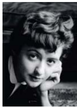
• فرانسواز ساجان