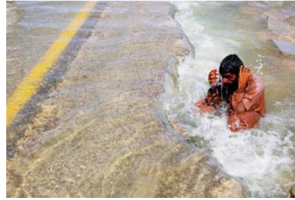
● باكستاني يستعمل مياه الضخان المارة عبر احد الخرق السريمة