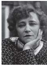
• سيموني غابرييلا كويت

من جميع الجوانب، بين المعجبن بها وكذلك للنقاد، فاجأت الجميع في اليوم الذي أجرت فيه مقابلة مع ميشيل بلايتني نيابة عن صحيفة يومية فرنسية كبرى، لكن الشغف الكبير في حياتها، بعد الروايات، هو التسيما التي كتبت لها عدة سناريوهات منها هيروشيمو من أمور الشهيرة للمخرج آلان رينيه. مارغريت بوسيتار، من الصعب اختصارها في بضع كلمات، شوقية بالكلاسيكيات، طالما ابتمتد عن الرواية الجديدة، متتعة عملاً فريداً خارج الشاشة، حصلت على الجنسية الأمريكية عام 1947، ولم يعمها ذلك مع أن تكون أول امرأة تنتخب للاكاديمية الفرنسية عام 1980. كانت بوسيتار مفرعة جداً، والأدب الأمريكي، وكانت المترجمة الفرنسية لـ (الأمواج) لفرجينيا وولف، اللقاء القريب بين اثنتين من الحساسيات اللدنية النادرة والمتفردتين.