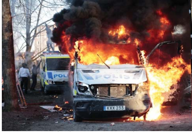
السويد شهدت احتجاجات واسعة حين أحرق زعيم بعثي متشددة نسخة من القرآن قبل أشهر.

التشاور بفسر قضية هل الفعل يندرج ضمن حرية التعبير أو خطاب الكراهية إذ يقول إن البعض يعتبر حرق الكتب السماوية لا يندرج ضمن حرية التعبير عن الرأي بل يندرج تحت الاعتداء على حرق المصحف أو انتقاده، ما يؤثر في الصالح السويدية والانضمام إلى حلف الناتو. يعتقد بأن هذا أحد التصورات المهمة. وأظهر الاستطلاع أيضاً أن النساء أكثر تأييداً لسكان موميكا. عن قضية منع الجنسية لسوان موميكا بسبب هذا الأمر، يشير الناشئ إلى أن حصوله على الجنسية السويدية أمر مستبعد لأهمه لأن يعطون الجنسية لشخص قام بمثل هذا الفعل وفقاً للقانوني أنه من الصعوبة أن يحصل على جنسية حتى بعد خمسة عشر عاماً لأنه كان قائداً لتفصيل مسلح معين والسويد عادة ما ترحم هكذا الأشخاص من الجنسية حتى لو كانت لديهم أسباب كافية حيث يتم منحهم إقامة 12 ذات شهراً وتجدد سنوياً.