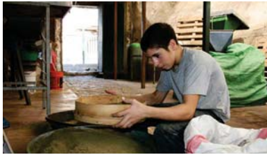
• عمالة الأطفال