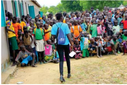
● أطفال افارقة مشمولون ببرامج تعليم جماعي