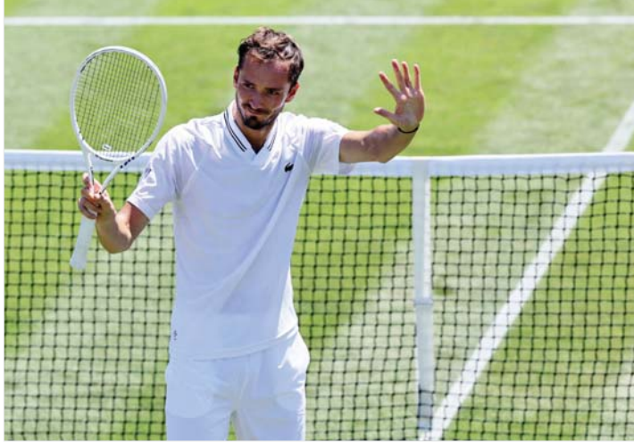
● مدفيديف يحقق فوزه الثالث على الفرنسي مانتارو

يخوضون الدور الثالث متأخرين على غرار الصربي نوفاك ديوكوفيتش حامل اللقب، في حين يلعب البعض الآخر الدور الثاني، مثل الإسباني كارلوس الكاراس المصنف أول عالمياً. كما أن القانون المفروض توقف المنافسات عند الساعة الحادية عشرة من مساء الخميس تسبب باستكمال بعض المباريات أمس الجمعة. بعد أن توقفت مواجهة أندى موراى واليوناني ستيفانوس تسيتسيباس على اللقب الرئيسي بعد أن كان البريطاني متقدماً بمجموعتين لواحدة. وتأهلت كفيتوفا، المصنفة تاسعة عالمياً وحاملة اللقب عامي 2011 و2014، إلى الدور الثالث بفوزها على الروسية أياكساندرا ستانوفيتش 2-6، 2-6. وساحقت الإسبانية بالوا دابوسا من مباراتها في الدور الثاني أمام مازان كوستيكوف للإصابة عندما كانت الأكرانية متقدمة 2-6، 0-1. كما بلغت الأميركية ماديسون كيزر، المتوجة الأسبوع الماضي بدورة أيسيتورن، الدور الثالث بفوزها على السويسرية فيكتوريا غولويك 7-6، 3-6.