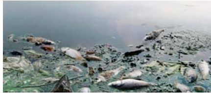
● تلوّث المياه سيء رئيس لكثير من الخسائر الاقتصادية