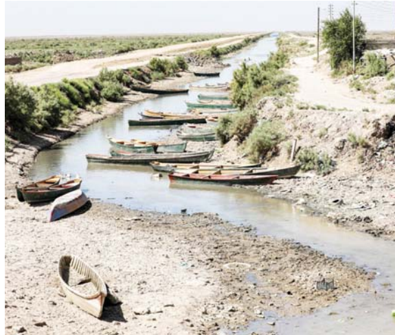
● الصيف الحالي شهد هجرة أكثر من 7 آلاف فلاح من الريف

وبيّنت أن العراق بحاجة ماسة إلى وجود الفلاحين في الريف وبحاجة إلى اهتمامهم بالموارد الزراعية والطبيعية، وهناك مشكلات كثيرة تنتج عن هذه الهجرة إذا