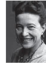
• سيمون دو بوبوار