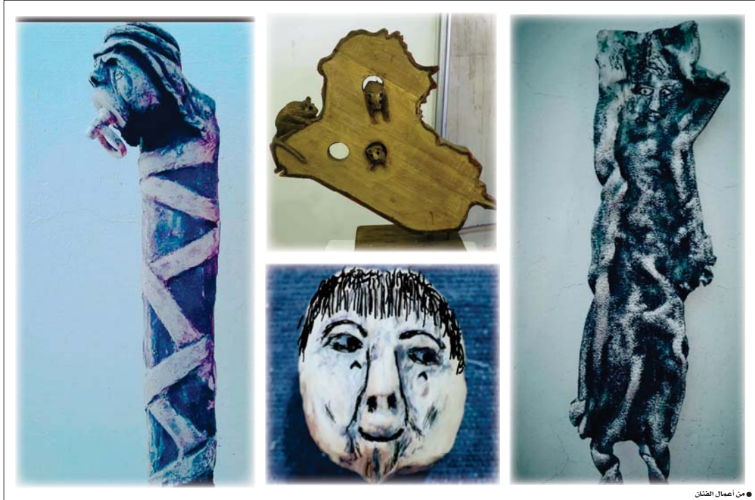
● من أعمال الفنان