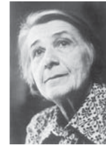
• ناتالي ساروت

الدعاية الحمضية بموهبة مبدعة، سيموني غابرييلا كويت؛ ربما على أن أصعبها في الحياة الأولى التي كويت كانت شخصية مهمة في النصف الأول من القرن العشرين، أول امرأة تتولى رئاسة أكاديمية غونكور، كانت شخصية تخريبية، بدأ أن لدى الجميع رأيهم في كويت، ولكن في الوقت الحاضر فضائل الحساس فليل على ما يهودي بسبب وحيه لإعادة اكتشافها، بالإضافة إلى أنها كانت مؤلفة جيدة جداً.