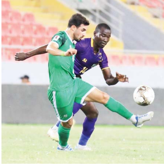
● اختيار معايير انتقالية قبل الشروع بشرروط دوري المحترفين

وتوه المصدر بأن الجانب الفني سيأخذ حيزاً كبيراً من متطلبات منح الرخص بأن يكون للنادي برنامج ممتد لتطوير الشباب كما يشمل رعاية طبية، عضواً مكتوبة مع الالاجين المحترفين إلى جانب تجهيز المرافق الرياضية بالشكل الأمثل وسأن تكون هناك شهادة اللعب، غرضها مراقبة في اللعب، منطقة الجماهير، الإسعافات الأولية، السلامة، خطة إخلاء معتمدة، جاهزية المرافق التدريبية، قيام باعداد التجهيزات الإرسادية والتوجيهية للجماهير من ذوي الاحتياجات الخاصة.