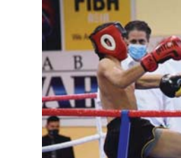
● البطولة محطة مهمة تحضير اللاعبين للاستحقاقات المقبلة