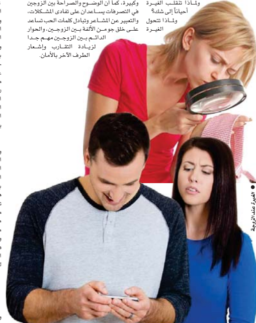
• غيرة عند الزوجية

بالعمل على بناء عائلة متماسكة خالية من المشكلات تحكمها القيم والأخلاق المنطلقة من المبادئ العربية الإسلامية، والتوعية بمسؤولية الوالدين ودرهم تجاه أبنائهم، لاسيما الصبية الذين هم دون سن البلوغ، وذلك في طرقات تتفهم أراهم ومشكلاتهم ومعاملتهم، وعلى وفق أساليب تربوية حديثة ومتابعة سلوكهم، والعمل على رفع الحواجز التي تمنعهم من الاضغاح عن مكونات انفسهم ومعاملتهم، وتوعية الأسرة بمخاطر العمل المبكر للعبئة والتناصح السلبية، التي قد تعرض لها، وذلك من خلال الندوات الإرشادية والمحاضرات ووسائل الاعلام، وقيام المنظمات المدنية والاجتماعية بزيارة الأسر، التي تعاني من مشكلات اجتماعية، لاسيما التجمعات السكنية العشوائية ومساعدتهم لاجل تطبيق هذه الظاهرة، والتعاون مع الجهات المختصة لإعادة المنسرين من الدراسة إلى مقاعد، والعمل على إيجاد أماكن سكنية تتوفر