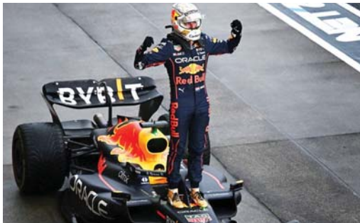
● فيرستاتين يقود فريق ريد بول لزيد من الانتصارات

نايجل مانسل المريض، وذلك قبل لفتين من نهاية السباق. وكان سينا متصدراً للسباق ويحاول تحطيم شليسر، فاستغل فتراتي خروج البرازيلي من السباق وحقق ثنائية عبر سائقه النمساوي غيرهارد بيرغر والإيطالي ميكيلي البويري بعد أسابيع فقط من وفاة مؤسسه إيزو فيراري. وأنهى شليسر حلم ماكلارين في الإبقاء على سجله عالمياً من الحساسة. وقد يكون مثل هذا السيناريو هو الأمل الوحيد لتتحيد ريد بول من تحقيق فوز آخر في سيلفرستون، ربما من خلال فيرستاتين، ومنح فريق آخر طعم الانتصار.