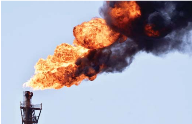
● استثمار الغاز الحر والمصاحب يوفر منافع اقتصادية ويقلل من المخاطر البيئية