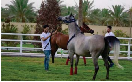
• تربية الخيول عادة متوارثة

وورد في الحديث النبوي الشريف علما أولادكم الرماية والسياحة وركوب الخيل. ولجمال الخيول وهيبتها أثارت اهتمام الشعراء، إذ ورد عن المتنبي بيت الشعر المشهور ( الخيل والليل والبيداء تعرفني والسيف والرمح والقرطاس والقلم).