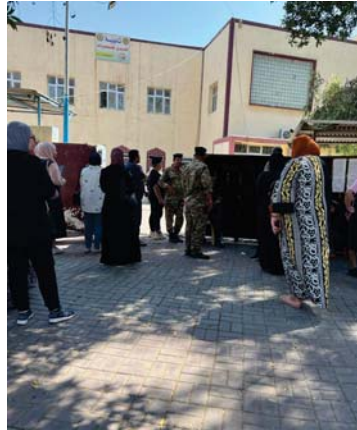
• قلق ومعاء

المنتبهة منذ الصيف الماضي ولغاية اليوم في كفة اخرى، فإن الاهل سنبوا يتحملون أعباء توصيل بناتهم وأبنائهم إلى مقر معاهد التقوية والى أماكن تواجد المدرسين الخصوصيين، وتعمل زحام الطرقات، لاسيما إن كانت في أماكن مختلفة، وليس ضمن نطاق المنطقة الواحدة، كلها عوامل تسهم في جعل الاهل والطلبة يتلق مستمر لغاية اجتياز أولادهم الامتحانات بسلام، فيعد هذا التعب والجهد الكبيرين من قبل الاهل، لدعم أولادهم للتمضي قدما من أجل النجاح، لا بد لهم من مجهودين انصام مهمتهم للأخير في الدعم، فيضطرون للوقوف أمام أسوار المدارس في انتظار أولادهم لحين الخروج من قاعة الامتحان، إيماناً منهم بأن هذا التصرف يعطي الأبناء الدعم والاهتمام.