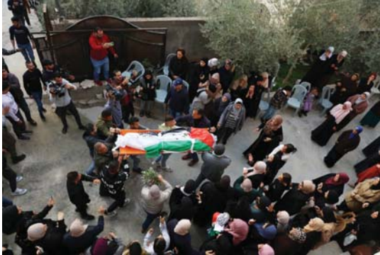
● جنازة مهيبة لأحد شهداء القنطرة الفلسطينية