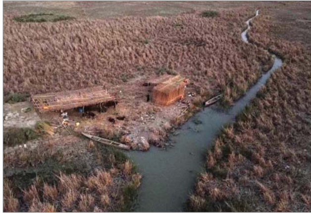
● دعوة لتوفير دعم طارئ يدرأ الكارثة التي تعيشها مناطق الأهوار