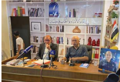
● متفق ميسان يحثون بالراحل الشيخ جعفر