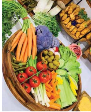
● لذة في الترتيب والتقديم

الأطباق لذيدة العلم، ومظهرها رائع، وهذا الضغط بإمكانه أن يكسبنا الخبرة وسرعة الاتقان والجدد.