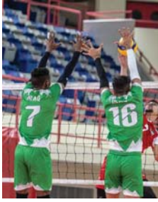
• منتخب الطائرة يبدأ تدريباته