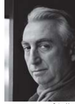
● رولان بارت

الاستنابية، التي تصور تصوراتها حول أربع كلمات مفتاحية هي جمالي، هي، أسلوب، شكل، تهدف إلى مركزية النص ضمن الحدود الشكلية أو البنية الشكلية للنص، وما يضيفه الشكل والإطار العام والبناء الداخلي في النص من محالية خاصة، بعيدا عن علاقته بالجمع أو دلالاته على مؤلفه أو محتواه في هذا السياق، فإن المنهج الجمالي في النقد الأدبي يسعى لاستثباته عن باقي المناهج (السياقية) التي تدرس الأدب من منطلق ارتباطه بسياقاته الاجتماعية والتاريخية، فضلا عن ارتباطه بالمؤلف (منهج النص) الذي اقتضى دوره في التصورات النوعية في سياق الافتراض البيوي - (موت المؤلف) كما عند رولان بارت، بيد أن هنالك تصورات أخرى للآداب تعمل على استنباط منهج تكاملي يعتمد على الاستراتيجية المزدوجة في قراءة النصوص، في معنى مفعول أن يمنح النص بوضوح تجربة جمالية واقعية هي نتاج تشكيلات خطافية تقع خارج حدود الجمالية إنما يتركز على تجربة واقعية يتم نقلها إلى العقل الابداعي، وذلك يعني ضرورة دراسة الأدب كمعطى