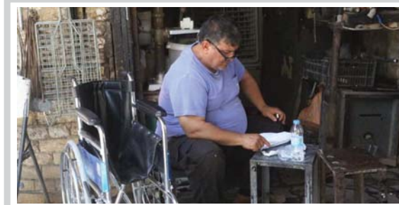
صورة وتعليق عوقه لم يمنع من العمل في مهنة شاقّة.