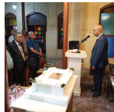
● العمل هو تأسيس شيء ناجح