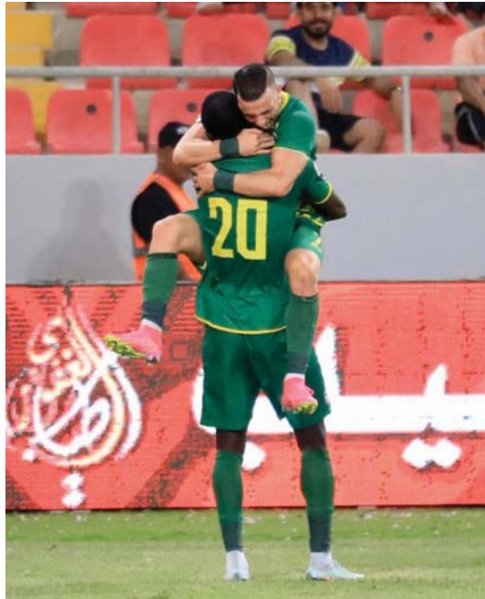
• هل سيسحها الشرطة قبل الجولة الأخيرة؟

سيكون الشرطة على موعد مع التنويع بطلاً لمناسبات الدوري الممتاز لكرة القدم للمرة السادسة في تاريخه، حينما يحل اليوم ضيفاً على نفط ميسان ضمن الجولة الـ 37، إذ يحتاج إلى تحقيق الفوز من أجل حسم اللقب رسمياً. وتنجح الفئارة في الجولة السابقة بالمحافظة على ضارب النقاط الذي يفصله عن أقرب منافسيه عقب تغلبه على الكهرياء بثلاثية نظيفة، ليصبح على بعد خطوة واحدة من إحراز الدرع الثاني له توالياً. بدوره يسعى فرسان المملكة إلى تأجيل أفراح البيت الشرطائي ممولين على عالمي الأرض والجمهور لتحقيق الهدف المنشود، إلا أن طموحاتهم ستصطدم بإمكانات الفريق الأخضر المدجج بالعناصر المميزة من المحليين والمحترفين ويقف الشرطة في صدارة الترتيب برصيد (76 نقطة) متوقفاً على القوة الجوية الوصيف بفارق 4 نقاط، بينما يمتلك نفط ميسان (48 نقطة) في المركز الثاني عشر. من جانبه يحتاج الصقور إلى معجزة للإبقاء على أمانه بأحرز اللقب، لكونه مطالب بجمع 6 نقاط من مبارياته المتبقية اليوم أمام زاخو والجوية الأخيرة ضد نوروز، شرط تعثر الشرطة بالمتأمل أو الخسارة في مواجهتي نفط ميسان والحور. وفي لقاء آخر يخوض الطلبة صاحب المرتبة الرابعة مباراة صعبة عندما يلاعب نوروز، ويتطلع إلى حصد النقاط الكاملة التي تقربه من المركز الثالث. ويرنو الكهرياء إلى استعادة توازنه أمام الديوانية، إثر الخسارة التي تكبدها بمواجهة الشرطة في الجولة السابقة، وينظر الفريق البرتقالي لهذه المباراة بعين التعويض بهدف العودة للترتيب الذهبي، في حين يعد اللقاء للأحمر الديواني بمثابة تحصيل حاصل، بعدما تأكد هبوطه رسمياً للدرجة الأولى. ويشهد الحدود الرجال للاقعة دعوك في مباراة تبدو متساوية الحظوظ بين الطرفين.