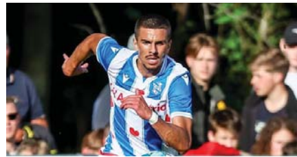
• موهبة جديدة قادمة لتشكيلة الأسود