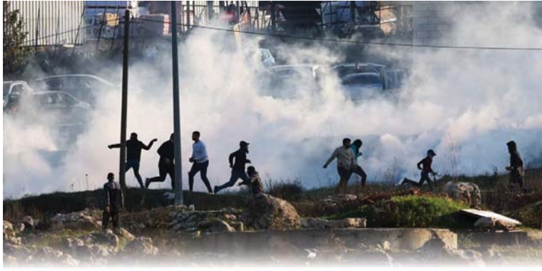
● القنطرة حتى غربي لايفاء فلسطين ضد الاحتلال الاسرائيلي