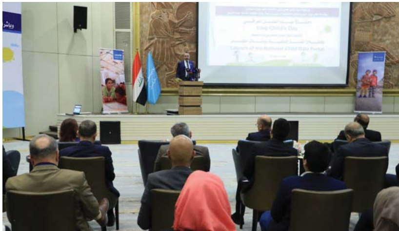
● الأطفال أكثر الشرائح السكانية تأثراً بالتحديات الأمنية والاقتصادية والاجتماعية والصحية