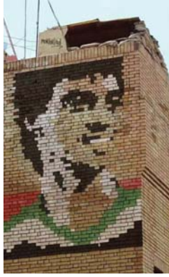
● مخلص حبيب من ألوان جدرانته

ما يباع على بالي ويوزقني كثيراً هو المثلور على صيغة للحفاظ على هذا التراث وأرشدته، واستعداده واستحضار الصالح الفاعل منه، سواء من خلال مبادرات مؤسسية أهلية أو رسمية، إذ المهم هو حفظ ذاكرة العراق بحفظ جهود أبنائه.