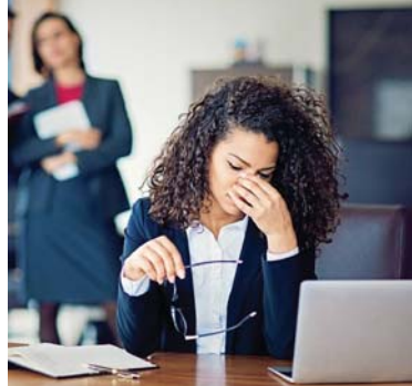
● التأثير في نسبة التتم

Workplace Bullying Institute وجد معهد نسبة تصل إلى 80 بالمئة من قبل نساء أخريات، بينما أظهرت دراسات أخرى أن النساء اللاتي يقدمن تقارير إلى النساء يتعرضن لسلوكيات أكبر من التتم وسوء المعاملة والتخريب الوظيفي، وهذه الظاهرة تسمى «متلازمة ملكة الحلحل» وتستخدم لوصف النساء المسائت اللاتي يقمن عن قصد بكبح النساء الأخريات بسبب جتسهن وقد تمت صياغته في السبعينيات ولا يزال يستخدم حتى اليوم.