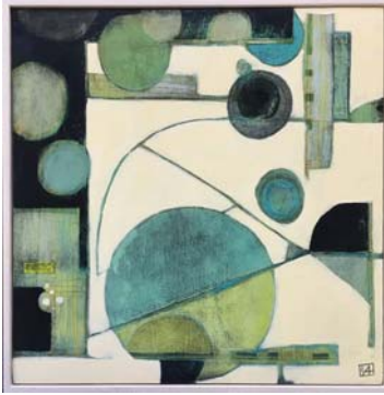
• روحات الفتنة ايزابيل الصنادير

إدخالها. وهناك ازدحام الحوادث الكثيرة التي تنتظر الدور في إدخالها لصالة العمليات، كل الفحوصات تشير إلى أنه لا بد من إجراء العملية، وإلا فإنها ستموت، ولكن أي وحش سيأخذ من أحضانها، كان الوقت متأخراً منتصف الليل، وما أن صارت بيد الفريق حتى صاحت الطفلة بصوت فطر قلوب الجالسين الذين كانوا يشاهدون الموقف، وما أن قالت وهي تمد ذراعها، وتطلق يأس (ماما) انهارت الأم الشابه وندت عنها صرخة مدوية هزّت أركان المكان، حتى أن الكثير من الحاضرين، قاموا من أماكنهم لمشاركتها والتخفيف عنها ومنحها الصبر والأمل بالله لكن صوت ابنتها ظل يتردد في مسامعها تلك الجملة الوحيدة، التي فطرت قلب أمها.. (ماما) تعبير أن لا تتركيني يا أمي) وهي تراها في آخر مشهد تمدّ ذراعها نحوها. صرخت بجون بعد أن غابت ابنتها عن نظرها ومزّقت سكون الليل، الذي كان يشير إلى منتصفه! وأي أم تعبر