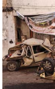
● سيارة متضررة بعد دخول قوات الاحتلال الاسرائيلي إلى جنين