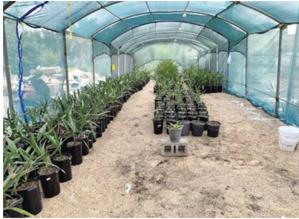
● زراعة التخليل تشهد توسعاً كبيراً وزيادة مضطربة

واقع القطاع. وأشار إلى أن أعداد التخليل وصلت اليوم إلى أكثر من 20 مليون نخلة بعد أن نجحت الوزارة في استزراع التخليل في مناطق خارج المتعارف عليها في كل من محافظات نينوى وكركوك وصلاح الدين ومناطق البادية في الأنبار، منبهاً إلى أن تلك المناطق لم تكن مستزعة بالتخليل على اعتبار أن الأجواء كانت غير مهيأة للزراعة وبالتالي ازادت المساحة الجغرافية الخاصة بالتخليل تتوسع إلى مناطق لم تكن سابقاً معروفة بزراعتها.