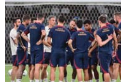
● إنريكي مطالب بوضع حلول للخطة الدفاعية