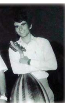
● الخماش مع تلميذة عبد الملك الكريم

وفي تموز سنة 1948 حل الفنان روعي الخماش ضيفاً على العراق للمرة الثانية، لتكون محطة استقرار. عمل في وطن جديد زاخر بالمعارف والفنون والترات، واستمتع الخماش من خلاله فعلاً أن يعمل ويبدع ويحفل موقفاً فنياً متميزاً في جميع أرجاء الحركة الموسيقية. إذ عيّن حال وصوله العراق 1948 م رئيساً للفرقة الموسيقية