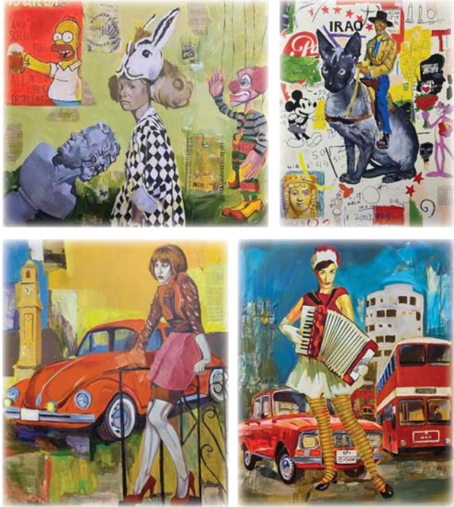
● من أعمال الفنان