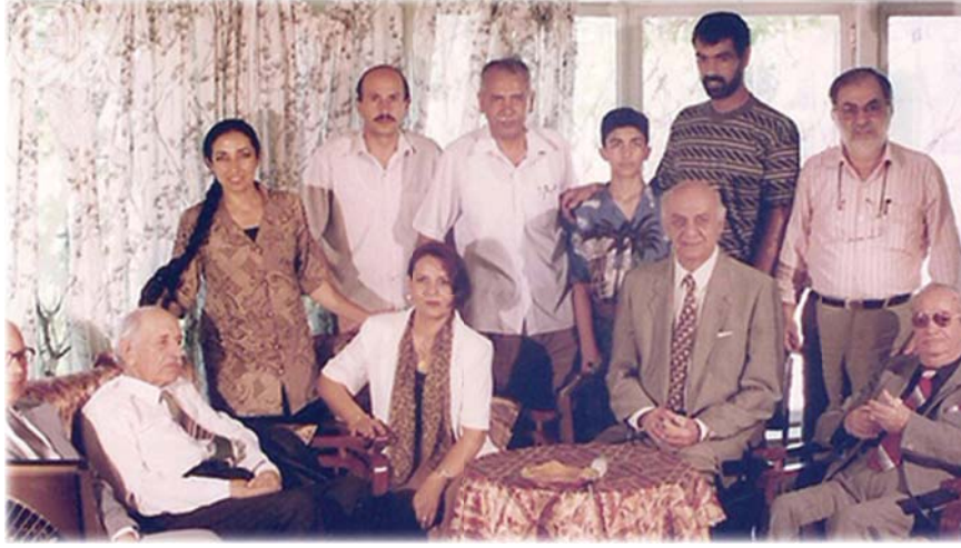
● الخماش مع نخبة من الموسيقيين

اعتاد العراقيون لسنوات طويلة، أن يستقبلوا إفطارهم خلال شهر رمضان بإبتهاال يا إله الكون إننا لك صمنا للموسيقار الراحل روعي الخماش بصوت فرقة الإنشاد العراقية، حتى بات هذا الإبتهاال جزءاً من طقوس شهر رمضان، يطرق أسماعنا بمهابة وبهجة حال الايدان بتناول الافطار. والفتان الملتزم هو الذي يوظف الفن في خدمة غايات نبيلة وسامية. وهذا ما فعله الموسيقار روعي الخماش عبر مئات من أعماله الموسيقية. كالموشحات والانتهاالات والأناشيد الدينية والديوية والوطنية. روعي الخماش التسطيطي الذي ولد في نابلس وجاب العديد من البلدان العربية، ليستقر به المقام في العراق فأحب العراق وأحبه العراقيون ومن بغداد برز نجمه، حتى بات معروفاً بالعراق أكثر من فلسطين.