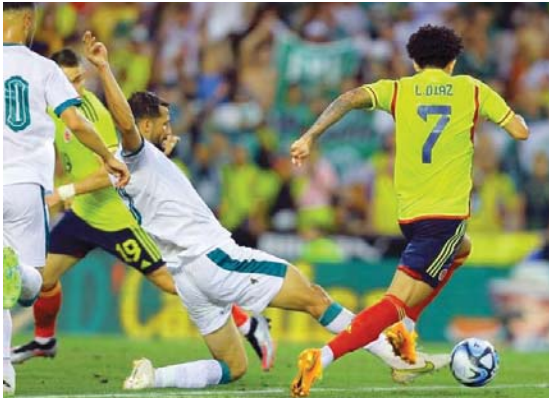
فرقة متوازنة لمنتخبنا في التصفيات الآسيوية المشتركة

ويجد أن "كرة العريقة عادت من جديد إلى مصفاة التنوع وحقت نتائج جيدة على صعيد الشباب والأولمبي والوطني فضلاً عن تواجدهم المدرب الإسباني خوسيه كاساس الذي وصفه المؤلفين منهم لتمثيل المنتخب إلى جانب محترفيها في الخارج الذين تمت مرافقتهم عن طريق مبارياتهم القوية بالباشل أو المسجلة عبر مواقع التواصل الاجتماعي". مشدداً على أنه "لا توجد أي مشكلة في اختيار الجديريين منهم على أن تكون الدعوة لأفضل".