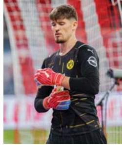
● غياب كوبل عن ودية دورتموند المقبلة

أمام مانشستر يونايتد بسبب مشكلات عضلية. ويغيب عن دورتموند في الوقت الحالي أيضا جيمي بيونيفينتر وجيوفاني رينا، حيث لا يتمتعان باللياقة للمشاركة.