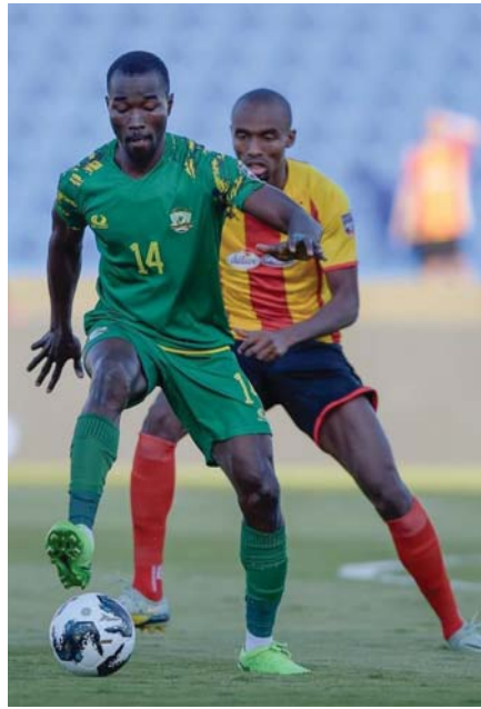
● الشرطة يلعب بخيارين

اليوم يثبت الشرطة هيبته وأحقية التأهل، وهو رنان لا بد من الفوز به برغم المواجهة الممقدة مع حامل لقب الدوري السعودي، لن يكون هناك أثر للأسماء والنجوم والأرض والجعمود الأثر البالغ سيكون للمدربين وما يحرص عليه لاعبوها من مستويات يزره بها طريق المجد الذي تتناهيه في بطولة عربية تضم أفضل الأندية الآسيوية والأفريقية، حافظوا على رباطة جأشكم وقدموا مباراة الممر، فيكم ومعكم تتشلق كرتا لأيام يسباضاً زاهية جديدة للعراق نفرح بها جميعاً ولتمتعتنا الأمل بنجاحات وإنجازات فرحة بخلع بها مستقبلنا التي نعصفه سواعد الأبطال وهمم الغباري من أبناء هذا الوطن الحبيب.