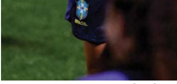
● بسطورة البرازيل تبدي مخاوفها من نهاية حزين

وقالت في تشييمها إلى ما وصلت إليه الكرة النسائية "من المتفاني أن يسمعونني رغبة لي في هذا، لأنه قبل 20 عاماً، في 2003، لم يكن أحد يعرف مارتا".