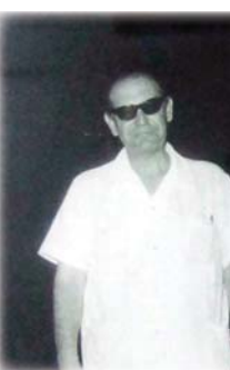
● الخماش مع تلميذة عبد الملك الكريم

كان مجموع ما لحنه الخماش من موشحات للفرقة ما يقارب الأربعين موشحاً. إضافة إلى تدريب الفرقة على العشرات من الموشحات العربية والاندلسية المشهور، فضلاً عن أغنيات