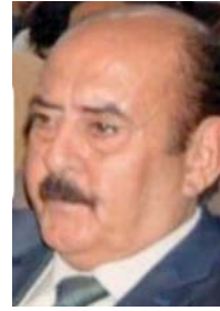
● غزاي درغ الطائي

ويعتبر يوسف هذا حسارة فاحدة للأديب، الذي يقع في هكذا شرك ينفقه أهم القيم الجمالية والإبداعية والأكثر من ذلك يقع في خضم، وهم وترجيحية من ورق ضمنت له من الخارج، فلم ير سوى نفسه مبدعاً كبيراً لا يأذ أن حتى تكبر أو تتعفن، أما المسار الثاني كما يقول الشاعر هو الاسم الذي اشتغل عنه صاحبه بكل جد وحث في صخور المعرفة، ووسلوا لحقيقة الإبداع وعاش معاناته الإنسانية وذاق مرارات التقفر والأهمال والتمهيش وربما شهد تجربة الموت لأكثر من مرة وأحياناً مصادرة أحلامه وتوجيه شتمه له ومع ذلك فقد بقي كشجرة