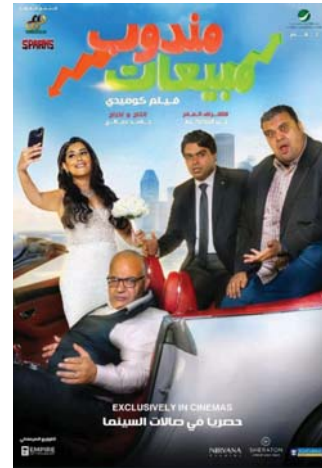
● بوستر الفيلم

طرح المخرج العراقي حامد صالح، فيلمه "مندوب مبيعات" في دور العرض المصرية والعربية، مطلع آب الحالي، وهو ثالث أفلامه بعد "شمانتا أرتجيتيوز" 2018 و"الممرس" 2020. وقال صالح لـ "الصباح" يتحدث الفيلم عن شخصيات مصرية مقيمة في الإمارات، دائراً حول مشكلات زوجية تدفع بيومي وسيد للسفر والتصال صفة مندوبي مبيعات في شركة سعيد الذي يدخل صراعاً ضد فريدة وشركتها للحصول على جهتها والاتصال بها فيكون سبب تعقيد الأمر بينهما بما يعيق تحقيق طموحات سعيد، مؤكداً: