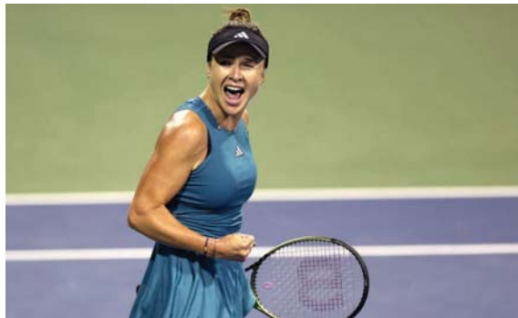
● سفيتولينا تفوز مجدداً على أزارينكا

● خرجت الأوكرانية إيلينا سفيتولينا منتصرة للمرة الثانية توالياً من مواجهاتها الحساسة "سياسياً" مع البيلاروسية هيكتوريا أزارينكا، بالفوز عليها 6-7 (2-7) و6-4 في الدور الأول بطولعة واشنطن في كرة المضرب.