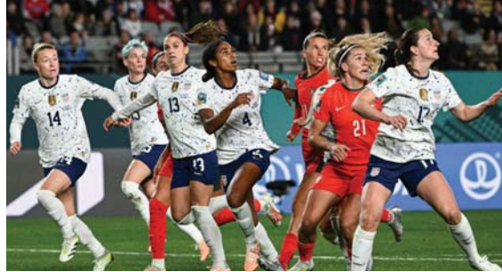
● أميركا تتجو من فخ البرتغال

ونزلت سيدات هولندا أمام اليابانيات إلى النهائي وخسرن 1-0. وسقطت سيدات هولندا أمام اليابانيات 1-0.