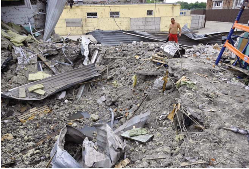
● استمرار الهجوم الأوكراني لن ينجح عنه سوى دمار مزيد من المدن الأوكرانية..