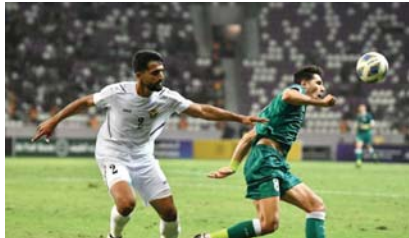
● الأولمبي يبدأ استعداداته من مصر

ووفت إلى أنّ الأولمبي سيخدل في تجمع داخلي مغل في محافظة البصرة بعد العودة من معسكر القاهرة، تتخلله ثلاث