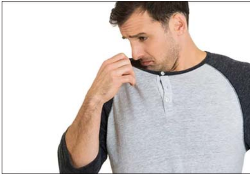
● الإنسان واهتمامه بنظافته جسمه

أهم ما يميز الإنسان نظافته الشخصية، فالاهتمام بها واجب عليه كما واجب الرد في تعامله الأخلاقي، فجميل عندما تمتزج الأخلاق والنظافة لتتكون إنساناً نموذجياً فالعكس يكون الشخص غير الملائم في جميع الأوساط الاجتماعية. والمجتمع بطبيعته يفضل أن يرى المقابل بآناقة وترتيب ونظافة، فهي سمة تميز الإنسان عن غيره، ولعدم اهتمام البعض من الأفراد بالنظافة الشخصية والتي تعكس على المكان الذي يعملون به كانت لنا جولة تحقيقية.