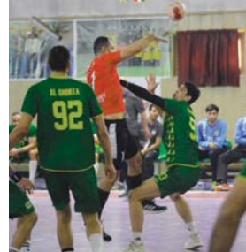
يد الجيش يشرع بتدريباته