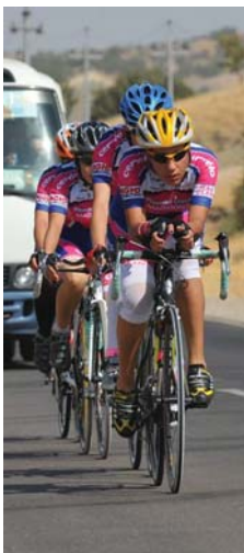
● طواف تركيا فرصة لتطوير دراجينا