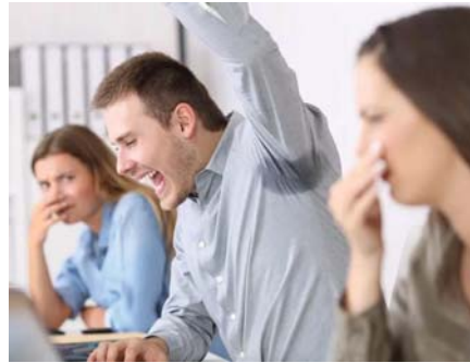
● نفور الناس بسبب الروائح الكريهة

المفاسل المتعلقة بالإنسان ونشأته وترتيبه وسبل تحصيله من أي ضرر يلحق به، فكان القرآن الكريم أممية النظافة، فقال تعالى: (وَيُذَكِّرُكَ فَطَهْرُكَ) (سورة المدثر، الآية 4).