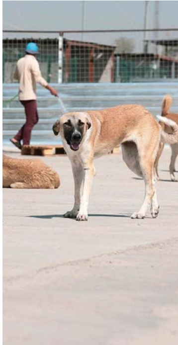
● إيواء الكلاب السائبة في بعض المحافظات

وأقضيها واستعمل لهم تلقيحات وترفع جميع الكلاب على أذانها من قبل دائرة البيطرة لمحافظة أربيل والجهات الأخرى التابعة للصحة والبلدية. وأضاف وجود المنظمات والشركات الخيرية أسهم في هذا الموضوع إلى جانب الحكومة، وسوف تتصل المذكور عن الإنثا لكي لا تتنازع وتكون لهذا المأوى إدارة منظمة تعتنى على قسم البيطرة وقسم التغذية والتقسيم الصحي وأقسام أخرى.