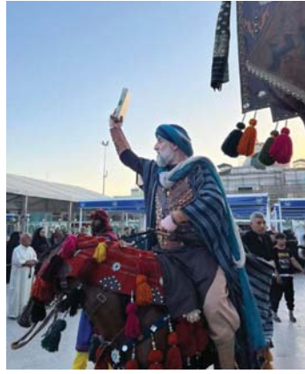
بربر ناطقا عن أبي عبدالله

معدزة لوطين كان بلد التخليج الأول في العالم، لكن أصبح شاعره يعلم بـ (ماعتون) فيه يضع حيات من تمور البرجي أو الخضراوي أو البربري أو البريم أو الخضراوي أو أصابع العروس.