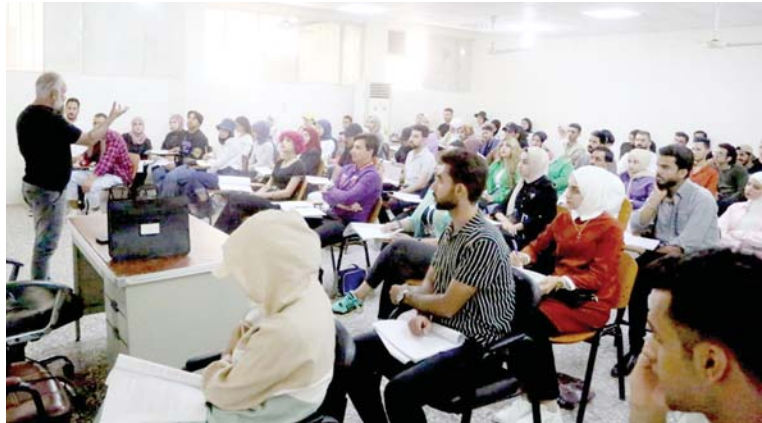
الطلبة في محاضرة

شهدت السنوات الأخيرة تزايداً في عدد الجامعات الخاصة. لعدة أسباب يعزوها بعض المختصين الى احتواء العدد الهائل من مخرجات الثانويات بسبب تزايد الكثافة السكانية. والبعض الآخر الى قلة نسبة المعدلات الحاصل عليها بعض الطلبة في الامتحانات العامة. ولم تؤهلهم لدخول الجامعات الحكومية. فهل تعد نعمة أم نقمة على القطاع التعليمي؟