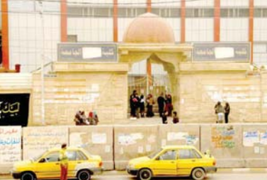
أحدى الجامعات الأهلية