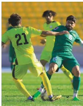
تأكيد إقامة دوري المحترفين الموسم المقبل

ويجد أن "كرة العريقة عادت من جديد إلى مصفاة التنوع وحقت نتائج جيدة على صعيد الشباب والأولمبي والوطني فضلاً عن تواجدهم المدرب الإسباني خوسيه كاساس الذي وصفه المؤلفين منهم لتمثيل المنتخب إلى جانب محترفيها في الخارج الذين تمت مرافقتهم عن طريق مبارياتهم القوية بالباشل أو المسجلة عبر مواقع التواصل الاجتماعي". مشدداً على أنه "لا توجد أي مشكلة في اختيار الجديريين منهم على أن تكون الدعوة لأفضل".