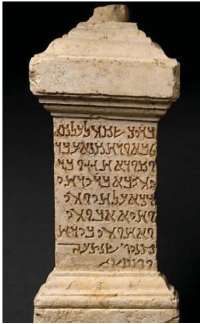
● أحد الكتابة الآرامية وبيدة الألبانية الكنعانية

كثيرة، كالتة، بالأصل من كلده). ثم تم غزو الآراميين ما بعد من قبل الإمبراطورية الأخمينية (539 - 332 ق.م). وعُدّ الفرس أنفسهم ورثة للإمبراطوريات السابقة، وحافظوا على الآرامية بوصفها اللغة الرسمية للحياة العامة والإدارة، إذ بقيت الهياكل الإدارية الإقليمية كما هي، وجاءت اقتباسات الإسكندر الأكبر (336 - 323 ق.م) والأرمينية الهلنستية لكل من السلوقيين (305 - 64 ق.م) والبطلمية (305 - 30 ق.م)، وعاش الآراميون تحت هيمنتهم ثم استخدم اليونانيون القدامى المصطلحات السوروية كتسميات للآراميين والأراضي الوردية، ولكن خلال الفترة الهلنستية (السلوقية - البطلمية) تم التعريف بمصطلح سوريا للإشارة إلى مناطق غرب نهر الفرات، التي على عكس مصطلح آشور، الذي يشير إلى مناطق أهد شرقاً.