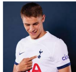
● ميكي فان دي فين

● لندن، آ ف ب مليون مع المكافآت. وبدأ فان دي فين مسيرته في نادي فولندام الهولندي قبل الانتقال إلى فولفسبورغ عام 2021. ويات فان دي فين خامس صفقة توتنهام استعداداً للموسم الجديد. ويستهل توتنهام مشواره في الدوري الإنكليزي الممتاز في مواجهة برنتفورد خارج ملعبه الأحد المقبل. 40 مليون يورو مع إمكانية أن تصل إلى 50