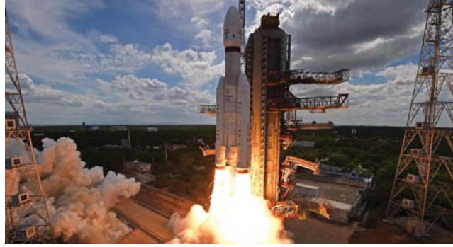
• مهمتها التجوال حول مسطور القمر وجمع البيانات وإرسالها إلى الأرض