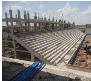
● شركة تركية ستبدأ عملية إعمار الملعب