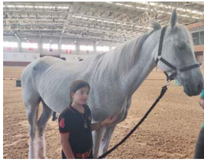
● الفارسة الصغيرة

وأضافت لائبا: أنا مسعدة جداً بحصولي على هذه الهدية من الشيخ محمد بن راشد، والمتضمنة عشرة خيول ومركز تدريب للفروسية، إضافة إلى حصولي على الإقامة الذهبية في دولة الإمارات ومن المقرر أن أشارك في بطولة الخيل الدولية للقدرة والتحمل في الإمارات خلال شهر تشرين الثاني المقبل.