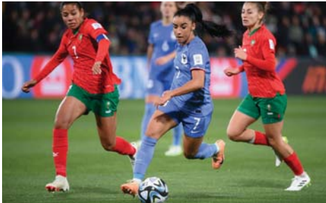
منتخب سيدات فرنسا يسير بثبات نحو اللقب

وكان المنتخب الجنوب أمريكي فشل في التأهل إلى نهائيات 2019، إلا أنه قام بخطوات عملاقة في القشرة الأخيرة، بعد أن تصدر مجموعته في الدور الأول للنسخة الحالية أمام المغرب، فيما أفضيت الأدوار الاقصائية.