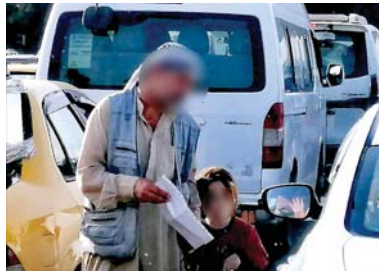
● ادعاء المرش صورة أخرى للتسول

وأشارت إلى أن "العديد من هؤلاء (النصحاء) يتم إعطائهم مواد معدرة من مافيات لضمان استمرارهم"، وأوضحت أن "هذه الظاهرة ليست جديدة فهي موجودة منذ عقود، إلا أنها انتشرت أكثر حالياً بسبب غياب