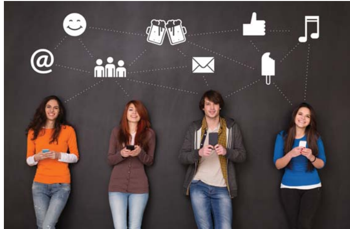
• مواقع التواصل الاجتماعي ومنافذها العديدة

من غير الممكن، ولا المعقول أن يستوعب القطاع الحكومي كل هذه الأعداد المتزايدة - وفي كل عام - من الخريجين وغيرهم، إذا ما علمنا التحفة المتزايدة التي تأتي منها دوائر الدولة ومؤسساتها من الموظفين. لكن الحكومة مطالبة بإيجاد فرص عمل لهم، ولجوه هؤلاء الشريحة المهمة لسوق العمل الإلكتروني، جاء بسبب انعدام نوافذ اقتصادية تستوعب تخصصاتهم، فيعضهم ينجح في تجربته، ويطورها، وأخر يفشل، ومنهم من يحاول، ولا يرمي منديله. لكن عينه تبقى ترنو لمستقبل زاهر، وواقع اقتصادي صحي لبلاد، يجد فيه الجميع -دون استثناء- فرسهم الحقيقية بالعمل؛ لنهنا نفوسهم، ونقر بعينهم، يعيش كريم ولتلق.