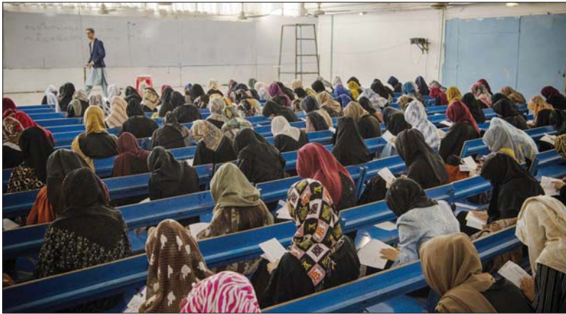
● صف دراسي لفتيات افغانيات.. من الماضي