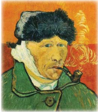
● بورتريه فان كوخ

تؤدي شهرة الفنان دوراً كبيراً في تسويق نتاجه الفني وتحديد قيمته المادية، وبعض النظر عن المستوى الفني المختلف نسبياً بين نتاج وآخر، إذ إن من فئتي هذا النتاج سيبيح عن توقيع الفنان قبل أن يبعث عن قيمة العناصر الفنية للوحة والأسلوب الذي تشكلت فيه، ويناء الاسم الفني في السوق الفنية ليس أمر أسهل، إذ إنه أحيانا يرتبط بأسباب لا علاقة لها مطلقاً بالفن. فقد تكون شهرته لواقف سياسية معينة، أو لواقف اجتماعية جريئة طرحها في بيئته، فضلاً عن أسباب أخرى لها صلة بقدوم الفنان أو انتمائه إلى مرحلة معينة تاريخية من الأجيال الفنية. وعلى سبيل المثال فإن أعمال الفنان جواد سليم ذات مكانة مرموقة في سوق الاقتناء على ندره الحصول عليها، لأنها تتفق بجمع فنية حدائث عالية تمثل مرحلة الريادة التشكيلية الحديثة في العراق والوطن العربي، فضلاً عن تمتعها