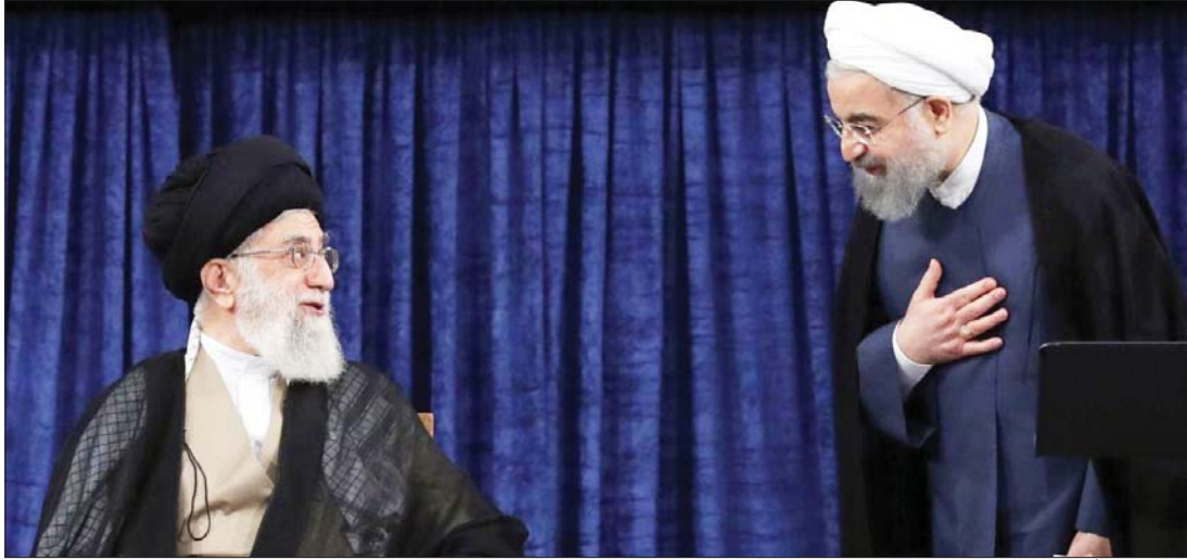
● اجتماع المرشد الأعلى مع روحاني لساعة كاملة يشير جملة من التكتلات

حسن روحاني هو الرئيس الإيراني الوحيد الذي هدد بالمحاكمة بتهمة هدر مصالح البلد وتهديد أمنها القومي، وجمعت ضده الملفات والتوقيعات، واتهام عليه النقد الأصولي الشديد الذي تجاوز حد هتك الحرمية إلى الاتهام بالخيانة، فاختار الصمت والثوري في بيته والاعتزال المطلق عن شؤون السياسة سنة وأكثر زاد في الأجواء السلبية من حوله عدم اختياره عضواً في التركيبة الأخيرة لجمع تشخيص مصلحة النظام أسوة بسلف آخر له هو الرئيس الأسبق محمد خاتمي، الذي حرم هو أيضاً من عضوية المجمع، في إشارة من أوسط مدلولاتها الظاهرية، تتخلل علاقته بالمرشد ومكتبه، وشبه إجماع أصولي على إدانة الخط العام لسياسات حكومته الداخلية والخارجية، وتحمليه مسؤولية ما تعاني منه إيران اليوم من أزمات اقتصادية ومعيشية واجتماعية في الداخل، ومشكلات في السياسة الخارجية.