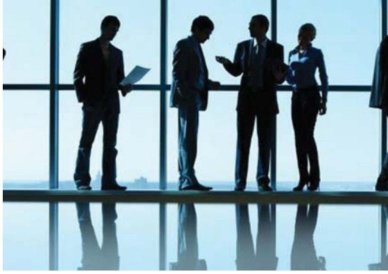
• تاحة العمل للمواطنين عبر البوابات الرقمية

نادراً ما تجد فئة قليلة من الشباب - الخريجين والذين لا يمتلكون مؤهلاً - فرصة للتعيين، في دوائر الدولة ومؤسساتها، في ظل انحصار وقلة فرص العمل في القطاع الخاص. فهؤلاء -الذين يتخبطون في القطاع العام- هم محظوظون بينهم تلك الفرصة، سواء أتمهم ببناء وتعب، أو بفعل وجود واسطة أو دعم معين.