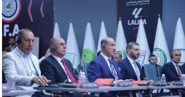
● جهود حثيثة لإنتاج دوري المحترفين

نظم الاتحاد العراقي لكرة القدم في مقره يوم أمس الثلاثاء، اجتماعاً موسعاً لممثلي أندية الدرجتين الممتازة والأولى مع رابطة الدوري الإسباني (لا ليغا)، بحضور أعضاء المكتب التنفيذي ورئيس الرابطة الإسبانية خافيير تيباس الذي اتصل بالحاضرين عن طريق الدائرة الإلكترونية (اون لاين) من مقر إقامته في مدريد.