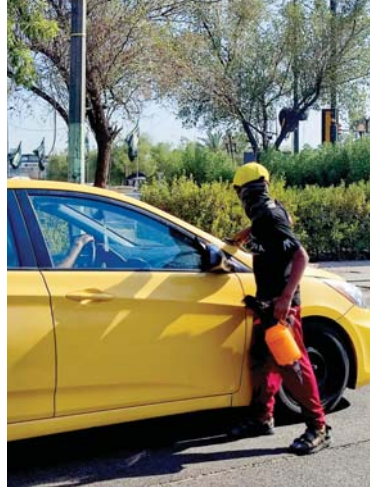
● ماسحو الزجاج يحرجون أصحاب المركبات

روتين التعقيد في البيت! من الشباك كوتيلهم تعالوا باهم!