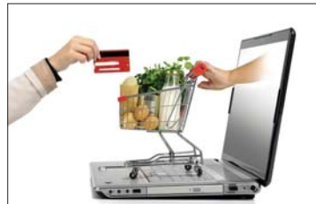
• التسوق الإلكتروني

لا تسارق الإيتمامة معيها، ويبعث الأمل والتفاؤل لجميع من يشاهدهم، بالرغم من ظروفه الاقتصادية الصعبة، وتفاصيل حياته المرهقة، فبعضها كان يمتلك مكتباً يبيع فيه خطوط شركات الاتصال (اسم كارت)، وتتم فيه صيانة الهواتف