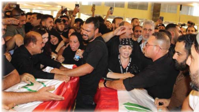
● أثناء تشييع الفنانين فلاح ابراهيم ورشا طارش