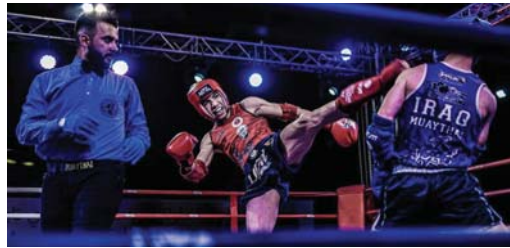
● طموحات بتحقيق نتائج إيجابية في بطولة العرب