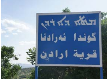
انظر الحلقة القادمة من كاشوف مرقع عراقي