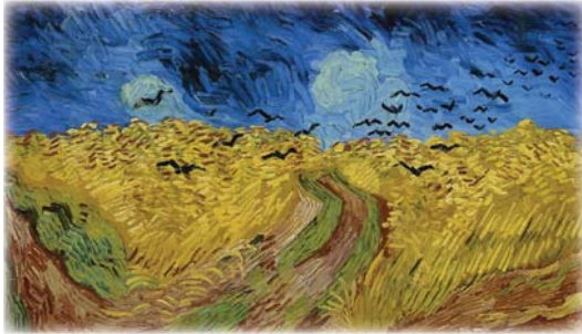
● غريبان فوق حقول القمح لفنان كوخ