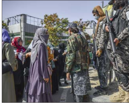
● حركة طالبان تمنع الفتيات من مواصلة الدراسة بعد مرحلة الابتدائية

ومع ذلك فهذا لا يمنع وجود حالات مبهترة هنا وهناك، فهي بعد أمتار قليلة من المرمر المزدهر في المستشفى، كان بعض المرضي يعترضون بنشأة تبلغ من العمر 16 عاما لدى دخولها إلى المستشفى، وتذكر والدها كيف تدهورت الصحة النفسية لابنتها بعد أن منعها خطيبها البالغ من العمر ثمانين عاما من الذهاب إلى المدرسة.