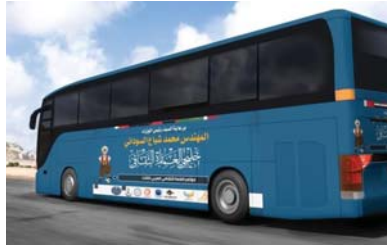
● باص التنمية

تأمل أن يطرر توجيه السوداني خفزة (المضاربين) إلى الأيد، فالوطن لا يستحق إلا الرخاء والود، إنه يكره الرياء، ويكره الكذب، ويكره خلق الخير واختلاجات الحد والابتدال، فما أوجنا إلى أمن صادق، واقتصاد متين، ورعاية صادقة وأبوة خنون.