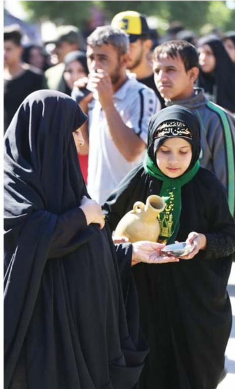
الحكومة تولي أهمية كبيرة للزيارات الملبئية التي يشهدها العراق سنوياً

المقدسة، وتتضمن إنشاء وتأهيل الطرق وإقامة الجسور وبناء السكك الحديدية ومشآت المنافذ الحدودية وساحات تبادل البضائع والمنتجات والمدن لاستراحة الزائرين. وفي السياق، أعلنت وزيرة الاتصالات هيام الياسري تشكيل الوزارة غرفة عمليات لمناقشة تنفيذها لتعليمات الموازنة. وقالت الياسري، «تتضمن استثمارات الوزارة في مجال الاتصالات 13 مليار دينار، وهي من أهم القطاعات التي تساهم في التنمية الاقتصادية وتنشيط السياحة الدينية». وأضافت الياسري، «تتضمن استثمارات الوزارة في مجال الاتصالات 13 مليار دينار، وهي من أهم القطاعات التي تساهم في التنمية الاقتصادية وتنشيط السياحة الدينية». وأضافت الياسري، «تتضمن استثمارات الوزارة في مجال الاتصالات 13 مليار دينار، وهي من أهم القطاعات التي تساهم في التنمية الاقتصادية وتنشيط السياحة الدينية».