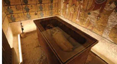
• مقبرة توت عنخ آمون

يؤكد علماء المصريات أن السبب وراء اختفاء مقبرة الفرعون الشاب دون سابق إندار هو أنها لم تكن مميزة، لأنها كانت صغيرة