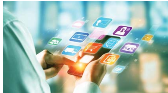
• أساسيات التسويق الرقمي وطرق عمله

إنما الإنسان مستقيل في أي وظيفة، فمثل هذه الوظيفة، ينتجها بالتشغل والتكسل هوسمة الراغبين للواقع، وعليه كل نوافذ العمل متاحة للجميع، ورغم قلها لكن التاب والأصيل هو البحث والاستعداد للنفس، ليتروح العمل دأشاً فيها: لأنها الفيصل الوحيد من عدم وضع الإنسان في