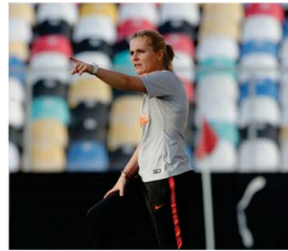
● فيغمان تتألف لوحدها الاجتياح الذكوري في ربح النهائي

قالت فيغمان: "ما نأمله هو أن يصبح هذا التوازن صحيحاً في المستقبل، ونحن نعمل على ذلك، على الأقل في إنكلترا". وأضافت: "أعلم في الكثير من البلدان الأخرى أيضاً، أنه يجب إعطاء فرص مزيد من النساء في اللعبة وأمل أيضاً المزيد من المدربات في اللعبة". وتعد فيغمان (53 عاماً) حاملة لقب كأس أوروبا مع "الطوائ الثلاث" بعدما توجت بعباس أوروبا مع "الطوائ الثلاث" الهولندية عام 2017 قبل أن تعود بلاذها إلى نهائي كأس العالم بعد ذلك معاً مع ماين من فازت بكأس أوروبا للمرة الثانية في مسيرتها العام الماضي مع "الطوائ الثلاث".