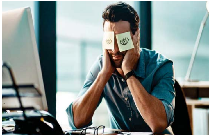
● شعور الموظف بالحيف حين يرى أن ما يتقاضاه لا يساوي ما يبذله من جهد فكري وتعب جسدي

ما نرجوه هنا من العاملين في المؤسسات أن يكونوا أقوى من ضغوط العمل، وأن يتقنوا براعتهن وتفرضوا في الأربعين سنة الأخيرة لكل أسباب الاحتراق النفسي، ومع ذلك طلوا متعلقين بالحياة وبالوطن.