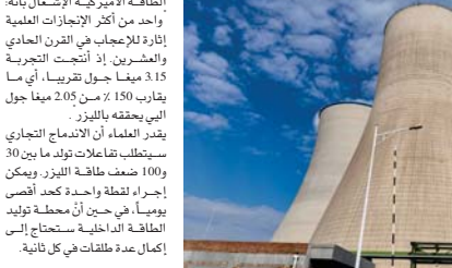
• علم طاقة لا محدودة خالية من الكربون

طاقة أكثر مما يستهلكه التفاعل، والذي يعرف بـ الاستعمال لكنّ العلمي الجديد المثير، وكررتنا الباحثين في مختبر توراتس لبرمور الوطني الفيدرالي بكاليفورنيا، الذين تمكنوا من تحقيق الاستعمال لأول مرة العام الماضي، استطاعوا إعادة تنشيط هذا الاندماج، لكن هذه المرة تنوعوا طاقة أعلى.