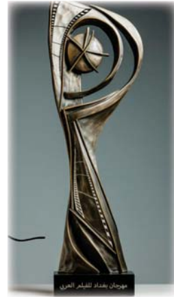
● شعار المهرجان

وأكد البحراني استوحته من شكل المرأة العراقية، التي قدمت الكثير وتستحق أن تكون حاضرة في هذا الملتقى السنوي المهم والمميز، فكان هذا الشعار وكأنها امرأة تهزج ترحيباً بضيوف العراق، وقد تحول الرأس إلى شمس تشرق من جديد من العراق لتتبع جمالاً إلى كل العالم، مضيئاً، الجسم الخاص بالجازرة من البرونز المالح بألوان، نفذه مصغر متخصص في بيروت.