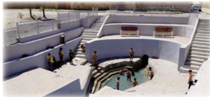
● قنه قهر داعش