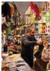
● أغلب البضائع لا تخضع لسيطرة نوعية حقيقية

مؤكداً أن المنتجات المحلية والمستوردة تخضع للرقابة بالتعاون مع الجهات الاستهلاكية تحقيقاً لأهدافه الاستراتيجية المتمثلة برفع مستوى مطابقة المنتجات الخاضعة للرقابة وتوفر السلامة فيها، ومنع تداول المنتجات غير المطابقة للمواصفات والمعدمة، وضمان فعالية وكفاءة إجراءات الرقابة على الأسواق لحماية كل من المصنع والتاجر والمستهلك وتعزيز الثقة بالأسواق المحلية.