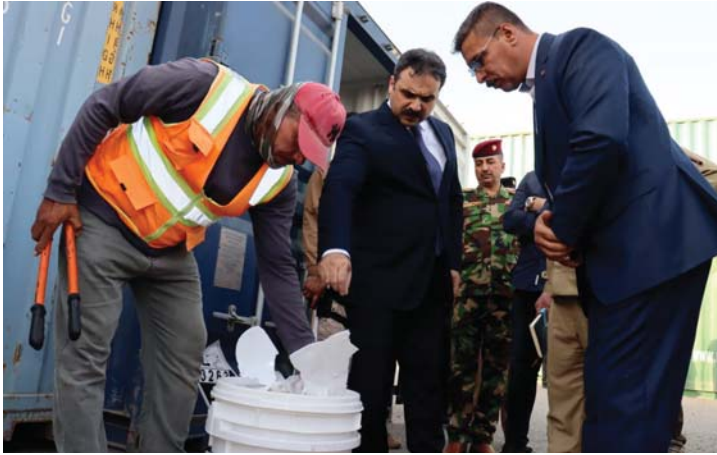
● المخابرات التي تضيق في منافذ الحدودية