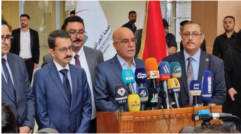
● وزير الصحة يشرف على التضمينات النهائية لافتتاح مستشفى الحكيم