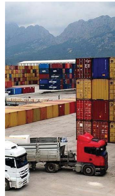
● إغراق البلد بالبضائع المستوردة