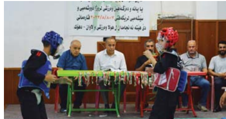
• منافسة مثيرة بين الفرق المشاركة

• بغداد، حارث العبيدي اختتمت قبل أيام بطولة بغداد للفتيات العربية في التايكونجوتسو والسكي التي نظمها الاتحاد العراقي في بغداد في قاعة الصناعات الحربية الرياضية الملتفة، بينما أسدل لاحقاً على منافسات بطولة دهوك التي شهدت مشاركة ستة فرق وقال رئيس الاتحاد محمود إبراهيم في تصريح خص به الصباح الرياضي: إن بطولة العاصمة بغداد شهدت منافسة عالية بين المشاركين في هذه اللعبة التي تعد إحدى الرياضات القتالية، يطبق فيها اللاعب مجموعة من حركات ومسكات بسرور فائقة. وأضاف أنّ نادي حيفا حصل على المركز الأول بـ 68 نقطة يليه نادي الصناعات الحربية بـ 38 نقطة، بينما حل المرور ثانياً بـ 31