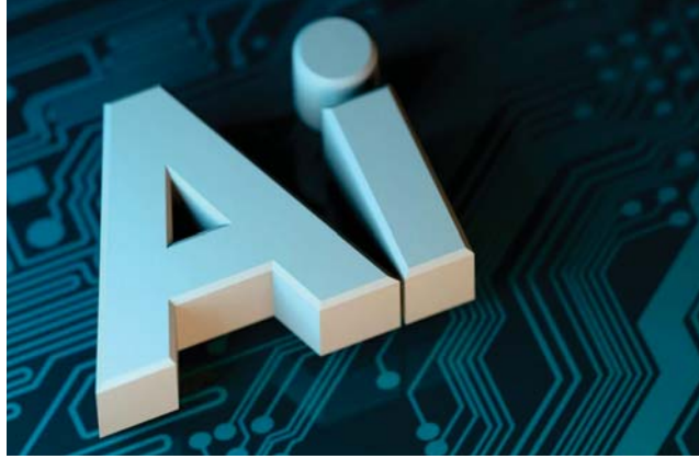
• تسليط الضوء على مشكلات الذكاء الاصطناعي