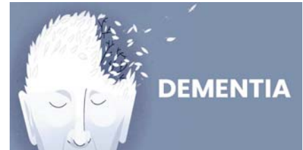
● أهم الأسباب النفسية للتسيان هو اشتغال البال والقلق