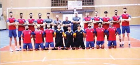
• وشنى الطائرة جاهز لخوض البطولة القارية