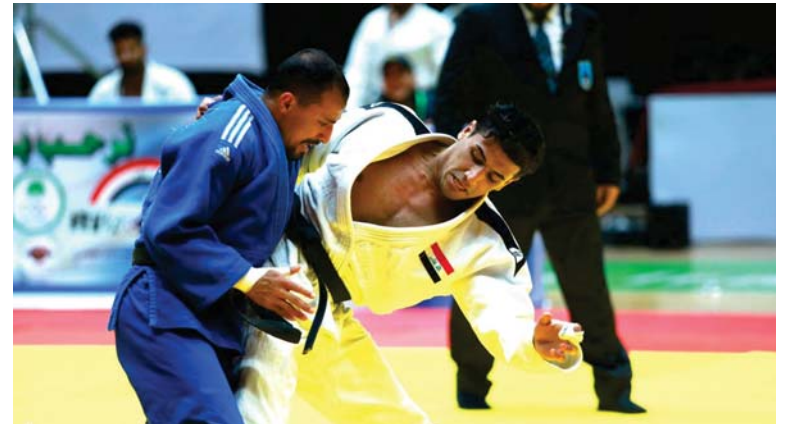
سعي جاد لتحقيق نتائج إيجابية