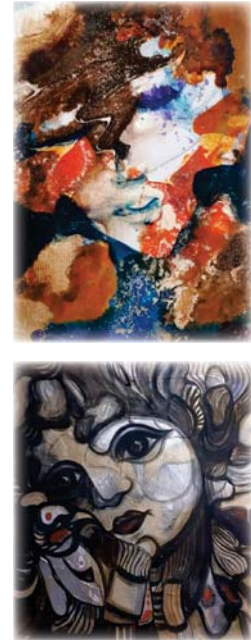
• من أعمال الفنانة