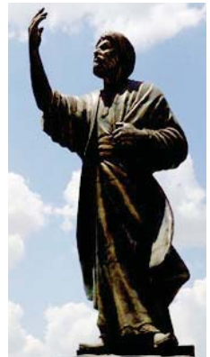
● تمثال المتنبي

يبدأ مسالحه من دون أي شهوة للأشباح من الذات، يتصفح مقاطع الإبراء، 184 عبر خاصية ريلز، يفكر بالحكمة التي جعلها ترضى ككتابة في قصيدة، ثم يشير إلى الطغ الذي يشاهده ويقول: «هو العالم الحكلي والعالم الصدي» هو فعلا ذلك، عالم فرط خواته يكون صوتاً وصدى من دون لحظة تأثير تكلمها على مدنيته، باستثناء