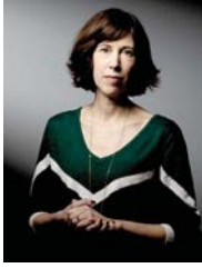
• نيسرين كولومباني