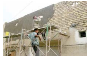
● اصراع على العمل في صيف لاهب