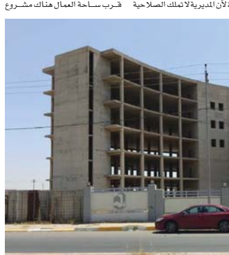
● تأجيل العمل في بنائة مؤسسة حكومية