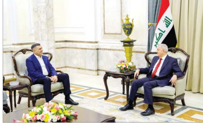
● رئيس الجمهورية، البصرة ركيزة أساسية للاقتصاد العراقي

التي يعاني منها العالم وتأثيراتها السلبية على العراق، فضلاً عن مناقشة الخطط والمشاريع الاستثمارية التي من المؤمل تنفيذها في البصرة. من جانبه، قدم العبداني شرحاً مفصلاً لخطط الحكومة المحلية في توفير الخدمات لواطنيها، مشتماً ودعم واهتمام رئيس الجمهورية بالحكومة.