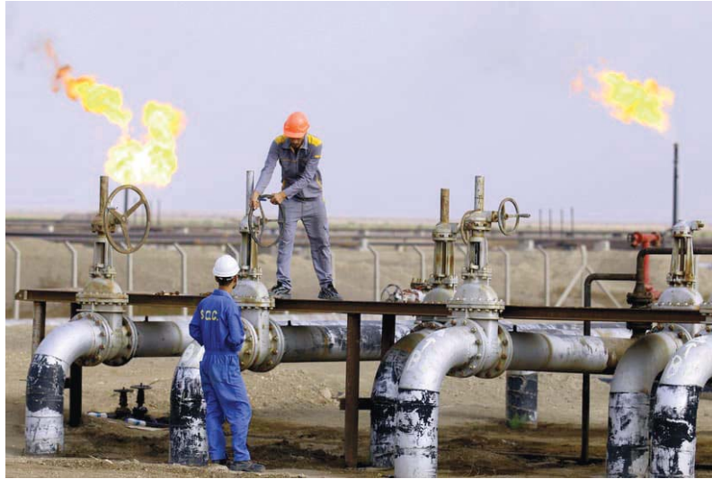
● الكهرباء والنشط تبحران استيراد الغاز من قطر وتركمانستان