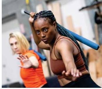
• صورة المتبركة لانشاء تسخ رقمية واقعية جدا لهؤلاء الأشخاص

قادراً على ابتكار حوادث تصادم ناجمة عن سرعات عالية، بناءً فقط على تعليمات المخرج، بحسب بلومكامب. ويتابع في هذه المرحلة، تكون قد استغنيا عن مؤدّي المشاهد الخطرة وعن الكاميرات ولا تضطر كذلك إلى ارتداء الخلية، مضيقاً مسيحج إلى الأمر مختلفاً جداً. ويمثل الذكاء الاصطناعي أحد الأسباب التي تعطل الإضراب الذي يشل الإنتاجات في هوليوود طابعاً جديداً. وبالإضافة إلى مسالة تقاسم الإيرادات المرتبطة بالذكاء الاصطناعي نقطة رئيسية في المفاوضات.