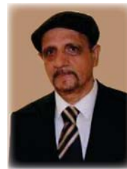
● بإسلاف الجراح

وأضاف الجراح أنتجت في السنوات الأخيرة عشرات من الأعمال الموسيقية والغنائية، التي لم تثر التوسيع الأعمال التي تعرضت له. وفي الختام تأمل الجراح وزارة الثقافة ووزارة الفنون الموسيقية باعتماد أعماله لتشرها وإيصالها إلى جيل الشباب الواعد، فأثارت العزاف في زاخر بالكثير.