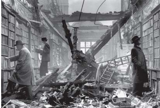
● مجازر المكتبات وحرقتها الانتقامية في مختلف العصور

منّي إليه، وشكرت الله تعالى على التعمة به علي، وسألته المزيد من أمثاله الذي وصفته فيه بعد ذكر الشوق إلى الصداية ونعي وما نال قلبك، التهميه في صدرك من الخير الذي نمني إليك فيما كان مني من إحراق كتيبي التنقيسة بانتار وغيلها بماذا، وأضاف أبو جحان التوحدي، وهو يسوق أسباب ذلك الفعل الموجه، وبعد فلي في إحراق هذه الكتب أسوة بأئمة يقتدى بهم ويؤخذ بهديهم ويمسك إلى ناره، منهم أبو عمرو بن العلاء، وكان من كبار العلماء مع زهد ظاهر وورع معروف، دفن كتبه في بطن الأرض فلم يوجد لها أثر، وهذا داود الطائي، وكان من كبار علماء الله زهداً وقفاً وعبادة، وقال له تاج الأمة، طرح كتبه في البحر وقال بتاجها، نعم الدليل كنت، والوقوف مع الدليل بعد الوصول غناه، ودون وسلا، وخمول، وهذا يوسف بن أسباط، حمل كتبه إلى غار في جبل وطمس فيه وسد بابها، فلما عثرت على ذلك قال وكان العلم في الأول ثم كاد يظن أن الثاني، فهجرت له لوجه من وصلناه، وكهذه الفقرة ذاتها، الأضنى من ذلك أن يعد أحد العلماء إلى إعادة مؤلفاته، كما فعل أبو جحان التوحدي وغيره احتجاجاً على نكد الأيام، يقول ياقوت الحموي في كتابه معجم الأديب، «وكان أرواحان قد أحرق كتبه في آخر عمره لقلته جوارها، وضاع بها على ما لا يعرف غيرها بعد موته، وكتب إليه القاضي أبو سهل علي ما اعتمد من الفعل وشتمه كتاب عليه أبو جحان معتزلاً من ذلك... وإفاني كتاب غير محتسب ولا منوع، على طمأنه برح للدار».