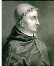
● الكاردينال سيستيروس

منّي إليه، وشكرت الله تعالى على التعمة به علي، وسألته المزيد من أمثاله الذي وصفته فيه بعد ذكر الشوق إلى الصداية ونعي وما نال قلبك، التهميه في صدرك من الخير الذي نمني إليك فيما كان مني من إحراق كتيبي التنقيسة بانتار وغيلها بماذا، وأضاف أبو جحان التوحدي، وهو يسوق أسباب ذلك الفعل الموجه، وبعد فلي في إحراق هذه الكتب أسوة بأئمة يقتدى بهم ويؤخذ بهديهم ويمسك إلى ناره، منهم أبو عمرو بن العلاء، وكان من كبار العلماء مع زهد ظاهر وورع معروف، دفن كتبه في بطن الأرض فلم يوجد لها أثر، وهذا داود الطائي، وكان من كبار علماء الله زهداً وقفاً وعبادة، وقال له تاج الأمة، طرح كتبه في البحر وقال بتاجها، نعم الدليل كنت، والوقوف مع الدليل بعد الوصول غناه، ودون وسلا، وخمول، وهذا يوسف بن أسباط، حمل كتبه إلى غار في جبل وطمس فيه وسد بابها، فلما عثرت على ذلك قال وكان العلم في الأول ثم كاد يظن أن الثاني، فهجرت له لوجه من وصلناه، وكهذه الفقرة ذاتها، الأضنى من ذلك أن يعد أحد العلماء إلى إعادة مؤلفاته، كما فعل أبو جحان التوحدي وغيره احتجاجاً على نكد الأيام، يقول ياقوت الحموي في كتابه معجم الأديب، «وكان أرواحان قد أحرق كتبه في آخر عمره لقلته جوارها، وضاع بها على ما لا يعرف غيرها بعد موته، وكتب إليه القاضي أبو سهل علي ما اعتمد من الفعل وشتمه كتاب عليه أبو جحان معتزلاً من ذلك... وإفاني كتاب غير محتسب ولا منوع، على طمأنه برح للدار».