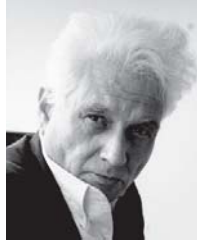
• جاك دريدا