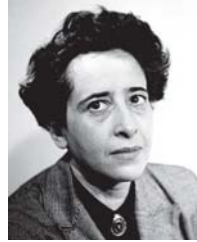
• حنة أردت

الفرق الواحد والمشرين، ستكون هناك ملفات ضخمة في هذا التسلسل المفتوح في أروقة الإعلام والمخابر العالمة وتاريخ عتقات الدول تشير إلى هذه الصفة، ولا يمكن إغفال دور الإعلام العالمي المحترف في تسويق الأكاذيب على الرأي العام. في المجال الفلسفي الأقدم من تاريخ الكذب، فإن (نيتشه يميل إلى اتهام الأفلاطونية والهرطقة واللاهوتية والأصنامية بالأكاذيب، وعندما تناول الإقناع بوجود عالم حق). وهذه الاتهامات الفلسفية ليس بالضرورة أن تكون صادقة، فالخيال السريدي للفلسفي يقوم على وقائع تاريخية واجتماعية، ليس بالضرورة أن تكون فائزة، فمستويات التغيير فيها قائمة لتطور الأنساق والواقع للبلد منذ القديم وحتى اليوم، ومن فإن الفلسفة القائمة على مبدأ الشك، يتغير مفاهاً الفلسفي والسريدي والاستنتاجي بالضرورة. في كتاب، كيف تكذب، كرهراً، لأطونزي أثر لونغ هناك مختصر من معاشات أليكسيوس (55-135 ميلادية) ترى أن أول لفظة تصف ما يهدأ، مثل، لا تكذب، وقائها هو البرهن مثل، لماذا علينا أن لا تكذب، وانها تصير البرهن مثل، ما الذي يجعل هذا البرهن ما سوياً ما هو البرهان بعد ذلك، وما الصوت وما التناقض، وما الحقيقة وما الباطل، وبينما تشغل بالبراهن، والبحث عن حقيقة الصواب من الخطأ، الأجر أن نلتفت انتباهنا إلى أول الفلسفة وسؤاله، لا تكذب، وهكذا تحول الفلسفة من دون زيف أن تشكك بالوقائع والبراهن قبل حلول الدليل، فهي باحثة بمعنى أن الأصول التاريخية والنفسية والاجتماعية لأظاهرة دراسة ظروفها العميق، قبل تحليله، لذلك عندما نقرأ أن هناك من يعيد كتابة التاريخ، من دون البرهون والنفسية وزواياها المعقدة، سيعيد هذا ضرباً من المحافة التي تحمل بين طياتها أكثر من زيف، بما يعني تدوير الكذب بأكاذيب جديدة.