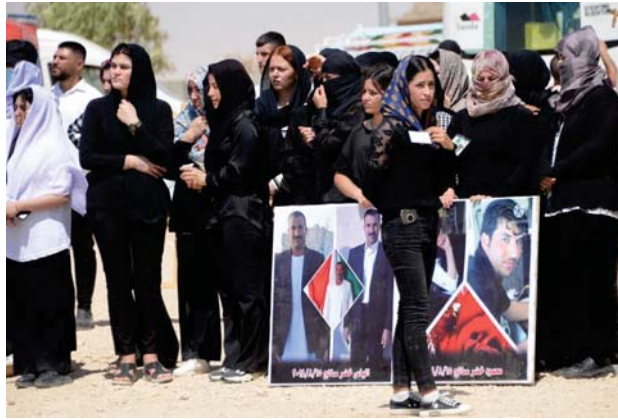
● الإيزيديون يحيون الذكرى التاسعة لجرمة الإبادة التي ارتكبتها العصابات الإرهابية

الملاك رقم 25 لسنة 1960، وذلك لاستيعاب العائدين الوظيفية، بما فيها عابرين ذوي المهن الطبية والصحية. وسأدق المجلس على تقييمات (76) مديراً عاماً ضمن الوجبة الثانية الخاصة بتقييم المديرين العاملين في الوزارات والجهات غير المرتبطة بوزارة، باعتماد المعايير والبيانات المدة من اللجنة المؤلفة بموجب الأمر الديواني (23059)، لتقييم المديرين العاملين. وأوضح البيان أن التقييمات جاءت كالتالي: نقل 3 مديريين عامين أصالة، بدرجة أدنى أو إجازة على التقاعد، وإنهاء مكلف 12 مديراً عاماً وكالة أو شبيب أعمال، ونفيور ثلاثة مديريين عامين أصالة، ونقل مدير عام أصالة إلى وزارة أخرى، وإعادة تقييم 57 مديراً عاماً أصالة وكالة بعد ستة أشهر.