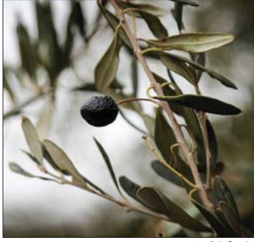
● نوعية الزيتون الجيد

بعد أن كانت التلال المتاخمة لمدينة أربيل جرداء تشكو التصحر، باتت اليوم خضراء تكسوها أشجار الزيتون لترسم خطوطاً طويلة على مد البصر. بعد أن دشنت حكومة إقليم كردستان خطة لدعم المزارعين بتوفير الأرض والمستلزمات الضرورية لهم بهدف إكثار زراعة شجر الزيتون. ملايين من أشجار الزيتون تمثل الرصيد الزراعي الراهن لإقليم كردستان، الذي يتجه نحو تحقيق الاكتفاء الذاتي من زيت الزيتون. وتزايد الطلب على هذا الصنف من الزيت بفضائه الصحية العديدة دفع العديد من أصحاب رؤوس الأموال لإنشاء معامل لإنتاجه بالاعتماد على الناتج المحلي من الزيتون.