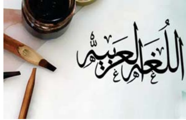
العربية - شاد خالدة