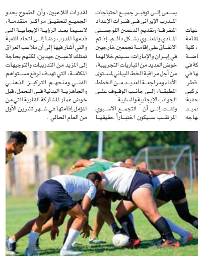
مطوحات لبناء منتخب جيد

يسعى إلى توفير جميع احتياجات المدرب الإيراني في فترات الإعداد التفوقية وتقديم الدعم اللوجستي المادي والمعنوي بشكل دائم، إذ تم الاتفاق على إقامة تجمعين خارجيين في إيران والأمارات، سيتم خلالها خوض العديد من المباريات التمريرية، من أجل مراقبة الخطط البياني لستون الأداء ومرآة العديد من الخطمط، إلى جانب الوظيف على الجوانب الإيجابية والسلبية. ولفت إلى أن التجمع الآسيوي المرتقب سيكون اختياراً حقيقياً