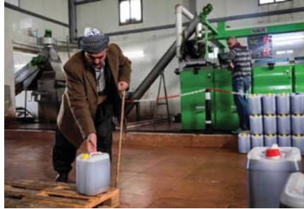
● تصدير زيت الزيتون

وكان إنتاج زيت الزيتون في العراق محدوداً وتستهود البلاد كميات كبيرة منه من تركيا وفونس وسوريا وإسبانيا وإيطاليا وغيرها. إلى ذلك تؤكد وزارة الزراعة في حكومة الإقليم