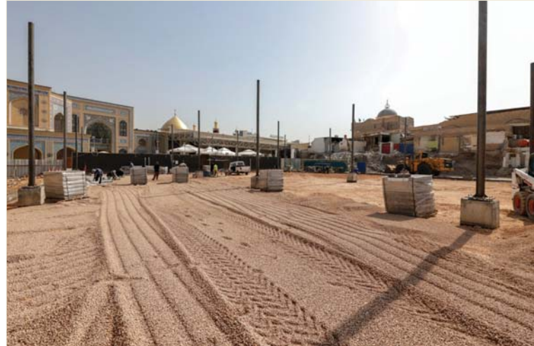
● توسعة محيط الصحن الحيدري الشريف لاستقبال زائري الأربعين

● النجف الأشرف: حسين الكبي ● العمارة: سعد حسن