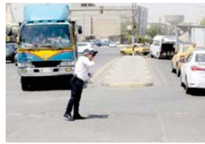
● شرطة المرور تحت سيطر الحر الشديد