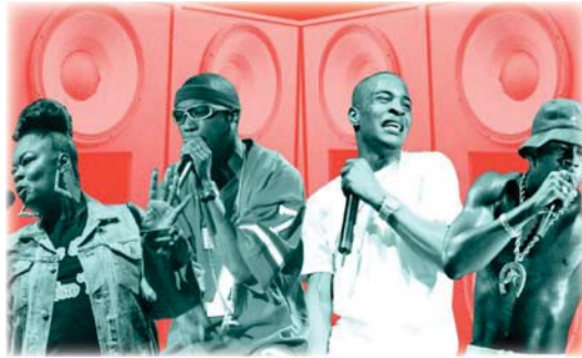
● ليزال «الهييب هوب» راسخاً في ثقافة بديلة بالولايات المتحدة

عدد كبير من مغنّين الهييب هوب مغنّون آخرون يقيمون في ام أحياء فقيرة رابيسز وفيشي ستوك وكاردي بوس ودايك ونيكسي ميناج نجوماً عالميين أيضاً لكن رغم همتهم، لا يزال الهييب هوب راسخاً في ثقافة بديلة في الولايات المتحدة ومتعدداً في التجربة الدولية للتصوير وعدم المساواة، على قول الخبراء.