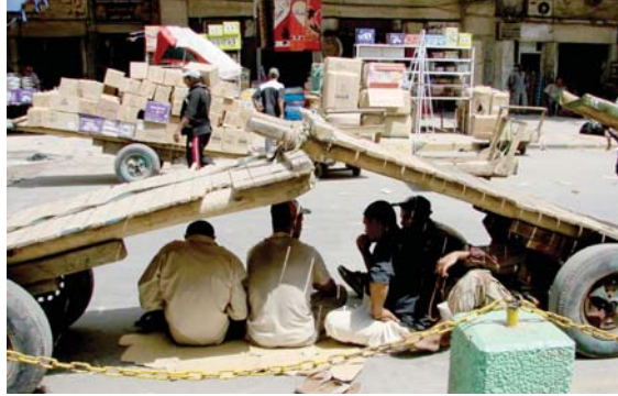
● الاحتفاء من أشعة الشمس القاسية