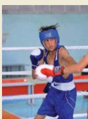
منافسات مثيرة شهديتها البطولة

التأشيين، من ناحتي الأعداد المشاركة والنوعية، وهي تمثل المهار الحقيقى لمستويات اللاعبين، الذين تاهسون