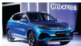
• السيارات صينية الصنع يجب أن تواجه رسوماً جمركية أعلى