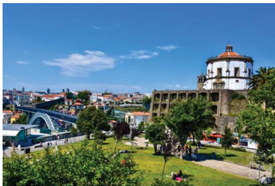
● أحد أحياء يورنو الريفية المشتهية من تزايد مشاكل المدمنين على المخدرات

تأثير كوفيد-19 بلغ إنتاج الكوكايين مستويات قياسية عالية، وتوسعت عمليات ضبط المواد المضطرب تعاطي المخدرات النشط، أو تم سجنهم لإرتكابهم جريمة تتعلق بالمخدرات أو تعاطي المخدرات عبر البرتغال الصغيرة لديها أجابة، فيقول العام 2001، رمت البلاد وراء ظهرها سنوات طويلة من سياسات مدعومة بقوانين من أجل تقليل الضرر من خلال إلغاء تجريم استهلاك جميع المخدرات للاستخدام الشخصي، بما في ذلك شراء وحيازة ما يكفي من تلك المواد السمية لمدة عشرة أيام، ويقضي التعاطي أمراً مخالفاً للقانون للناس بالتواجد في تلك الأماكن وتعاطي المخدرات، فقد جعل الأمر