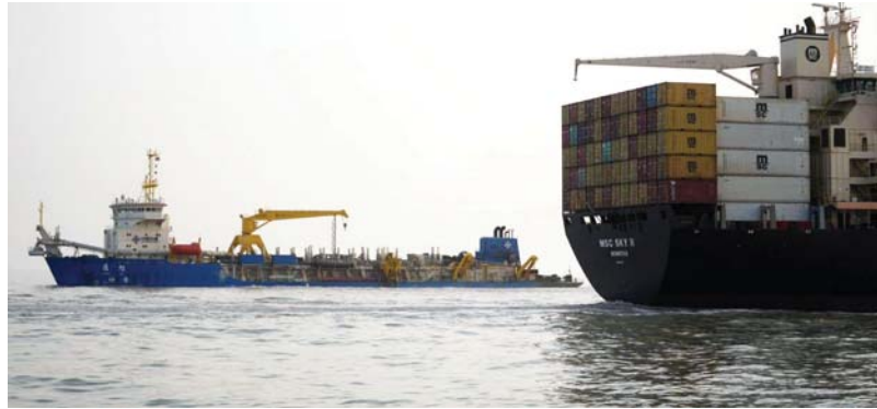
● استمرار رفع الترسبات لضمان مرور السفن التجارية بأمان