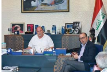
قرارات مهمة تهدف إلى جعل المهرجان لاحقاً بالسينما العراقية