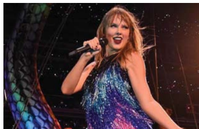
• تاييلور سويفت

وأضاف الموقع أن ما يتردد هو أن تاييلور كسبت بالفعل ما يزيد على 5 ملايين جنيه إسترليني (6.3 مليون دولار) من العائدات بعد إطلاق ألبوم Speak Now (نسخة تاييلور) في شهر يونيو الماضي. ويحسب أحدث التقارير المنشورة بهذا الخصوص، فقد تبين أن ألبوماتها، التي أعادت تسجيلها (وهي 3 ألبومات فقط، محقت لها عائدات ما جمعة يقدر إجماليها تقريبا بـ 6.8 مليون جنيه