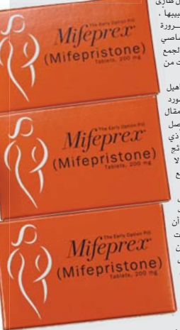
• نتائج الدراسة: قد لا تتطابق على جميع المرضى

إن الدراسة أظهرت أن التماسيح تميّز بدقة المعاناة في صرخات صفار القفود أو الأطفال، وكما كانت الصرخات تتطوّر على معاناة أكبر، كلما ازدادت ردة فعل هذه الزواحف . وتأتي هذه النتائج في إطار بحث جيوسياسي بين الدول المؤثرة للدول وتلك المتأثرة له ، إذ تحاول الأخيرة التخلي عن العملة الأمريكية في التعاملات التجارية .