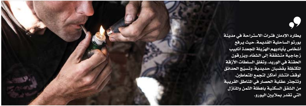
● متعاطل المخدرات يأخذ جرسته عبر غليون التمهين

يطارده الإدمان فترات الاستراحة في مدينة يورنو الساحلية القديمة، حيث يرفع أشخاص بأيديهم الهزيلة المجددة أنابيب زجاجية مستشقة إلى الشاه، ويزرقون الحقنة في الوريد، وتغلق السلطات الأزقة المكتظة بقضبان حديدية، وتسيج الحدائق لوقض انتشار أماكن لتجمع المتعاطين. وتتجدد عقوبة الحصار في المناطق القريبة من الشقق السكنية باهظة الثمن والمنازل التي تغمر يملأين اليورو.