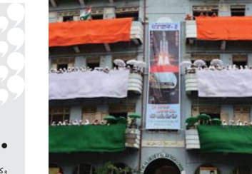
احتفاءً وشعبياً واسع بالهامة الفضائية

يعين الاعتبار، مشيراً إلى أن استخدامها كمنهج علاجي معياري يعتمد على مجموعات الصحة المهنية من أمثال منظمة الصحة العالمية . كذلك، لفتت سو ليو إلى ضرورة إجراء مزيد من الأبحاث في هذا الخصوص، قائلة إنه من السابق لأوانه أن نوصي النساء بأخذ البيروكسيكام مع موانع الحمل الطارئة، وتابعت أن كل امرأة ترغب في أخذ مانع حائض عليها مراجعة طبيبها، داعية إلى ضرورة استشارة اختصاصي عند الرغبة في الجمع بين أي مجموعات من الأدوية . وأكدت أريكا كاهيل من جامعة ستانفورد الطبية، في مقال في مجلة طبي، أن نتائج الأبحاث في الدراسة قد لا تتطابق على جميع المرضى . وأشارت كاهيل إلى أن النساء اللاتي تتناولن موانع الحمل الطارئة مع البيروكسيكام، لم تظهروا أي اختلاف ملحوظ لتأثيرها على الفعالية الشهرية المتأخرة من موعدها مثلما أوضحت الدراسة للرئيسية في 14 تموز 2023 .