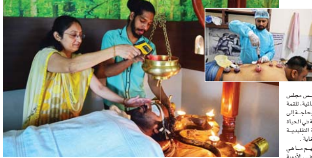
ازداد استخدام العلاجات التقليدية خلال الجائحة لمعالجة المسابن وكوفيد

وقالت منظمة الصحة العالمية إن العلاج الطبيعي لا يعني دائماً أنه آمن، ولتُعد قرون من الاستخدام ضماناً للفعالية، لذلك، يجب تطبيق الطريقة العلمية والعملية لتقديم الأدلة الدقيقة المناسبة. وقالت منظمة الصحة العالمية إن نحو 40 ٪ من المنتجات الصيدلانية المتقدمة المستخدمة حالياً مستمدة من أساس منتج طبيعي . وفق منظمة الصحة العالمية التي تشتهر في هذا الإطار بـ «عناصير بارزة مشتقة من الطب التقليدي، بما فيها الأسبرين، قائمة على تركيبات تستخدم لحقن شجرة الصنّاف» .