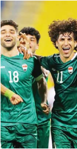
● تَفْؤُل يتقدّم مستوى متميز خلال التصفيات