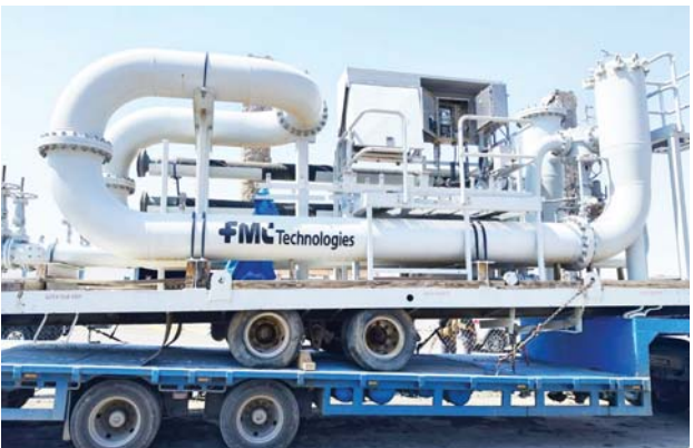
استعادة معدّات مصفى بيجي خطوة مهمة لإيقاف استيراد المشتقات النفطية

بغداد، رغد حاتم بعد إعلان رئيس الوزراء محمد شيوع السوداني، ومن بعده وزارة النفط، في بيان تصفيي، استعادة العدات والمواد والأجهزة المبروفة من مصفى بيجي إبان احتلال عصابات داعش الإرهابية، انتشرت آمال الخبراء والمتابعين بتحقيق العراق حقرة نحو الاكتفاء الذاتي من المشتقات النفطية، وعُدوها خطوة مهمة نحو إيقاف استيراد هذه المشتقات التي تكلف الدولة سنوياً مليارات الدولارات. وذكر الخبير التقني على نعمة لـ الصباح، أنه جرت استعادة جميع الأدوات والمواد المبروفة من المصفى، والتي كانت موجودة في إقليم كردستان، مبيّناً أنّ المواد المستعادة رغم كونها أجزاء مهمة للمصفى، إلا أنها تمثل بحدود 60% من المواد اللازمة للمصفى، وهناك أجزاء معقودة وأخرى يحتاج توفيرها إلى فترة زمنية، إلا أنها بالتأكيد ستكون أقل بقل مما لو تمّ استعادة المواد المبروفة.