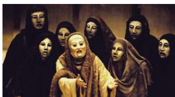
• مسرح القهوريين أداة للتعليم والدفاع

يعيدون القراءة والكتابة والعمل وغبرهم من الشرائع المسحوق (م)، وما يصطلح عليها بالطبقة البروليتارية، وكذلك برز خلال هذه التجارب ما يسمى (بالآباد الاشتراكي) والمسرح الاشتراكي، وهما يسعيان للكشف عن (فساوة النظام الرسائلي). فكل نتاجاتهم تؤكد أن سبب أزمتنا الإنسان والمجتمع جزء من النظام الرسائلي، ناهيك عن مصطلح (الآباد الثوري) المسرح الثوري) مسألة اضهادهم والمضمرة إزاء أدب ما بعد الكولونيالي، وغيرها من المفاهيم التي تتداخل مع قضايا الطبقات المسحوقة وتعمل على استخدام الأدب كأداة حقيقية لتوعية (التثوير) وخلق سلوكيات إيجابية لدى هذه الطبقات والحلحلة البقطة الواسي في ربيع هذه الطبقة وسعى لهذا العديد من الكتاب والشغلتين بهذا العقل، خاصة من الطبقات المحرومة للنظام الاشتراكي والتوجهات اليسارية، وبعض الكتاب الذين خرجوا من معطف هذه الطبقة فاستشعروا الامها وممانتهم، وبالتالي كتبوا فكرية. من هذه الطبقة بكل أمانة اجتماعية، وهي أن ما أتت عليه التعبيرية هم الأبرز الذين تناولوا مع أدب الطبقات المسحوقة، فصوروا حياة العمال في المصانع والمناجم ونظ