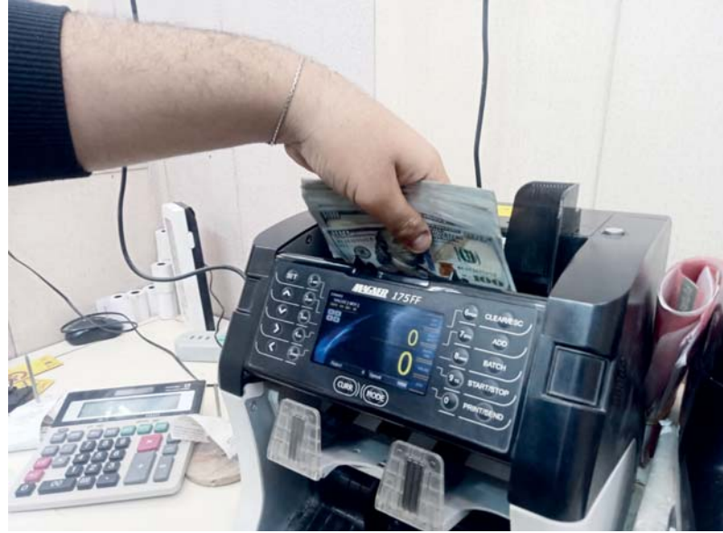
● الدولار يواصل الارتفاع في السوق الموازية برغم الإجراءات المشددة.