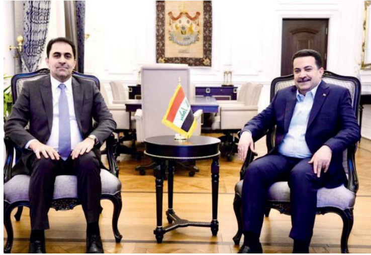
● تتسّق فاعل بين السملتين التشريعية والتنفيذية