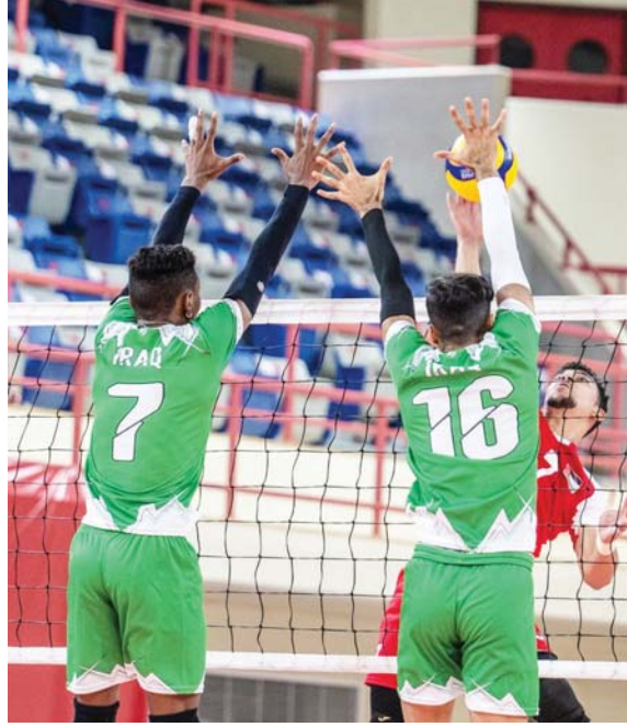
● محو حات للو سول بعيداً في المسابقة القارية