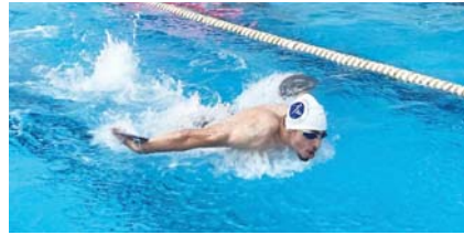
● الاستعانة بسباحين محترفين أبرز قرارات اتحاد اللعبة