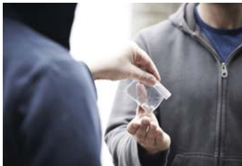
● المخدرات مشكلة عالمية تشر بتلكثير من الناس

يسبون استخدام المخدرات من قبل الشرطة وأحالتهم على «لجان الرد»، فيما الأشخاص الأكثر اضطراباً، فيمكن للسلطات فرض العقوبات عليهم، بما في ذلك الغرامات والتوصية بالملاج، وبعد ذلك كله يقضي قرار المحضر طوعياً.