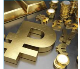
• العملات الرقمية جزء من حرب جيوسياسية