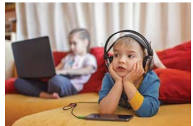
● جيل خصائصها الفنا وتصانح الآبورة والأوموة