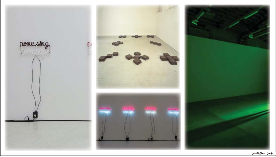
● من أعمال الفنان

ورأس الفنان هنا، يضيف بعداً نفسياً للتوازن الداخلية للفنان وإقصاء ذاته التي جسدها بالصرخة التي تمثل حالة من الانفجار وفقدان الصبر. وإن مصدرية العنف تأتي عبر فقدان الحرية والقبول، التي ضيقت على الإنسان، فأضحى مؤطراً يحدود فرضها المكان وأوضاع سلطة التحكم في أمره، فكانت سلطة الخارج