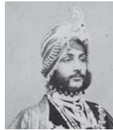
أخيرا بطرقة البنجاب دوليب سينغ

بينما كانت صوفيا برفقة ملكة السبع القديمة برفقة أختها، ياميا، كانت الحشود تبتكي وتهتف باسمها، ثم زارت الأميرتان موقع منديت (جاليينوالا) التي وقعت عام 1919 عندما أطلقت القوات البريطانية النار على الهنود وارتدم هنق.