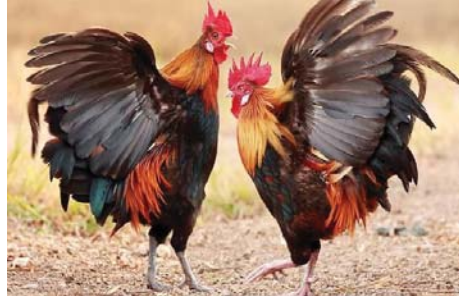
● أحد عراك الديكة

الموسوي: إن هواية تربية الديوك تختلف عن هواية خوض المنافسات وكسب الرهانات، موضوعاً أن العديد من الأشخاص يقومون بتربية الديكة لغرض بيعها بأثمان باهظة، ولكنهم لا يفصلون إداخلها في المنافسات لأسباب، منها عدم قدرتهم على مشاهدتها، وهي تفوض حرياً دموية تنتهي أحياناً بمقتل الديك، مشيراً إلى أن البعض الآخر، يربي الديك ويديره منذ صغره على أن يكون مقاتلاً شرساً يمكنه من كسب الرهانات المالية، التي تصل أحياناً إلى ملايين الدنانير، لافتاً إلى ضرورة اختيار المربي اسماً للديك المقاتل، ومن أسماء الديكة ( أبو شهبه - أبو عريف - الكاسر - الجارح - الخفاف - الطوبوك - الخ ).