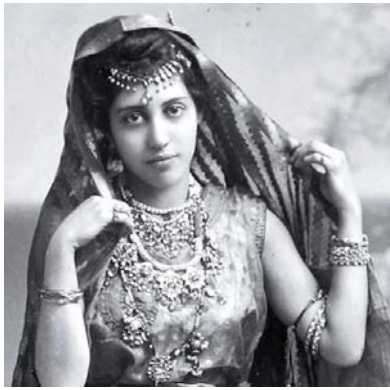
الأميرة صوفيا وهي ترتدي الزي الهندي