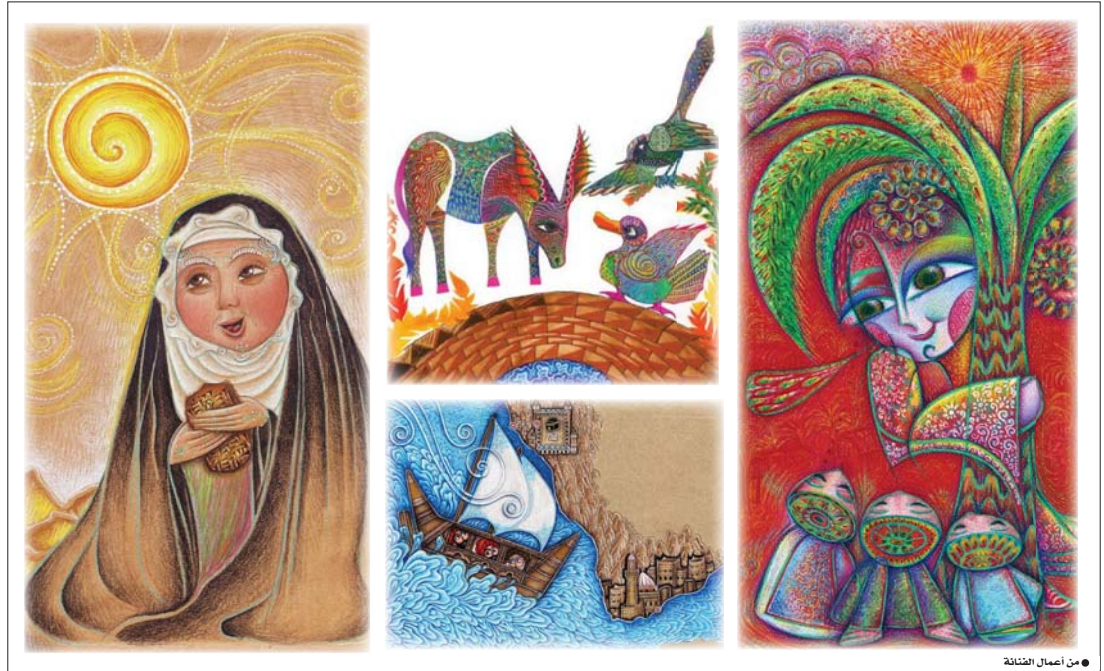
● من أعمال الفنانة

أنت بمحض الصدفة وكل ما زسم كان للطفولة والسعادة كعصير عن امتنان الإنسانية لوجود الطفولة فيها. حكايات واقتضا عبر مجلات وخصص مصورة ومشاهد متفرقة جميعها اعتصمت بالشكل الأساسي على الفن التشكيلي عبر رواد هذا الفن الرائع، ومنهم صاحبة السبق الفنانة العراقية الكبيرة انطلاق محمد علي الرائدة في فن الرسم للأطفال، فبالأفلام الملونة وعلى السورق ذهبت