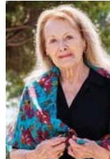
• كاتبه مبرية