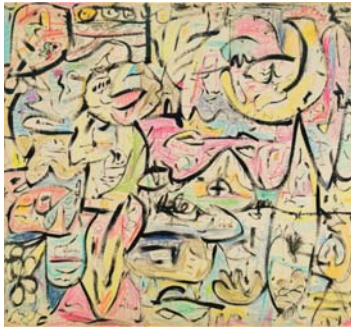
● لوحة الفنانة هيلين فرانكلينشر

كنا أنا وكيو بعمر متقارب لكنه أجمل مني بمئة وسبعين سنة فهو يمتلك شخصية لطيفة أيضاً فلا يشعر بالأثمة والغرور ولو أن أحداً سبب له مشكلة بالصدفة فإنه لا يشعر بالغضب، إذ يستدرك قائلا "أوه، حسناً لقد فعلت الأمر نفسه لكنتي في الواقع لم أسمع عنه أنه أتى بعمل سيئ تجاه أي شخص". كان ذا نشئة جيدة أيضاً، فأبوه كان طبيياً له عيادة في جزيرة شيكوكو وهذا يعني أن كيو لا يحتاج إلى مصرف جيد ولا أحد هائل بأنه كان مبدراً فهو متأق ذكي ورياضي رائع أيضاً، كان يمارس لعبة التنس في المدرسة الثانوية، وهو يهوى السياحة فيذهب إلى المسبح مرتين في الأسبوع أما على نطاق السياسة فقد كان ليبرالياً معتدلاً. وكانت درجاته، إن لم تكن ممتازة، فهي جيدة في الأقل، لم يدرس تقريباً تحضيراً للاختبارات، لكنه لم يفشل في الدروس، فقد كان يستمع جداً في المحاضرات، كان مهوياً على نحو مدعش في العزف على البيانو ويمتلك الكثير من تسجيلات بيل إيغانز وموزارت. ومن كتابه المتفضّلين بلوك ومويسان. وأحياناً كان يقرأ رواية لكتزوبور أوي أو كاتب آخر وكانت مقالاته التقديرية دائماً دقيقة تماماً. أما مع النساء فقد امتك شعبية بصورة طبيعية لكنه من نوع الرجال الذي لم يكن في متناول أي فتاة كانت له صديقة ثابتة في السنة الثانية من كليات الثيات العريقة. وإعادة على الخروج معاً كل يوم أحد. على أي حال كان هذا هو كيو الذي عرفته في الكلية باختصار، كانت شخصيته تفلح من العيوب. وقد عاش كيو في شقة قريبة إلى شفتي ومن خلال إعارته الملح أو إعارتي لصفة نبتنا الصداقة، وسرعان ما تبادلنا أماكننا دائماً واستمعنا إلى أسطوانات التسجيل وفي إحدى المرات قمنا أنا وصديقتي