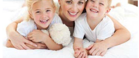
• الحب هو الأسلوب الأمثل والأفضل في التربية

كوني واقفة من نفسك وفردتك وبطفلك أيضاً، عليك أن تكوني متأكدة بأنك تقومين بفعل الصواب طامناً، أنك تطيقين هذه القواعد وأنت جديرة بهذه المهمة، رغم صعوبتها وأنت ستؤدنها على أكمل وجه وستحصلين ثمارها في المستقبل.