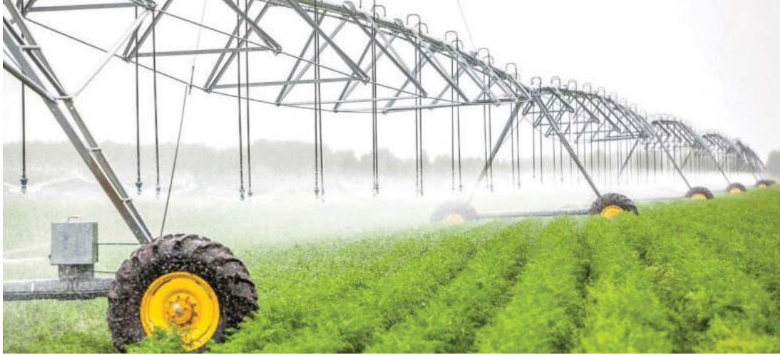
● تقنيات الري الحديثة تسهم في تقليل هدر المياه