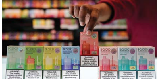
بعض أنواع أجهزة السجائر الإلكترونية التي تستخدم لمرّة واحدة وعليها بطوريج التيكوتين، وهو مادة تؤدي لإدمان

في السجائر الإلكترونية. ويقول د. جيمسون روز، (أستاذ مساعد في الطب وعييد مشارك للإشراك وتطوير علوم الطب بكلية طب جامعة ميريلاند، للدراسة)، «السجائر الإلكترونية توصل العديد من المواد إلى الجسم والتي من المحتمل أن تكون ضارة، بما في ذلك المواد الكيميائية والمواد الأخرى التي قد لا يعرفها المستخدم ولا يفهمها وهناك أبحاث تشير أن السجائر الإلكترونية المتوفرة على التيكوتين ترتبط بتغيرات حادة في العديد من مقاييس الدورة الدموية، بما في ذلك ارتفاع ضغط الدم