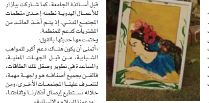
نماذج من أعمالها

التطريز متعبة، فأنا أقوم باستخدام يدي والأبرة فقط، وحتى لو كانت اللوحة صغيرة الحجم، فهناك لوحات استلمت إنجازها بأسبوعين، وهناك ما يقبت أسبوعين، بها شهراً أو أكثر، ولا أستطيع العمل على اللوحة بشكل مستمر، ولساعات طويلة، فهذا يسبب لي الألم في الرقبة، وكذلك العين، لهذا أحاول كثيراً أخذ قسط من الراحة، لكي لا أسبب لنفسي مشكلات صحية مستقبلية.