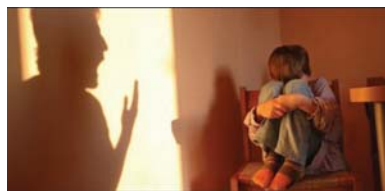
• غياب القوانين الرادعة ساهم في تصاعد وتيرة العنف ضد الأطفال

لأنها ساعة خطيرة تزامت مع ظروف حساسة يمر بها بلدنا، وأوضاع طالبتنا سابقاً وأكثر من مرة بتفعيل قانون حماية الطفل كي يكون رادعاً تجاه الجناة. غياب القوانين الرادعة بحسب والمستقبل.