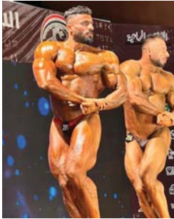
● بناء الأجسام يتطلع لخواصة التاجح قاريا