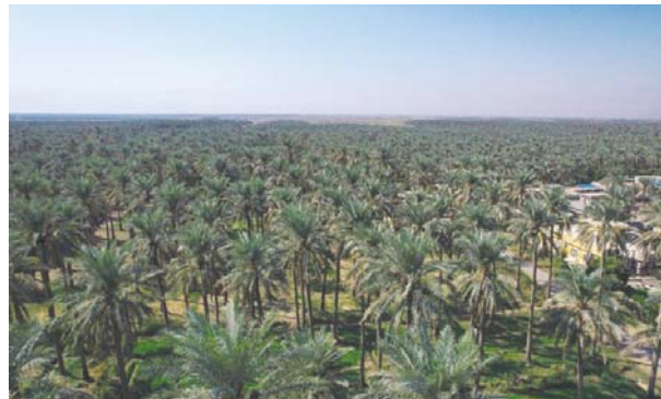
● خطط زيادة أعداد الخيل

أعلنت وزارة الزراعة، أنّ أعداد أشجار الخيل في البلاد، ستصل بحلول العام 2027 إلى 25 مليوناً، مقابل 17 مليوناً و500 ألف حالياً، كاشفة عن إقرار برنامج لإكثار فصائل الأنواع النادرة منها وعلى رأسها صنف (المجول).