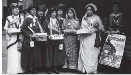
قادت الأميرة صوفيا حملة لدعم جرحى الجنود الهنود

لا تزال صوفيا واليب سينغ، الأميرة الهندية التي حاربت من أجل منح النساء حق التصويت في الانتخابات البريطانية، شخصية غير معروفة في بلد أسلافها (الهند). ففي العام 1910 كانت ضمن وفد مؤلف من 119 ناشطة نسوية، في طريقهن لمبنى البرلمان، ليحصلن على فرصة للقاء لرئيس الوزراء البريطاني هربرت هنري أسكوت في تلك الفترة. لكنه رفض مقابلتهن، فتعرضن للضرب من قبل رجال الشرطة والحشود خارج المبنى.