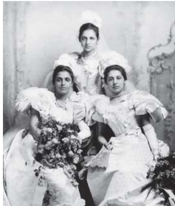
صوفيا برفقة شقيقاتها

بيسات إلى مكتب الهند في لندن، ضمن وفد من النساء الهنديات للنساء وزير الخارجية واستمع لهن الوزير دون تقديم اية وعد. تروي أبتا أناده في كتابها كيف أزع تسليط الضوء على الأميرة الهندية صوفيا الملك جورج الخامس آنذاك، الذي كان مناهضا لحق الاقتراع ولكنه لم يتخذ إجراء ضدها لأن البرلمان كان يسيطر على مواعدا المائة بشكل مطلق. خلال الحرب العالمية الأولى اشتركت الأميرة في قضايا أخرى، منها رعاية الجنود الجرحى الهنود في بريطانيا، وجمعت الأموال لهم. ثم عادت إلى الهند في زيارة أخرى عام 1924، عاقدت كانت تعبر مملكة السبع القديمة برفقة زوجها، كانت السفر إلى البنجاب، وبينما العزم على السفر إلى البنجاب، وبينما كانت تعبر مملكة السبع القديمة برفقة زوجها، تم زيارت الأميرتان موقع منديت (مجالينوالا) التي وقعت عام 1919 عندما اطلقت القوات البريطانية النار على مئات الهنود وارتدم هنق.