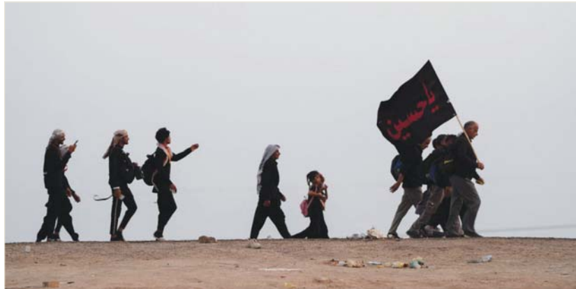
● حطط لإيواء الزائرين

● بغداد: الصباح ● النجف الأشرف: حسين الحسني ● العمارة: سعد حسن