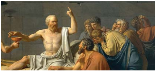
• الكساغوراس وهو من اعم الثلاثة السفسطائيين