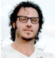
● باسم الأشعار

وهو ما فعله فيما بد المرحوم الكركلي بدلا من جدل الرواية مكتوبة بمستويين من اللغة مستوى السرد، بالفصحى والحوار بالعامية كما فعل قرأ رواية الرجعي البهيد، كتاب رولفو الأخير السررات والأرواح بمستوي واحد متوسط من اللغة. أما الكلام من اللغة الأسبانية في أميركا اللاتينية هذا جزء من أساطيرنا عن الآخرين، الاستخدام اللغوي لماركيز مقدر حتى بالنسبة للمتكلم بالأسبانية، الكك يعرف ماركيز بسبب الإعلام أما الكك قرأ ماركيز وفهم ماركيز هذا خيال، وكه شخصيا يعرف رولفو، أفر أما كتبه مترجموه ولاكتيوية والفرنسية كانوا مزمنين باستخدام مستويات عالية من اللغة لجاراته في استخداماته الشعرية وتداكيبه المعتدة، أما لغتنا الفصحى غير مصطنعة، فأصبحت هي الأخرى جزءا من حياتنا اليومية، الموظف يكتب مطالعته بالفصحى والشرطي يكتب تقريره بالفصحى، وحتى الشخص الذي يسجل في محل في دفتر اليومية بالفصحى، هذا نقاشنا بالفصحى والتصنع بالأمس؟