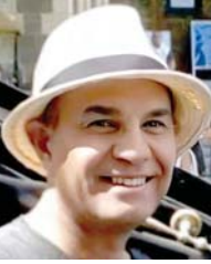
● استناد حداد

لديهم لغة فصحى ولهجة عامية. مؤكدا امتلاك المجتمعات العربية مثل هذه الجديفة حتى أن لغة الرواية والشعر بل وحتى بعض الصحف الرسمية عالية المستوى ونخبوية وقاموسها اللغوي ثر ومتنوع وصياغة عباراتها مختلفة عن صياغة الناس للمحارات في حواراتهم اليومية. أي أن عامة الناس لا تستخدم الكثير من الكلمات التي يستخدمها الروائيون والشعراء والصحفيون. لافتا إلى أن الأمر لا يقتصر على العرب فقط، ثم أيد الأصداء رأي علي بدر بأن اللغة العربية الفصحى مطبوعة ومختلفة من زمن لآخر فطاشيا مع تغيرات الزمن. حتى أن قاموس اللغوي للشعر العباسي يختلف عن قاموس اللغوي للشعر ما قبل الإسلام إلى حد ما، بسبب تركة مفردات قديمة لم تعد تناسب العصر وتسايق أيضا على المعاصر، والعامية صياغة وتسايق أيضا على المعاصر، وأضاف قائلا بأجل اللغة العربية من حيث الموسيقى والإيقاع الداخلي فيها. عدوا أنها هذه اللغة الفصحى علمه قبلنا من الأشياء الصعبة إلا التقليل وفي منها.