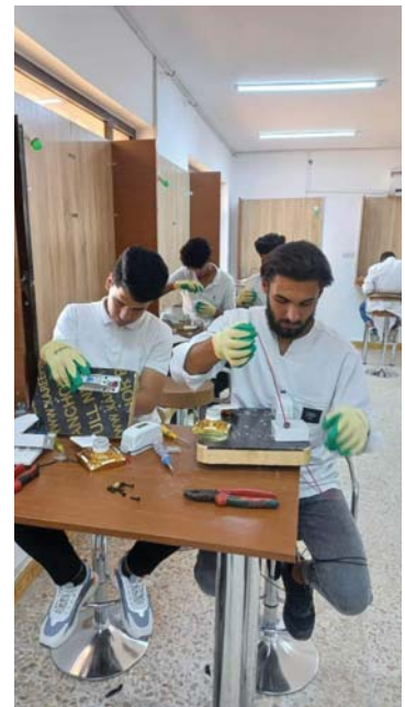
• تزايد أعداد العاطلين في العراق عام تلو الآخر