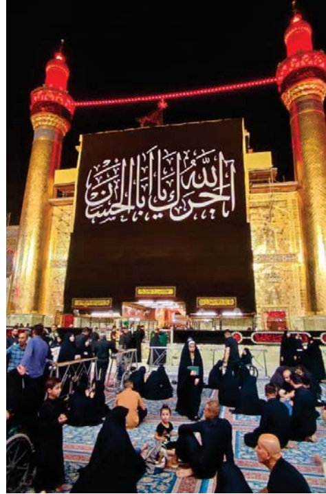
● التجف الأشرف تحفل الدوام الرسمي الخميس بمناسبة وفاة النبي الأعظم (ص)

التبروكيمياوية المتعددة، بطاقة إنتاجية يخطط لها أن تقارب مليون طن سنوياً تشكل قاعدة صناعية رصينة تدعم الصناعات البلاستيكية والمطاطية وكافة الصناعات المرتبطة بها، تعزيزاً لمصالح ومعامل الطعاق الخاص. وأضاف جهاد أن المشروع يوفر أكثر من 40 ألف فرصة عمل، ويحقق إيرادات مالية كبيرة تدعم الاقتصاد الوطني والتنمية المستدامة، وبمساهمة وزارتي النفط والصناعة وشركة شل العالمية للبتروكيمياويات وجهات أخرى يتم تعديدها بعد إقرار الصيغة النهائية للمشروع. عضو لجنة النفط والغاز والشؤون الطبيعية التابعة إلى المشوكر بيجي أن مصفي كربلاء وبيجي سيتهان استيراد الكثير من المواد الوقودية في حال إعادة تشغيل الأخير، معتبراً أن المواد التي استعادتها الحكومة والتي تم الاستلقاء عليها من مصفي بيجي، لن تكون ذات فائدة ما لم يتم إكمالها بإباني المواد الموجودة في المصفي. وقال المشوكر في حديث لـ «الصباح»، أن المصفي يحوي لوحات تحكم أعيدت مؤخراً، فيها كلمات سر لا يمكن تشغيلها إلا عن طريق مختصين ذوي خبرة في هذا الجانب بالخصوص. وذكر النائب أن عمليات إعادة تأهيل مصفي بيجي دخلت حيز التنفيذ ما يعني أن عمل مصفي كربلاء وبيجي معاً سيضخ على الكثير من عمليات استيراد أنواع الوقود وخاصة البنزين والغاز من دول الجوار أو باقي الدول الأخرى، ما يوفر الكثير من الأموال.