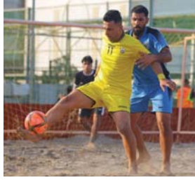
● الشكوك الادوية تصيب مشاركة كاتنا بالمثل

المباريات التجريبية. من أجل مراقبة الخطأ البياني لمستوى الأداء ومراجعة العديد من الخطط التكتيكية، للوقوف على الجوانب الإيجابية والسلبية، ولتتبع إلى أن "التجمع المونديال المرتقب سيكون فرصة حقيقية لاختبار قدرات اللاعبين، وأن القموح يحدد الجميع تحقيق أفضل النتائج، التي تعزز من سمعة اللعبة خارجياً".