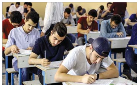
● لا توجد أي تأخيرات في وضع الطلبة بشأن تعديلات المناهج