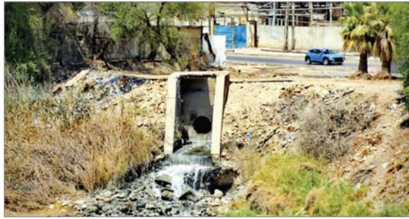
● كميات عالية من الصرف الصحي تلوث دجلة