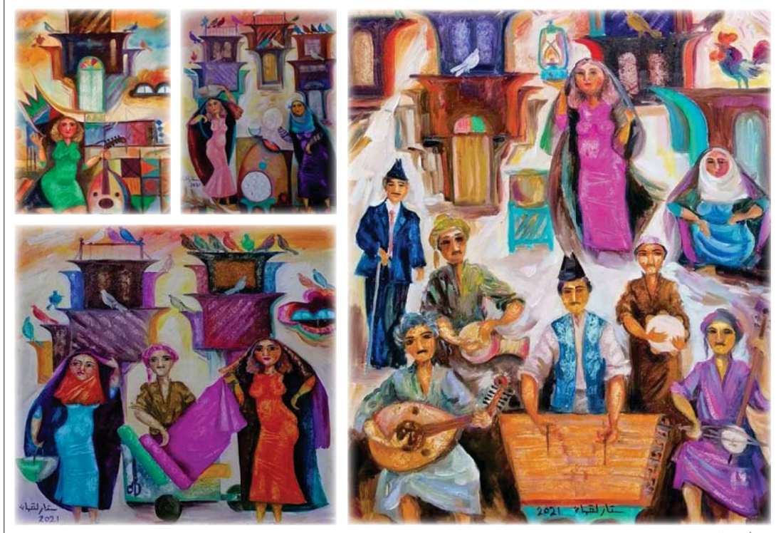
● من أعمال الفنان

منذ فترة ليست بالقصيرة وأنا أتابع تجربة الفنان التشكيلي العراقي ستار لقمان، فهو من فنانين العراق الأكثر حضوراً وتواجداً في الساحة الفنية التشكيلية، وقد التفت به ذات مرة في (جمعية التشكيليين العراقيين) ودار حديث بيني وبينه حول ما قدمه وما سيقدمه، وعن متابعتي لأعماله، في الحقيقة وجدت أنه ينتمي إلى الجذر المكاني وإلى البنية بوصفها منتجة للجمال، وهذا دليل بروز هويته في عالم الرسم، فالأماكن البغدادية والشخصيات التي تلتصق بالعلامة البارزة في أعماله، كذلك في اشتغالاته الأخرى في الطبيعة والأماكن المفتوحة، تعبر عن أسلوب له خصوصية، فحتى لوحاته تثير شعور وجداني وماجيسي تثيره العلامة في الشكل من خلال الإشمام أو من خلال طريقة بناء اللوحة، ولعل هذا الأمر أبرز ملامح سطح اللوحة بشكل بصري واضح.