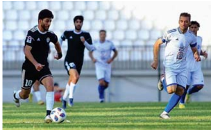
● الزوراء يامل ببداية قوية في الاستحقاق القاري