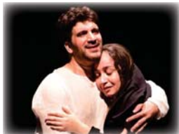
مشهد من التدريبات