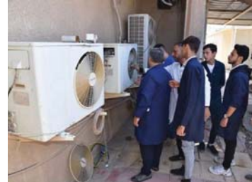
• وزارة العمل وتخفيف البطالة

وواصل حديثه (المستشار صباح)، بالإمكان فتح افاق التعاون مع الدول العربية والدولية لتعيين وتشغيل الشباب والخريجين وحملة الشهادات العليا والتنسيق مع المنظمات