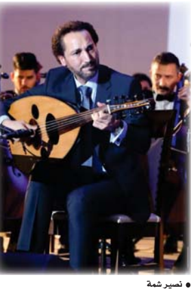
● نصير شمة

وعن طبيعة ونوع مشاركة بيت العود في فعاليات يوم التضامن في السودان، قال المشرف على البيت الموسيقي مصطفى صالح: من المؤمل أن يبدأ يوم التضامن منتصف شهر الحالي، بمشاركة فنانين عرب، وستقدم فيها مقطوعات موسيقية منها التوية السودانية، إضافة إلى الطريق إلى شلاور وعزوف نصير شمة، وعزوف اشرف توزيع الراحل فتح الله احمد وتأليف نصير شمة، كما يشاهد في الحفل عدد من الواهب الصغيرة، إضافة إلى عازقة الموندولين التي ستقدم المايمو السوداني.