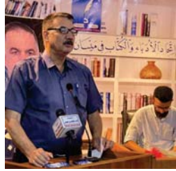
جمال جسام أمين يؤين سديته الدفاعي

بمعازة من الوهن الثقافي؟ أدرك أن واقعا اليوم يشهد مدا استهلاكياً وضعفاً عاماً، وفساداً إدراياً ومالياً، لكن ما رأيته هو مستوى مكتسبات ثقافية، متحققة في وطن كانت اليونسكو قد تبتأت له قبل عقود، أن يكون واحداً من عشرة بلدان في العالم على صعيد التعليم والثقافة. أعرف أن الثقافة فاعلا وناقداً للواقع، ولديه رؤية واضحة لتضايها المجتمع وإشكالياته في الحاضر، تمتد للمستقبل، مع تحياتي واعتذاري لرواد جمعة المنبئي.