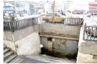
● إغلاق تام للمهاجر تحت الأرض

الطبقة الوسطى. حاملة مثل المدينة والتقدم. وعاد المجتمع عقودا طويلة. وعندما فرضت العقوبات فضت على كل امكانيات التقدم. وهو أمر مخطف له ومحسوب". وتابع "لو تلقى نظرة تاريخية على سبشار الرشيد في الخمسينيات والستينيات، وكذلك ساحة التحرير ومحالها الآن ستكتشف أنه كان طبيعيا أن تصبح الاتفاق مكانا للتفتيات والمشردين".