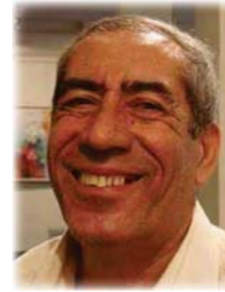
● ستار لقمان

كما لفتت نظرنا في أعمال الفنان ستار لقمان، أن في كل لوحة داخل اللوحة الواحدة التي تتناول وحدة المكان وتفاصيله، تمثل مشروعا خالصا، بمعنى أنه علامة فنيّة لجسد المرأة البغدادية وما تحملها من جمال الأداء والحركة وبالطريقة الرسم (الفتح الواضح، إنما هو في الوقت ذاته التقاطة متقززة ويمكن أن تصعب مشروعا قائما لذاته، كذلك الشبايك وأشكال الرجال