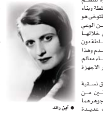
● ابن رلد

يختفون في الرؤية والاستراتيجيات والأهداف، ولكن كل منهما يتشدق فعل السلطة بأساليب مختلفة، تتجلى الطريقة الأولى باللجوء لطريقة الدبلوماسية للوصول إلى السلطة بينما الثانية الديمقراطية بوصفها أفضل ما هو ممكن من نظم سياسية لتحقيق الدولة وصناعتها وبنائها وهذا المجال تعديداً لم يغب عن بال العديد من الفلاسفة ما للصرع من أثر وأهمية في تحقيق نتائج وأثر على مستوى السياسة بل وفعل بناء الدولة والضغط باتجاه تحقيق تطورات وموجات