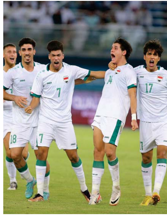
● أداء جيد للأولمبي خلال التصفيات