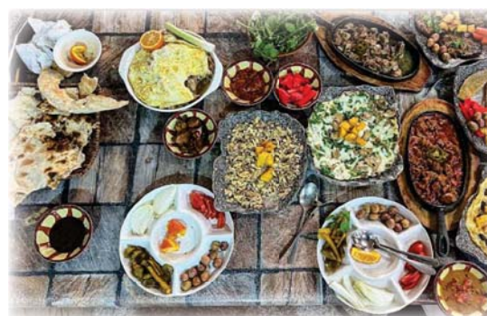
● عراقيون تقريبا نسبة بقايا الطعام المهدورة بنحو 43 بللثة من إجمالي التهامات

كجزء من الوجهة الاجتماعية هذه العادات غير المنضبطة والتي لا يمكن تجنب آثارها بسهولة تهدد اقتصاد البلاد بصورة مباشرة لاسيما أن البلاد تقف على أعتاب الانهيار الاقتصادي أكرم حشوش إن هدر الطعام موجود في كل الطبقات لها علاقة بالطعام البسوت والمطاعم ومصانع الأكل، والحد منها يقض على اختيار أساليب إنتاج وتغليف منتجاتها، إذ أصبح النظم عن مقلتها التي يقض عندهم مفهوم الشؤنة وما تحمله من مضامين وسلوكيات.