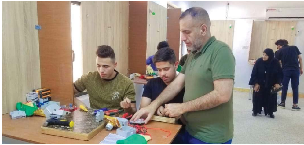
• أهمية إطلاع فروع للمشاريع المدرة للدخل