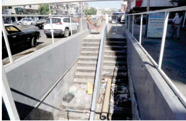
● أصبحت مكبا للتفتيات أو ملاذاً للمشردين

جاذبة تحول جزءا من أمكتنها إلى مراكز إشعاع في المدينة وناعرة. إذ تحول ذلك الجزء إلى هاشم مبتدل. بل تلطسه حتى القاع الاجتماعي. شتما مميّزة عن مدن العالم في بغداد الكثير من المعالم المعبودة وحتى بالمعوم. ولت فرحان التي أن جعل، فضلا عن الأسواق تحت الأرض في سوق الشورجة وأماكن أخرى، يمكن تقديمها كأنموذج حضاري وسياسي يترجم الحالة المدنية الجديدة. ولكن حدث العكس، وتحولت إلى فوضى عارمة، ومنها المشاجر تحت الأرض حيث باتت مكبا للتفتيات.